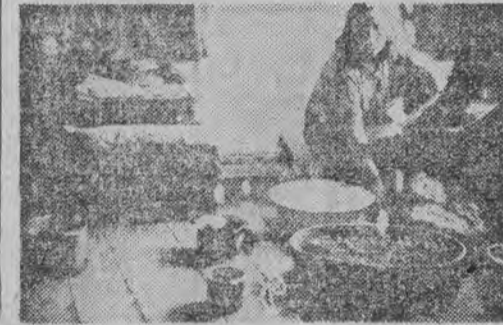
Na drugim piętrze u ob. Żupana do akcji samoobronnej przed deszczem mobilizuje się wszystkie miski i garnki

ścił sił roboczych natrafia w dalszym ciągu na poważne trudności. Krótki okres, jaki nas dzieli od zimy, przy jednoczesnym braku dekarzy i smolarzy, nakładają na Komitety Do-