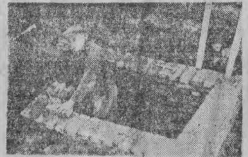
Budowa wodomierza — bezpośredni skutek wizyty Komisji Specjalnej przy Pl. Zwycięstwa 7-12

go Rynku były przedmiotem stałych najśmieszniejszych handlarzy z okolicznego rynku, którzy pozostawiali tutaj po swym wyjściu brudy w obfitej ilości, a więc — zgnite owoce, pierze z ptactwa, co gorsza, dzięki uległości kilku lokatorów, którzy handlarzom wypożyczali swie komórki na hodowlę kur, kaczek i gęsi w olbrzymich stadach, podwórko lepiło się od brudu, a w puszkach ze śmieciami żerowały bezkarnie w biały dzień szczury.