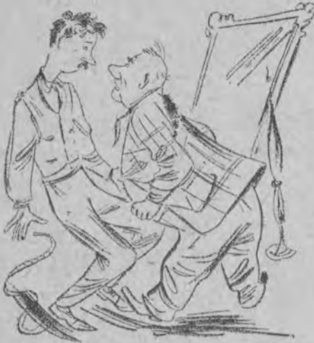
9. Spodnie długie, rękaw krótki. — Pan za dużo wypił wódki!