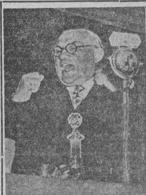
Bevin się gniewa — że dolary amerykańskie nie chcą napływać do Anglii.