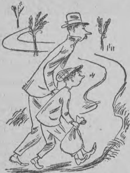
47. Lecz co robić? stulił uszy i w świat z Tomkiem dalej ruszył.