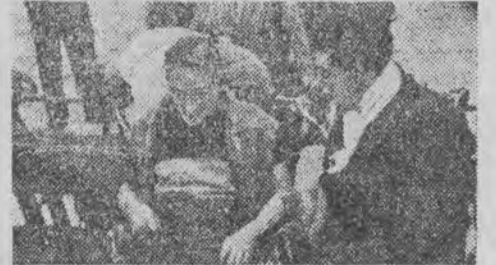
Mistrz świata, Józef Scherens (Belgia), podczas mistrzostw w Paryżu

W finale Scherens spotyka się z ulubieńcem Paryża, dzieckiem toru w Parku Książąt, Francuzem Gerardinem, młodszym od niego o kilka dobrych lat. W biegu pierwszym wygrywa pewnie Belg. Następuje start do wyścigu drugiego. Na ostatnim okrążeniu Belg przewraca się, a ponieważ nastąpiło to przed ostatnimi 200 metrami, wyścig zostaje przerwany.