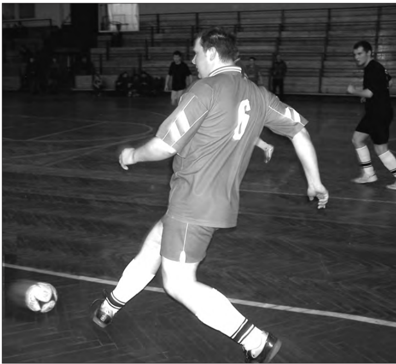
Zespół Płomyka-OSP finiszował całkiem skutecznie...