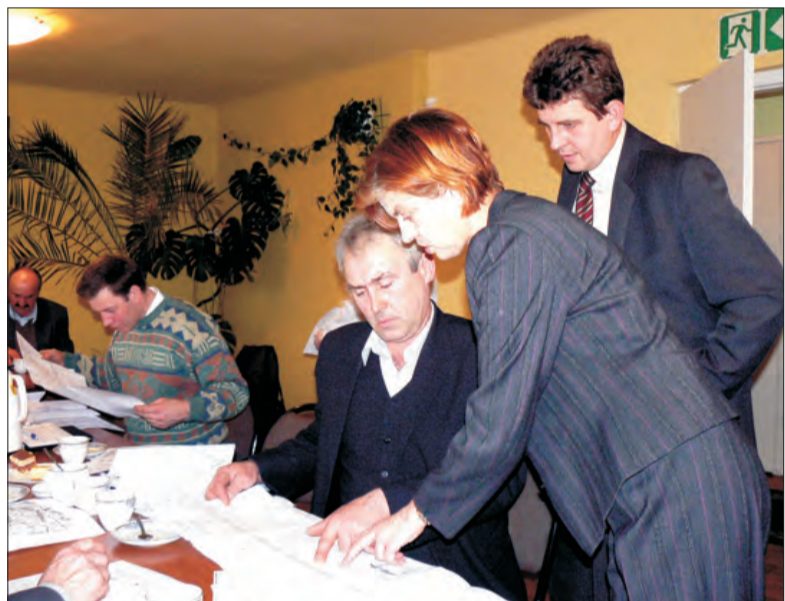
W czasie komisji radni mieli możliwość indywidualnie dowiedzieć się, co w planie zagospodarowania gminy przewidziano dla ich miejscowości.

Do końca 2008 r. PoloMarket planuje mieć 300 sklepów, tak aby sieć obecna była w każdym polskim województwie. (eb)