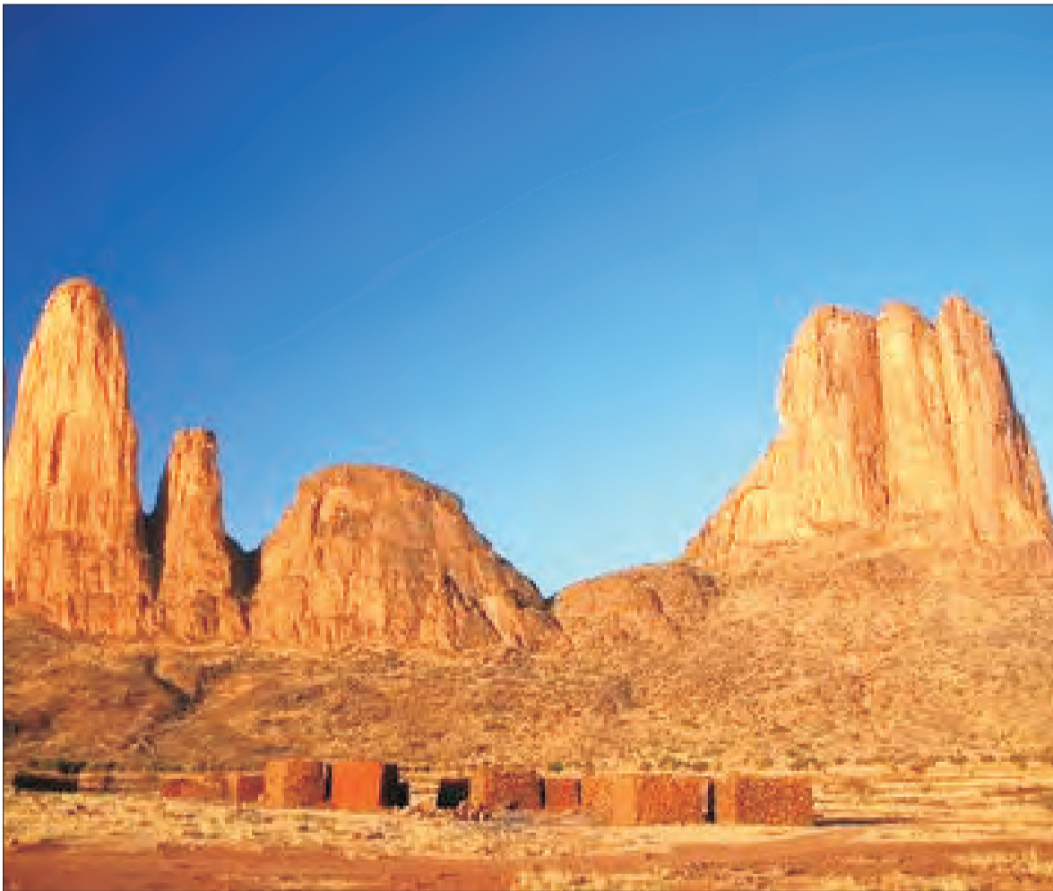
Main de Fatma - wspinaczkowa Mekka Mali.