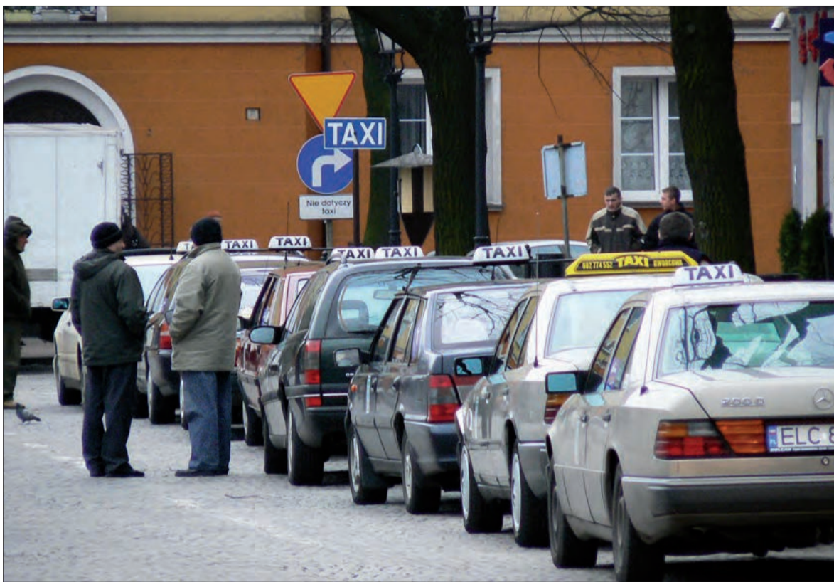
Łowickie taksówki stoją zazwyczaj na postoju przy dworcu PKP oraz na Starym Rynku. Wraz z nowym regulaminem może się to zmienić.

- To jest zapis rewolucyjny! - powiedział w czasie dyskusji nad regulaminem radny