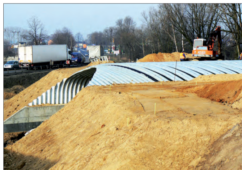
„Dwójka” jest remontowana obecnie na odcinku od Łowicza do granicy woj. mazowieckiego (na zdjęciu prace przy budowie wiaduktu nad Seminarą). Od soboty prace zaczną się też na odcinku od Łowicza do Bedna.