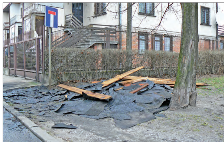
Oto szczątki dachu zerwanego z budynku przy ulicy Żabiej w Łowiczu.

Mimo wietrznej soboty, niedzielną noc upłynęła spokojnie. A kolejny dzień powitał nas niemal wiosenną pogodą. (wcz)