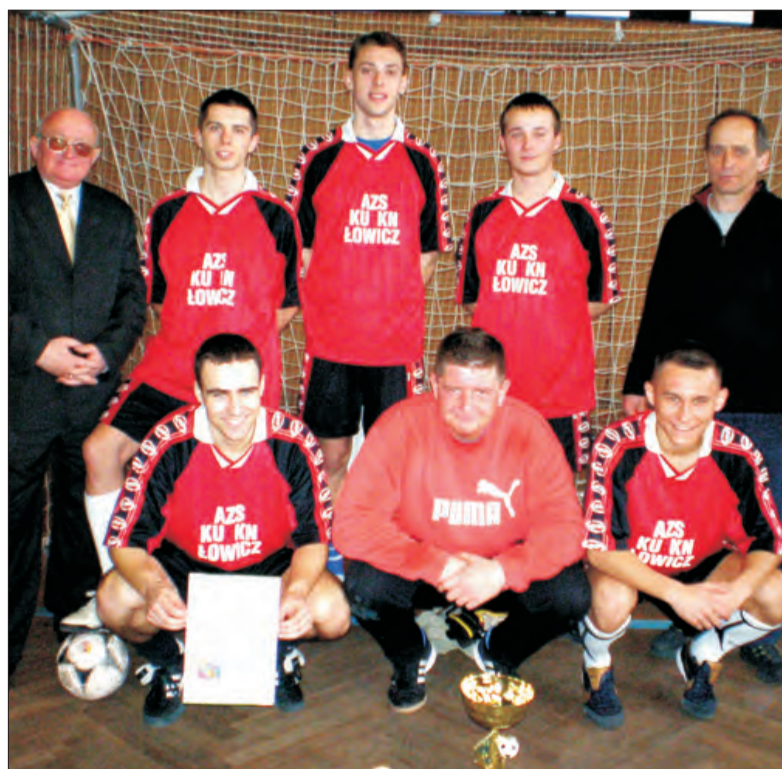
Ekipa Kolegium Nauczycielskiego w Łowiczu nie dała szans rywalom...

Futsal - Akademickie Mistrzostwa Szkół Wyższych Województwa Łódzkiego