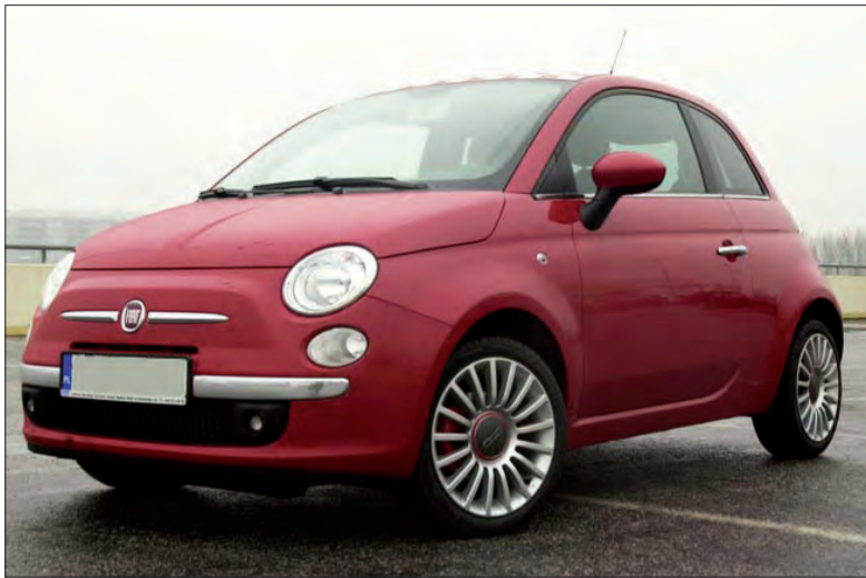
Trudno będzie spotkać dwie takie same „Pięćsetki”, Fiat stawia bowiem na różnorodność i dostosowanie do indywidualnych potrzeb.

Co zachęca do kupna? Z pewnością nie cena. Bardziej liczy się wygląd, stylizowany na poprzednią „Pięćsetkę”, a także możliwość kupna bogato wyposażonego auta. Najtańsza wersja z benzynowym silnikiem 1.2 (69 KM) na wyposażeniu ma dwie poduszki, ABS z EBD, regulowaną wysokość kierownicy ze wspomaganiami, światła do jazdy dziennej i kosztuje 34.500 zł. W Polsce dostępna będzie od maja tego roku. Obecnie najtańsza wersja pop kosztuje