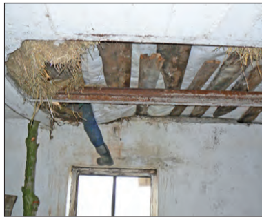
Strop budynku w Lipnicach zabezpieczono deskami i kółkami. A i tak uczestnicy akcji musieli uważać, gdzie stawiają nogi.

opowiada kobieta. - Cale szczęście, że wiatr nie zepchnął go w kierunku domu i okien. Wtedy nie wiem co by było.