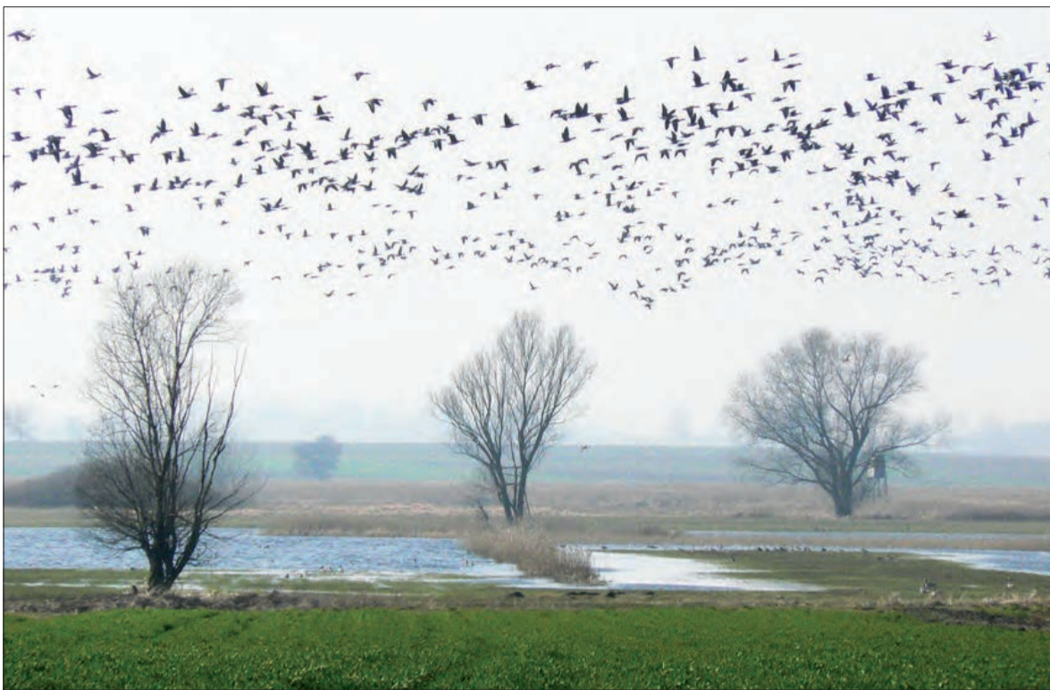
W dolinie Słudwi gęsi podrywają się co jakiś czas, sploszone przez psy lub ludzi, chwilę później ponownie lądują na rozlewiskach.

O rozpoczętych wiosennych przelotach może też świadczyć potrójenie się liczby gęsi, które na rozlewiskach zbierają się, by ruszyć na północ - do Skandynawii i północnej Rosji. W ubiegłą niedzielę było ich