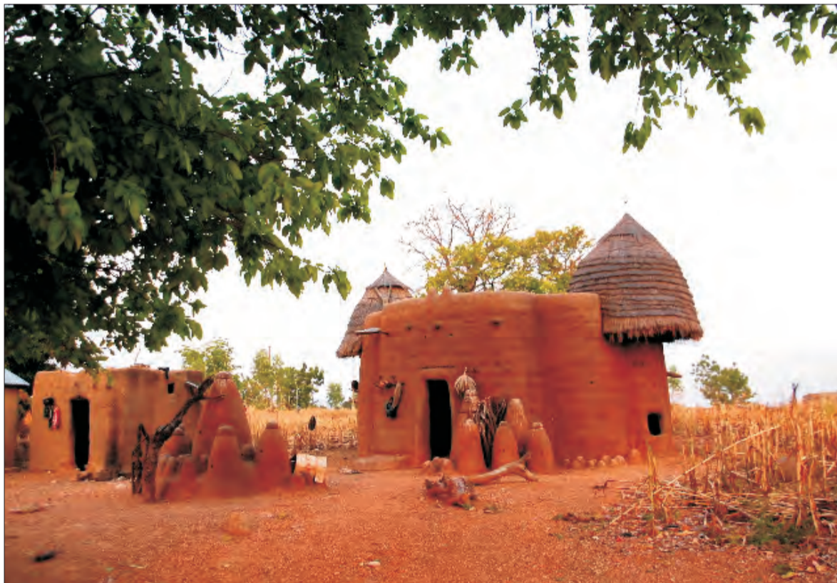
Inni zaczęli budować domy w kształcie mini fortec.

zeni ich planami, bo to nie pierwsza ich tak egzotyczna i daleka podróż.