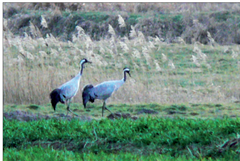
W pobliżu zbiornika Okręt spacerują żurawie.

Wielu kierowców musiało się zdziwić, obserwując wieczorem 23 lutego na