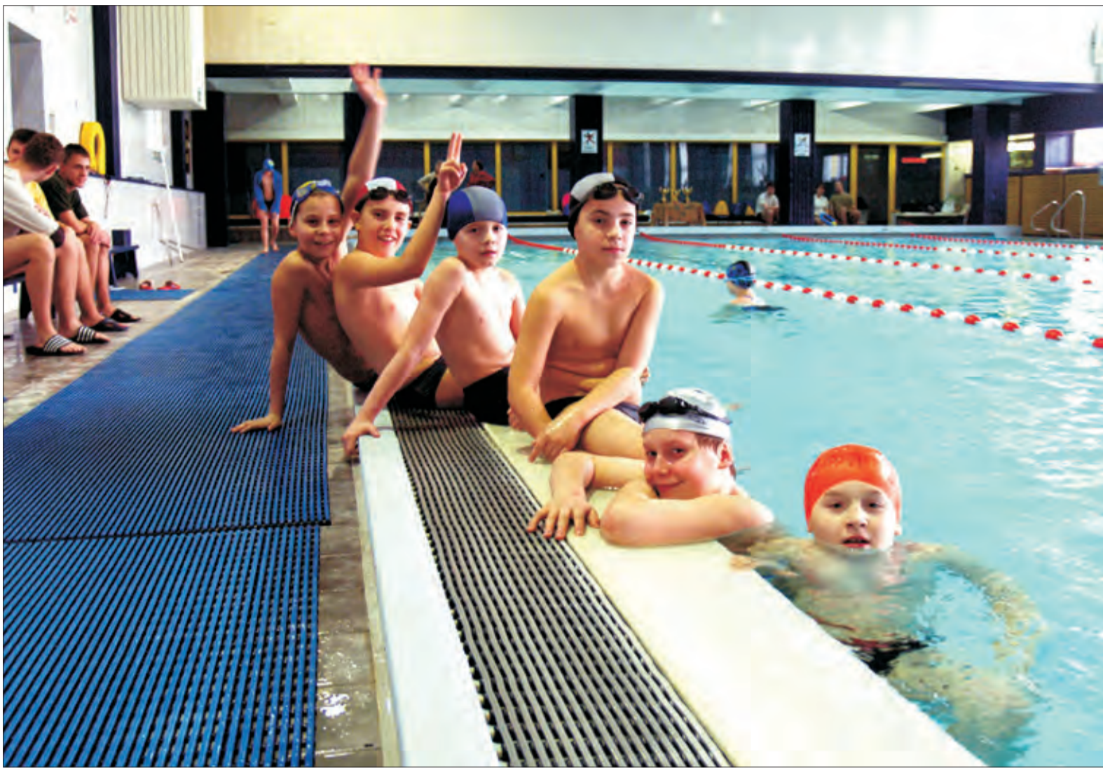
Spore zainteresowanie startami w zawodach pływackich...

I Pływackie Mistrzostwa Os. Stefana Starzyńskiego