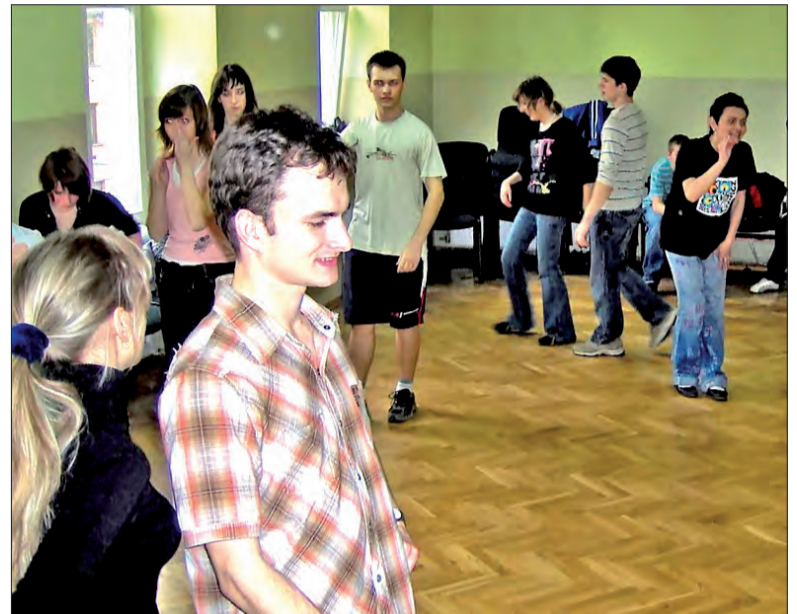
W zajęciach z tańca ludowego uczestniczyło nieco mniej osób niż w zajęciach z tańca towarzyskiego.