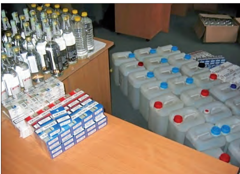
Nieoczyszczony spirytus w 10-litrowych baniakach i pseudomarkowe wódki znalezione w Dzierzgowie były schowane w kanale samochodowym

Najpierw, w czasie kontroli targowiska w Łyszkowicach, w samochodzie osobowym marki Lada, na ukraińskich numerach rejestracyjnych, celnicy znaleźli 49 butelek alkoholu oraz 77 paczek papierosów różnych marek. Właścicielką towaru była 46-letnia obywatelka Ukrainy, która jako miejsce swojego czasowego pobytu wskazała jedną z posesji we wsi Dzierzgow w gminie Nieborów. Na miejsce pojechała grupa celników z WZP. W wyniku kontroli tej posesji funkcjonariusze ujawnili kolejne dwadzieścia trzy 10-litrowe pojemniki ze spirytusem oraz 380 paczek papierosów różnych marek. Nielegalne towary ukryte zostały w kanale samochodowym, który był w budynku gospodarczym. Oprócz tego znaleziono tam również setki pustych butelek i kapsli oraz podrabianych etykiet i banderoli.