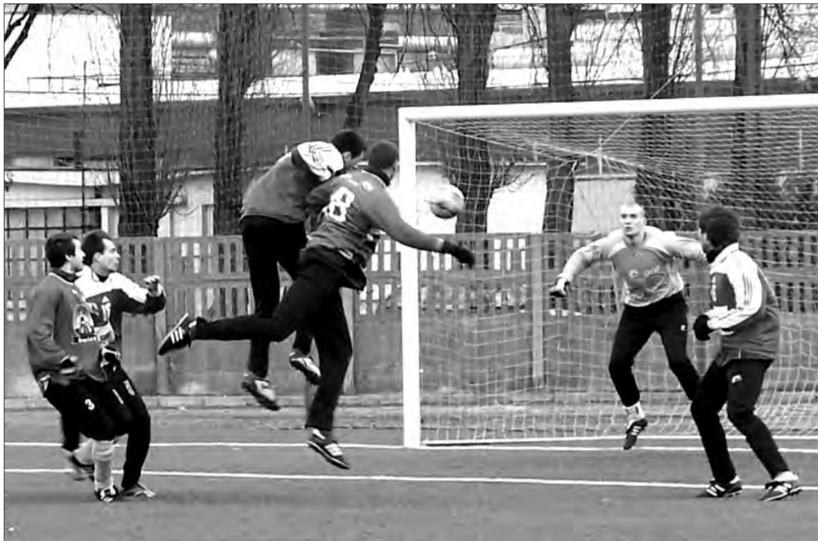
Raz po raz w polu karnym OKS 1945 Olsztyn się kottowało.

Piłka nożna - przygotowania KS Pelikan do rozgrywek II ligi