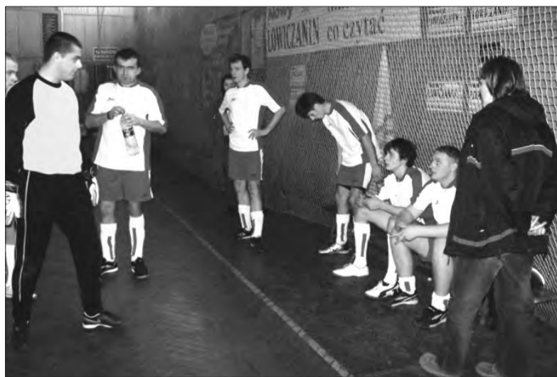
Najlepsi w III lidze okazali się gracze Victorii Zabostów Duży.