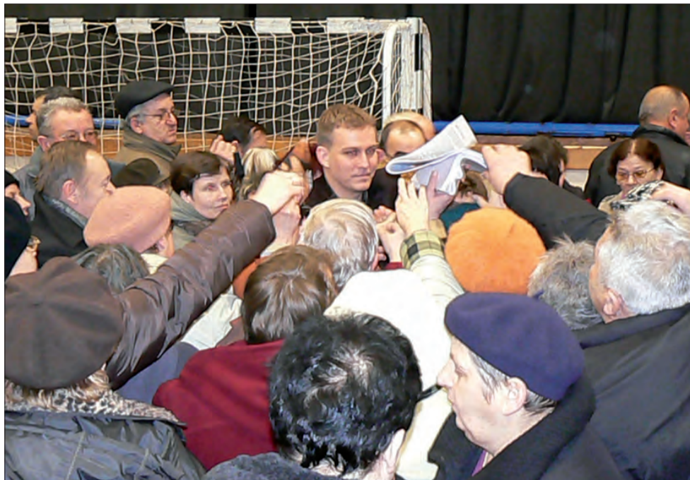
Jacka Polaka, który rozdawał samouczek uwłaszczeniowy, obległy po spotkaniu prawdziwe tłumy. Ludzie wprost wrywali sobie broszurę.

Pierwszym krokiem na drodze do uwłaszczenia jest złożenie do zarzą-