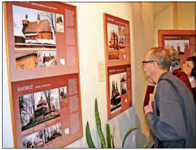
Piękna architektura, piękne fotografie.

Mają ulotne piękno, duszę, klimat i nastrój. Z roku na rok jest ich coraz mniej. Mowa o drewnianych kościołach. W łowickim muzeum od 20 lutego można obejrzeć wystawę fotograficzną, przedstawiającą kilkadziesiąt takich obiektów z 4 krajów środkowej Europy.