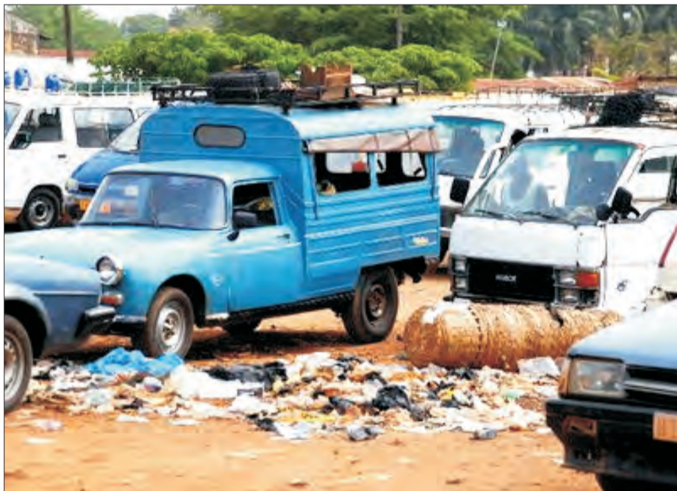
W Afryce wszystko ci zapakują w plastikowe torebki. Potem widać je wszędzie. Na zdjęciu śmieci na ulicach Nawakszot, stolicy Mauretanii.