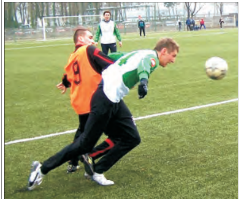
Piłkarze łowickiego Pelikana do końca walczyli z nowodworskim Świtem o zwycięstwo. Skutecznie...

Koszykówka - 12. kolejka III ligi mężczyzn