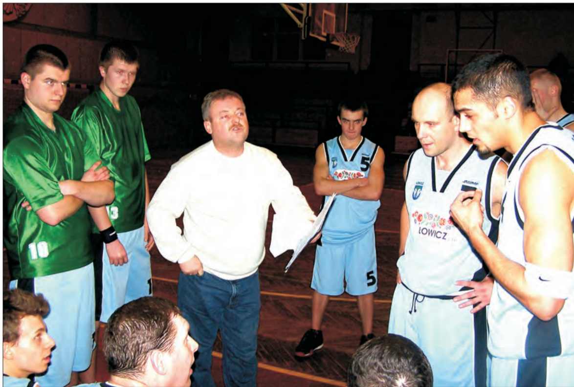
Koszykarze Książaka mają bardzo duże szanse na zdobycie tytułu mistrzów województwa łódzkiego.