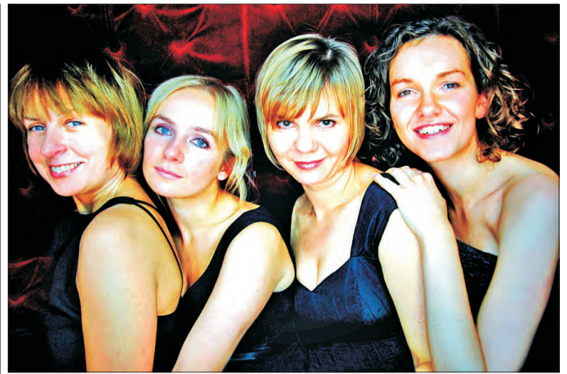
Kwartet smyczkowy Apertus.

Wystawa trafiła do Łowicza dzięki współpracy, jakie muzeum łowickie nawiązało z Wojewódzkim Urzędem Ochrony Zabytków w Zilinie na Słowacji. Wystawę można oglądać do 31 marca, z Łowicza wróci ona na Słowację. (mwk)