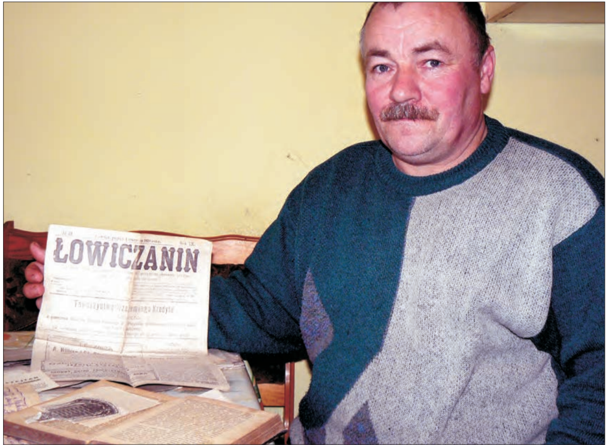
Wśród starych szpargałów sołtys wsi Ziemiary znalazł na strychu także numer Łowiczana z 1919 roku.