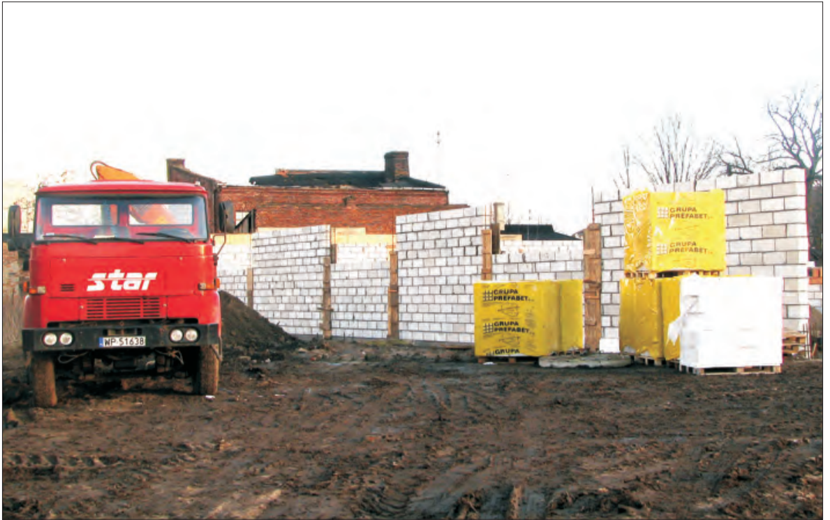
Fundamenty już wylane mury już wyszły z ziemi.