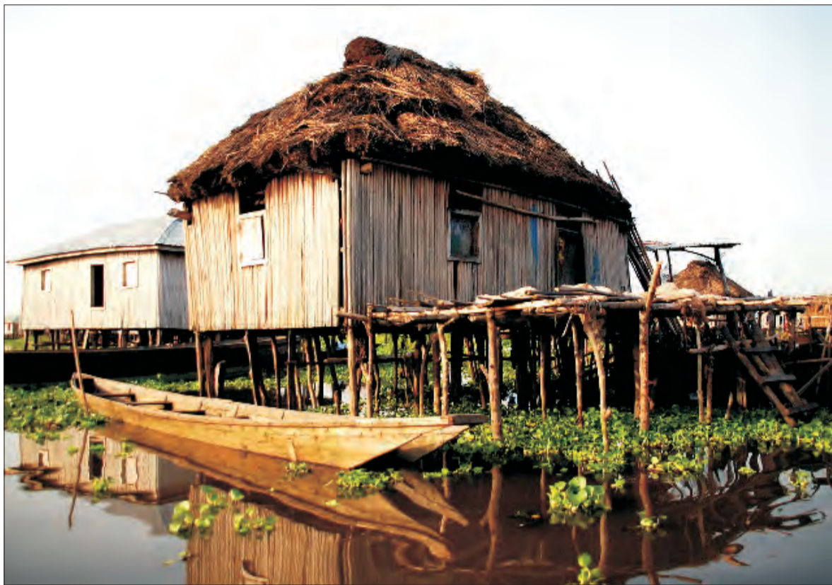
Mieszkańcy Afryki Zachodniej na różne sposoby próbowali uniknąć zakucia w niewolnicze kajdany. Jedni wykorzystując przesąd zabraniający handlarzom niewolników wstępu na wody jeziora zbudowali swoją wioskę na palach...

Tym razem udało się im odwiedzić Afrykę wschodnią, środkową czyli „serce Afryki”, zachodnią i północną, w sumie 17 krajów. Tradycyjny szlak podróży po Afryce wiedzie z północy na południe, a więc Kair - Kapsztad. Podczas swojej podróży spotkali kilkanaście innych osób, które wybrały taką właśnie trasę. Pomysł na wyjazd zrodził się rok przed pakowaniem bagaży. Nie wydawał się skomplikowany: jechać do Afryki i koniec. Wszystko zaczęło się konkretyzować, gdy udało się im otrzymać zapewnienie z pracy, czyli Ministerstwa Spraw Zagranicznych, że mogą dostać półroczne bezpłatne urlopy. Warunkiem ich otrzymania miały być pozytywnie zdane egzaminy konsularno-dyplomatyczne. Do egz-