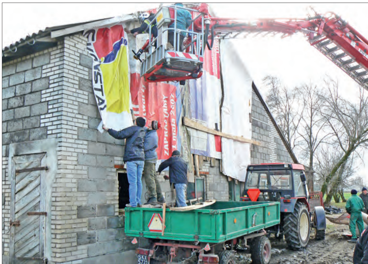
Strażacy zabezpieczyli zniszczony szczyt budynku w Lipnicach, używając do tego podnośnika.

Garaż blaszak nie był niczym przytwierdzony do podłoża. Wiatr porwał go, siłą uderzenia zmiotł do samego gruntu trzy przęśla betonowego plotu. Staranowawszy budę z psem w środku i połamawszy niedawno zasadzone drzewka owocowe i iglaki, garaż jakby nigdy nic zatrzymał się na środku działki. - Nie wierzyliśmy własnym oczom -