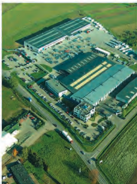
Siedziba PP. Oknoplast-Kraków

- Dziękuję za miłe słowa. Rzeczywiście staraliśmy się zrobić produkt, który będzie przełomem na europejskim rynku. Bowiem okno PLATINIUM