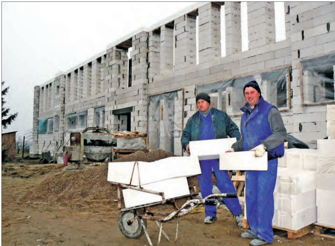
Szybko posuwają się prace przy budowie sali gimnastycznej przy Zespole Szkół w Błędowie.