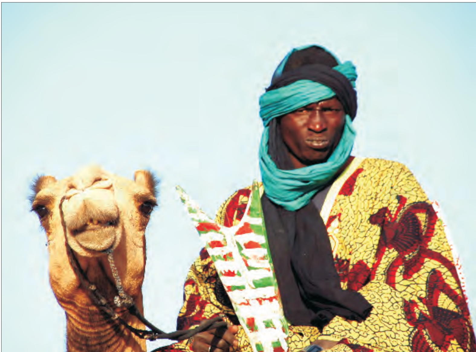
→ Tuaregowie wyglądem przypominają Arabów, ale czasami zdarza się w ich towarzystwie, na wielbłądzie, człowiek o skórze całkowicie czarnej.