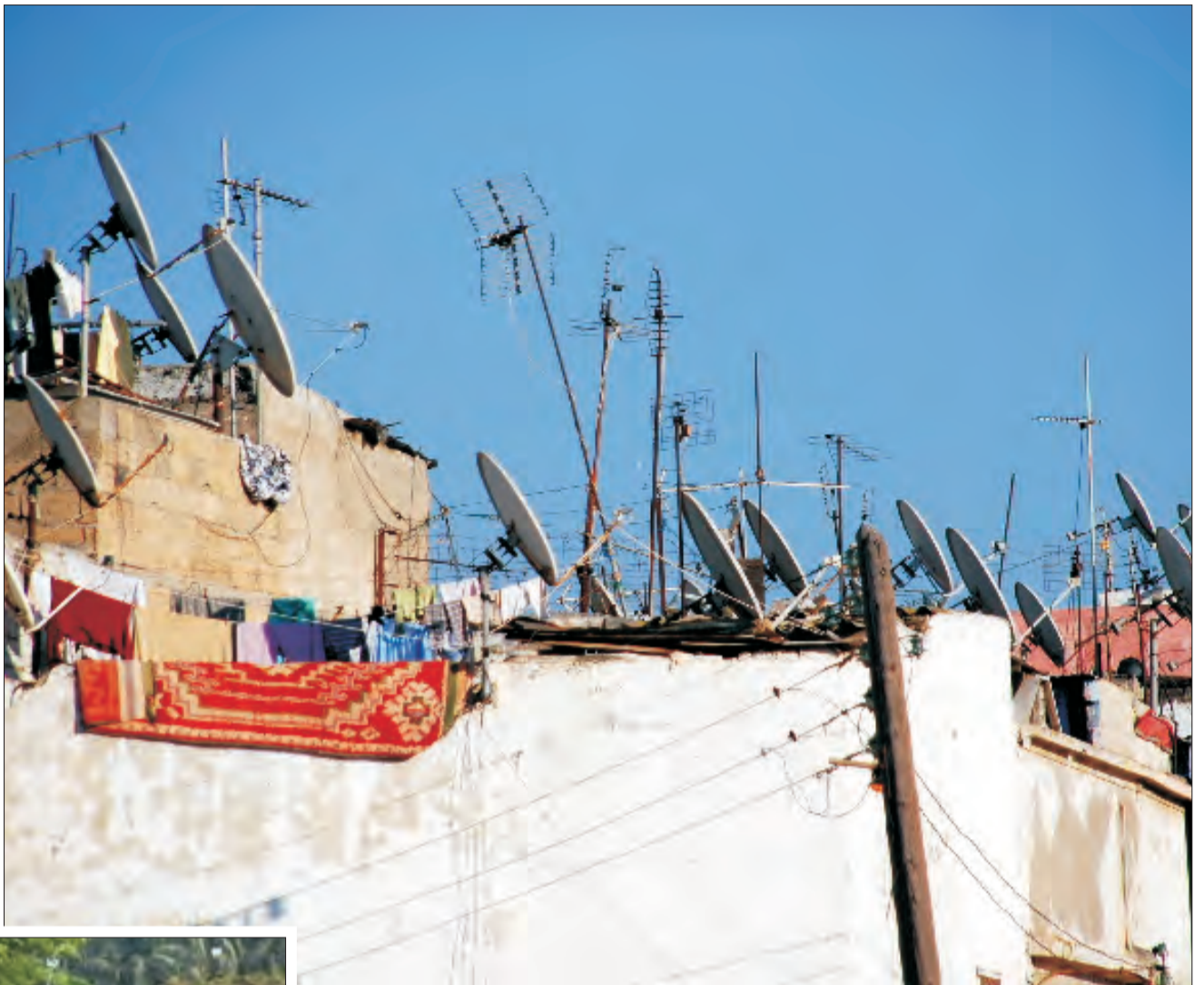
Końcowy etap podróży, już najbliższej Europy: las anten satelitarnych w jednym z miast marokańskich.

Warto podkreślić, że przeciętnemu mieszkańcowi Afryki nazwa Polak nic nie mówi. Gdy ją wymieniali, każdy pytał „Holland”? Dalsze tłumaczenia, że „Polonia” też prowadziły w ślepy zaułek, bo Polonia - Bolonia, więc pytano ich: Czy mówicie po włosku? Mimo to informacja, że jest to kraj europejski nasuwała rozmówcom bardzo pozytywne, aczkolwiek stereotypowe skojarzenia. Dawali temu wyraz mówiąc np. „Piękny kraj”, „Mój ulubiony kraj”, a nawet „Jak tam dostać wizę?”