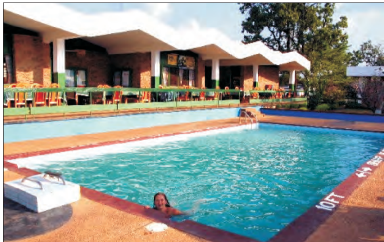
Afryka dla turystów. Taka też istnieje. Basen przy hotelu w Mole.