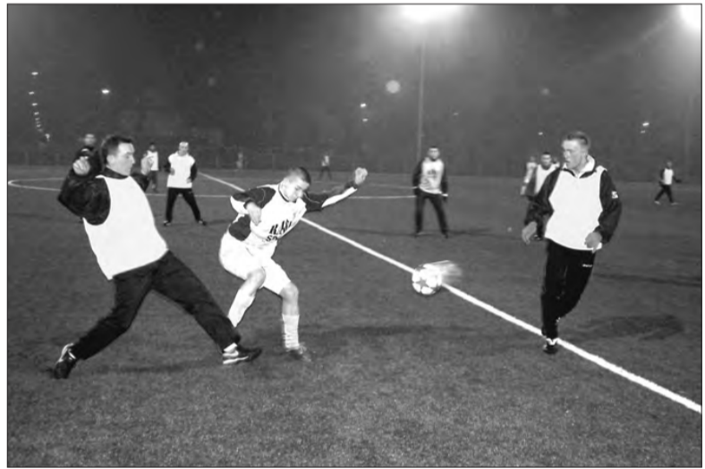
W debiucie „jupiterów” Pelikan II ograł Mazovię aż 7:1.