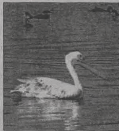
Pelikan czuje się na raszynskim stawie dość swobodnie.

Pelikan, ptak dziwny i tajemniczy, na ogół kojarzy się z Łowiczem, choć nie jestem pewien czy wielu mieszkańców widziało go na własne oczy. Jest jednak znakiem tożsamości nie tylko miasta, lecz także regionu. O Łowiczu mówi się przecież „gród pelikanowy”, jako że ten egzotyczny ptak jest osnową herbu miasta.