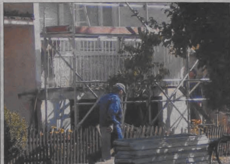
Metalowe rusztowania będą tu stały jeszcze przez kilkanaście dni.