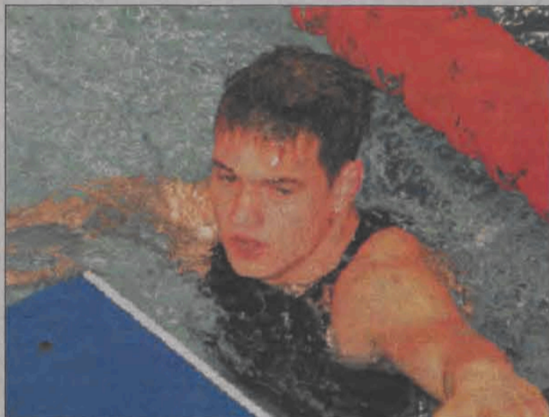
Do startu w Atenach zabrakło tak niewiele...

■ Na pewno chciałbyś pójść w ślady Otylii. Czy myślałeś już jak zaplanować nadchodzące cztery lata, by walczyć o medale na olimpiadzie w Pekinie?