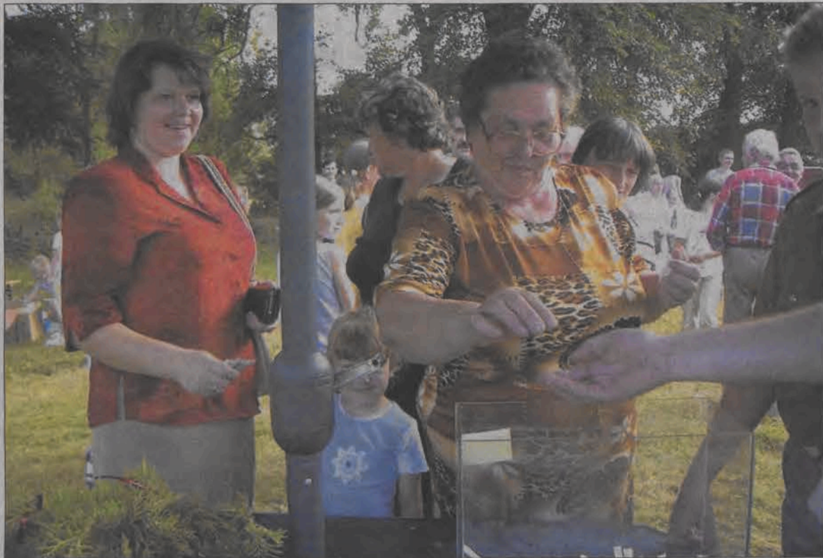
Dużym powodzeniem cieszyła się zorganizowana przez bolimowskich harcerzy loteria fantowa.