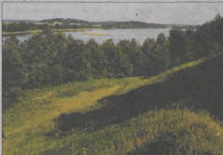
Malownicze tereny Świętajna. Czy wkrótce zagospodzą tam turyści z Nieborowa?