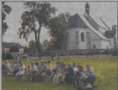
Piknik parafialny w Bolimowie zorganizowany został na dużym trawiastym terenie przy kościele.