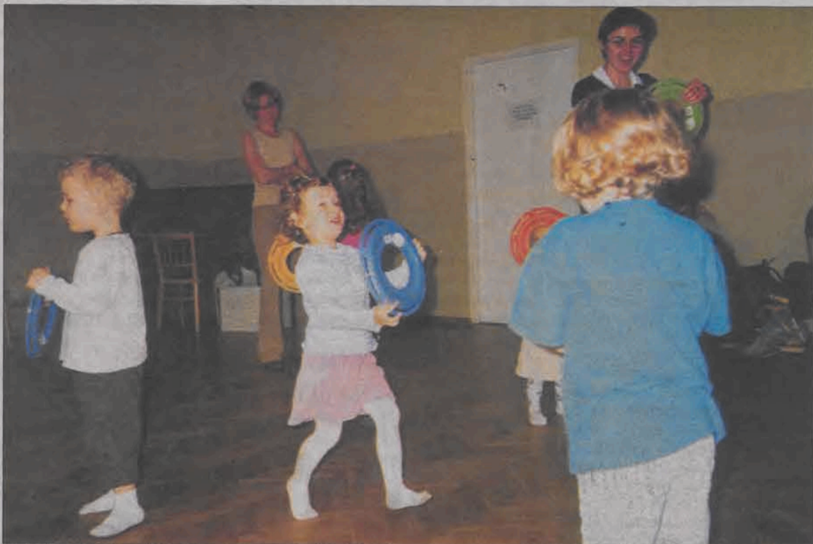
Dzieci w czasie zajęć w Łowiczu bawią się w jazdę samochodem. Za kierownice służą im freezbee.