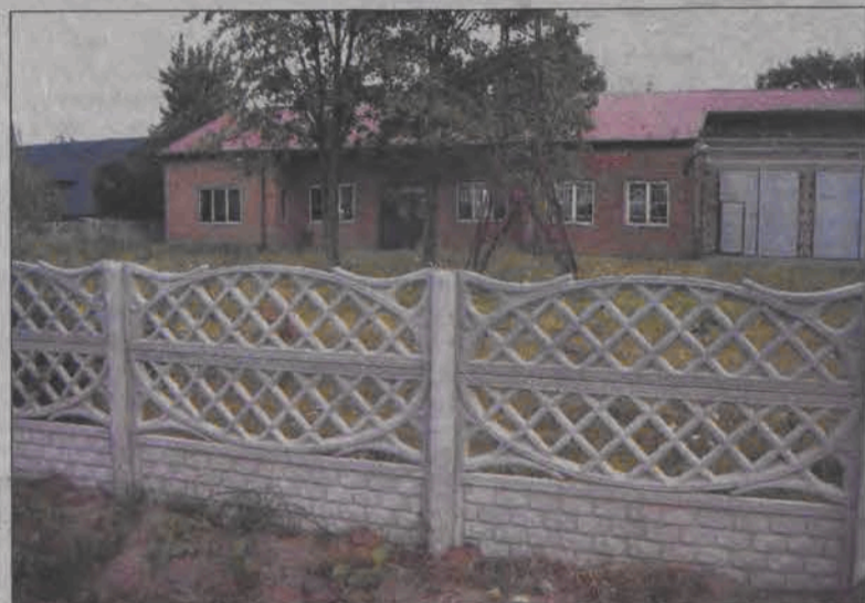
Nowy betonowy plot, który zastąpił przerdzewiałą, porwaną siatkę, znacznie poprawił wygląd estetyczny terenu.