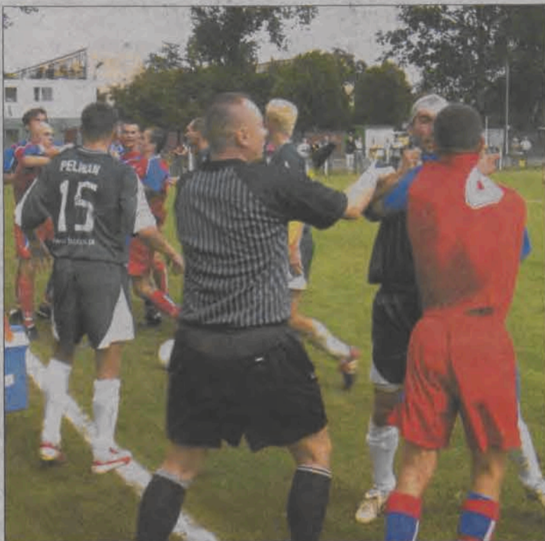
W drugiej połowie meczu z Gwardią doszło do „regularnej” bójkii graczy obu zespołów.

Tyle tylko, że z Gwardią nigdy nie grało nam się łatwo. Ostatnie ligowe zwycięstwo