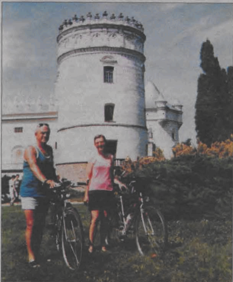
Nasi podróżnicy na tle zamku w Krasiczynie.

Krasnystaw - Chełm - Kock - Wola Gulska - Wola Okrzejska - Nowe Miasto nad Pilicą - Łowicz.