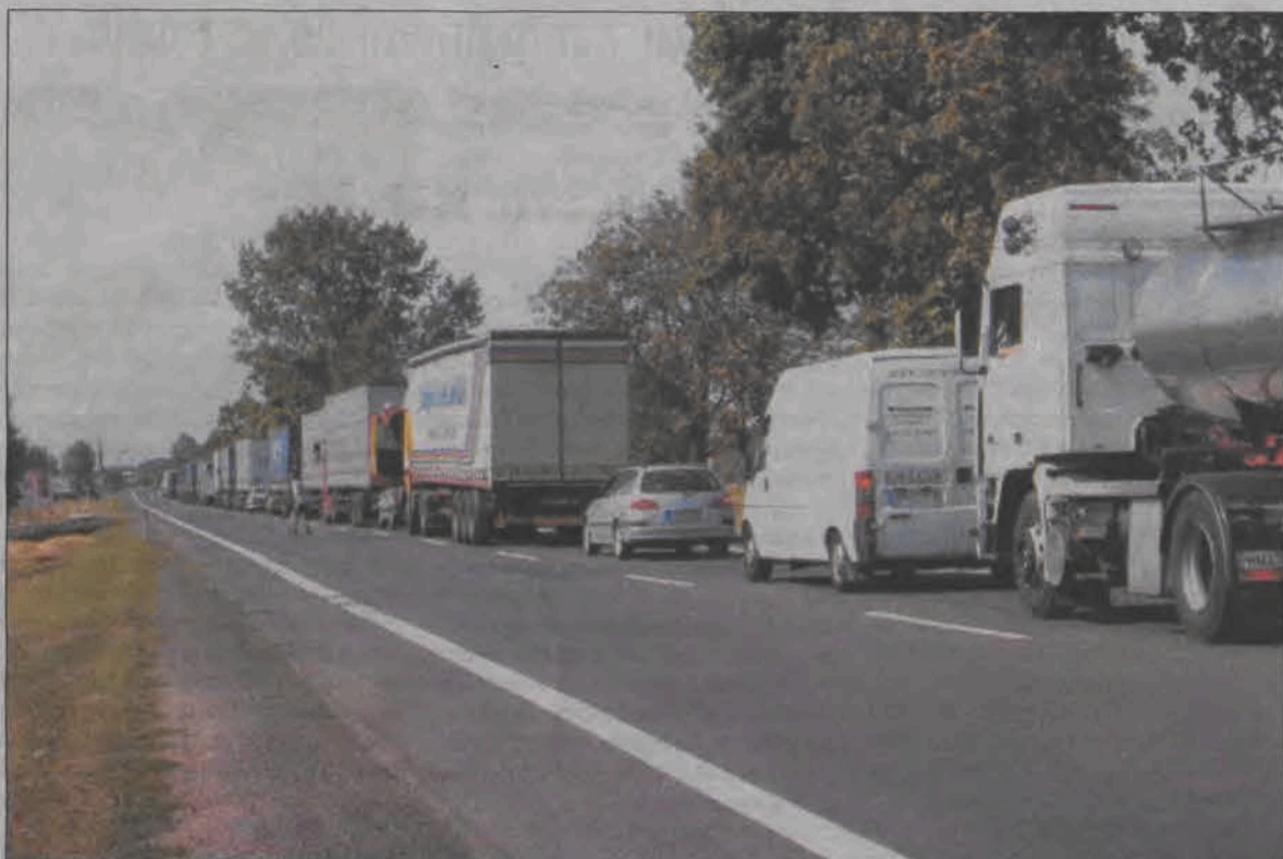
Taki sznur samochodów ustawił się na „Dwójce” we wtorek w południe. Na zdjęciu w głębi słabo widoczny wjazd w ul. Warszawską.