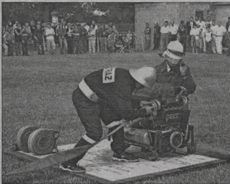
Zawody strażackie w Kiernozi rozegrane zostały w niedzielne przedpołudnie 22 sierpnia. Publiczność dopisała.

Finałowe wyniki przedstawiały się następująco: pierwsze miejsce OSP Niedzieliska, drugie Osiny, trzecie Chruście, czwarte Kiernoza, piąte Sokółów Kolonia, szóste Stępów, siódme Zamiary, ósme Tereśew i dziewiąte Witusza.