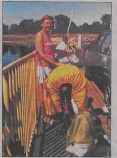
Przeprawa promowa w Pomorsku.

W drodze do Zielonej Góry dla turystów rowerowych zaczęła się bardzo uciążliwa pogoda - upał, jednak wytrzymali i zrealizowali wszystkie punkty swojej wycieczki. Będąc w Gnieźnie pytali się o drogę do Strzelna i napotkana osoba przypomniała im o znanych na cały kraj piktogramach w Wylatowie. Akurat były one na trasie, którą jechali i trudno byłoby ich nie zauważyć, zwłaszcza że przyjeżdża tam wiele osób, aby zobaczyć regularne koła przegniecionego zboża. Z tego pola wzięli na pamiątkę nawet kilka kłosów pszenicy. Jadąc dalej we Wronkach spotkali parę turystów rowerowych z Holandii, którzy wybrali się