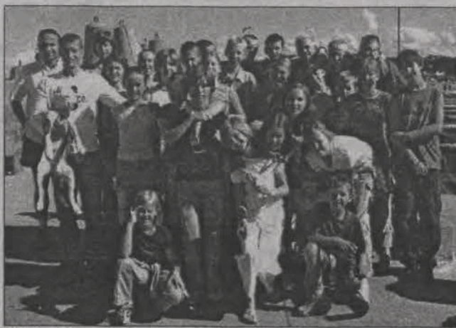
W Sarbinowie wypoczywali najmłodsi członkowie sekcji koszykówki.