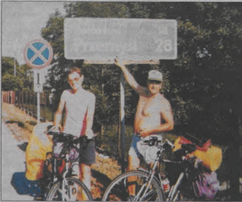
Jedno z pamiątkowych zdjęć robionych przy drogowym znaku, tym razem w Pruchniku.

Dalej był Jarosław, Tarnogród i Bełżec - gdzie upamiętniono ostatnio obóz zagłady Żydów. W Tomaszowie Lubelskim obejrzeni kościół z drewna modrzewiowego, a w Zamościu - Stare Miasto z bardzo charakterystycznym rynkiem.