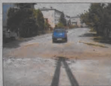
Jak wygląda skrzyżowanie ulic Dolnej i Lipowej. Trudno uznać, że prace tutaj są skończone.

skrzydeł” tego typu inicjatywie. Przypominamy, że płyty te mieszkańcy pozyskali za darmo z miejsca celebry mszy św. podczas pobytu Jana Pawła II w Łowiczu. Płyt tych było jednak za mało, aby utwardzić całą ulicę. Pojawił się wtedy pomysł, aby wszyscy mieszkańcy Dolnej złożyli się i dokupili tyle płyt, aby wystarczyły na całą ulicę i na pokrycie robocizny. Tego zamysłu nie udało się zrealizować, bo nie wszyscy chcieli płacić. Płyty położono więc na tym odcinku, w którym do porozumienia między ludźmi doszło, złożyli się więc tylko na robociznę. Nawet teraz niektórzy z nich nie czują się pokrzywdzeni, uważają, że płyty są solidne i sprawdzają się. - W sumie to i tak jesteśmy zadowoleni, bo cała ulica jest utwardzona. Woda nie będzie wchodzić do piwnic, wreszcie będzie porządek - mówi Łowiczanie mieszkający na gra-