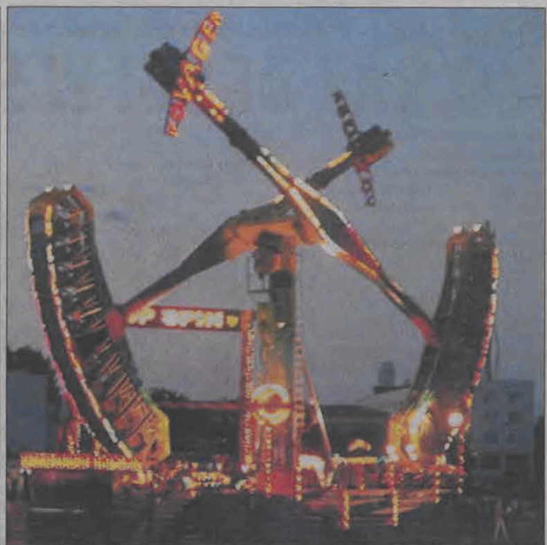
Tylko w niedzielę, 22 sierpnia lunapark, który przyjechał do Łowicza i tradycyjnie już „rozbił się” na łakach przy ul. Kaliskiej był pełen amatorów mocnych wrażeń. Młot, beczka strachu i inne atrakcje były oblegane. Przez wcześniejsze dwa dni świecił pustkami z powodu deszczowej pogody. Lunapark najefektowniej wyglądał w nocy, oświetlony kolorowymi światłami.