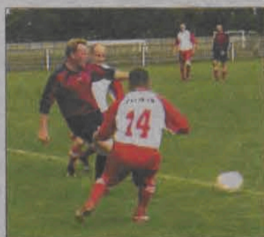
Jedną z atrakcji pikniku był mecz działaczy i strażaków.

Zanim jednak na murawie przy Starzyńskiego zaprezentowali się działacze Pelikana i Strażacy, najpierw klasą błysnęli trzeciolicowcy pewnie pokonując