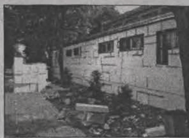
W SP 4 ku końcowi zmierzają już prace ociepleniowe sali gimnastycznej, które mają szansę zakończyć się jeszcze przed 1 września w ocenie pracowników je wykonujących.

- Do 1 września zakończą się prace w budynkach, a następnie prace na zewnątrz będą prowadzone w ten sposób, aby nie stwarzać zagrożenia dla uczniów. Termomodernizację w przypadku obu szkół będą prowadzone w ten sposób, aby nie kolidowało to z zajęciami szkolnymi - mówił jednak burmistrz Maciej Mońka na posiedzeniu komisji społecznej 26 sierpnia, po wizytacji inwestycji w szkolnictwie, która miała miejsce dzień wcześniej.