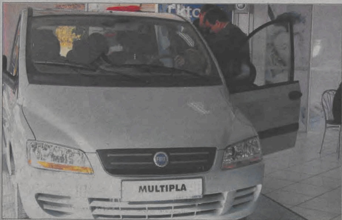
Nowy przód Multipli utrzymany jest w stylistyce charakterystycznej dla wszystkich modeli Fiata, który - tak jak inne marki - dąży do ujednolicenia linii.