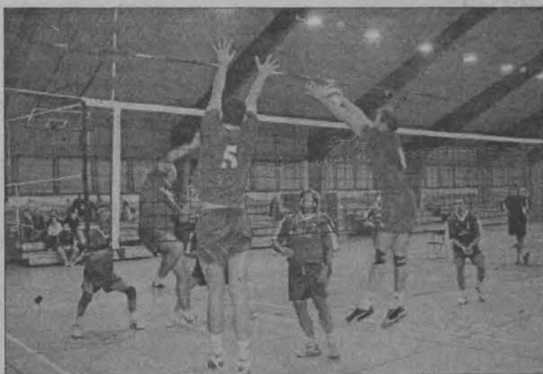
W derbach TKKF Głowno ekipa „Bankierów” wygrała 3:1.

■ TKKF BANK SPÓŁDZIELCZY Głowno - TKKF EXPANDOR Głowno 3:1 (25:19, 25:19, 28:30, 26:24)