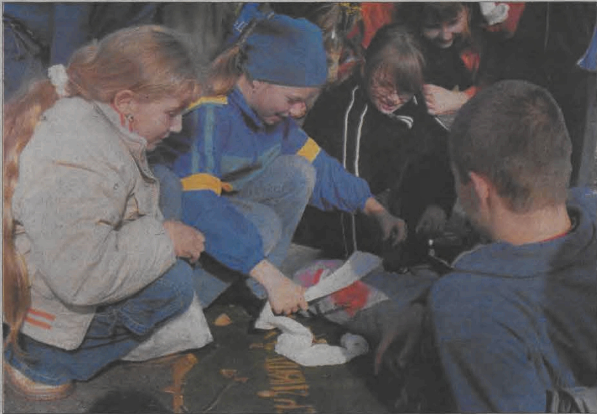
Młode harcerki nieźle radziły sobie z opatrywaniem rannego kolegi.