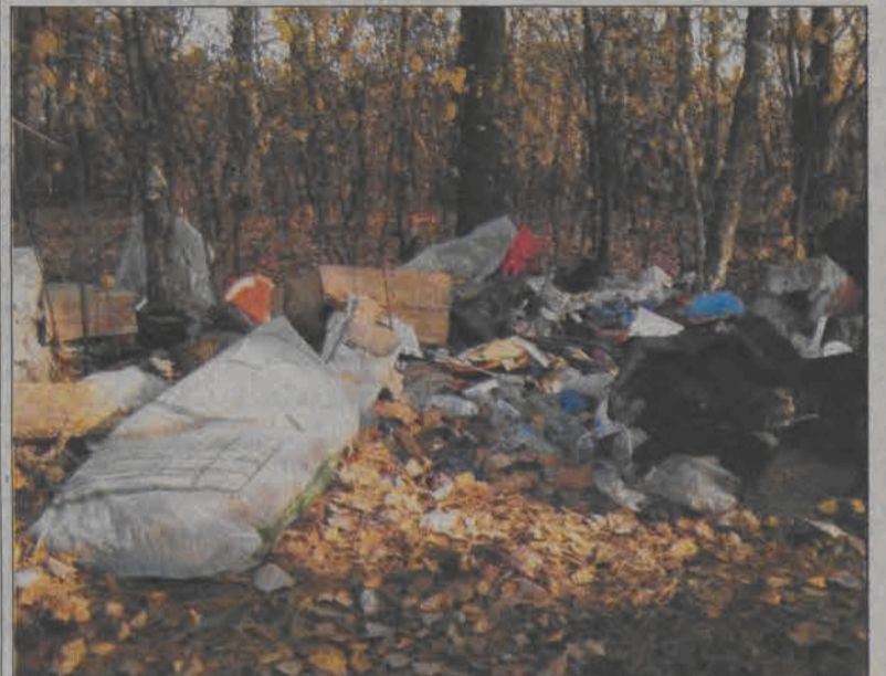
W małych laskach wokół Łowicza więcej jest śmieci niż grzybów. Czy tym, którzy tak robią, nie jest wstyd?