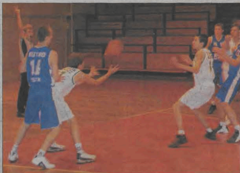
Juniorzy UMKS Książak odnieśli czwarte zwycięstwo w sezonie i ekipa ta samodzielnie prowadzi w rozgrywkach ŁKosZ.