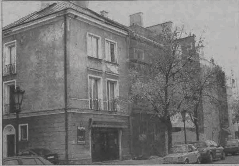
Wyraźnie widać linię, do której położone zostaną nowe tynki akrylowe. Nie będzie to przyjemny dla oka widok.

K wota, którą „Vicam” zażądała za ocieplenie oraz położenie akrylowych tynków w kolorze pomarańczowym i żółtym na powierzchni 280 m 2 elewacji części należącej do państwa K. nieosiągalna zaskoczyła ich. - W negocjacjach z kierownictwem firmy na początku nie mówiliśmy o ostatecznej cenie prac. Za-