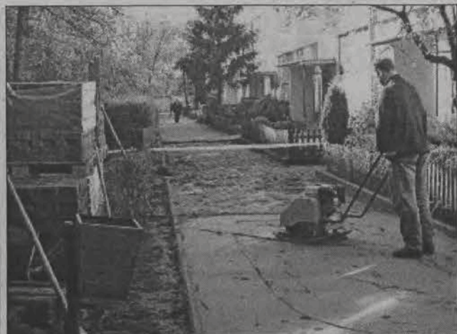
Ułożenie chodnika przed jednym blokiem na osiedlu Starzyńskiego to praca na niebagatelnej powierzchni 360 metrów kwadratowych.

Rolnicy - przedsiębiorcy narzekają, że nowe przepisy o ubezpieczeniu spadły na nich jak grom