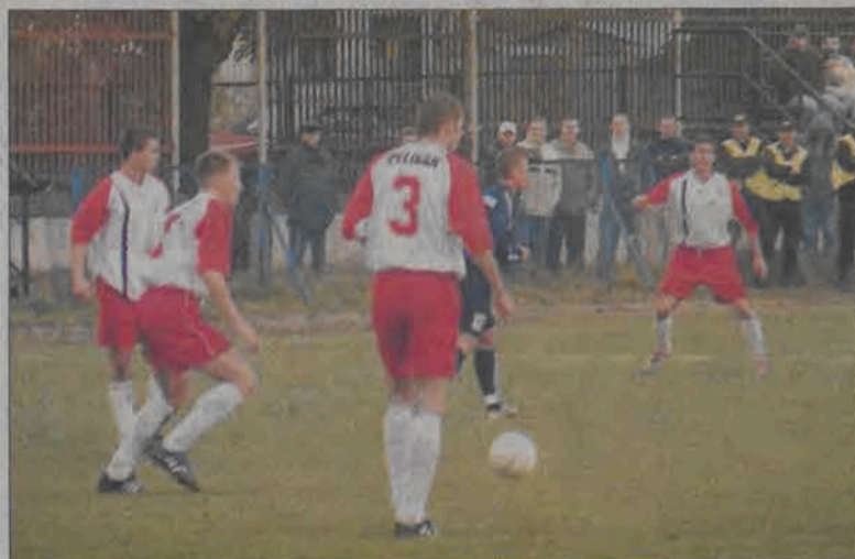
Łowiczanie stwarzali sytuacje, ale nie potrafili ich wykorzystać.