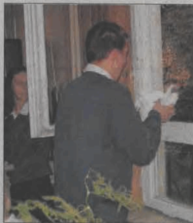
Na zakończenie programu w wykonaniu gimnazjalistów, symbolicznie na wolność wypuszczono białe gołębie - symbolizujące pokój.

Montaż słowno-muzyczny z wypowiedzi i przemówień Jana Pawła II przeplatany piosenkami, z których jedna przypominała ostatnią jego wizytę w Wadowicach, przedstawili uczniowie Gimnazjum nr 1 w czasie „Wieczoru papieskiego”, w czwartek 21 października.