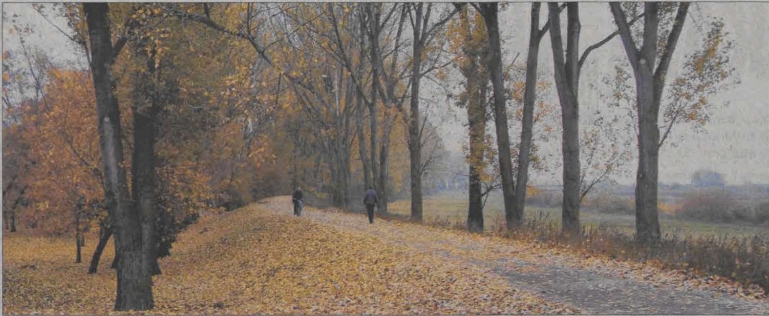
Ta aleja ma zniknąć, ale cały park ma wyglądać ładniej.