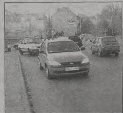
Zamknięcie ul. Mostowej i objazd ul. Tkaczew spowodowało spore komplikacje w ruchu samochodów, przed godz. 8 i ok. 16 kilka razy dochodziło do korków.

Do dziś miejsce to miało zostać zasypane tłuczniem i otwarte dla samochodów, które będą mogły poruszać się po ulicy Mostowej po wschodniej stronie pasa jezdni. Prawy pas będzie zajęty na dalej prowadzone roboty przy budowie kanalizacji. W zależności od ich awansowania, będą one wymuszały konieczność krótkiego zamknięcia ruchu lub wprowadzenia ruchu wahadłowego. Roboty, jak dowiedzieliśmy się od Grzegorza Pełki naczelnika Wydziału Inwestycji i Remontów w ratuszu, skończą się w pierwszej połowie listopada. Jak zaznaczył on w rozmowie z nami, doprowadzenie kanalizacji będzie dotyczyło 5 kamienic, w tym tylko jednej po wschodniej stronie ulicy Mostowej. Jak się bo-