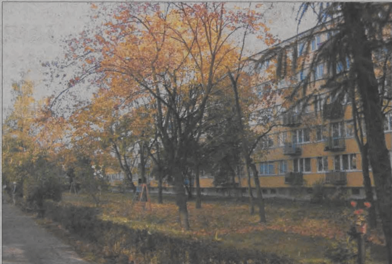
Dla niektórych mieszkańców osiedla Starzyńskiego drzewa przed blokami urosły za wysokie.

Niektóre drzewa przed naszymi blokami sięgają trzeciego, a nawet czwartego piętra. Te niższe drzewka staramy się sami przycinać używając drabiny, ale przecież tych wysokich nie damy rady. Podobnie jest z krzakami: rosną dziko, a do okien na parterze, czy na pierwszym piętrze nie wpada nawet jeden promyk światła, który mógłby zimą ogrzać mieszkanie - tłumaczy mieszkańiec bloku nr 4 z osiedla Starzyńskiego.