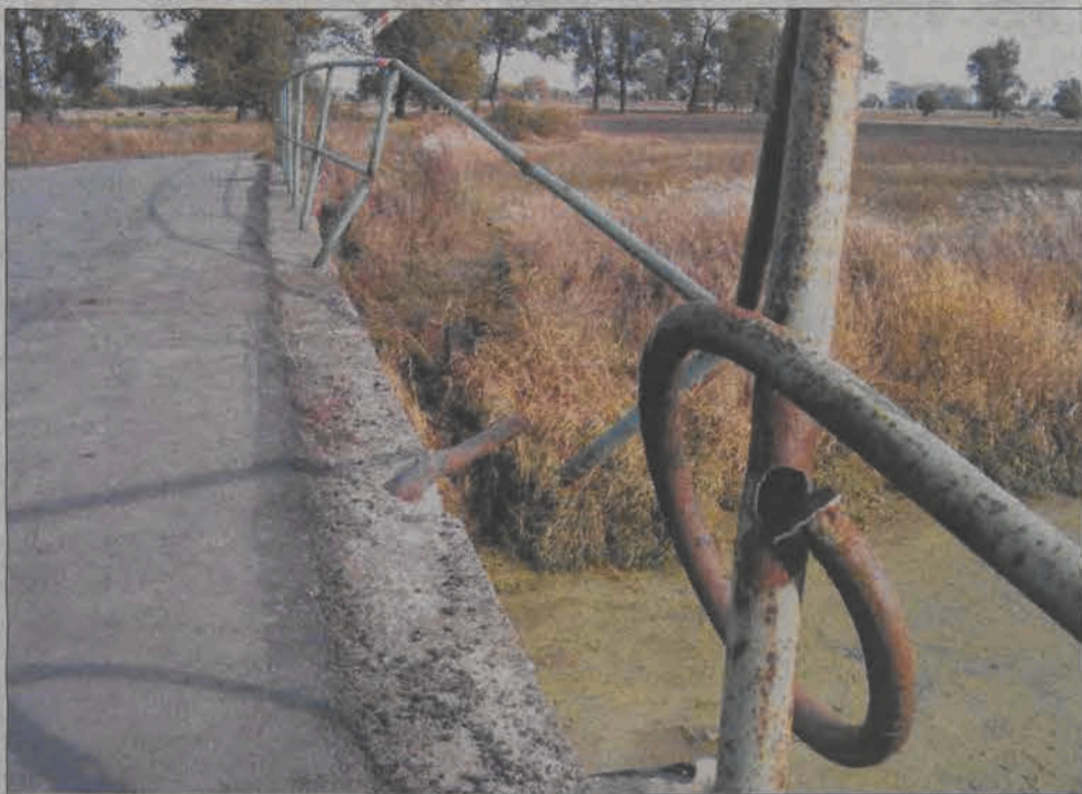
Barierki na moście na Słudwi zostały zabezpieczone tylko białą-czerwoną taśmą, którą zerwał wiatr...

2. Świerż w gminie Łowicz – niebezpieczny zakręt bezpośrednio przed mostem na Słudwi na drodze z Szymanowic w gminie Zduny do Świerża w gminie Łowicz. Brakuje znaków ostrzegawczych o tym nie-