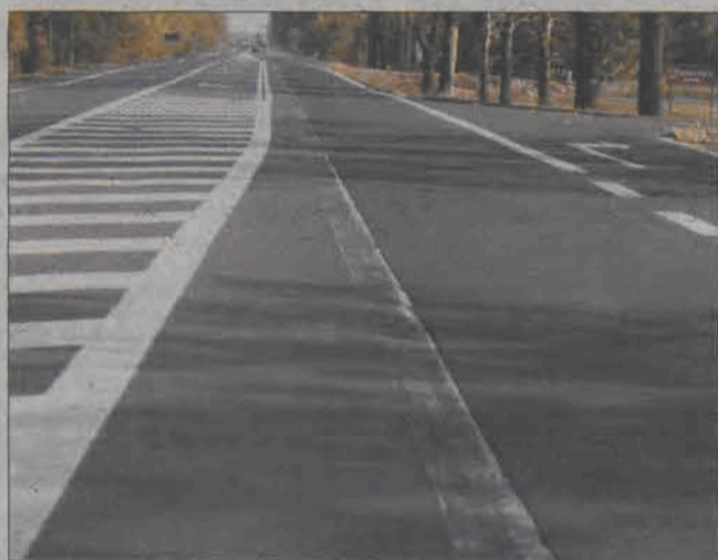
Na drodze w Maurzycach widać jeszcze stare, ciętne linie. Prawoskręt zaskakuje kierowców.

- Zima idzie dużymi krokami, a odpowiedzi z urzędu wojewódzkiego jeszcze nie ma. Sądzę, że nie uda nam się przeprowadzić remontu. Przecież nikt nie remontuje domu czy mieszkania podczas mrozów, bo to ogromny dyskomfort dla jego mieszkańców - dodaje dyrektor. (eb)