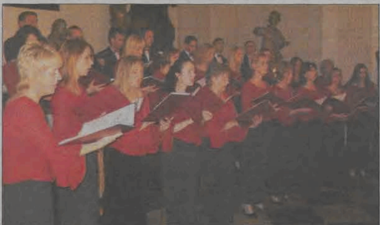
„Madrygał” z Legnicy oczarował łowicką publiczność.