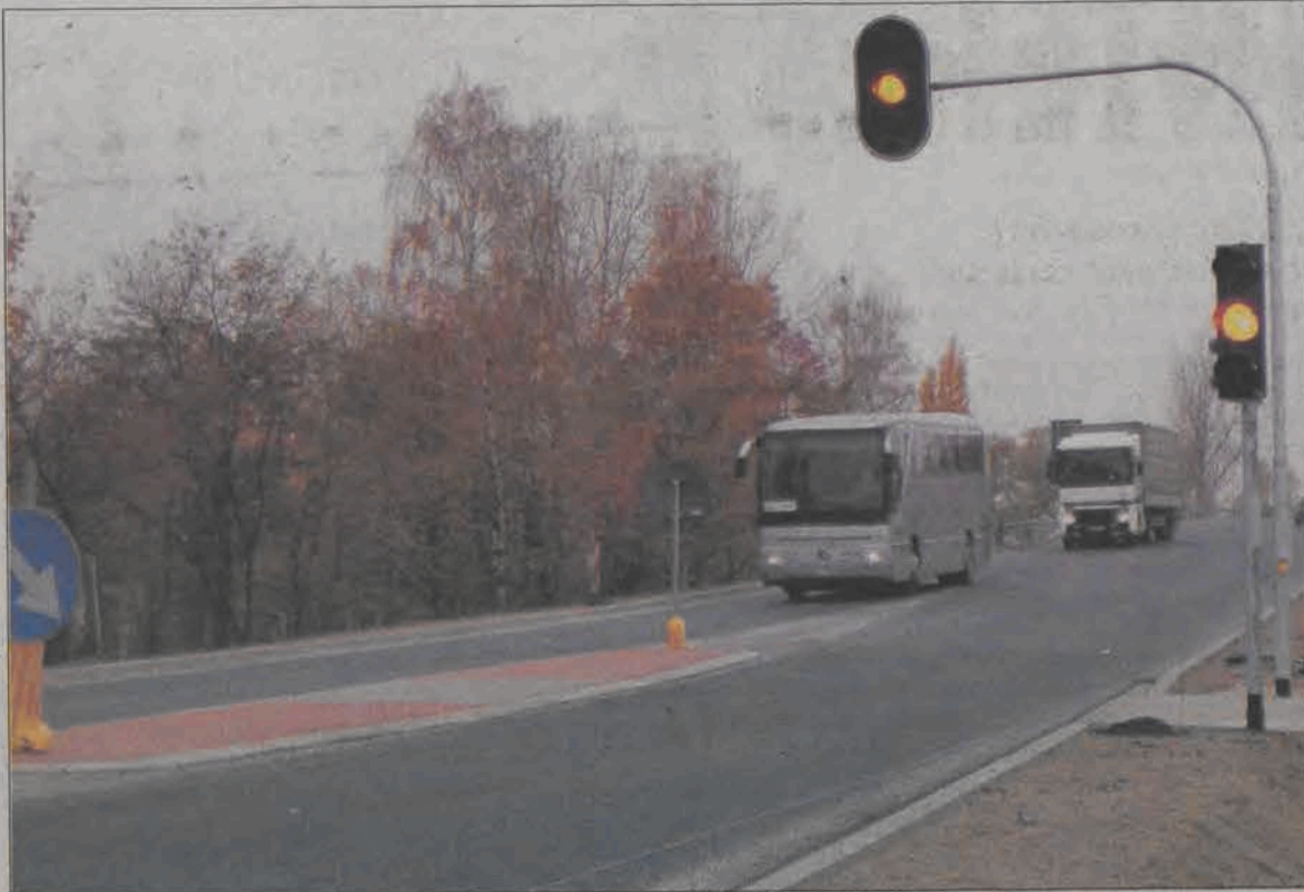
Światła na przejściu dla pieszych przy Grunwaldzkiej są już gotowe.