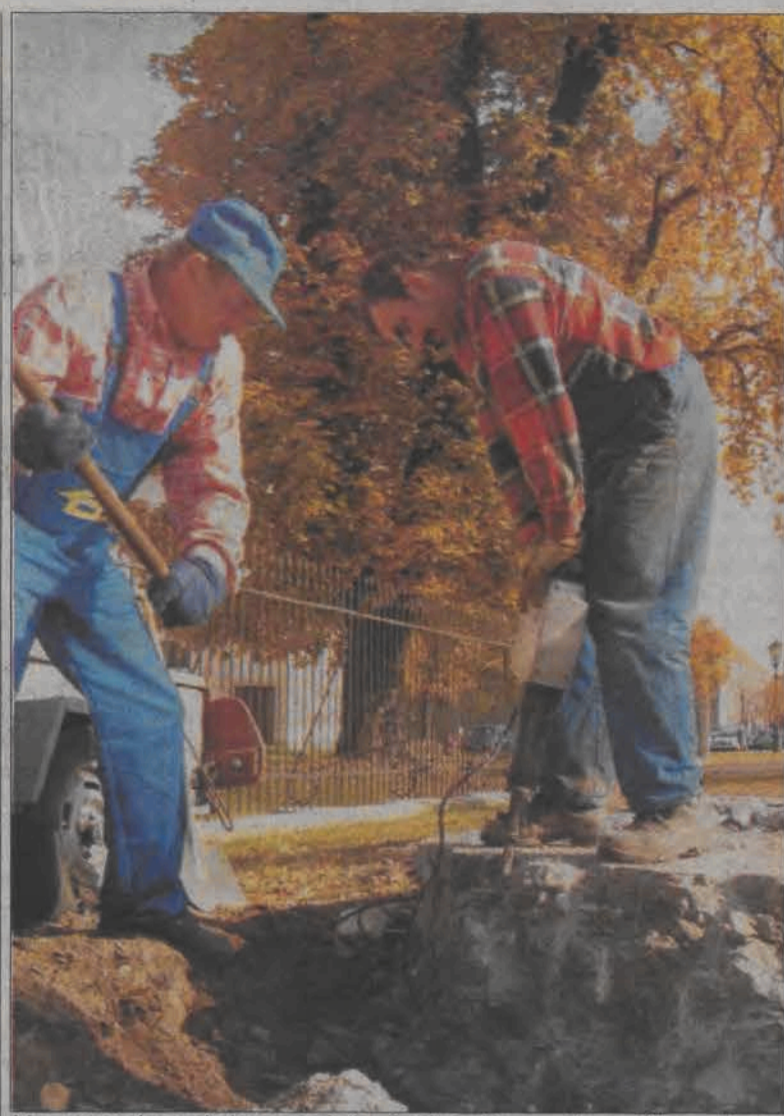
Maszynowo i ręcznie kruszono beton fundamentu pomnika na Starym Rynku, w jego wnętrzu znaleziono dokumenty dotyczące jego powstania.

10 lat do konkursu mała „Miss i Mały mistrz gminy Zduny”, dzieci będą prezentować się w sobotę 6 listopada na scenie sali widowiskowej. Konkursy przeznaczone są wyłącznie dla mieszkańców gminy Zduny. Ich rozstrzygnięcie przewidziano w czasie Święta Jesieni. Wtedy także rozstrzygnięty zostanie konkurs na czystą i piękną gminę. Gwiazdą święta będzie Halina Frąckowiak, która w niedzielę 7 listopada da swój recital w GOK. (tb)