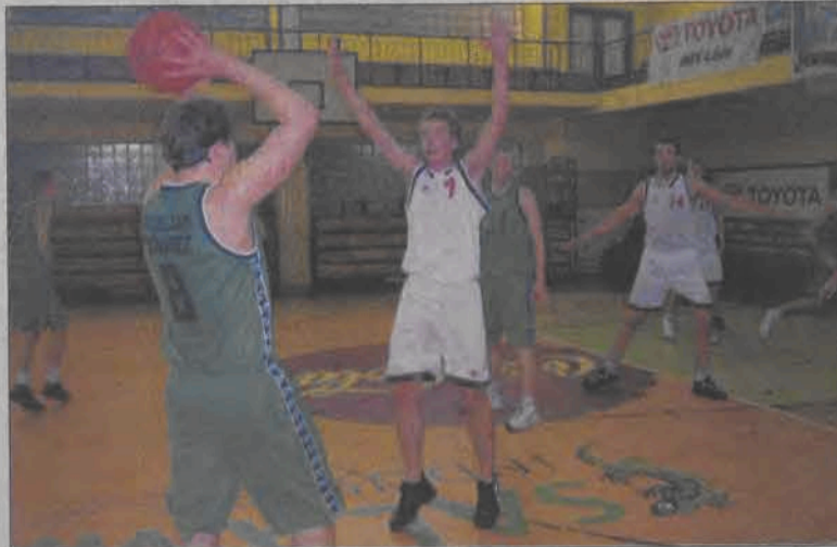
Łowiczanie znów przystąpili do meczu „poważnie przestraszeni”.