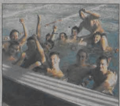
Sztafeta chłopców z I LO okazała się minimalnie lepsza od II LO.