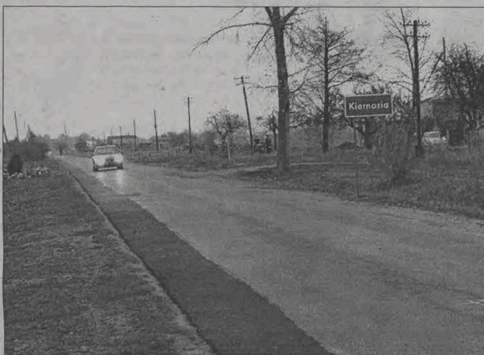
Droga z Kiernozia do Luszyńca poszerzana była w tym roku. Podobnie jak wiele innych dróg powiatowych wymaga ona też położenia nowej nakładki. Czy lepiej jest zadłużać się i inwestować, czy nie zadłużać się - to problem, przed którym stanął samorząd powiatowy.

sję rewizyjną - przyp. red.) która będzie to oceniać, jak zwykle skrupulatnie odniesie się do tego stwierdzenia - powiedział z wyczuwalnym sarkazmem. Starosta zwrócił uwagę, że druga kadencja rozpoczęła się z długiem 1 milion 244 tysiące, dodatkowo radni zdecydowali o zaciągnięciu kredytu dla szpitala w kwocie 900 tysięcy złotych. Zwrócił uwagę na prowadzone liczne inwestycje, które od roku 1999 pochłonęły 21 milionów złotych. - To jest plus minus szacowany dług powiatu z uzasadnienia - zauważył, dodając, iż dynamika inwestycji w ciągu dwóch lat w porównaniu do poprzedniej kadencji wzrosła o sto procent.