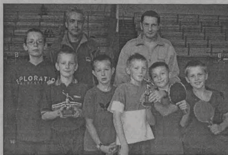
W eliminacjach rejonowych ekipa SP 3 Łowicz zajęła drugie miejsce, a chłopcy z SP Mastki zostali sklasyfikowani na miejscu 5-8.

Drugie miejsce w zawodach rejonowych wywalczyły uczennice Szkoły Podstawo-