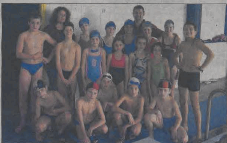
Awans do zawodów rejonowych wywalczyły obie sztafety ze Szkoły Podstawowej nr 4 w Łowiczu.