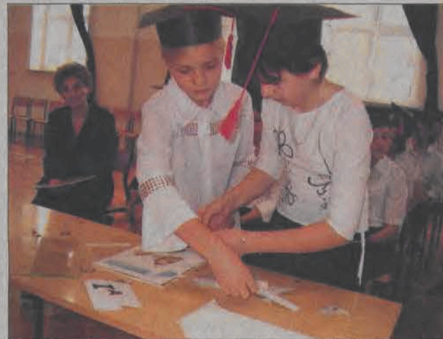
Gimnazjaliści wykazali się wiedzą o patronie w konkursie układania motywu z jednego z obrazów.

Przed ślubowaniem i pasowaniem gimnazjaliści odpowiadali na pytania quizowe na temat życia i twórczości Chelmońskiego, składali z elementów motyw z jednego z obrazów, malowali kopię, odgadywali, z którego obrazu pochodzą postacie, za które przebrali się ich koleżanki i koledzy. (mwk)