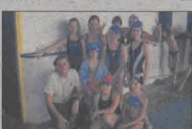
Wśród dziewcząt wygrała SP 2.