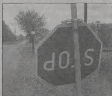
W pobliżu niestrzeżonego przejazdu kolejowego w Zielkowicach zniszczonych zostało aż sześć znaków.

Najwięcej znaków zostało zniszczonych bezpośrednio przy niestrzeżonym przejeździe kolejowym - drugim jadąc od strony