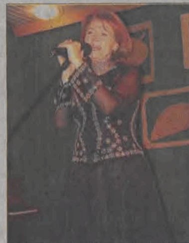
Halina Frąckowiak - gwiazda Święta Jesieni, przyciągnęła liczne grono sympatyków swych melodyjnych piosenek.