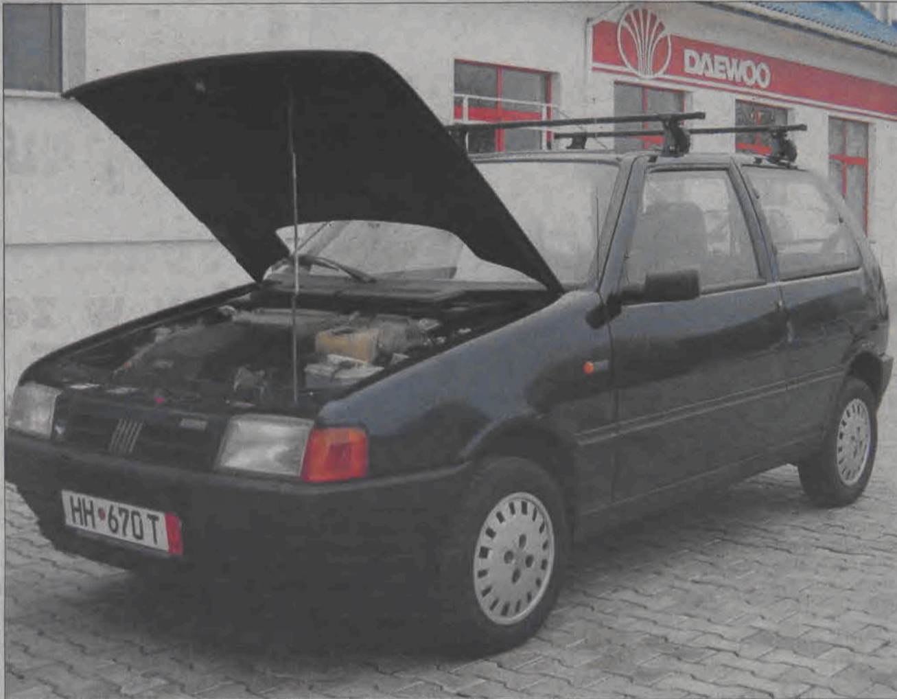
13-letni Fiat Uno kupiony został od niemieckiego leśnika za 100 euro. Lakier z zewnątrz jest trochę poskrobany, ponieważ samochód często jeździł po leśnych drogach. Przyjechał z Niemiec „na kołach”. Jego nowy, polski właściciel na autostradzie jechał nim nawet 170 km/h. Samochód został kupiony dla żony, która dojeżdża z Bednar do pracy w Syntexie.

Wydział komunikacji zobowiązany jest do wystawienia właścicielowi takiego auta karty pojazdu, co kosztuje właściciela prawie 700 złotych, wliczając w to znaczki skarbowe. Takiej karty pojazdu nie musi posiadać osoba rejestrująca auto zakupione w Polsce. Ponadto na granicy zapłacić trzeba 65 procent akcyzy od ceny samochodu widniejącej na fakturze zakupu. Kupujący jest