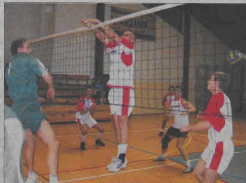
Dzi-koś-ć wygrała po raz trzeci i ekipa ta samodzielnie przewodzi w tabeli I ligi Amatorskich Mistrzostw Łowicza w piłce siatkowej.

Pogoda niekorzystnie wpłynie na nasze samopoczucie, osłabiona sprawność psychofizyczna.