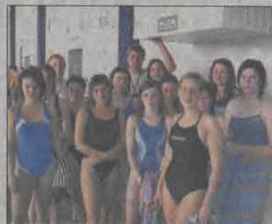
Po raz kolejny najlepszą została ekipa dziewcząt z I LO Łowicz.