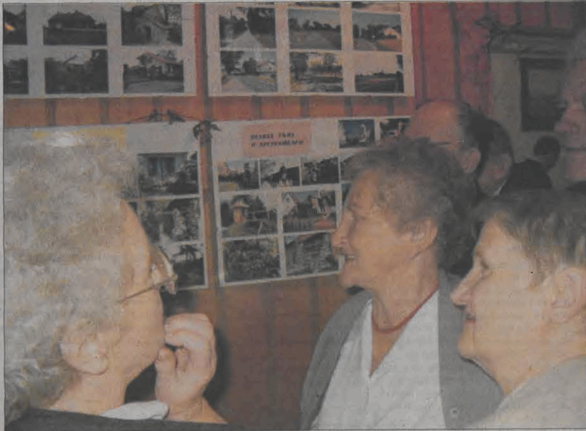
- To na naszej wsi? - tak dziwiło się wiele osób, oglądając zdjęcia zadbanych posesji, biorących udział w konkursie „Czysta i piękna gmina”.