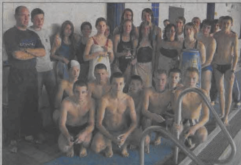
W tegorocznych mistrzostwach Łowicza szkół gimnazjalnych w pływalni dwukrotnie na czele uczniowie „Jedynki”.

Wicemistrzyniami powiatu łowickiego zostały zawodniczki Gimnazjum nr 2