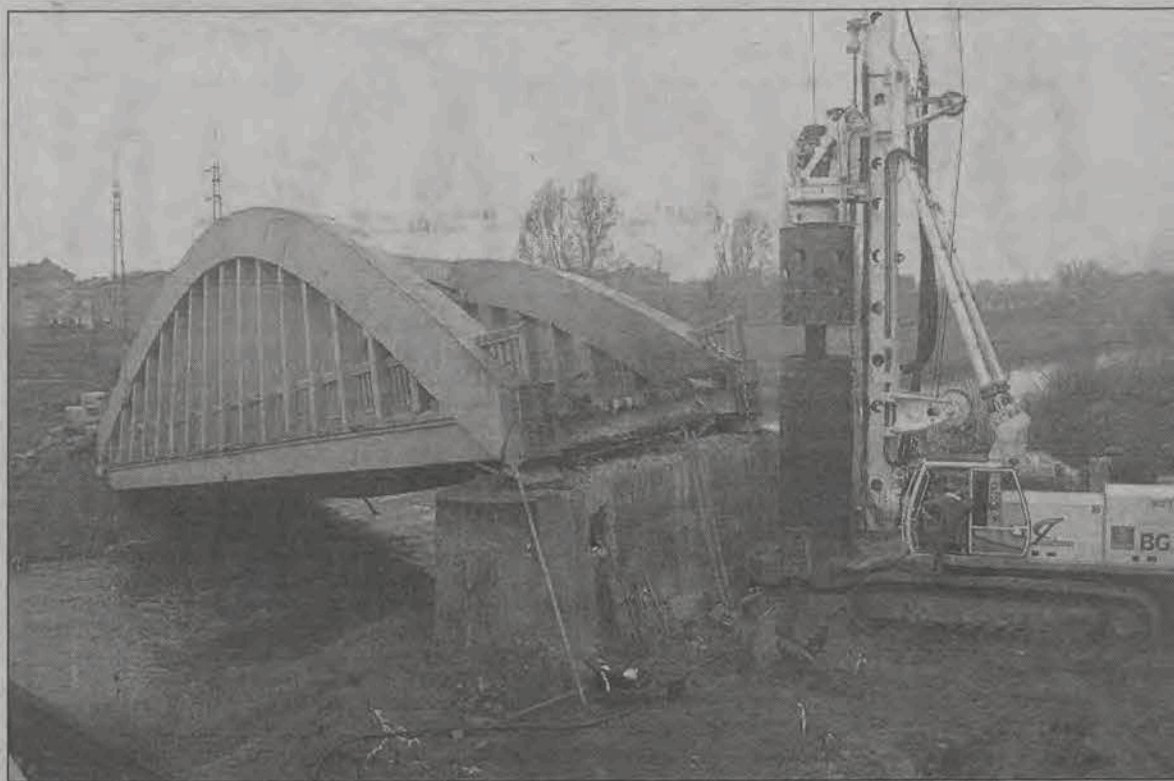
Trwa rozbiórka starego mostu Warszawskiego, w tym samym czasie stawiane są też pale pod nowy most.