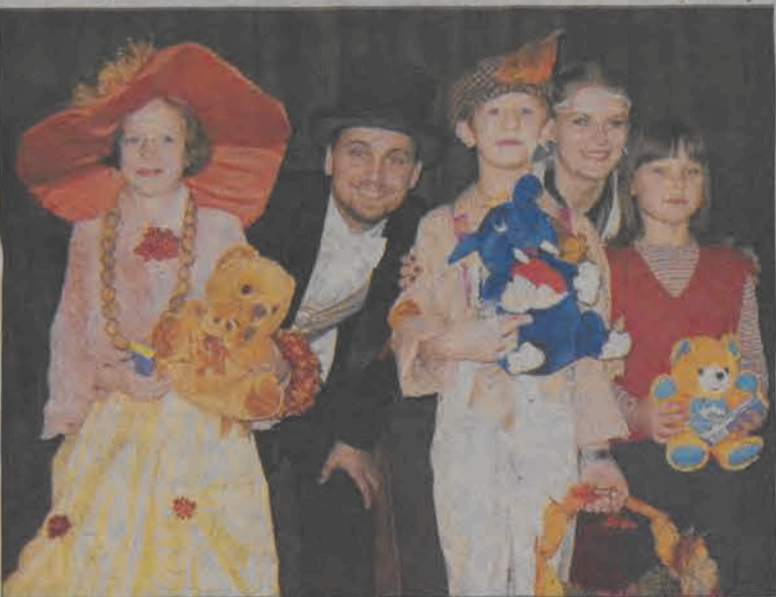
Pogotowie Artystyczne w otoczeniu Króla, Królowej i Pierwszej Księżniczki Jesiennego Balu.

Do 15 listopada potrwać mają prace przy budowie wodociągu Chyleniec - Michałówek. Kosztujący 420 tysięcy złotych wodociąg jest ostatnią z inwestycji, dzięki którym cała gmina Nieborów zostanie zwodociągowana. Na przyszły rok pozostanie między innymi wymiana rur azbestowych na rury PCV w Nieborowie. Wykonano już kosztorys, uzyskano pozwolenie. Za 550 tysięcy złotych wymienione zostaną rury, zamontowane zostaną nowe przyłącza. Nowe przyłącza za kwotę 30 tysięcy złotych założone zostaną także w Nieborowie Osiedlu, gdyż tam jedno przyłącze obsługuje trzy, a nawet pięć budynków, co w chwili obecnej stwarza problemy z zaopatrzeniem w wodę. Obecnie budowany wodociąg podłączony zostanie do istniejącej sieci w Belchowie. Ma on długość 780 metrów i 2600 przyłączy. Prace wykonuje firma Melgos z Gostynina. (wcz)