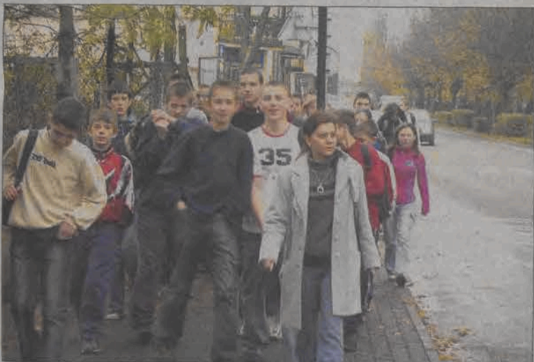
Młodzież pod wodzą nauczycieli wraca w bezpieczne mury szkoły. Podczas ewakuacji nie mogli zabrać kurtek, niektórzy byli w samych koszulkach, a nawet w krótkich spodenkach.

Kwiaty pod pomnikiem Synom Ziemi Łowickiej zostaną złożone 11 listopada ok. godziny 14, po zakończeniu uroczystości kościelnych poświęconych św. Wiktorii patronce miasta. (tb)