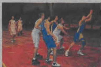
Księżacy odnieśli łatwe zwycięstwo z Wikingiem.

Łowicz, 7 listopada. Po raz drugi w tym sezonie spotkały się drużyny Księżaka i Wikinga. W pierwszym meczu 3 października, kiedy to łowiczanie grali po dłuższej przerwie, ledwie sobie poradzili z tą ekipą, wygrywając 47:39. W rewanżu było już znacznie lepiej. Patrząc na grę Księżaka, miało się wrażenie, że to inna drużyna. Łowiczanie ostro się zrewanżowali i nie dali ekipie z Tomaszowa najmniejszych szans, zwyciężając 92:49.