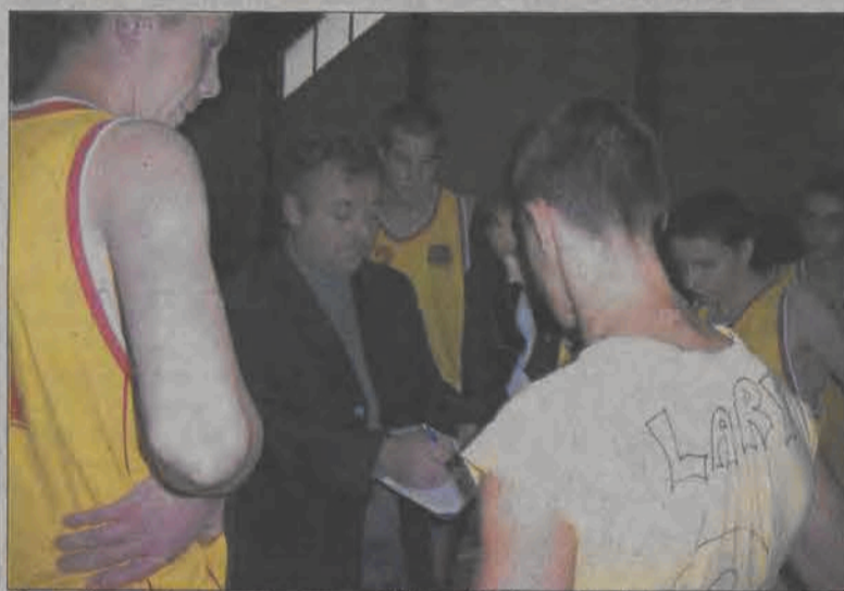
Podopieczni trenera Cezarego Włuczyńskiego nie dali szans rywalom.

Początek meczu podopieczni trenera Cezarego Włuczyńskiego zagrali bardzo skutecznie. W 7. minucie prowadzili 19:0! Po pierwszej kwarcie wygrawali 30:3 i trudno było tu mówić o równym poziomie. Oczywiście w takim meczu trener może