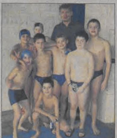
W rywalizacji chłopców najlepsi okazali się uczniowie „Pijarskiej”.