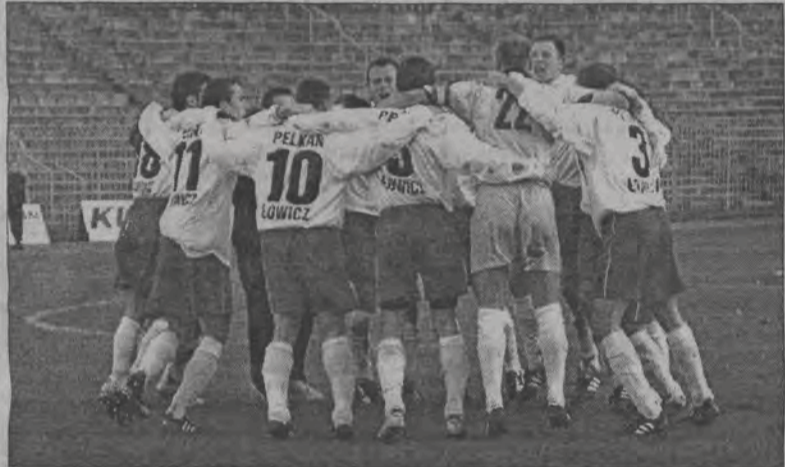
Po raz kolejny z wyjazdu na północny-wschód Polski Pelikan wraca z kompletem punktów.