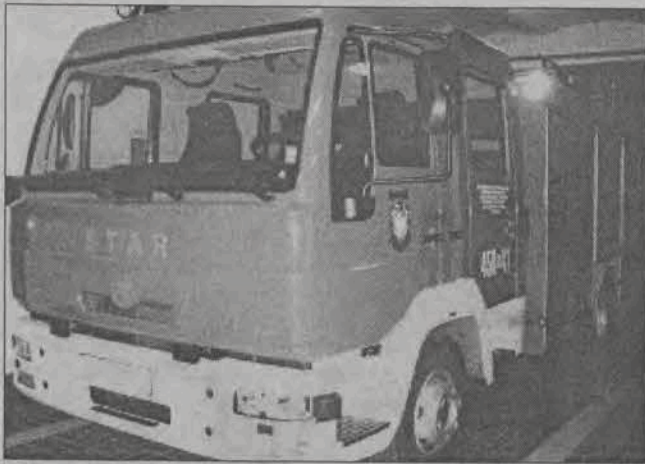
Tak prezentuje się nowy nabytek łowickiej OSP.