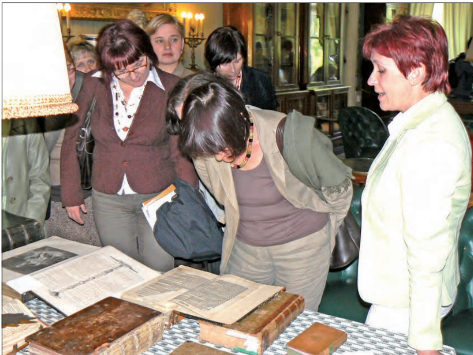
Bibliotekarze próbowali odczytywać staropolskie teksty i przyznać trzeba, że szło im całkiem sprawnie.

Wizyta zorganizowana została w ramach zakończonego już Tygodnia Bibliotek, organizowanego w dniach 5 - 11 maja przez Gminną Bibliotekę Publiczną w Nieborowie. Podczas spotkania bibliotekarze dowiedzieli się m.in., iż nieborowski księgozbiór zgromadził Michał Hieronim Radziwiłł, jeżdżąc po całej Europie i uczestnicząc w licznych aukcjach. Wiele z książek zakupił od francuskich dyplomatów, korzystając z powszechnej wtedy tendencji do wyprzedawania księgozbiorów. Zgromadził