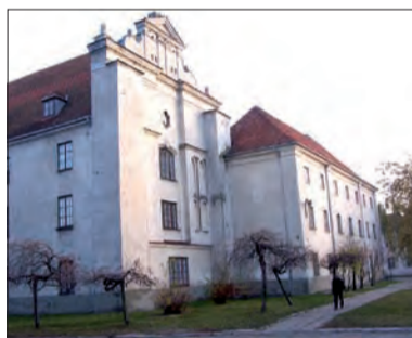
Kolegia przy ul. Stanisławskiego.

W NKJO prowadzona jest nauka trzech języków: angielskiego, niemieckiego i francuskiego. Nauka trwa przez 3 lata i kończy się pracą dyplomową pisaną pod kierunkiem nauczycieli NKJO. Nauczyciele kolegia współpracują z Uniwersytetem Warszawskim, korzystając z pomocy merytorycznej pracowników naukowych.