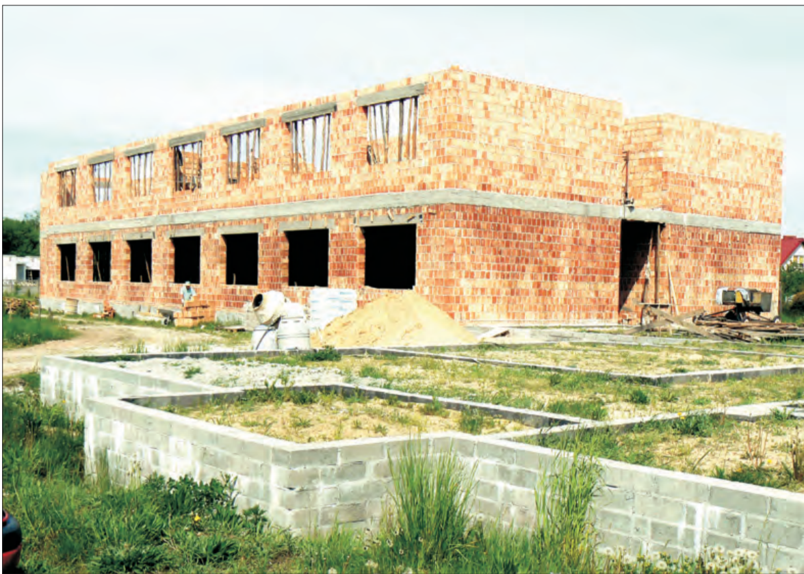
Druga kondygnacja murów Domu Pogodnej starości przy ul. Papieskiej jest już dobrze widoczna. Prace trwać mają do końca czerwca.

Warto dodać, że obecnie mury stawiane są tylko na połowie całego zaprojektowane-