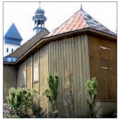
W ubiegłym roku w skansenie postawiony został kościół, w tym roku pojawi się dzwonnica z Wysokienic.

Ponadto za te pieniądze gontem przykryty zostanie dach kościoła, a także zamontowane zostaną podłogi. Zaplanowano również wykonanie szalunku zewnętrznego. Nie podjęto jeszcze ostatecznej decyzji