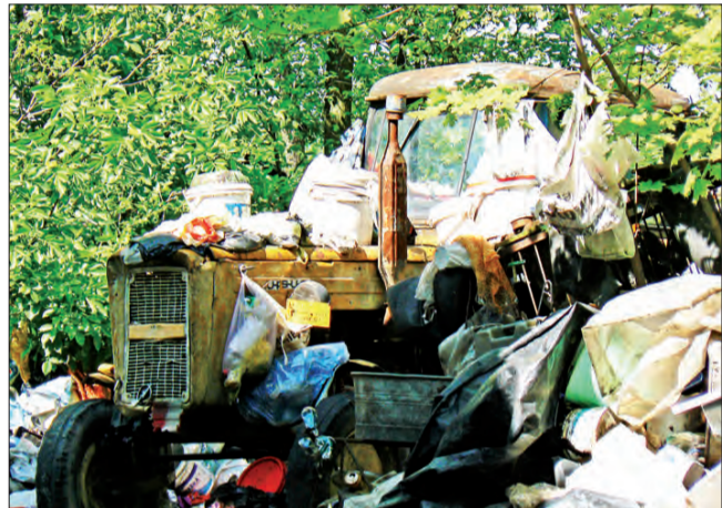
Jeden z dwóch „udekorowanych” traktorów na podwórku, które wszyscy w Nowostawach Górnych omijają szerokim łukiem.

Zirytowany głos przez telefon poinformował nas, że w Nowostawach Górnych jest gospodarstwo, w którym padła krowa. I dalej, że mieszkańcy mają powody, aby sądzić, iż zwierzę przedzie tygodniami rozkładać się będzie na podwórku,