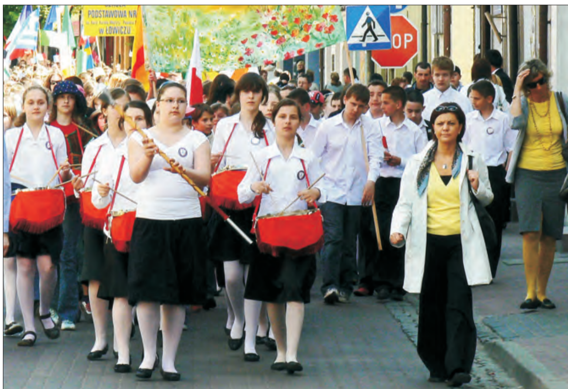
Barwnie i głośno obchodzili 9 maja Dzień Europejski uczniowie wielu łowickich szkół. Na zdjęciu: grupa dzieci z SP1, przedstawiająca Polskę. Więcej na str. 6.