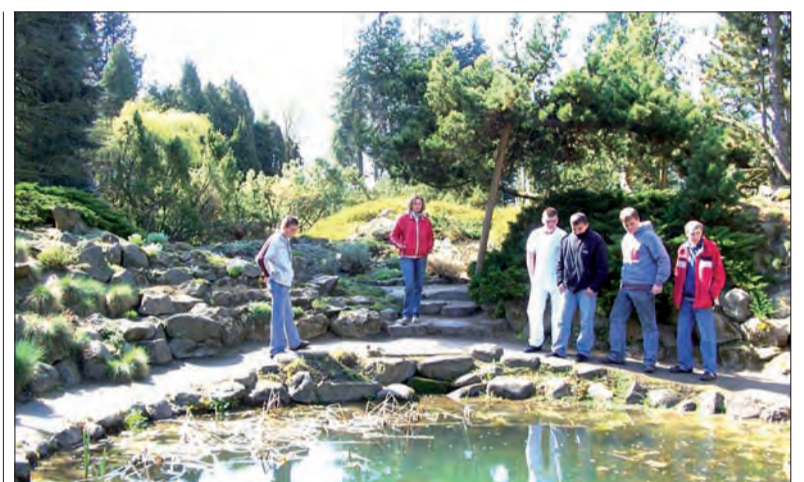
Skalne ogrody - to z tego właśnie słynie Rogów.