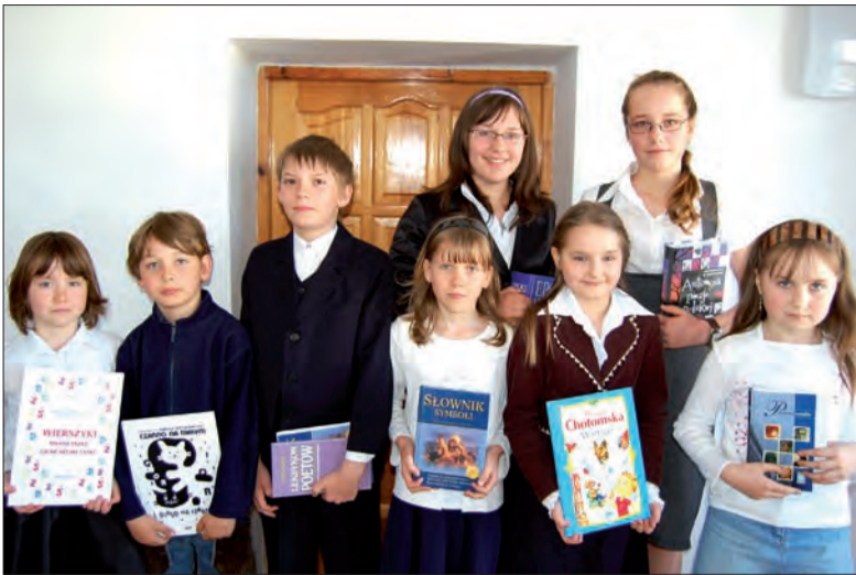
Laureaci etapu gminnego konkursu recytatorskiego. Oni reprezentować będą gminę Bolimów w finale w Skierniewicach.