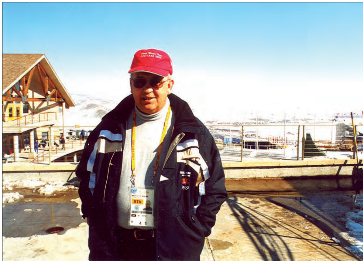
Obok centrum prasowego skoków narciarskich.

Cztery lata później niż mistrz skeletonu, James Shea jr, w Denver, Colorado przyszedł na świat Christopher Klug. Od najmłodszych lat nie miał większych zmartwień, bo rodzicom dobrze się powodziło.