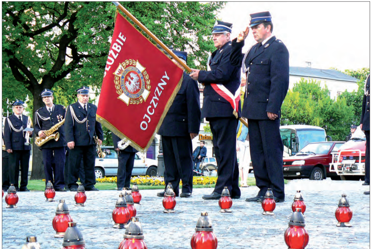
Pod pomnikiem papieża poczty sztandarowe oddały hołd Janowi Pawłowi II. Ustawiono też zapalone znicze.

Kawalkada wzbudziła na ulicach Łowicza duże zainteresowanie. Ludzie wyglądali z okien, zza płotów ogródków, ze sklepów. Robiono zdjęcia, nagrywano za