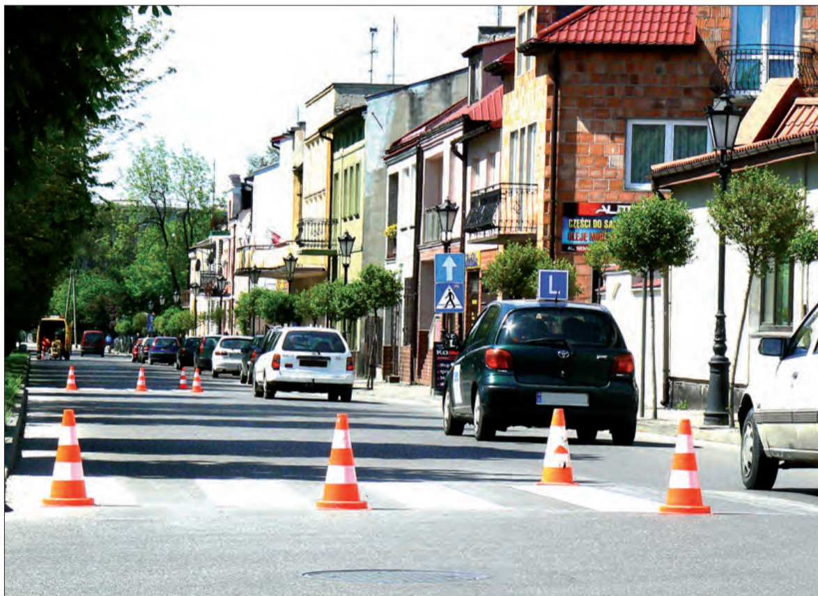
Malowanie pasów objęło na razie tylko centrum miasta, do końca czerwca firma ze Zgierza pomaluje pasy na wszystkich ulicach.