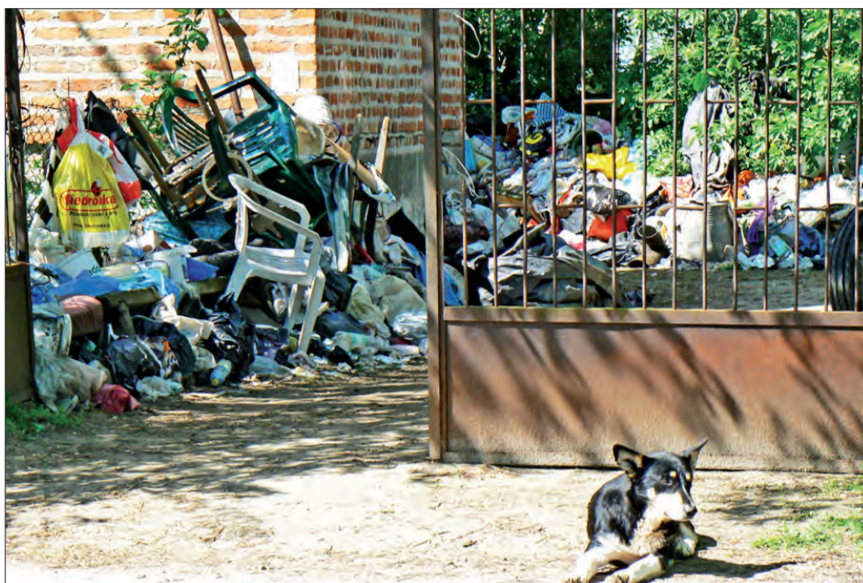
Tuż przy drodze, wśród zadbanych wiejskich podwórek i ogródków w Nowostawach Górnych nie miała niespodzianka - posesja zarastająca stertami śmieci i cuchnących odpadów

obrasła ceglany dom, dwa traktory i nie wiadomo co jeszcze. Po podwórku poruszać się można tylko wąskimi tunelami pośród śmieci. Ale to mało, bo naprzeciwko domu, po drugiej stronie ulicy rośnie kolejne wysypisko. Śmieciami „ustrojony” jest już nawet płatek przydrożnego krzyża. Obok cuchnąca kupka