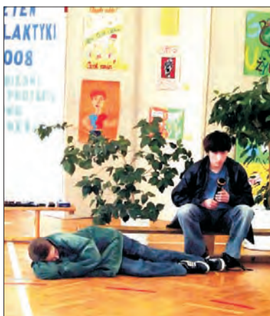
Inscenizacja „Nasze życie, nasze marzenia”.

W czasie dnia profilaktyki uczniowie przedstawili spektakl pt. „Nasze życie, nasze marzenia”, ukazujący zagrożenia płynące