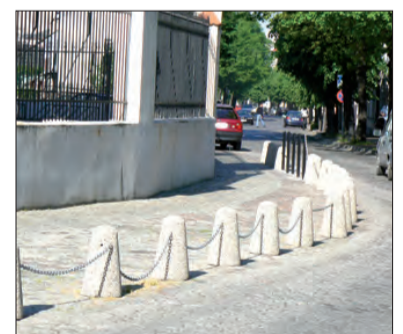
Wiele z tych betonowych słupków było przewróconych przez wandalów.