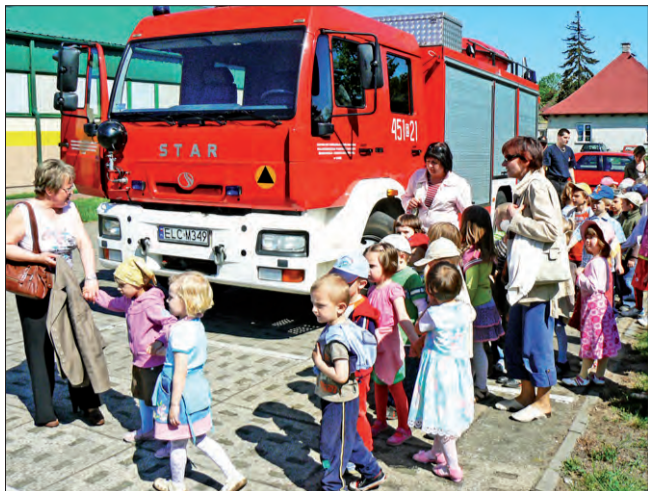
Strażacy w przedszkolu. Straż pożarna przyjechała 12 maja do przedszkola przy ul. Ułańskiej w Łowiczu - tym razem jednak strażacy nie gasili pożaru ani nikogo nie ratowali, tylko pokazywali sprzęt strażacki, dwa samochody bojowe, w tym podnośnik i opowiadali o swojej służbie. Co dzielniejszych przedszkolaków strażacy „przewieźli” w koszu podnośnika.