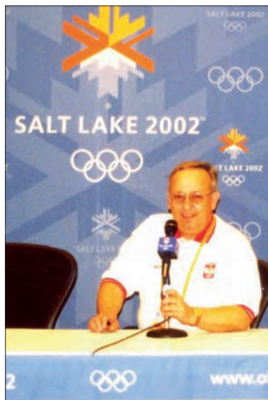
W centrum konferencyjnym igrzysk.