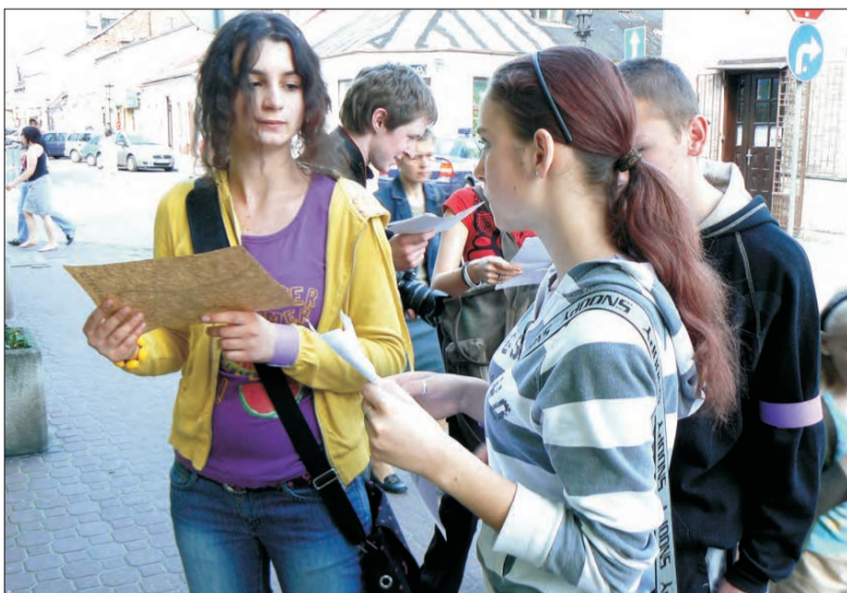
Dziewczęta z ZSP 4 miały problem z pierwszym zadaniem - nie ze swojej winy, fryzjera odnalazły błyskawicznie, tyle, że niczego nie mogły się dowiedzieć.

Do rywalizacji stanęło około 40 uczniów łowickich szkół średnich: drużyny z I, II i III Liceum Ogólnokształcącego oraz Zespołów Szkół Ponadgimnazjalnych nr 1 i nr 4. Najlepsi zdobyć mieli puchar przechodni. Oceniany był nie tylko czas, w jakim pokonano trasę, wykonując po drodze wszystkie zadania, ale także precyzja w wykonaniu zadań. - Biorę udział w tej grze po to, aby zrobić coś ciekawego, a nie tylko nudzić się w domu przed telewizorem