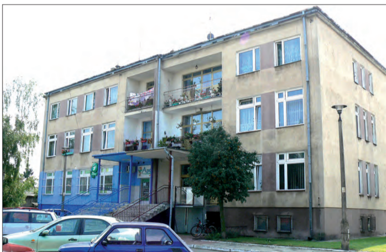
Parter budynku gmina chce zatrzymać dla siebie. Mieszkania znajdujące się na pierwszym i drugim piętrze mają wykupić najemcy.

Plan jest taki, że gmina Bielawy wykupi budynek ośrodka zdrowia w Bielawach od powiatu łowickiego z bonifikatą minimum 50%, a prawdopodobnie wynoszącą 60% ceny. Warunkiem będzie jednak zgoda lokatorów na późniejszy wykup mieszkań znajdujących się w ośrodku od gminy. Połowa z nich wyraziła zainteresowanie takim rozwiązaniem, a rozmowy trwają nadal. - Nie chcemy na tym zarobić, ale oczekujemy, że zwróci nam się kwota, którą zapłacimy powiatowi za ośrodek, czyli niecałe 400 tys.