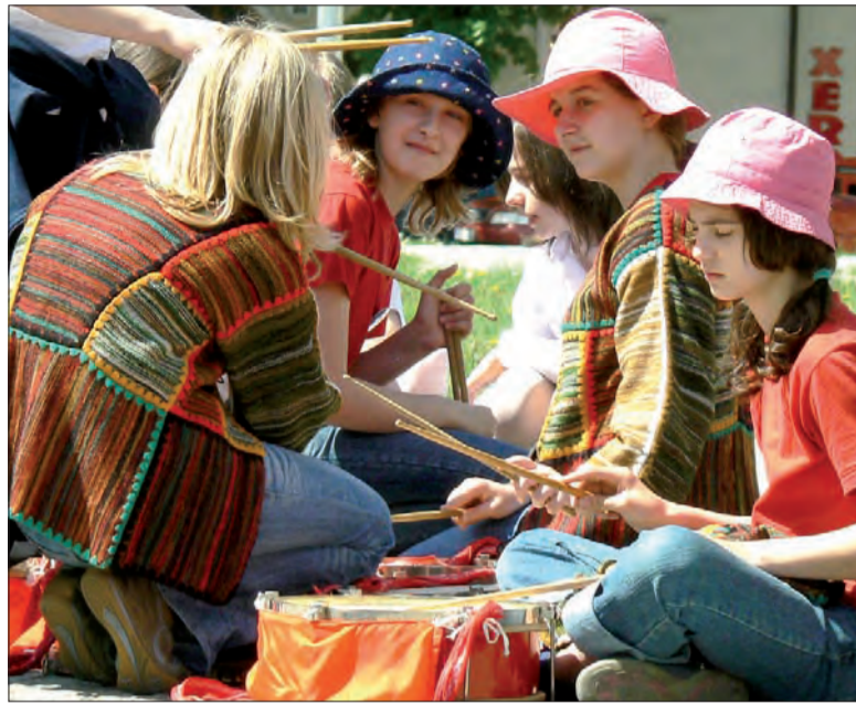
Werblistki ze Szkoły Podstawowej nr 1 tuż przed wyruszeniem w pochód na Nowy Rynek.

I tak, Szkoła Podstawowa nr 1 przedstawiła Polskę, SP nr 2 - Hiszpanię, SP nr 3 - Irlandię, SP nr 4 - Grecję, zaś SP nr 7 - Wielką Brytanię. Natomiast Gimnazjum nr 1 prezentowało Szwecję, Gim. nr 2 - Francję, Gim. nr 3 - Niemcy, Gim. nr 4 - Włochy. (tb)