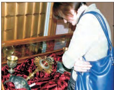
Pozłacane, drogocenne przedmioty ze względów bezpieczeństwa wystawione zostały tylko w dniu otwarcia wystawy. Tego samego dnia wróciły do kościelnego skarbcza.