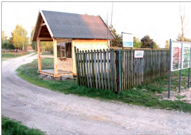
Przy wejściu do skansenu w tym roku staną kiosk, w którym pracownik muzeum w Łowiczu będzie sprzedawał bilety.

W czerwcu wyremontowany zostanie dach budynku komunalnego w Bełchowie Osiedlu. Chodzi o blok nr 14 przy ulicy Przemysłowej (jest to drugi z bloków stojących przy tej ulicy). Koszt prac nie będzie może wielki, jednak gmina zorganizuje przetarg, gdyż prac wysokościowych nie może wykonać przy pomocy brygady remontowo-budowlanej. Datę przetargu wyznaczono na 26 maja. Prace obejmą rozbiórkę pokrycia dachowego, wymianę niektórych elementów konstrukcji drewnianej dachu, przebudowę komińów ponad dachem, wykonanie pokrycia dachowego blachą powlekaną z obróbkami. (wcz)