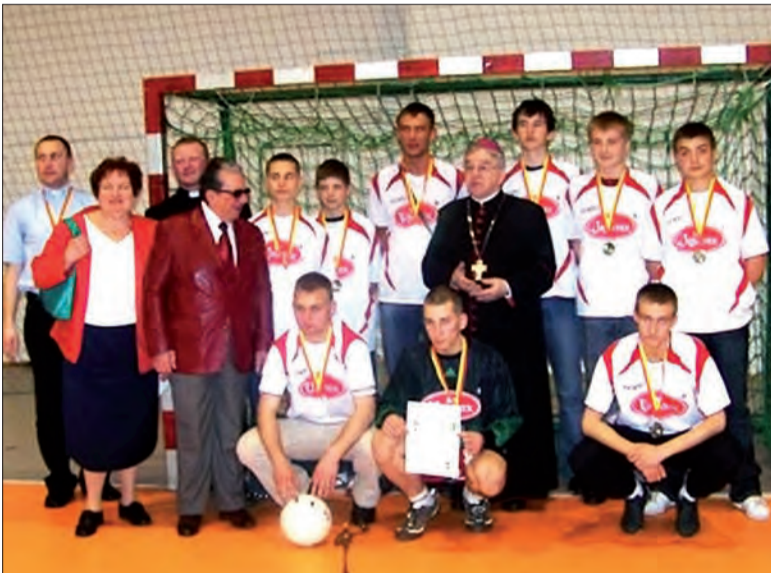
Ministranci - piłkarze z Łowicza, mają powody do dumy, bo z Łodzi wrócili z tytułem Mistrzów Polski.

Dodać warto, że piłka nożna jest w gronie służby liturgicznej bardzo popularnym sportem. Od kilku lat w diecezji łowickiej odbywają się rozgrywki w kategorii szkół podstawowych, gimnazjów i szkół średnich, w których diecezja podzielona jest na rejony obejmujące np. Łowicz, Skierniewice, Sochaczew, Łęczycę, etc. Mistrzowie i wice-