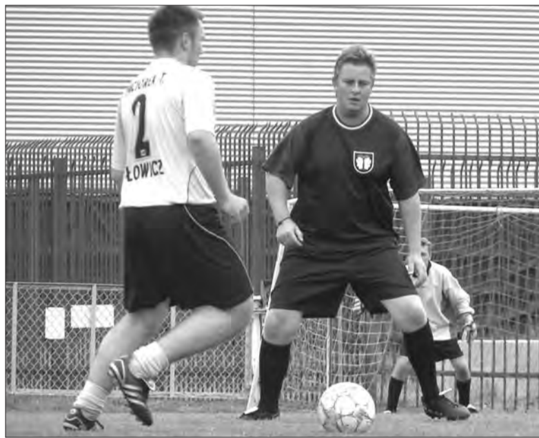
W finale Samorządowcy pokonali „Kolejowych” 1:0.