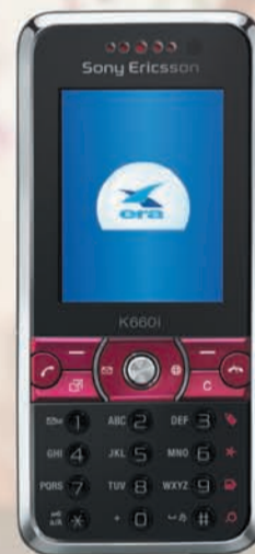
Sony Ericsson K660i

*opłata zgodna z cennikiem operatora sieci, z której wykonywane jest połączenie