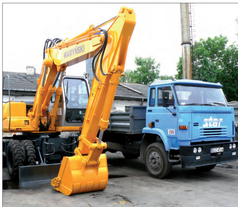
Nowa koparka Waryński na dniach będzie pracować na terenie Łowicza.

Rejony dzielnicowych można sprawdzić na nowo powstałej stronie internetowej Komendy Powiatowej Policji w Łowiczu. Do każdego dzielnicowego z Łowicza jest podany telefon. Oprócz tego na stronie znajdziemy telefony kontaktowe do kierowników poszczególnych sekcji w komendzie oraz ogień prewencji w gminach. Oprócz informacji teleadresowych na stronie można znaleźć informacje o aktualnie prowadzonych kampaniach i programach np. o programie „Tego się boję”, ogólnopolskiej akcji „Pilnuj drinka” czy Policji Akademii Bezpieczeństwa. Strona jest dostępna pod adresem www.łowicz.policja.gov.pl (mak)