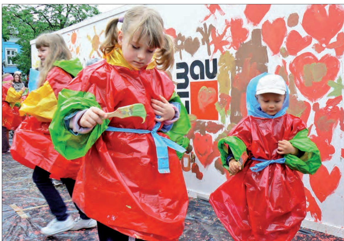
KOLOROWE EMOCJE - sobotnia impreza na Nowym Rynku dla dzieci, której mecenasem był koncert Baumit, wzbudziła sporo emocji. Organizatorzy szacują, że uczestniczyło w niej nawet ponad tysiąc dzieci, zużyto 350 pędzli i pomalowano około 280 m 2 powierzchni. Więcej czytaj na stronie 14.