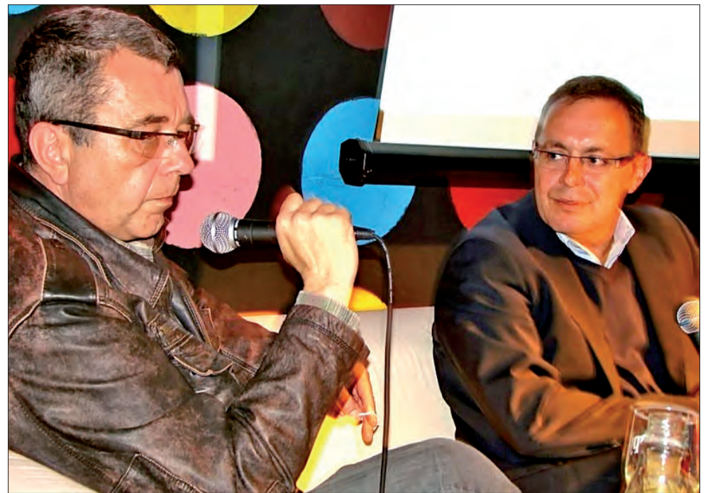
Grzegorz Miecugow i Tomasz Sianecki byli pierwszymi gośćmi klubu Pracownia w ramach cyklu Konfrontacje.

Autorzy popularnego programu telewizji TVN „Szkoło kontaktowe” Grzegorz Miecugow i Tomasz Sianecki - na zaproszenie Pracowni Sztuki Żywej - odwiedzili Łowicz.