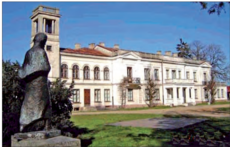
Pałac w Sannikach to największy obiekt związany z F. Chopinem w Polsce. Jego remont kosztować ma około 20 mln zł.

ponieważ okazało się, że jest jej potrzebna pomoc lekarska. Poprosił wtedy też jednego z pracowników urzędu o skontaktowanie się z wszystkimi radnymi, z którymi będzie to możliwe, z prośbą o natychmiastowe przybycie.