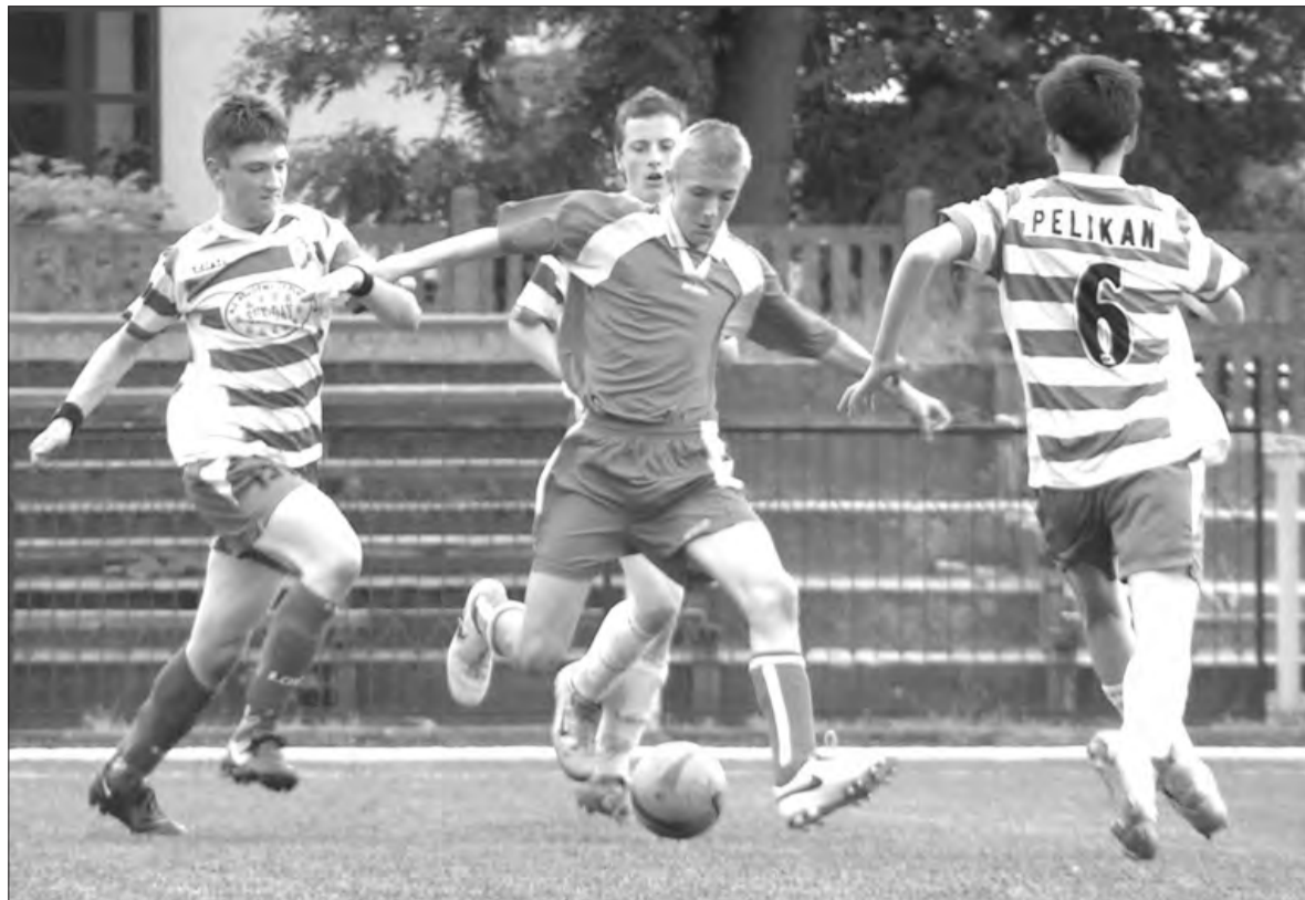
Łowiczanie nie sprościli tym razem Visowi.

Piłka nożna - wojewódzka liga Michałowicza