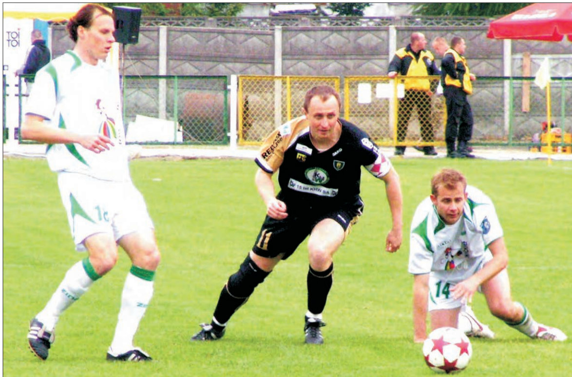
Piłkarze Pelikana wygrali z GKS Katowice 2:0 (2:0), ale nie zdołali utrzymać się w II lidze.