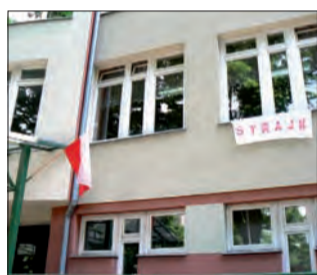
Czerwone litery na białym materiale z napisem „strajk” z daleka widoczne dla przechodniów mówiły jedno - w ZSP nr 4 nie ma lekcji 27 maja.

Strajk nie miał oznaczać, że strajkujące placówki będą zamknięte dla uczniów. Nauczycie-