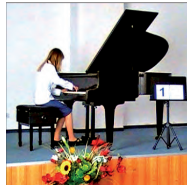
Festiwal zgromadził w tym roku 88 pianistów z 27 szkół. Przesłuchania trwały 2 dni.