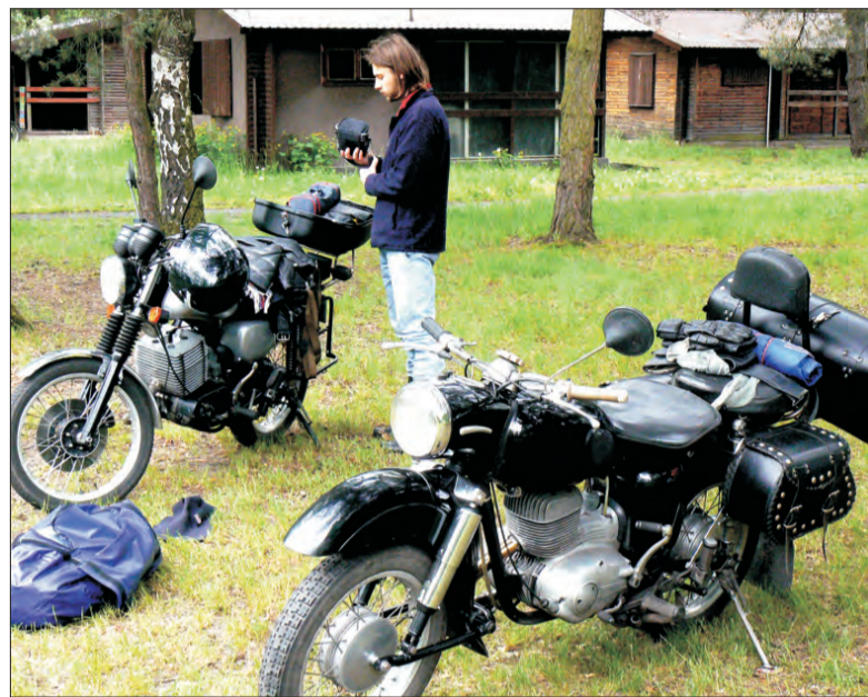
W zlocie uczestniczyły nie tylko MZ-ki, ale tych była zdecydowana większość.

stronę, bo stała na krzywym podłożu. (...) Wracałem około 7 godzin, więc nie było źle. Drogi puste, więc można było odkryć. Na autostradzie tradycyjnie max - pisał na forum MZ Klub Polska motocyklista z Lubania - Zgorzelca. (mak)