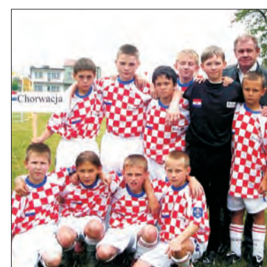
Młodzi piłkarze Pelikana z legendarnym Włókiem Smolarkiem.