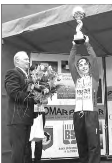
Zwycięzczyni II etapu Włoszka Georgia Bronzini.