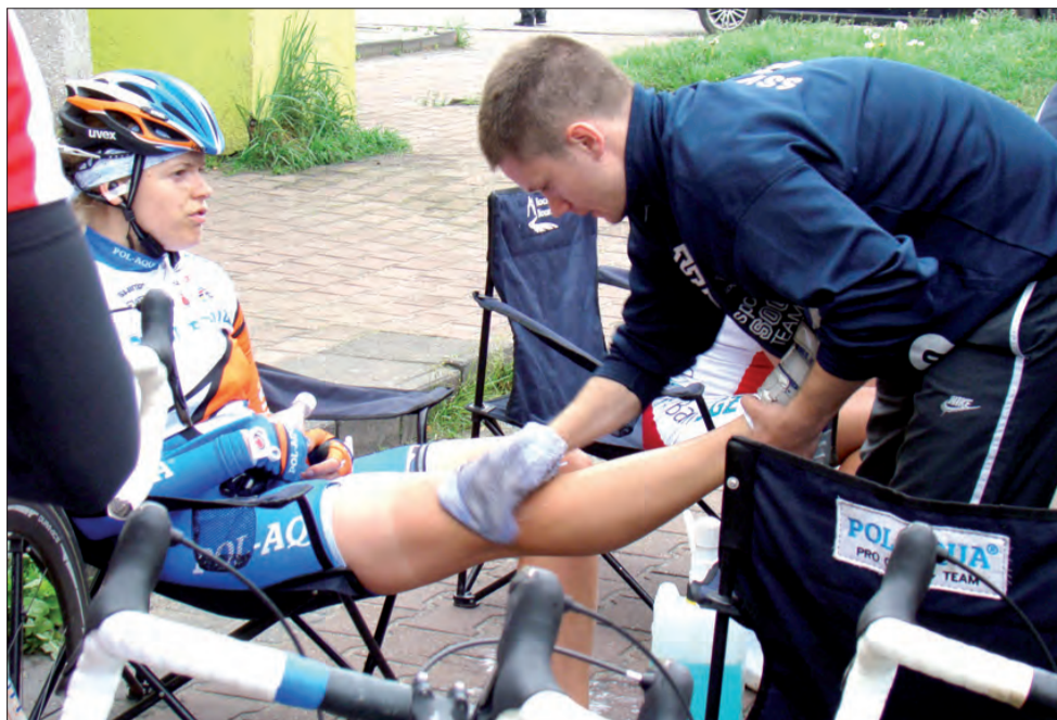
Masaż obolałych, zeszytwniałych mięśni...

W chwilę po zakończeniu wyścigu, kiedy znane było tylko nazwisko najszybszej - Włoszki Georgii Bronzini,