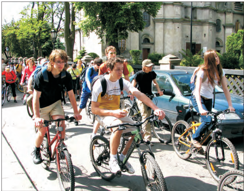
Uczniowie szkół pijarskich, wzorem lat ubiegłych, na imprezę do skansenu w Maurzycach pojechali rowerami.