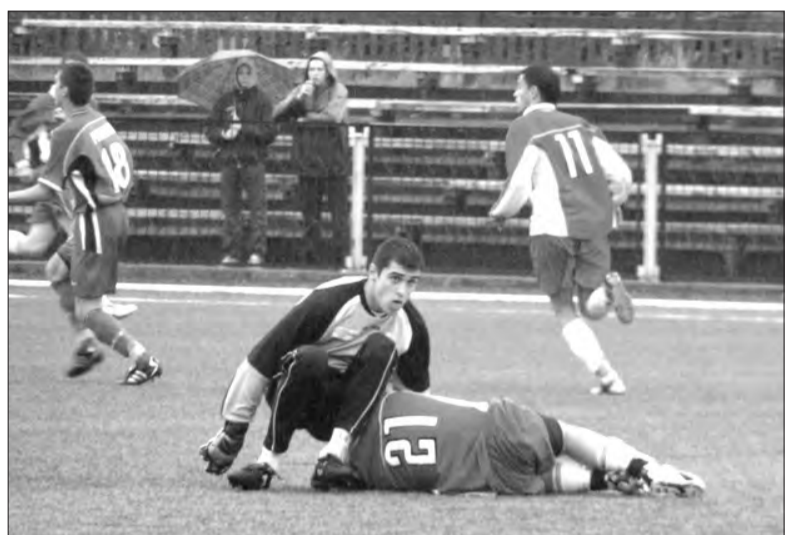
W meczu z UKS SMS łowiczanie przegrali 0:3.

W najbliższą sobotę łowiczanie zagrają przedostatni raz w lidze wojewódzkiej i podejmować będą na stadionie łowickiego OSiR Lechię Tomaszów Mazowiecki. (zł)