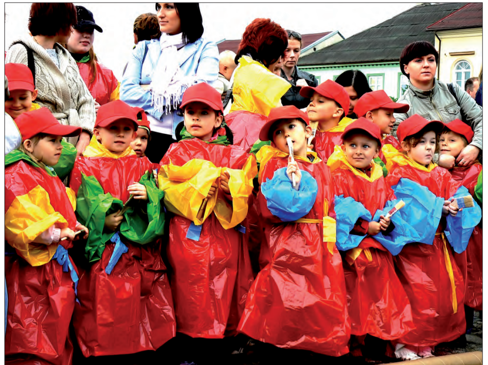
Założenie kolorowej pelerynki było warunkiem przystąpienia do malowania.