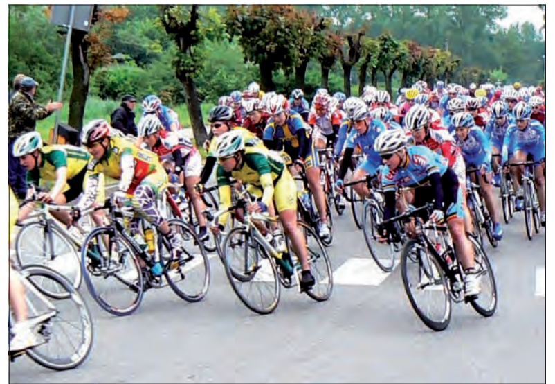
Niemal cały etap zawodniczki przejechały w zwartym peletonie.