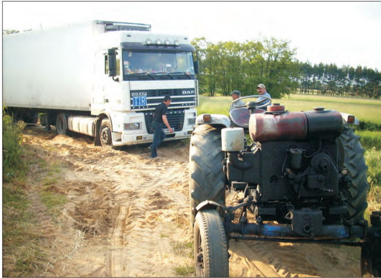
Mieszkańcy Zielkowic pomagali wyciągać TIR-y własnymi ciągnikami.

Kierowcy jadący od strony Skierniewic powinni już dużo wcześniej zauważyć znaki informujące o zamknięciu przejazdu kolejowego w Arkadii. Samochody osobowe mogą szukać objazdu właśnie przez Zielkowice, zaś samochody ciężarowe powinny pojechać przez Łyszkowice. Okazuje się jednak, że wielu kierowców ciężarówek również szuka drogi przez Zielkowice. Ruch na tej drodze jest nieporównywalnie