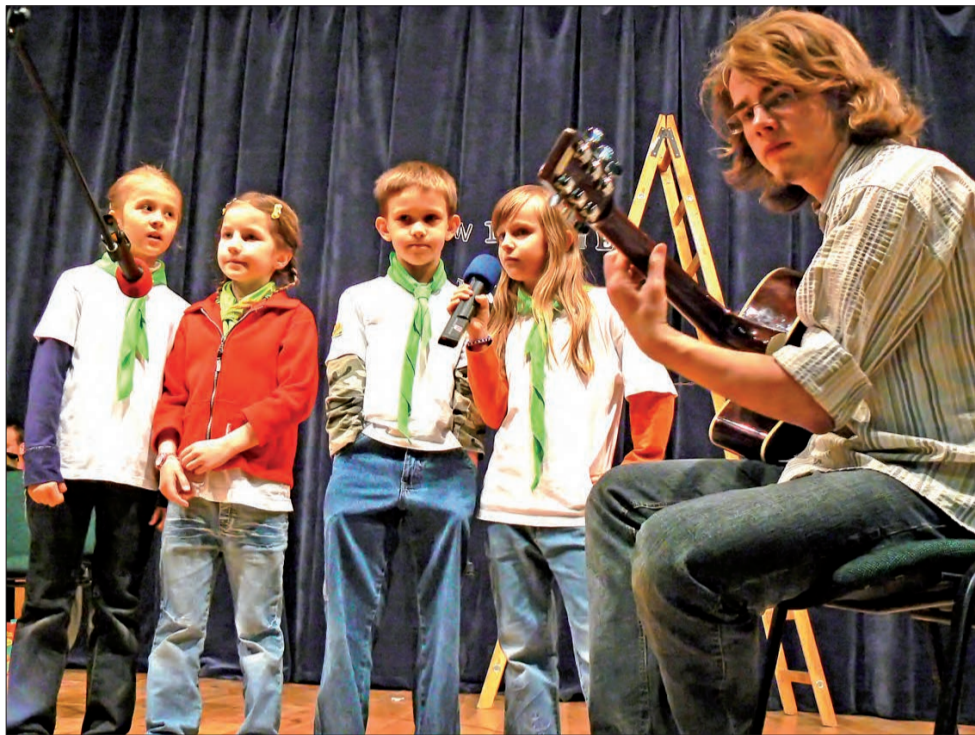
Część 123. Gromady Zuchowej „Wesołe Siedmiokroczki” - I miejsce w kategorii 6-11 lat.

Harcerskie spotkanie rozpoczęło się konkursem plastycznym dla zuchów i harcerzy młodszych na dziedzińcu Łowickiego Ośrodka Kultury. W samo południe w sobotę, 24 maja w kinie rozpoczął się natomiast festiwal piosenki harcerskiej i turystycznej. Ekipy biorące udział w festiwalu prezentowały wysoki poziom, wszyscy korzystali z akompaniamentu własnego (gitary, flet). Spoza środowiska harcerskiego w festiwalu wzięły udział dwie ekipy: z Gimnazjum nr 2 w Łowiczu i Gimnazjum nr 1 w Kompinie. Wśród zaprezentowanych piosenek znalazły się utwory z repertuaru m.in. Starego Dobrego Małżeństwa, Jacka Kaczmarskiego, zespołów Ira, Hey, jak również piosenki z repertuaru typowo harcerskiego. Piosen-