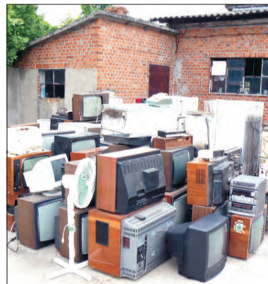
W gminie Chaśno zbiórka się udala.

Wtorek 3 czerwca: godz. 8.00-8.30 - przed OSP Łaguszew, godz. 8.45-9.15 - przed OSP Płaskocin, godz. 9.30-10.00 - przed OSP Sromów, godz. 10.15-10.45 - przed posesją Jerzego Papiernika w Ostrowcu, godz. 11.00-11.30 - przed OSP w Gągolinie Północnym, godz. 11.45-12.15 - przed świetlicą w Lenartowie, godz. 12.30-13.00 -