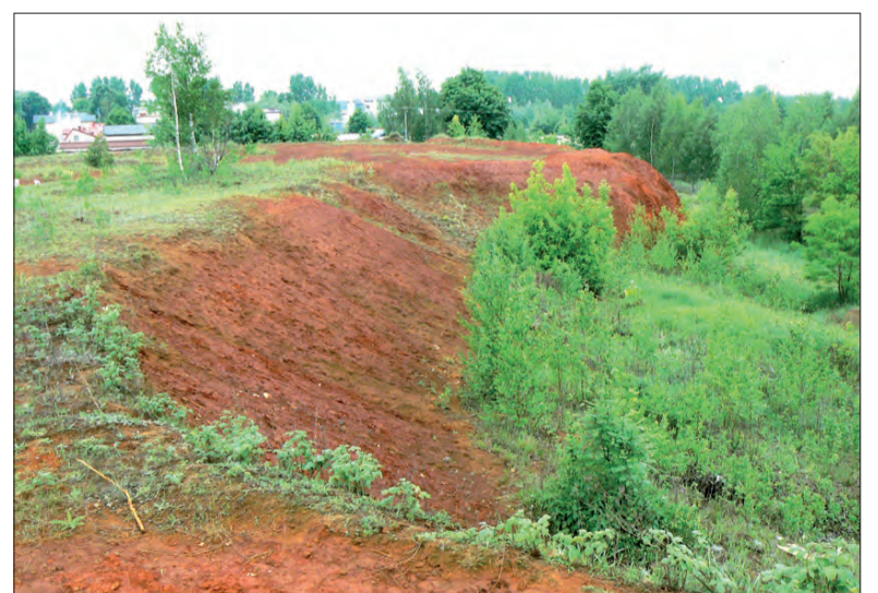
Kiedy zniknie Czerwona Góra okaże się, gdy znajdzie się jej nabywca. Miasto chce wystawić na sprzedaż teren, na którym się znajduje.

Działka, na której znajduje się góra, ma powierzchnię przeszło hektara, co daje spore możliwości jeśli chodzi o możliwość zagospodarowania. Jedyny problem to kwestia pozbycia się z niej około 45 tys. m 3 czerwonej substancji, od której wzięła się nazwa wzniesienia. Czerwona substancja to, zgodnie z wykonaną ekspertyzą przez rzeczoznawcę, tlenek żelaza. Pozostał on w tym miejscu po zniszczonej w okresie I wojny światowej, fabryce przetworów chemicznych. Góra jest, obok budynków mieszkalnych znajdujących się w admini-