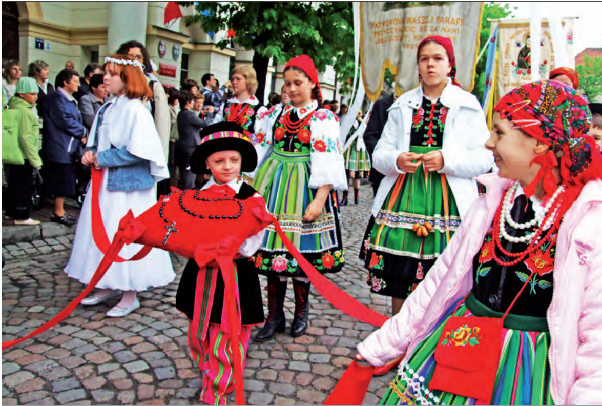
Boże Ciało przyciągnęło dużą grupę turystów, wszystko za sprawą kościelnych tradycji i kolorowych strojów ludowych.