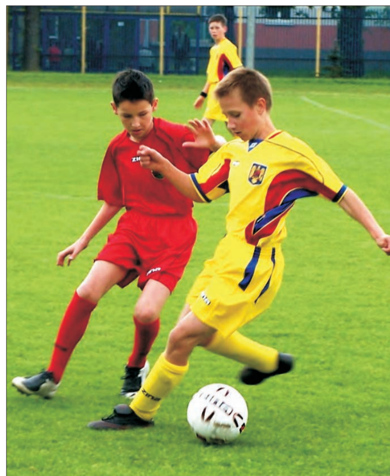
W pojedynku SP 4 (Walia) i Łyszkowic (Rumunia) padł wynik remisowy.

■ UKRAINA - IZRAEL 0:0 ■ WALIA - RUMUNIA 0:0 ■ UKRAINA - RUMUNIA 0:0 ■ WALIA - IZRAEL 0:0