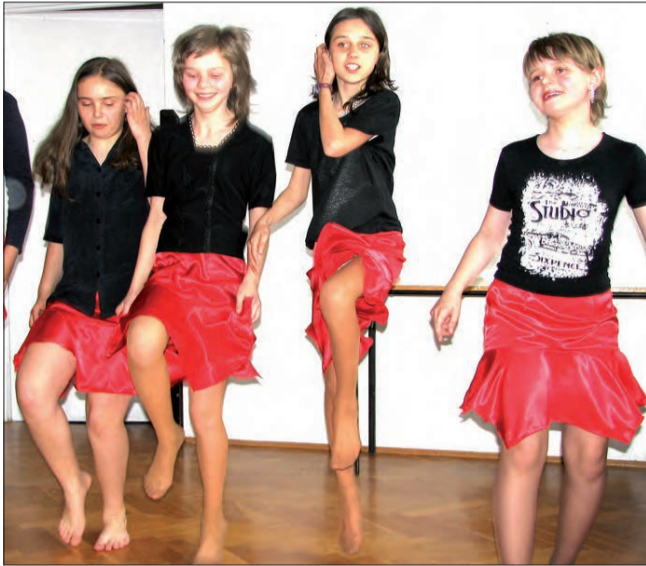
Klasa przedstawiająca Francję zdecydowała się zatańczyć kankana.

Konkursy mody, piosenki i tańca, a także rywalizacja w dekoracji sal i kulinariach - to dziedziny, w których musieli się wykazać uczniowie klas IV, V i VI Szkoły Podstawowej w Gągolinie w gminie Kocierzew. Wszystko to odbyło się w środę 21 maja, podczas trwającego około 3 godzin Dnia Europejskiego.