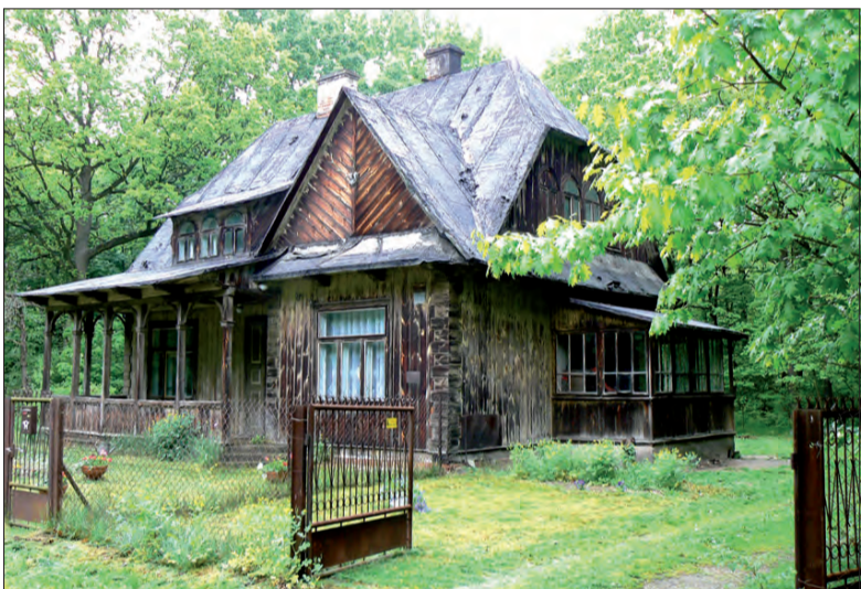
Nadleśniczy Mateja deklaruje, że jest przychylny przekazaniu budynku leśniczówki do skansenu w Maurzycach.

na drodze - nie zatrzymali się. Pojechalem zatem za nimi, by na miejscu spytać, co to za dokument. Nie doczekał się odpowiedzi - poinformowano go, że dokument przyjdzie pocztą. Nasz rozmówca twierdzi, że żaden dokument wymagający podpisania nigdy pocztą nie dotarł. Co wtedy podsuwano do podpisu starszej kobiecie?