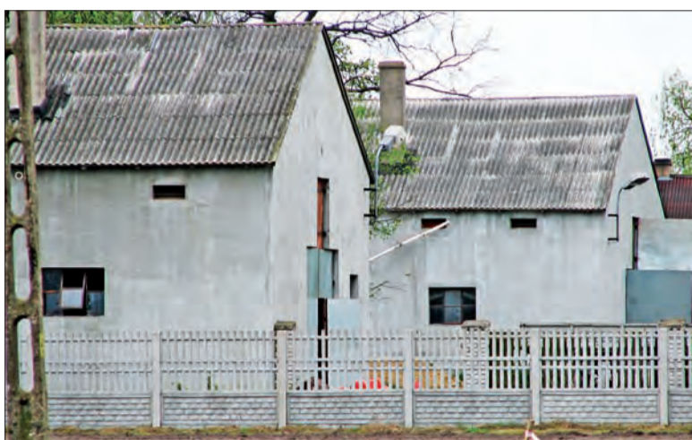
Dwa kurniki stoją kilkanaście metrów od drogi, ale widoczna na zdjęciu chorągiewka nie oznacza miejsca budowy trzeciego budynku.

Obydwie sąsiadujące z producentem drobiu rodziny utrzymują, że w czasie kiedy kurczaki dorastają, drogą obok kurników trudno jest przejść z uwagi na mocny zapach amoniaku. - Taki zapach jest co 6 tygodni, bo tyle trwa cykl chowu kurczaków i utrzymuje się trzy tygodnie przed ich pełną dojrzałością - mówi Mieczysław Żak.