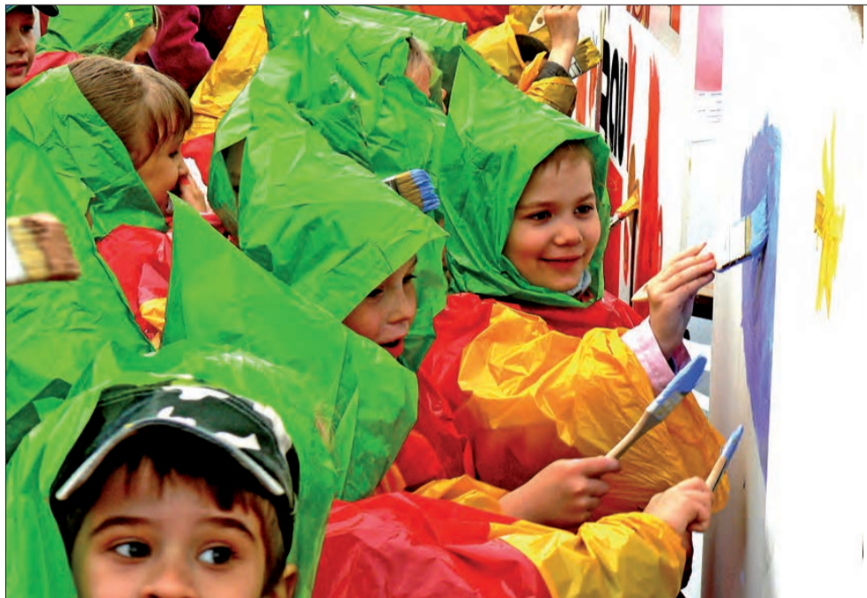
Włosy można było ubrudzić farbą nawet, gdy się miało kaptur na głowie. Przekonało się o tym wiele mam...

W Łowiczu gadżetów i certyfikatów trochę zabrakło i stąd u niektórych dzieci dodatkowe emocje. - Fajnie było, ale chłopaki mi się rozplakali, jak nie wystarczyło dla nich nagród i certyfikatów - powiedziała nam jedna z mam. Wiele dzieci jednak nie musiało ocierać łez, ale za to mamy musiały wycierać buzie z kolorowej farby. - Pelerynka okazała się za kiepskim zabezpieczeniem dla mojego urwisa.