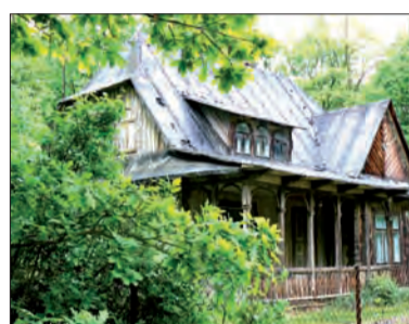
Nawet przy deszczowej pogodzie trudno się oprzeć urokowi leśniczówki.