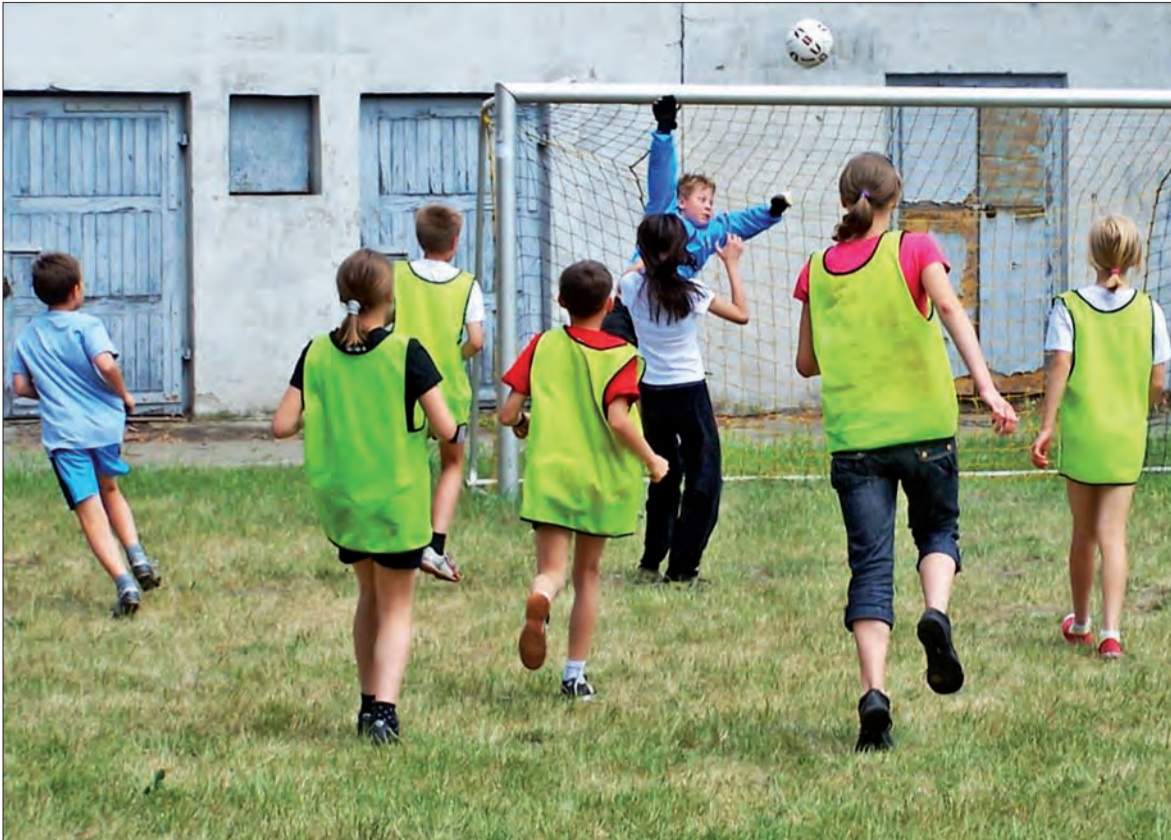
Emocji nie brakowało...