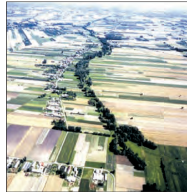
Lipnice z lotu ptaka.

Z okazji jubileuszu pochodzący z Lipnic Józef Tomala przygotował broszurę z historią wsi oraz miejscowej straży. Zamieścił w niej również nazwiska wszystkich wyróżnionych tego dnia druhow. Na okładce publikacji i w jej środku znalazły się też