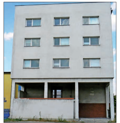
Ważą się losy tego budynku.

Od trzech tygodni pusto jest w budynku, który od lat na swoje potrzeby wynajmował Sąd Rejonowy w Łowiczu. W tej chwili czeka go gruntowny remont, którego zakres i koszty trudno na razie szacować, ponieważ nie jest jeszcze postanowione, jak obiekt zostanie wykorzystany.