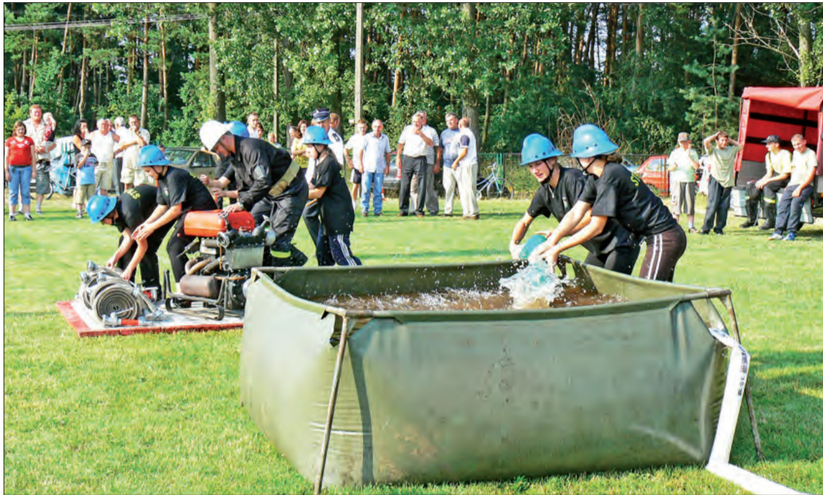
Tym razem w zawodach w gminie Nieborów wystartowały trzy dziewczęce drużyny MDP.

Poza drużynami startującymi w kategorii A, w zawodach brały udział Młodzieżowe Drużyny Pożarnicze - jedna chłopięca - z Nieborowa i trzy dziewczęce. Chłopięca drużyna nie miała więc rywali, zaś dziewczęta dzielnie walczyły o prymat najlepszej drużyny. Rywalizację tę wygrała MDP z Nieborowa, II była MDP z Bednar Kolonii, III - MDP z Mysłakowa. Nagrodami dla tych drużyn były piłki.