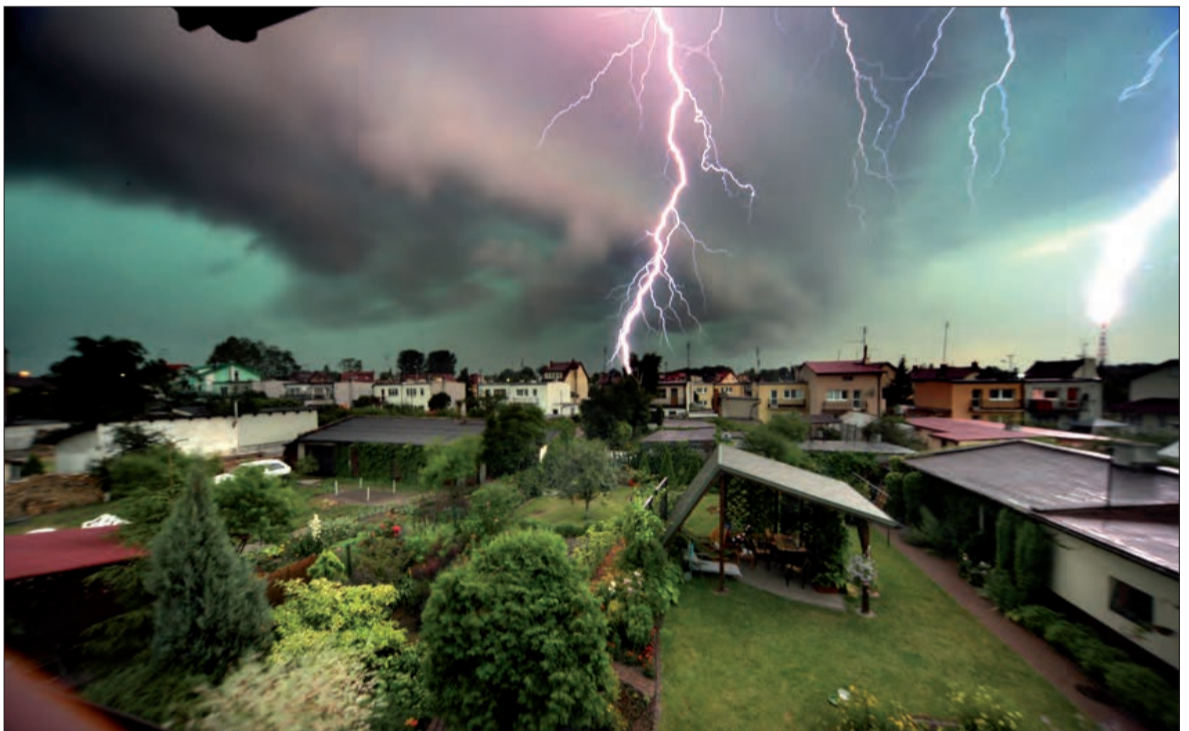
Niedziela 13 lipca około godz. 20. Niebo nad Łowiczem przysłaniają ciężkie, burzowe chmury. Widoczne dwa wyładowania atmosferyczne. fot. Krzysztof Surmacz.

Łowicka Straż Pożarna poza tymi pożarami odnotowała 24 zdarzenia związane z burzą. Najwięcej interwencji polegało na usuwaniu drzew stwarzających zagrożenie. Drzewa usuwano w Łyszkowicach, Bąkowie, Klewkowie, Kalenicach, Bełchowie, Stroniewicach, Bocheniu, Jezioroku, Brzozowie, Bednarach, Arkadii, Zdunach, Niedźwiadzie, Strugnicach, przy ul. Wiejskiej i Sobieskiego w Łowiczu. dok. na str. 3