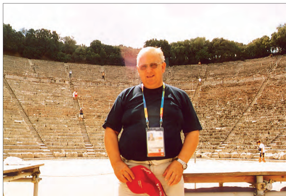
Na szczęście znalazł się też jeden dzień na wycieczkę poza Ateny. Mogłem więc podziwiać wspaniałą twierdzę w Napflio i słynny starożytny teatr w Epidavros.

kolei. Gwiazdą pierwszej wielkości, za którą praktycznie było długo, długo nic, była na tych igrzyskach w naszej ekipie Otylia Jędrzejczak.