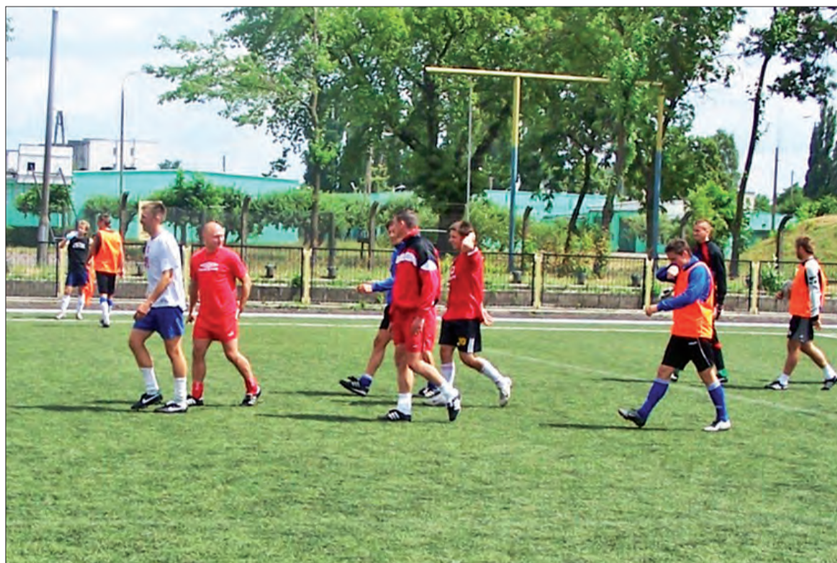
Zawodnicy Pelikana przygotowują się do występów w II lidze.

Piłka nożna - przygotowania KS Pelikan do rozgrywek II ligi