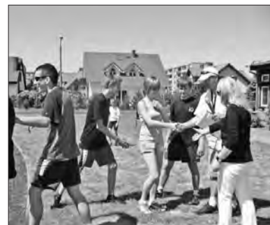
Uczniowie ZSZOI chętnie brali udział w poszczególnych zawodach.

■ UCZNIOWIE - NAUCZYCIELE 3:0 (25:17, 25:22, 25:18)