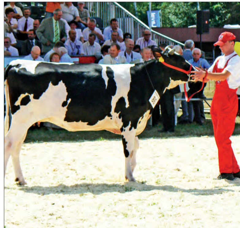
Mecka - championka w kategorii cielnych jałowic holsztyno - fryzyskich .

Najbardziej imponującym pokazem X Wojewódzkiej Wystawy Zwierząt Hodowlanych była prezentacja koni. W kategorii klaczy rasy małopolskiej cham-