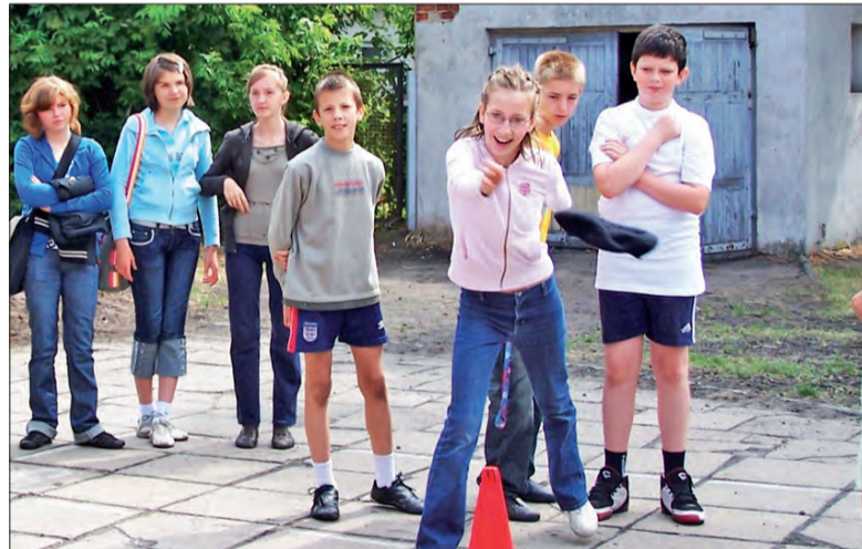
Rzut beretem to już tradycja w SP 4.

Po raz czwarty rozegrane zostały Mistrzostwa Szkoły w rzucie beretem. Do rywalizacji przystąpiło łącznie 54. uczennic i uczniów oraz jedenastościoro nauczycielek i nauczycieli, a rekord absolutny wciąż należy do K. Masztanowicza , który dwa lata temu uzyskał odległość 19,5 m. dok. na str. 30