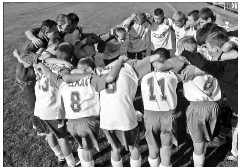
Atutem w ekipie Pelikana-94 jest dobra atmosfera.

Trener Wilk tak podsumował miniony sezon: Wynik z pewnością nie jest do końca satysfakcjonujący. Zawsze chciałoby się więcej, ale najważniejsze jest utrzymanie się w rozgrywkach wojewódzkich. Młodzi zawodnicy muszą mieć konfrontacje z silnymi zespołami. Tylko wtedy będą mogli podnieść swoje umiejętności. Spadek pozbawił by nas tej szansy na rozwój umiejętności piłkarskich. Od jesieni czeka nas nowy sezon, w którym chcemy powalczyć o lepszy wynik. czeka nas teraz dużo ciężkiej pracy. Mam nadzieję, że moi podopieczni poprawia swoje