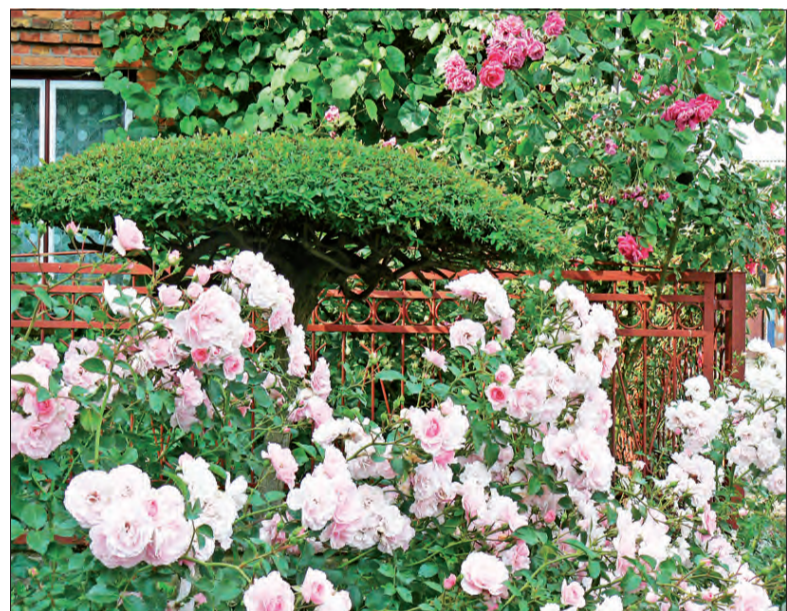
Widok róż zachwyca, jednak nie mniej urzekający jest ich zapach.

- wyjaśnia pani Jolanta. Jej miłość do róż obejmuje zarówno odmiany cięte, jak i rabatowe. - Im piękniejsze róże cięte, tym bardziej podatne na choroby. Róże rabatowe są bardziej odporne - mówi.