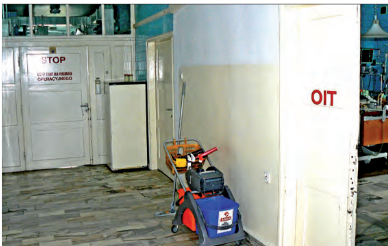
Wejście na blok operacyjny z Oddziału Intensywnej Terapii to jeden z problemów koniecznych do rozwiązania.

ny drogą, którą przybył na blok, wszystko w celu uniknięcia ewentualnego zakażenia. Nie działa system wentylacji, w czasie operacji na sali jest około 30 ° C, a wilgotność sięga 90% - mówi doktor Trepto.