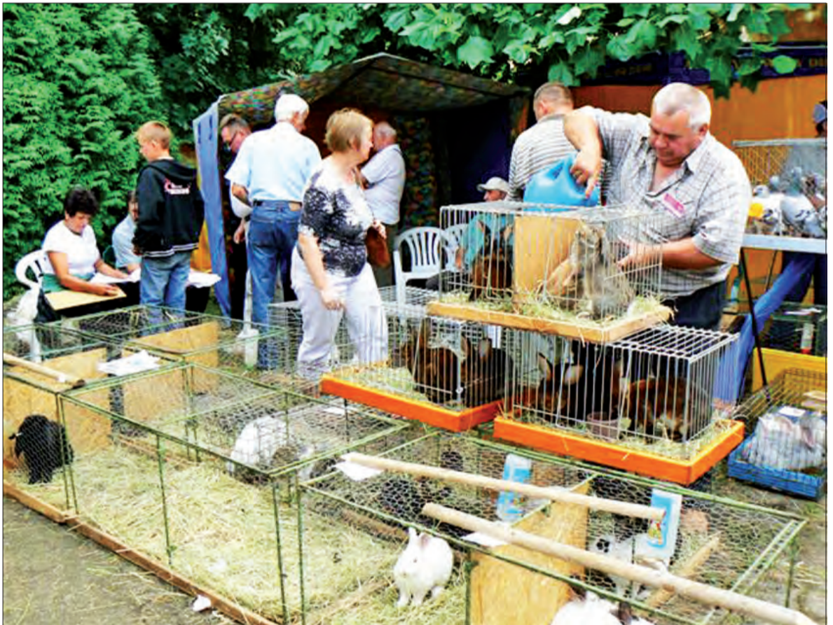
Stoiska z drobnymi zwierzętami, królikami, szynszylami i ptactwem ozdobnym były najchętniej odwiedzane przez rodziców z dziećmi.