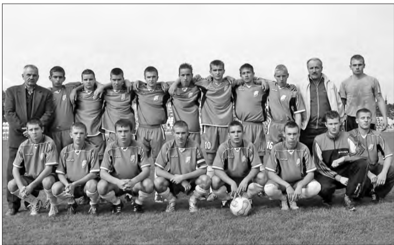
Skład juniorów starszych łowickiego Pelikana po rundzie jesiennej.

Łowiczanie zakończyli rozgrywki na przedostatniej pozycji, ponieważ z rozgrywek wycofał się Orzeł Łódź. Nasi juniorzy w 26. spotkaniach zdobyli osiem punktów, strzelając 22. bramki i tracąc 108. Na swoim boisku łowiczanie zdobyli pięć punktów, raz wygrywając, dwa razy remisując i dziesięć razy przegrywając. W tych meczach zdobyli