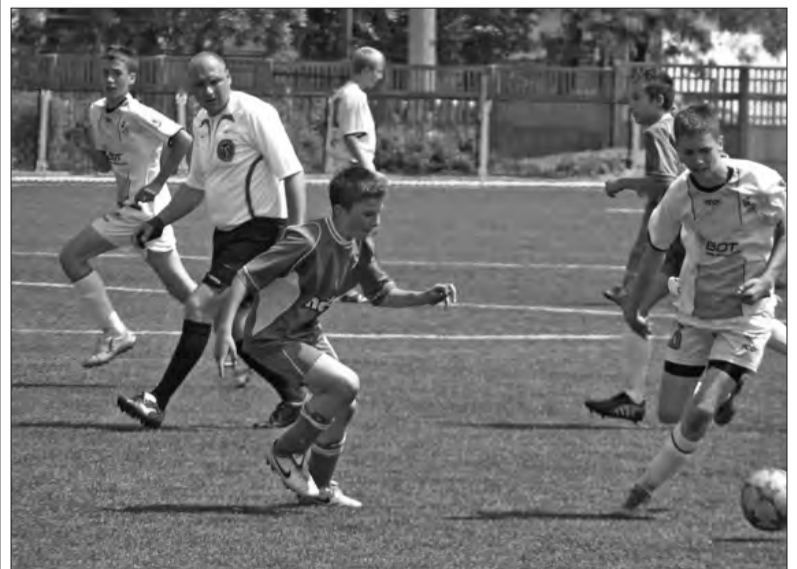
Ekipa Pelikana-94 utrzymała się w lidze wojewódzkiej, nie udało się ta sztuka ich kolegom z rocznika 1993 oraz 1989-90, ale w nowym sezonie w „centralnej” zagrają zespoły w ligach juniorów starszych (90-91) oraz młodszych (92).