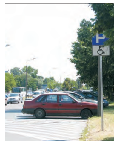
Oznakowanie parkingu dla osób niepełnosprawnych od strony ul. Sikorskiego.