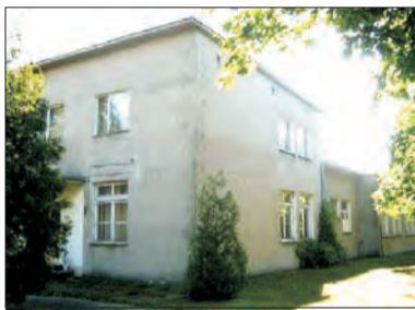
Kto będzie miał pomysł na wykorzystanie budynku w Kurabce?

Nie pierwszy już raz wraca w gminie Bolimów dyskusja nad przyszłością działki i budynku po byłej Szkole Podstawowej w Kurabce. Tym razem radni na sesji 8 lipca wyrazili zgodę na sprzedaż terenu. Nie oznacza to jednak, że zostanie on szybko sprzedany - gmina chce sprawdzić jakie będą oferty.