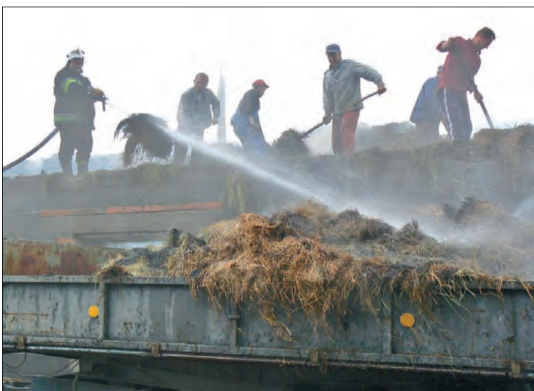
W poniedziałek od rana trwały prace przy usuwaniu i dogaszaniu słomy.