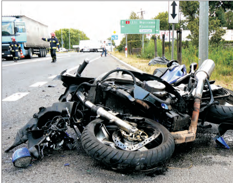
Rozbitý motocykl i łowiccy strażacy w tle - tak wyglądało miejsce tragicznego wypadku na ul. Poznańskiej.