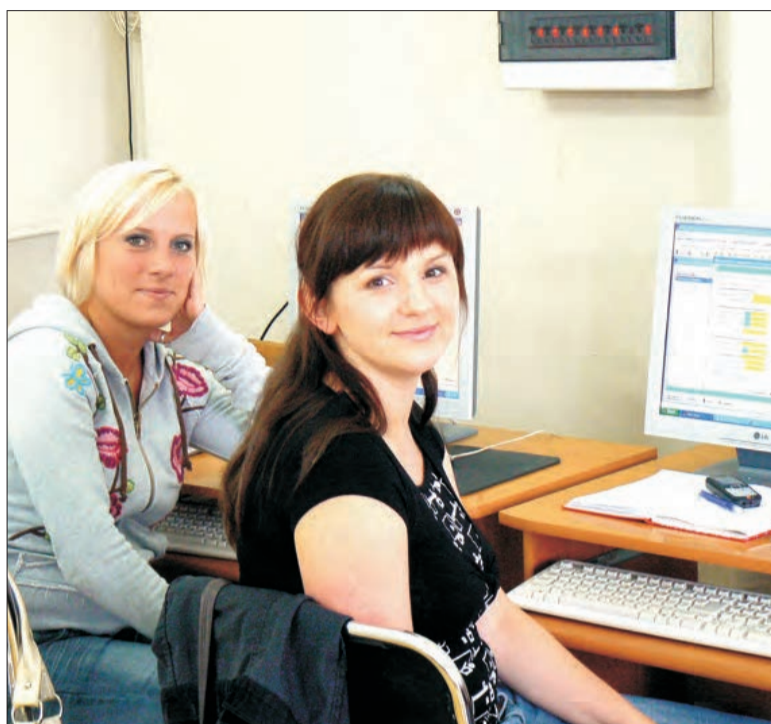
Kursantki liczą, że nowe umiejętności pomogą w znalezieniu pracy.

- Przerobiliśmy już tematy związane z zatrudnianiem pracownika (także niepełnosprawnego) tworzeniem list plac, ewidencją osobową i zasadami naliczania wynagrodzeń. Na pierwszych, teoretycznych, spotkaniach omawialiśmy też tematy związane z prawem pracy i przepisami BHP. Od kilku dni pracujemy z programem Płatnik - mówi prowadząca. Nie ma pewności, że w czasie miesięcznego kursu wszyscy uczestnicy zdążą się z nowymi programami oswoić i w pełni nauczyć się ich obsługi. Część z nich nie miała dotąd zbyt wiele do czynienia z komputerem. - Kurs się skończy, a potem nie będzie gdzie ćwiczyć - mówi uczestniczka - jeśli szybko nie znajdzie się okazja do wykorzystania tego, czego się nauczyliśmy, to wiele szczegółów natychmiast wyleci z głowy - dodają. Największe trudności sprawia konieczność bardzo precyzyjnego wprowadzania danych, poza tym Płatnik pracuje tylko na danych rzeczywistych, czasem trzeba kilka razy „strzelać” wpisując numery PESEL czy NIP, albo