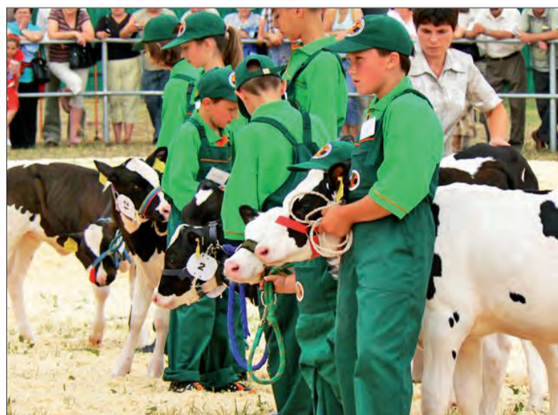
W kategorii dodatkowej oceniano cielaczki . Przychylna młodym hodowcom komisja przyznała wszystkim maluchom puchary i odznaczenia .

niż w latach minionych standardy i ostrzejszą rywalizację o championaty . Trudno się dziwić, że w starciu z mistrzami z kraju , hodowcy z naszego regionu wielu laurów nie zdobyli, ale już województwo łódzkie traktowane jako całość wśród championów mia-