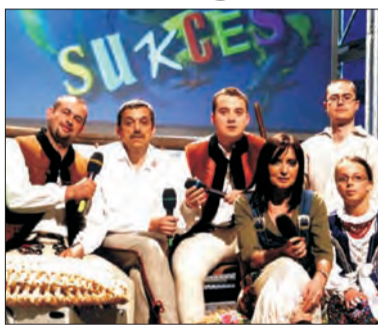
Krywań to jeden z najbardziej popularnych zespołów folkowych w Polsce, na zdjęciu jako jurorzy w telewizyjnej „Szansie na Sukces”.

Krywań jest na polskiej scenie folkowej uznawany za prekursora muzyki stylizowa-