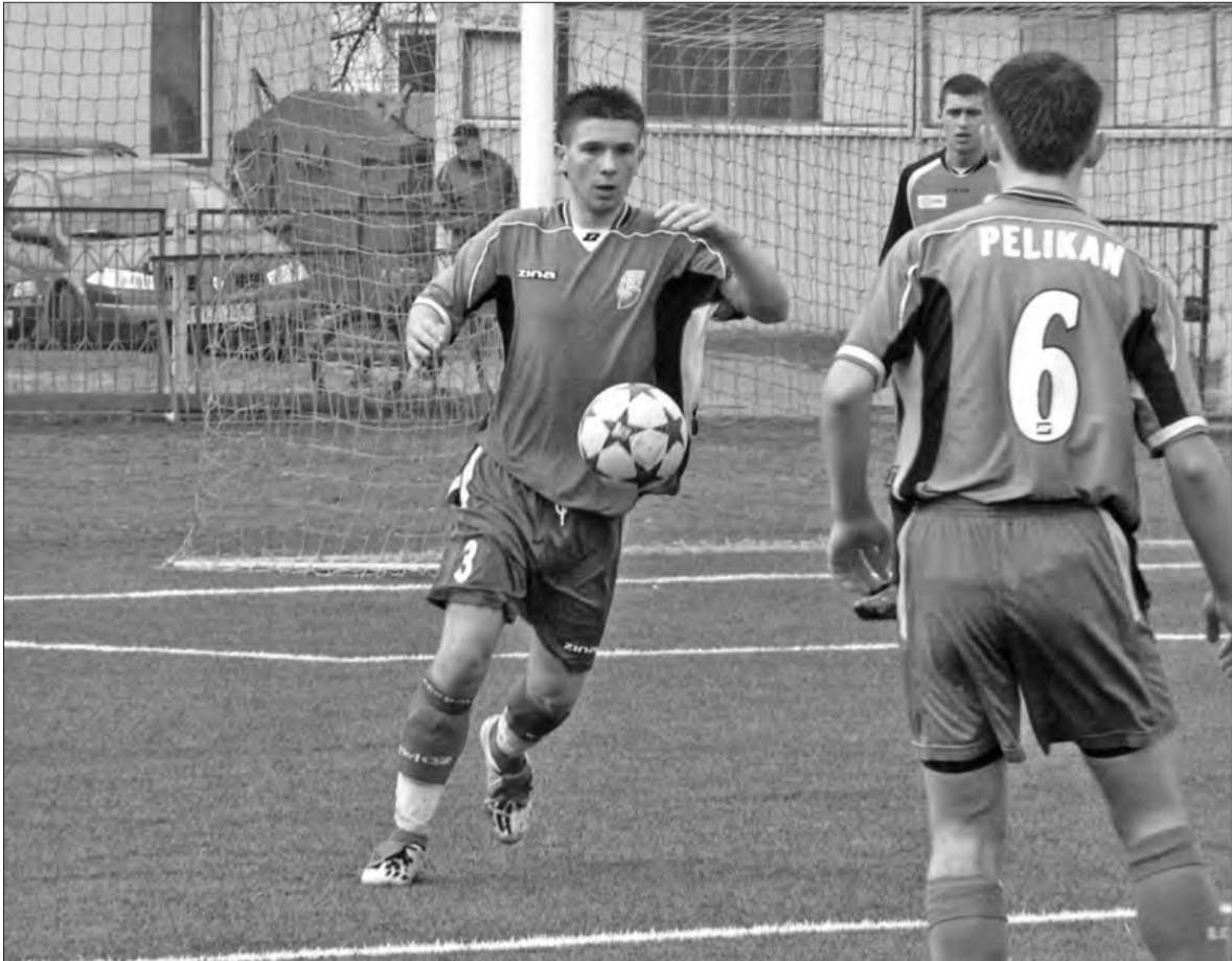
Wprowadzony przez PZPN nakaz gry w nowej II lidze dwóch młodzieżowców (rocznik 1998 i młodszy) otwiera sporą szansę dla młodych piłkarzy.

Piłka nożna - podsumowanie sezonu 2007/2008 Pelikana w wojewódzkiej lidze juniorów starszych