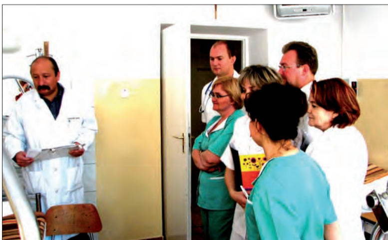
Mimo warunków lokalowych i możliwości finansowych, wszystkie oddziały szpitala pracują swoim trybem.