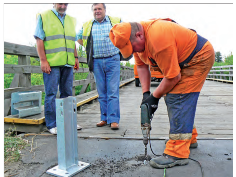
Znaki drogowe postawiono w poniedziałek, jednak główne prace na moście ruszyły we wtorek 15 lipca.

Nie jest to rzecz jasna rozwiązanie docelowe. - Tak jednak będzie do czasu wypracowania jakiejś koncepcji przebudowy - informuje członek zarządu. Jak mówi, jakkolwiek remont istniejącego mostu w ogó-