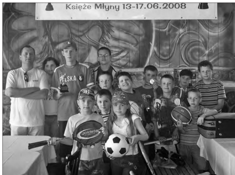
Szachiści UKS Pałacu wywalczyli sporo nagród.