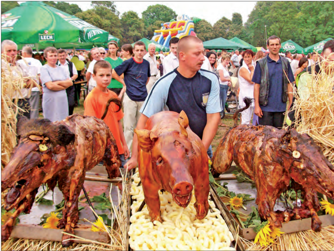
Dwa upieczone dziki i jeden prosiak wjechały na imprezę na wozie konnym, przybranym słomą i kwiatami.