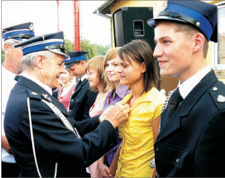
Lipnicka młodzież otrzymała odznaczenia za wysługę lat w OSP, która trwa 5 i 10 lat.