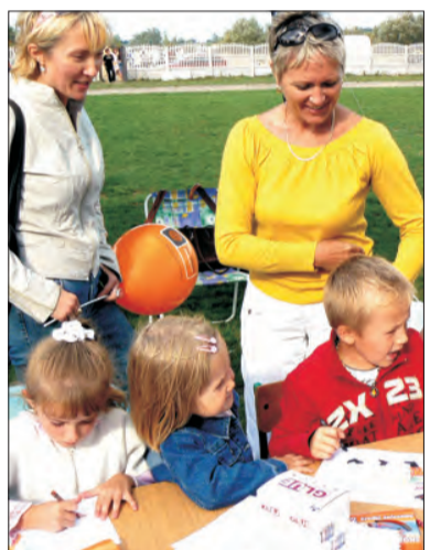
Organizacją konkursów dla najmłodszych zajęły się przedszkola. Dzieci chętnie uczestniczyły w zabawie.

Konkurencje nie były wcale łatwe. Tak naprawdę zadania stawiane przed zawodnikami, przetestowały dokładnie ich przydatność do roli gospodarza, małżonka, prawdziwego mężczyzny czy prawdziwej gospodyni. A emocji, śmiechu i zażartej rywalizacji na bielańskim boisku nie brakowało. Pokazało się też jak wielką rolę ma doping ze strony publiczności. Zawodnicy z Soboty, którzy w niektórych konkurencjach mieli słabszy doping - na przykład w zręcznościowej „Chłop ciska a mu tryska” w końcowej klasyfikacji zajęli ostatnie miejsce.