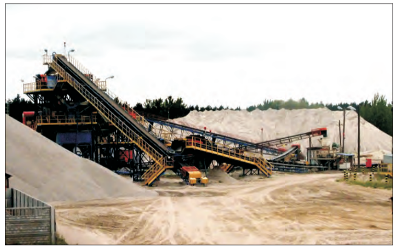
Wydobycie żwiru w kopalni „Rydwan” w Guźni ciągle trwa.