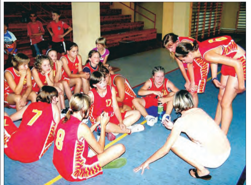
Mecz z Basketem Janikowo zakończył się rzadko spotykanym w koszykówce remisem.

Koszykówka - kadetki i młodziczki UMKS Książak Łowicz