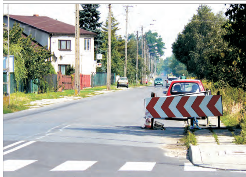
Wyrwa na ul. Chełmońskiego została tylko zabezpieczona barierką i czeka na załatwienie już 3 miesiące.