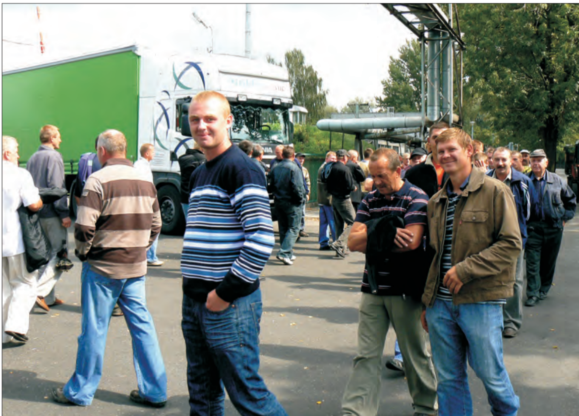
Przyjazne uśmiechy świadczyły o pokojowym charakterze pikiety.

Blokowane są zakłady w całej Polsce: Steinhauser w Warce, Dinter Polska w Kozietulach Nowych (Mazowieckie). W poniedziałek blokady sadowników pojawiły się przed zakładami Binder w Tarczynie (Mazowieckie) oraz w Górze Kalwarii. W woj. lubelskim protest trwa przed dwiema firmami: Appol w Opolu Lubelskim i Sokpol w Zagłobie. Ponadto rolnicy protestują przed zakładami Hortex Holding S.A. w Skierniewicach.