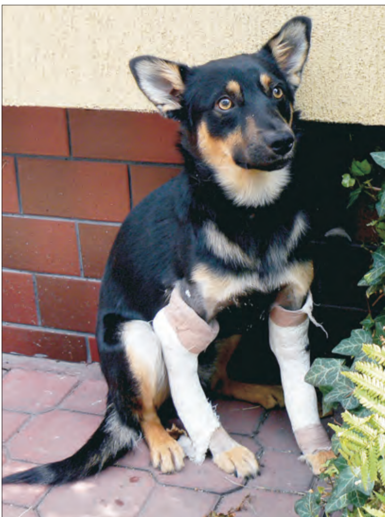
Kangur pod opieką pracowników lecznicy szybko wraca do zdrowia. Czy znajdzie się ktoś, kto zechce go przygarnąć?

Nie wiadomo jak długo zraniony pies przebywał jeszcze w tej wsi. Jego losem zainteresował się 10-latek przebywający z rodzicami u babci na wakacjach. On i jego rodzice chcieli psu pomóc, ale również oni nie mogli się nim zaopeczkować na stałe. - Dziwne było to, że pies był wesoły i pozytywnie nastawiony do ludzi. Wszystko wskazywało na to, że ktoś mu zrobił krzywdę, a zwierzęta takie potrafią być nieufne, a nawet agresywne - mówi mama chłopca.