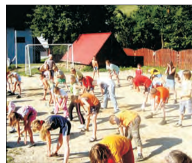
Coś dla ducha, ale i dla ciała. Uczniowie klas podstawowych podczas zaprawy gimnastycznej.

Krótko po powrocie podstawówkowiczów, w to samo miejsce w dniach 19 - 30 lipca pojechali gimnazjaliści. Dla nich, jak co roku był to wyjazd integracyjny. Chodziło w nim o to, aby pierwszoklasiści, którzy od września wspólnie rozpoczynają naukę poznali się, zasymilowali i wdrożyli do specyfiki pijarskiego nauczania. W wyjeździe udział wzięło 51 uczniów, oraz szóstka animatorów ze starszych klas gimnazjum.