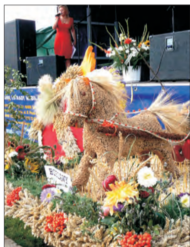
Turniej połączony był z gminnymi dożynkami. Pod sceną oglądać można było okazałe wieńce dożynkowe.

związaniu dziesięciu konkurencji pierwsze miejsce z liczbą 124 punktów zajęła Wojewodza. Reszta została daleko w tyle: na miejscu drugim z liczbą punktów 90 uplasowały się Trzaskowice, miejsce trzecie - 87 punktów - zdobył Chruślina.