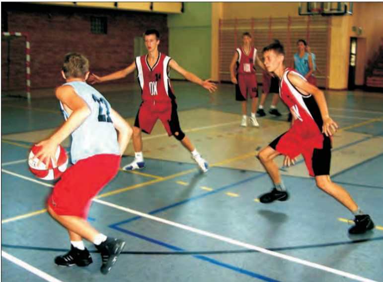
Miłą odmianą w treningach były mecze kontrolne.