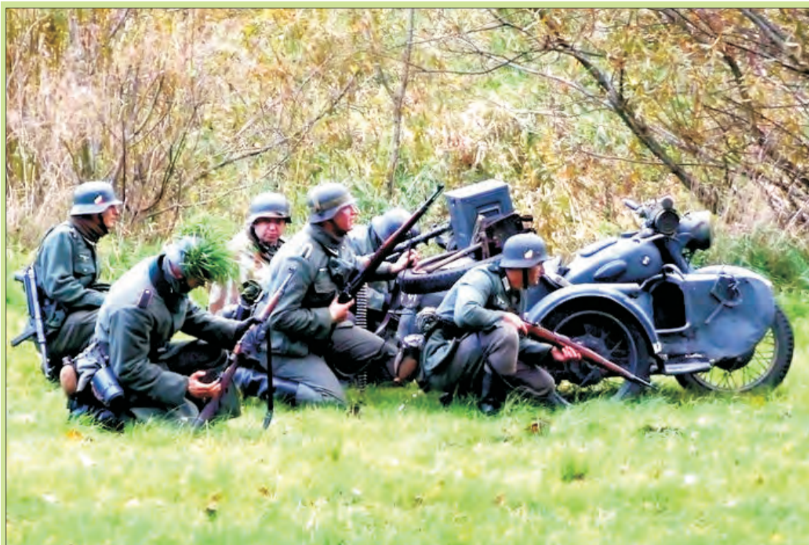
Pod koniec września po raz drugi zobaczymy inscenizację walk o Łowicz w wykonaniu grup rekonstrukcyjnych.