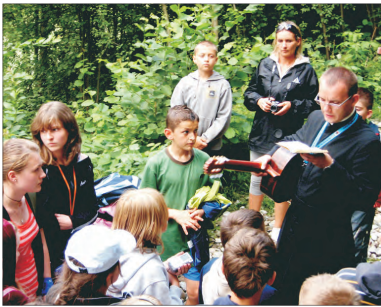
Modlitwa i wspólny śpiew na tonie natury pozostawiają niezapomniane wrażenia.

Kolonie szkół pijarskich to jednak nie sama rozrywka. Codziennie poranek rozpoczynano modlitwą, tak samo było też wieczorem. Program duchowy wyjazdu oparty został na dekalogu. Uczniowie oglądali filmy, studiowali materiały, spotykali się w grupach, omawiając poznane treści, słuchając pogadanki. Kierownik kolonii