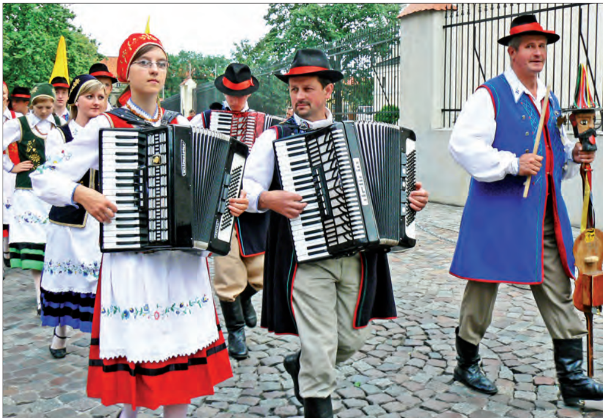
Po godzinie 14.00 barwny korowód wyruszył ze Starego Rynku na łowickie Błonia. Kaszubi widoczni w nim byli dzięki charakterystycznym strojom i instrumentarium.

Na Błoniach publiczność bawiła się przy dwóch scenach. W muszli koncertowej podziwiać mogliśmy występy grup folklorystycznych, m.in. Kaszubskiego Zespołu Pieśni i Tańca „Sierakowice” z powiatu kartuskiego, zespołu młodzieżowo - dzie-