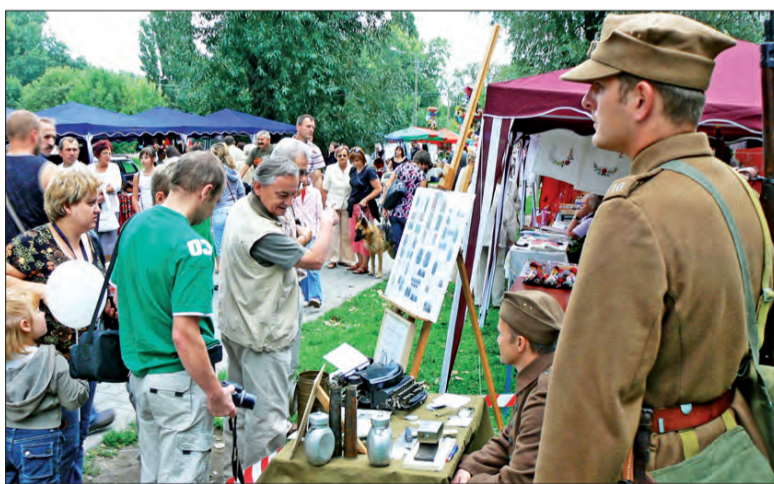
Łowicka grupa rekonstrukcyjna przybliżyła publiczności wygląd i wyposażenie przedwojennego 10 Pułku Piechoty.