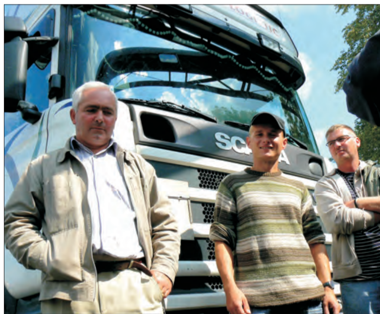
Sadownicy nie wypuścili z zakładu Tira z koncentratem jabłkowym.