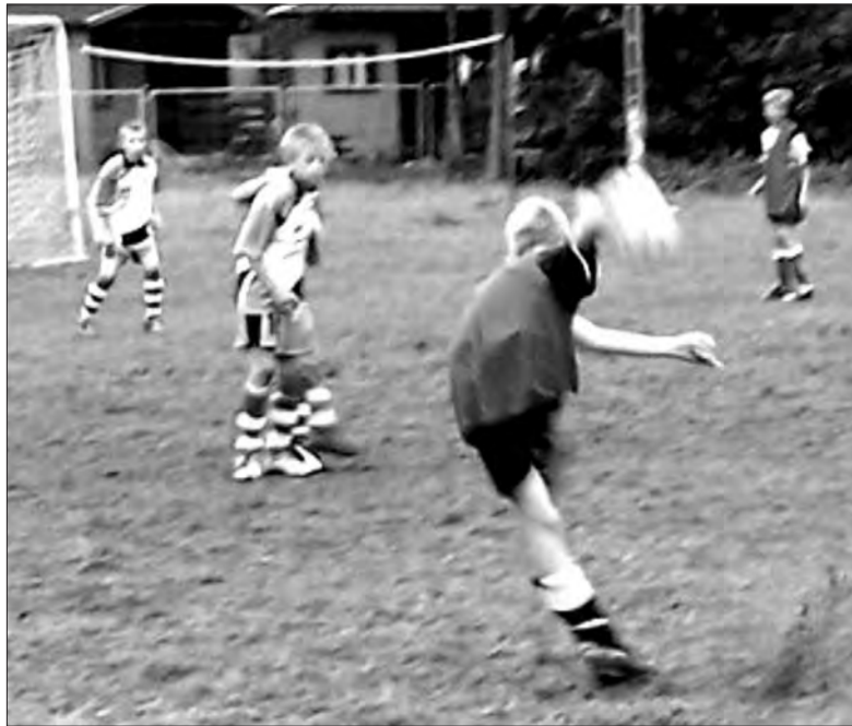
Ekipa łowiczanie Pelikana z rocznika 1996 rozegrała w Nowećinie cykl meczów kontrolnych.