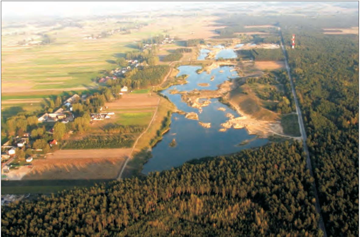
Może niedługo w Dąbkowicach Górnych powstanie strzeżone kąpielisko. Jak widać teren jest bardzo atrakcyjny.

Obszar przeznaczony do sprzedaży to ok. 46 ha zalesionego terenu ze zbiornikiem wodnym - będącego obecnie własnością Kosminu. W tym mniejsza część, ok. 13 ha jest już gotowa do sprzedaży, pozostała część, 33 ha, jest po rekultywacji i po pozytywnej decyzji Okręgowego Urzędu Górnictwa w Kielcach, stwierdzającej, że teren ten został zrehabilitowany. W chwili obecnej trwa zbieranie i uzgadniania dokumentacji. - Kiedy kupowaliśmy tę ziemię od rolników, w dokumentach było to zapisane jako rola i ciągle taki zapis istnieje. A przecież po naszym przemysłowym użyt-