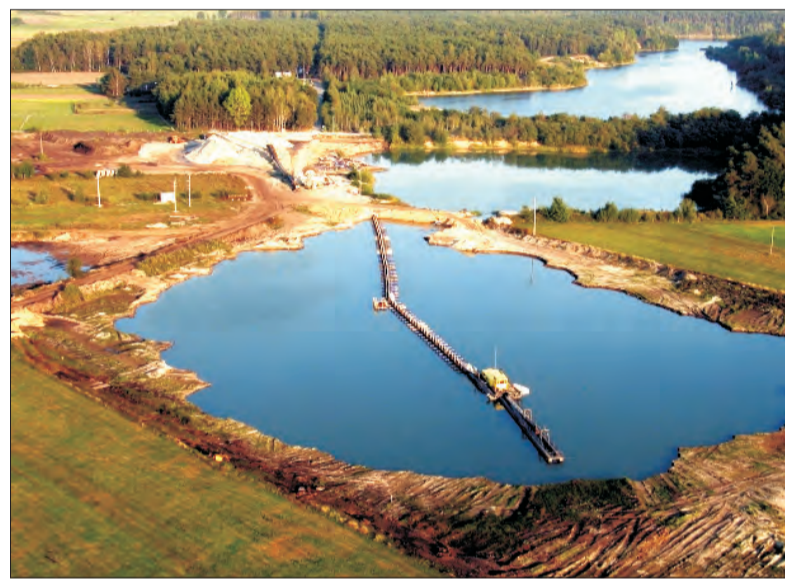
Tak wygląda działalność kopalni „Rydwan” z lotu ptaka.