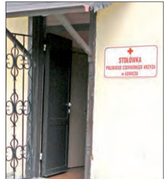
Wejście do stołówki PCK przy ul. 3 Maja.

7 tys. zł PCK otrzymał z Regionalnego Centrum Polityki Społecznej Urzędu Marszałkowskiego w Łodzi. Te pieniądze organizacja ma wykorzystać na prowadzenie, w okresie od października do grudnia, akcji polegającej na rozdawaniu raz w tygodniu paczek żywnościowych dla rodzin wielodzietnych oraz osób w trudnej sytuacji finan-