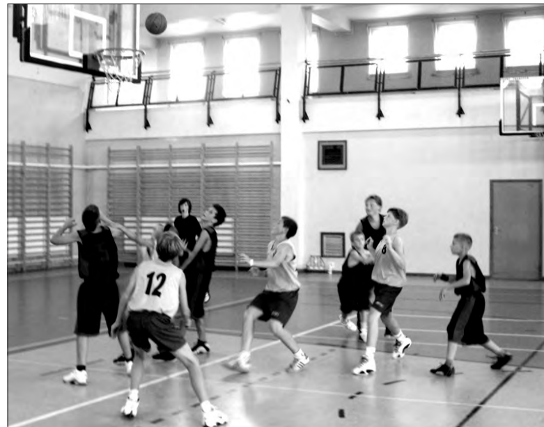
Po dobrym początku łowiczanie jednak przegrali z MKS Wodzisław Śląski.

Koszykówka - młodzicy UMKS Książek Łowicz