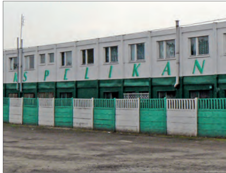
Działacze Pelikana liczą, że to już miasto zmodernizuje ten budynek, jako swój własny