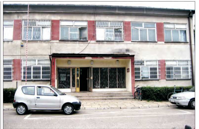
Niebawem wejście główne i cały budynek Urzędu Gminy w Bielawach wypięknije.

Co miesiąc kupowane są książki do Gminnej Biblioteki Publicznej w Domaniewicach. Z budżetu gminy przeznaczono w tym roku na ich zakup około 14 tys. zł. Biblioteka wnioskuje też do Ministerstwa Kultury o dotację w wysokości 9 tys. zł na ten cel. Kupowane są nowości do wszystkich działów bibliotecznych. Jeżeli biblioteka otrzyma dotację z ministerstwa w tym roku wzbogaciłaby się o 600 - 700 nowych książek. (eb)