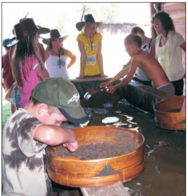
Płukanie złota to zabawa, która możliwa jest tylko w Krainie Westernu.