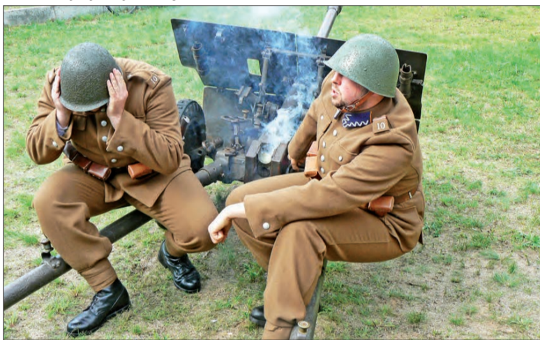
Biesiadę otworzyła łowicka grupa rekonstrukcji historycznych, salwą z działa, które przed wojną znajdowało się w wyposażeniu 10 Pułku Piechoty.