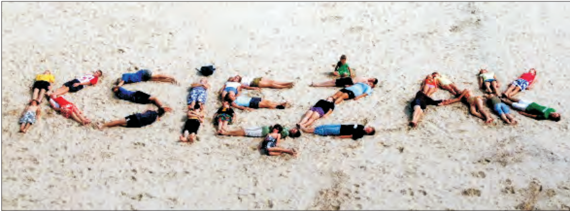
Na ruchomych wydmych w Słowińskim Parku Narodowym zawodniczki i zawodnicy UMKS Książak stworzyli napis z własnych ciał.

Koszykówka - przygotowania UMKS Książak do sezonu 2008/09