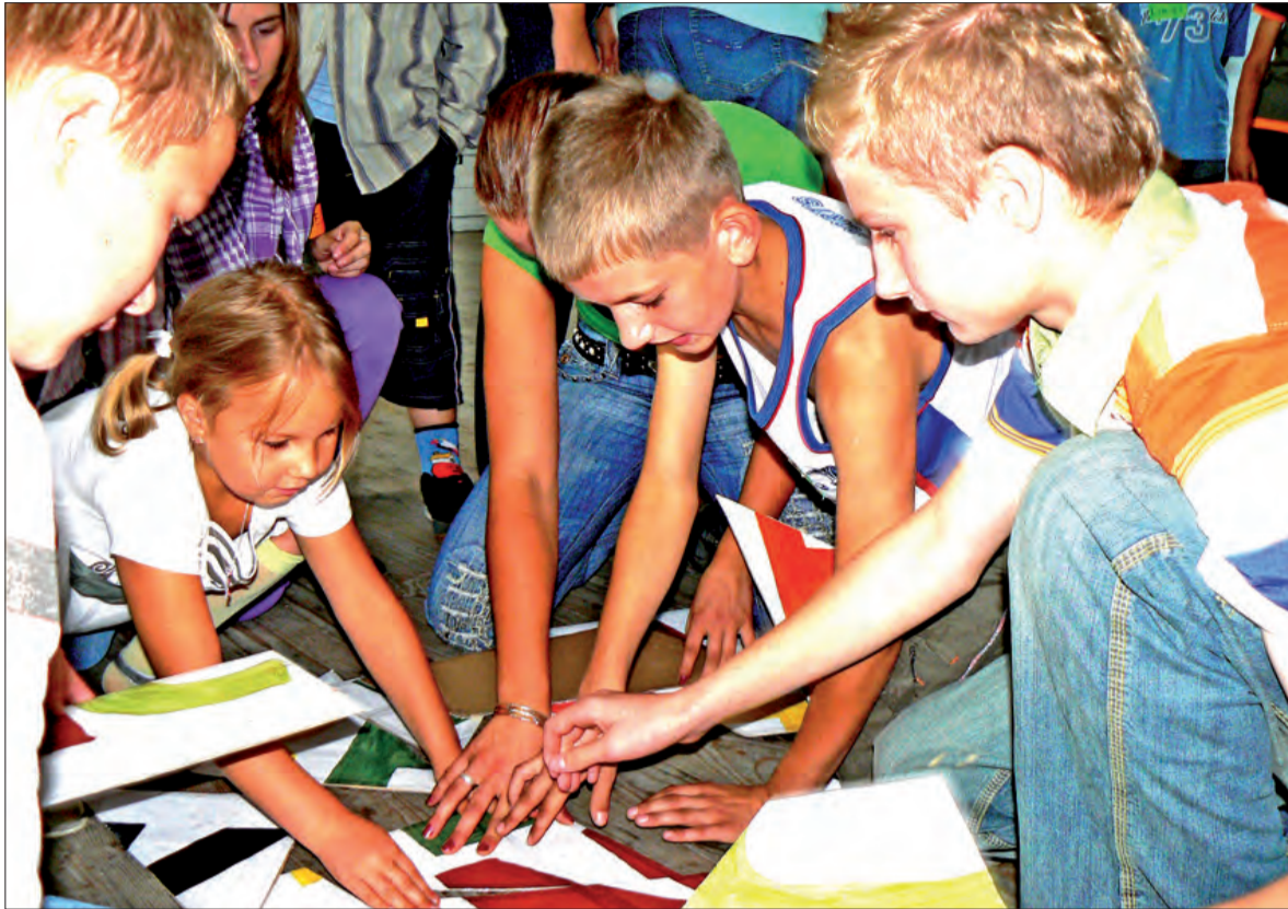
W Urzeczcu dzieci ściagały się na czas w układaniu puzzli.