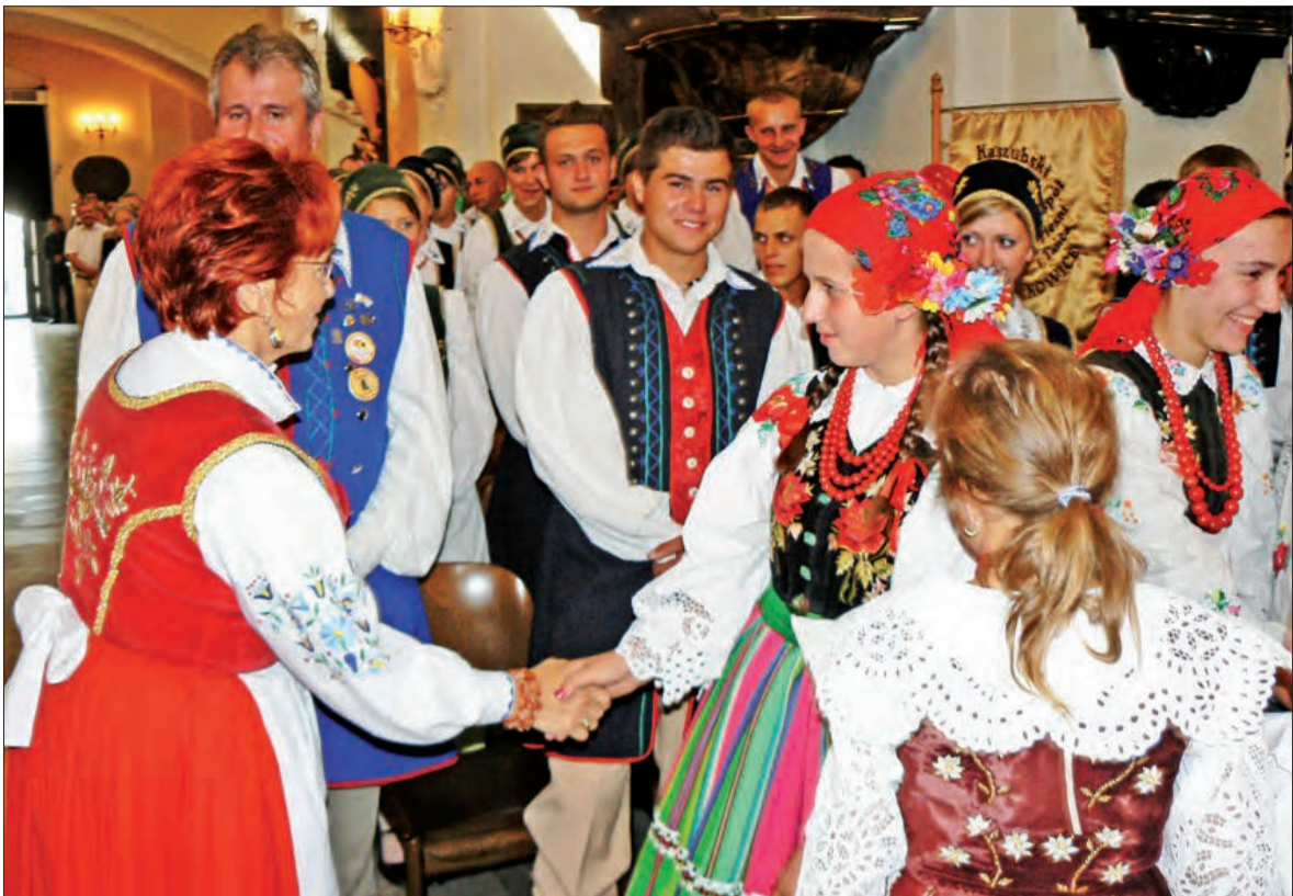
Łowiczanie i kaszubi: podczas przekazywania znaku pokoju w łowickiej katedrze zrobiono się naprawdę kolorowo.

Na biesiadzie stoisk gminnych kół gospodyń było więcej, podobnie jak stoisk twórczyni ludowych. Panie z gminy Kocierzew miały jednak w swym gronie mały ciałem, za to wielki uczuciem atut: najmłodszego