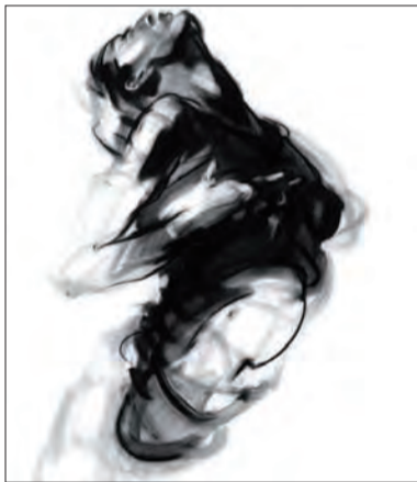
Jeden z rysunków, które można oglądać w Domku Ogrodnika

Obecnie prezentowane prace wykonane są węglem na papierze (100 x 70 cm). Technice tej Biernacki jest wierny od studiów w Akademii Sztuk Pięknych w Warszawie, podobnie jak tematyka (w większości są to interpretacje figury ludzkiej) wskazują na wierność metodzie zapoczątkowa-