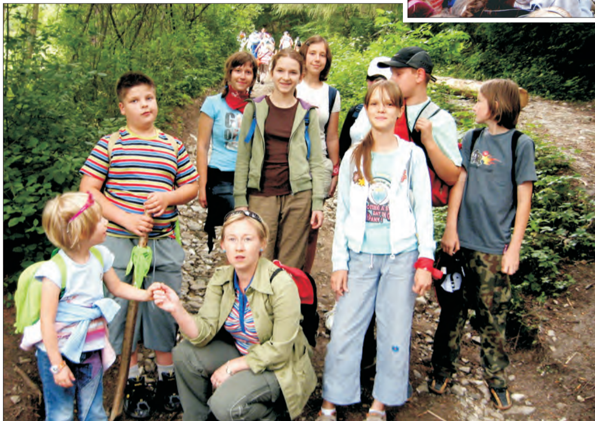
Wspólne wycieczki w góry podstawówkowiczów były okazją do wykonywania pamiątkowych fotografii.

dze, tradycyjnie, dzięki współpracy, otrzymując dofinansowanie ze Stowarzyszenia Parafiada.