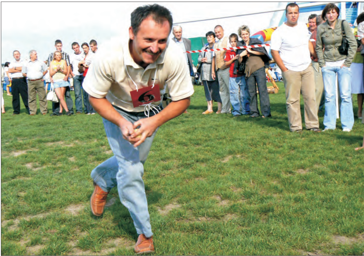
Zawodnik z Soboty nie zawsze trafił obranym ziemniakiem do wiadra. A gdy nie trafił, musiał pobiec i naprawić błąd.