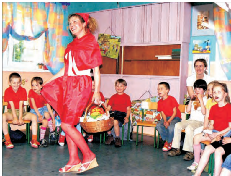
W Szkole Podstawowej nr 1 w Łowiczu może zabraknąć miejsca dla 6-latków. Na zdjęciu przedstawienie Czerwony Kapturek w wykonaniu mam w odziale „0”.

cesy w późniejszych latach opierają się na dobrym opanowaniu czytania i pisanie w najmłodszych klasach. Czytanie ze zrozumieniem pomaga potem bardzo w nauce. Ćwiczenie czyni mistrzem, a jeśli wcześniej je rozpoczną, tym lepiej.