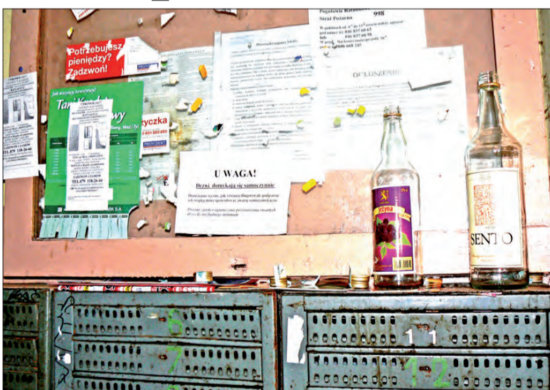
Bar jak się patrzy, tylko szkoda, że nie w prywatnym mieszkaniu, a na publicznej klatce schodowej

Reporter NL był na miejscu we wtorek rano. Już przy wejściu do klatki można zauważyć butelki po winach w niewysokim żywopłocie przy ławce. Po przekroczeniu progu klatki schodowej na skrzynkach pocztowych ustawione, jak na barze, butelki po alkoholu. Zapach, cóż - po prostu czuć mocznik. Po chwili krzątania się przy rowerze zza drzwi prowadzących do piwnicy wyszedł mieszkaniec tejże klatki, od którego czuć było wyraźnie woń alkoholu. Zaprzeczał, jakoby na klatce odbywały się głośne libacje alkoholowe. Błuznierstwami próbowała pozbyć się reporterka kobieta pokrzykująca zza drzwi prowadzących do piwnicy.