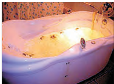
Gabinet balneologiczny, a w nim kąpiele perełkowe, inhalacje olejkami czy wodami mineralnymi... brzmi zachęcająco.

Specjaliści przeprowadzili już badania geologiczne według, których w Kominie pod Łowiczem na głębokości 2 tys. metrów płynie woda o temperaturze 80 st. C, a na głębokości 4 tys. metrów, 120 st. C. Czy podłowickie źródła termalne zostaną wykorzystane i dojdzie do budowy systemu geo-