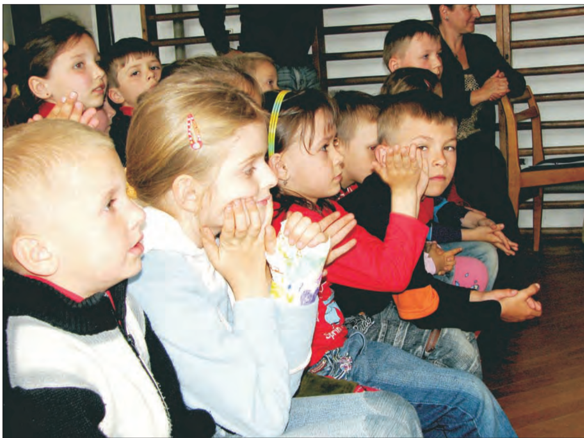
Dzieci z oddziału „0” SP w Gągolinie Płd. w gm. Kocierzew w niewielkiej szkole mają dobre warunki. Czy również dobrze będą mieć 6-letni uczniowie klas pierwszych w dużych szkołach? Czas pokaże.

naukę rozpoczynają 6-latkami. Młodsze dzieci łatwiej zmotywować do nauki, a na decyzję o roku wprowadzania reformy wpłynęły przesłanki demograficzne. Skłaniają one do szukania rozwiązań, które pozwolą na lepsze wykorzystanie bazy szkół i przedszkoli, a także utrzymanie etatów nauczycieli.