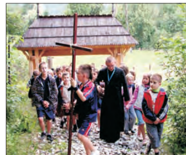
Wyjazdy ze szkół pijarskich to nie tylko wypoczynek i zabawa, ale również modlitewne rozważania. Górskie szlaki przemierzano z krzyżem na czele.