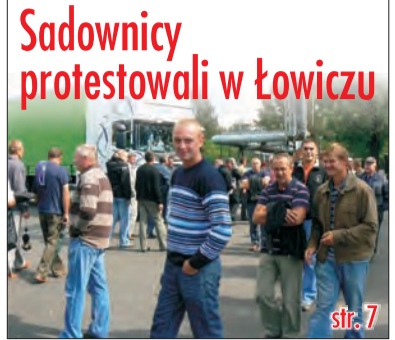
Sadownicy protestowali w Łowiczu