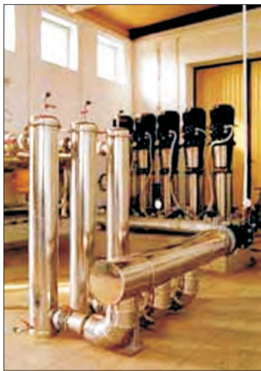
Na blok geotermalny składają się odwierty produkcyjne i reinkcyjny oraz wymienniki ciepła, filtry i system tłoczenia między otworami.

termalnego na razie nie wiadomo. Miejmy nadzieję, że we wrześniu coś się w tej sprawie ruszy do przodu.