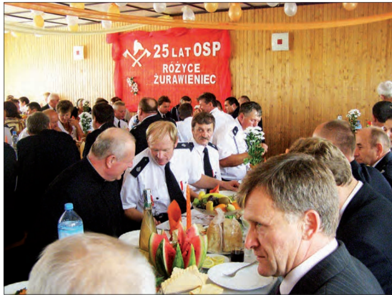
Nieodłącznym elementem jubileuszy strażackich jest przyjęcie. W Różycach Żurawieńcu przygotowały je mieszkanki tej wsi.

W latach 2001-2002 w remizie wiele się zmieniło. Zamontowano drzwi do wejścia awaryjnego, balustradę na schodach awaryj-