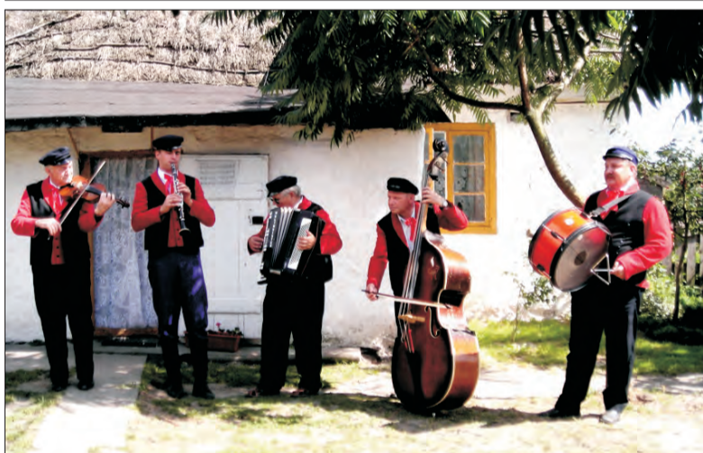
Sannicka kapela ludowa podczas nagrania w Lwówku.