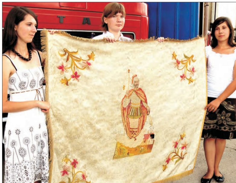
Dziewczęcy narybek OSP w Złakowie Kościelnym nawet nie zdaje sobie sprawy jaki skarb prezentuje. Pierwszy sztandar jednostki oglądać można tylko przy specjalnych okazjach.