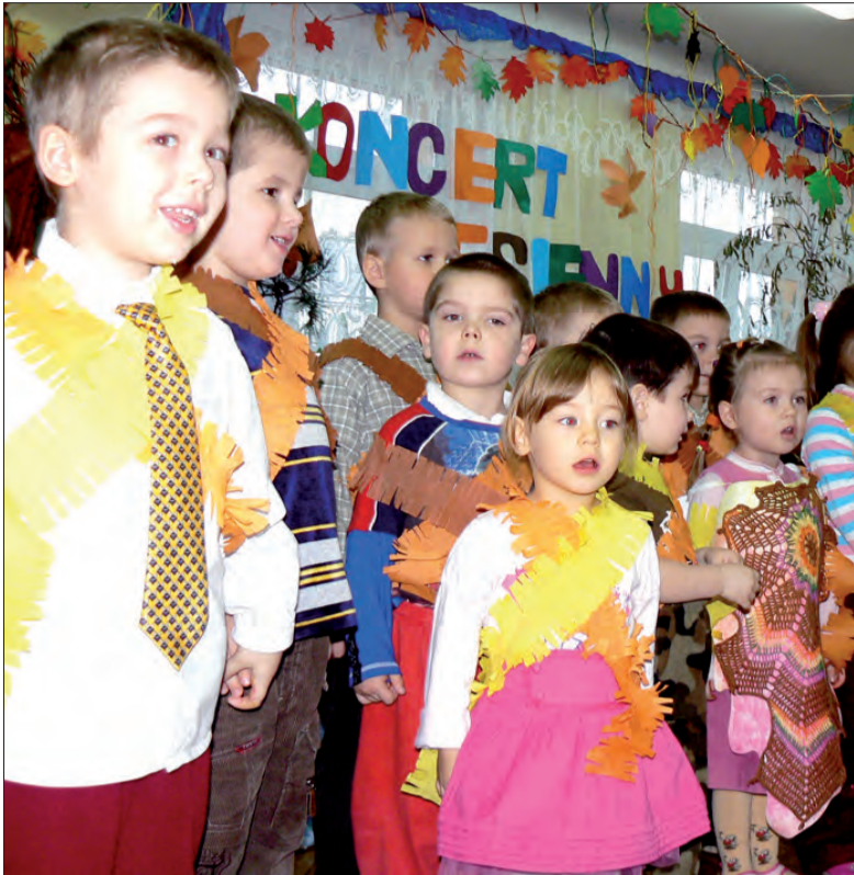
Przedsiębiorcy z najmłodszej grupy trzy- i czterolatków Przedszkola nr 3 zaśpiewali m.in. piosenkę o jesieni.