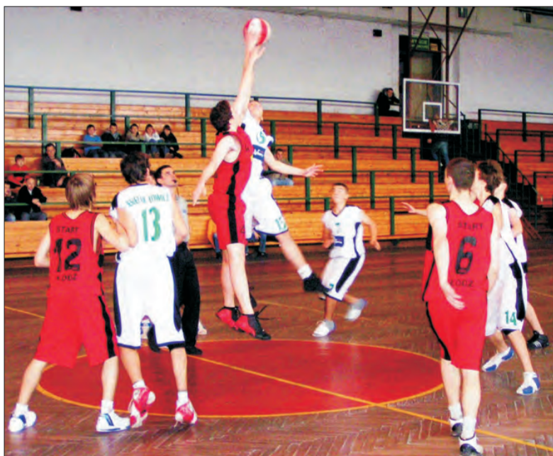
W pojedynku ze Startem II Księżak wygrał po raz piąty w tym sezonie.

Teraz łowiczanie mają wolny termin, a w środę 3 grudnia zagrają w Łowiczu z Salosem, gdzie będą zdecydowanym faworytem.