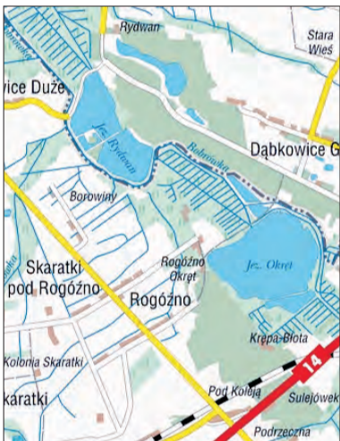
Położone obok siebie zbiorniki Okręt i Rydwan znajdują się na terenie Gminy Domaniewice.

Odłowy na Okręcie rozpoczęły się 26 października i zakończyły się w pierwszych dniach listopada. Na położonym obok zbiorniku Rydwan nadal trwają. W jego wo-