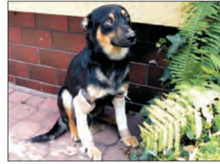
Tak wyglądał Kangur jeszcze podczas leczenia.