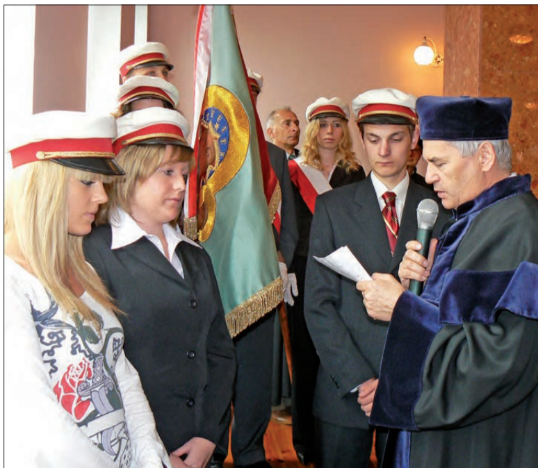
Coraz mniej licznie studenckie czapki prezentują się na kolejnych inauguracjach roku akademickiego w MWSH-P.

bie dziennym, jak i zaocznym, pedagogika opiekuńczo-wychowawcza i doradztwo zawodowe również w trybie dziennym i zaocznym, pedagogika resocjalizacyjna i terapia pedagogiczna także w obu trybach,