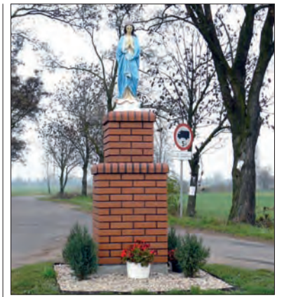
Nowa budowla sakralna jest solidniejsza, bo wykonana z cegły klinkierowej.

W ciągu 15 lat funkcjonowania wyższej uczelni w Łowiczu, wykształciła ona ponad 10 tys. studentów. Rok 2008/2009 to 16. rok funkcjonowania tej szkoły wyższej w Łowiczu. Uczelnia musi szukać nowych, atrakcyjnych propozycji na przyszłość, by najbliższe lata nie były dla niej jedynymi z ostatnich. (eb)