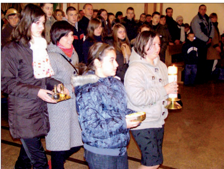
Młodzież z KSM w procesji z darami, podczas uroczystej mszy św. w kościele Matki Bożej Nieustającej Pomocy w Łowiczu.