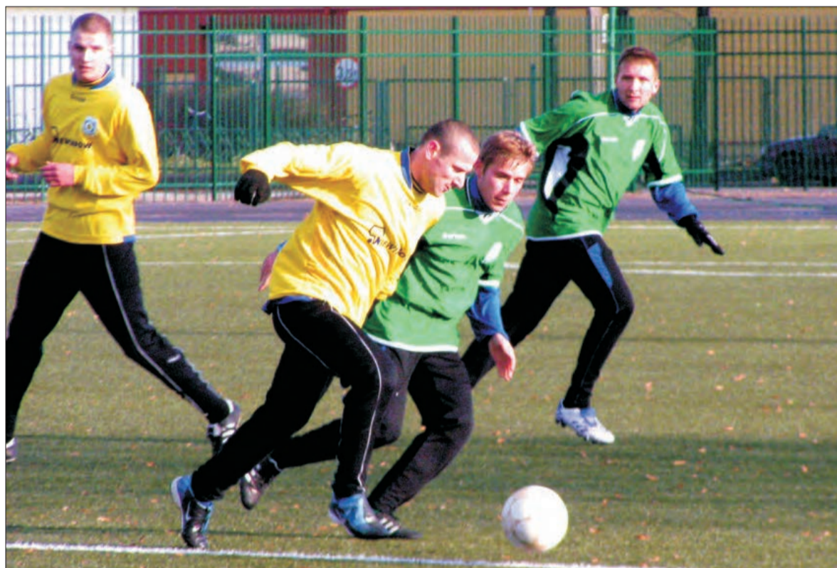
Na tle trzecioliговców z Niewiadowa wypadliśmy całkiem korzystnie.

Piłka nożna - przygotowania seniorów KS Pelikan