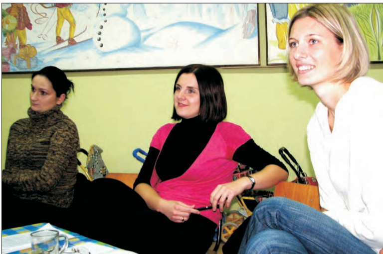
W warsztatach brali udział nauczyciele i rodzice. W grupie łowickiej były same kobiety.

którą można komuś wyrzucić krzywdę. Jako dzieci zazdrościliśmy naszym rówieśnikom ładnego charakteru pisma lub wygłaszanych publicznie pochwał pod ich adresem. Zazdrościmy - jak się okazało - innym osobom wyglądu, własnego mieszkania, lepszej sytuacji finansowej, dobrych relacji międzyludzkich. „Zazdroścę ludziom, którzy nie zazdrozczą” - podsumowała tę wyliczankę jedna z uczestniczek warsztatów.