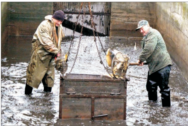
Pracownicy przedsiębiorstwa ładują ryby do pojemnika, którym przetransportowane zostaną na stół do segregacji.

dokarmianiem ryb czy dozоровaniem terenu i ochroną przed kłusownikami. Odłowy rozpoczynają się z początkiem października, a kończą w listopadzie. Wiążą się z całodobowym, niezależnym od warunków pogodowych nadzorem. Stąd w tym okresie zobaczyć można przy stawach prowizoryczne namioty.