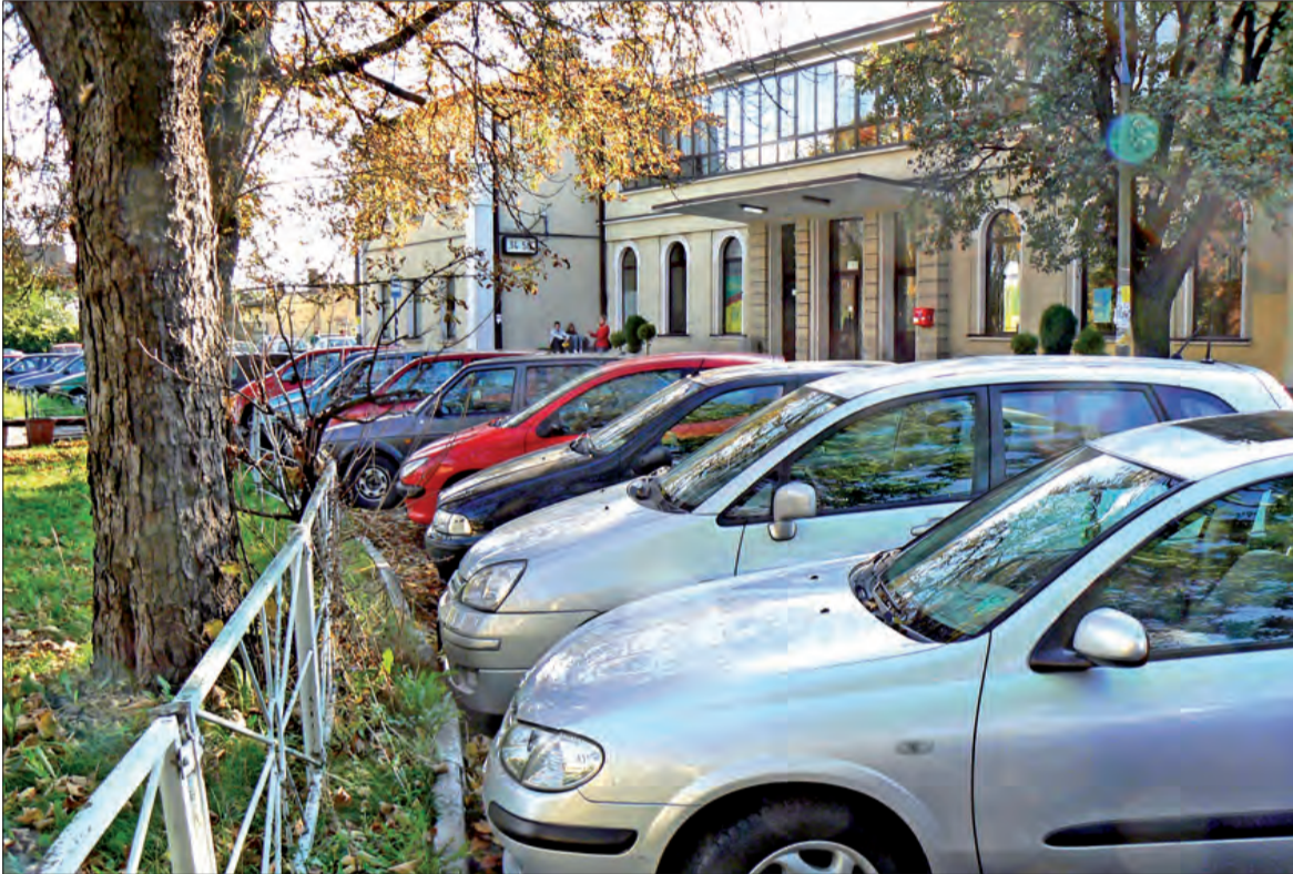
Jeden samochód przy drugim i tak na całej długości ulicy Dworcowej - w miejscach, gdzie można parkować.

Po wyburzeniu przed laty starego biurowca PKP - nazywanego „hotelu Berlin”, który stał niedaleko peronu numer 1 - na przedłużeniu ulicy Dworcowej, ale jeszcze przed „dzikim” wjazdem w ulicę Nieborowską - kolej zamierzała zorganizować tam parking. Plac od dworca dzielił stare zabudowania PKP - budynki mieszkalne pracowników. Teren po dawnym biurowcu został uprzętnięty, w znacznej części utwardzony gruzem i betonowymi płytami z budowy. Wkrótce jednak okazało się, że kierowcy nie chcieli tam parkować. Należy więc zadać pytanie dlaczego? PKP nigdy oficjalnie do tego nie zachęcało i jak się okazuje, na przeszkodzie stanął stan prawny działki. Teren ten w poprzednim