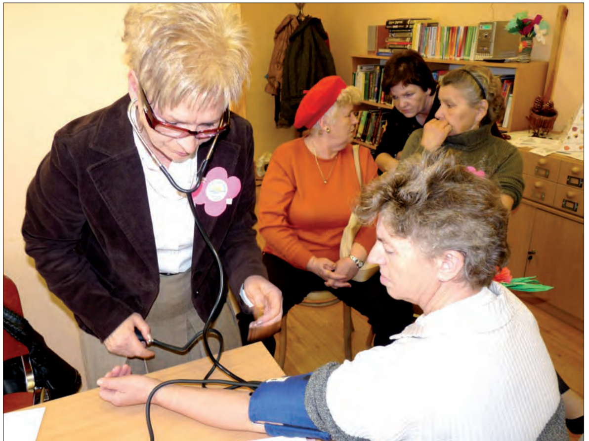
Belchowskie badania cieszyły się dużym powodzeniem uczestników imprezy.

Dzieci nie muszą odpowiadać na wszystkie pytania, wystarczy, że odpowiedzą chociaż na jedno. Ankietę będzie można wypełnić na miejscu. - Wymyśliłam ją, żeby łatwiej sprostać wymaganiom młodych czytelników i stworzyć, przynajmniej w jakiejś części, bibliotekę ich marzeń - dodaje Znyk. (jr)