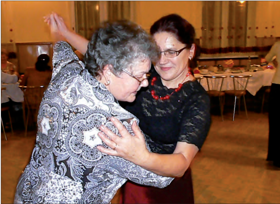
Zdarzało się, że w tan ruszały same kobiety i nie przeszkadzało im to w dobrej zabawie.