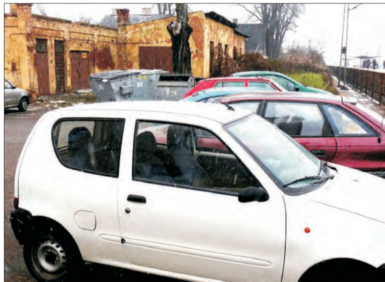
Miejsca parkingowe można również zorganizować usuwając stare pomieszczenia magazynowe i komórki za budynkiem dworca.