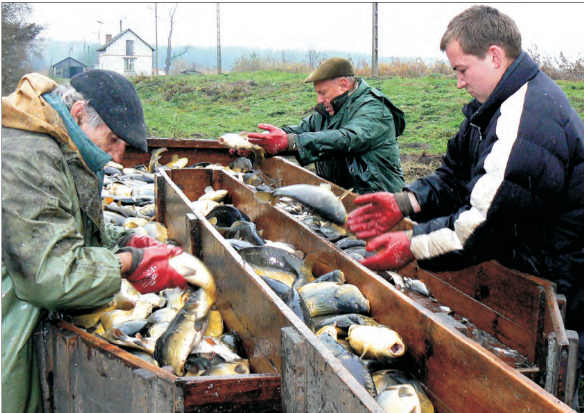
Na stole do segregacji oddziela się karpie od innych gatunków, później są one ważone i przewożone w zbiornikach do magazynów w Łyszkowicach.

Ryby zgromadzone w niezbyt głębokim betonowym magazynie, do którego wpływają przez noc, to ciekawy widok. Są stłoczone na niewielkiej powierzchni, dokładnie je widać. Do magazynu wchodzi pracownicy przedsiębiorstwa, którzy odlawiają je podbierakami i ładują do pojemnika. Dalej w tym pojemniku przenoszone są koparką na stół do segregacji. Tam ryby się dzieli na gatunki, waży, po czym ładuje one w natlenionych zbiornikach umieszczonych na przyczepie ciągnika. Gdy są pełne - jadą do Łyszkowic, gdzie w przedsiębiorstwie czekają na nie magazyny. Tam będą przebywać do czasu sprzedaży.