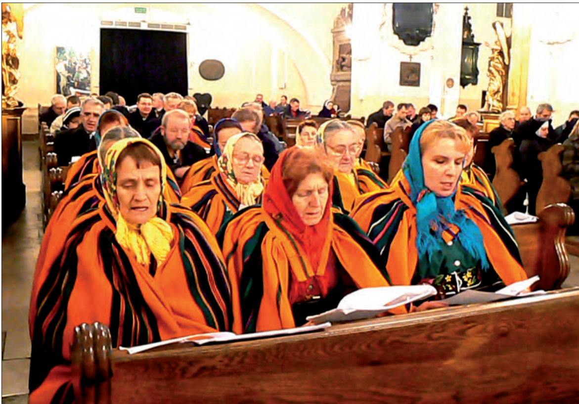
Podczas warsztatów w katedrze uwagę zwracały parafianki z Dzierzbic pod Krośniewcami, ubrane w stroje ludowe.