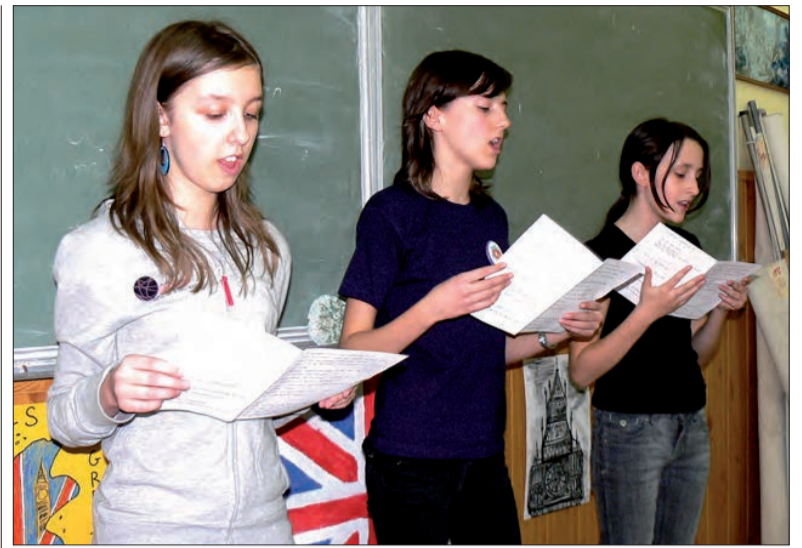
Zwycięzynie konkursu „You can sing” podczas występu.