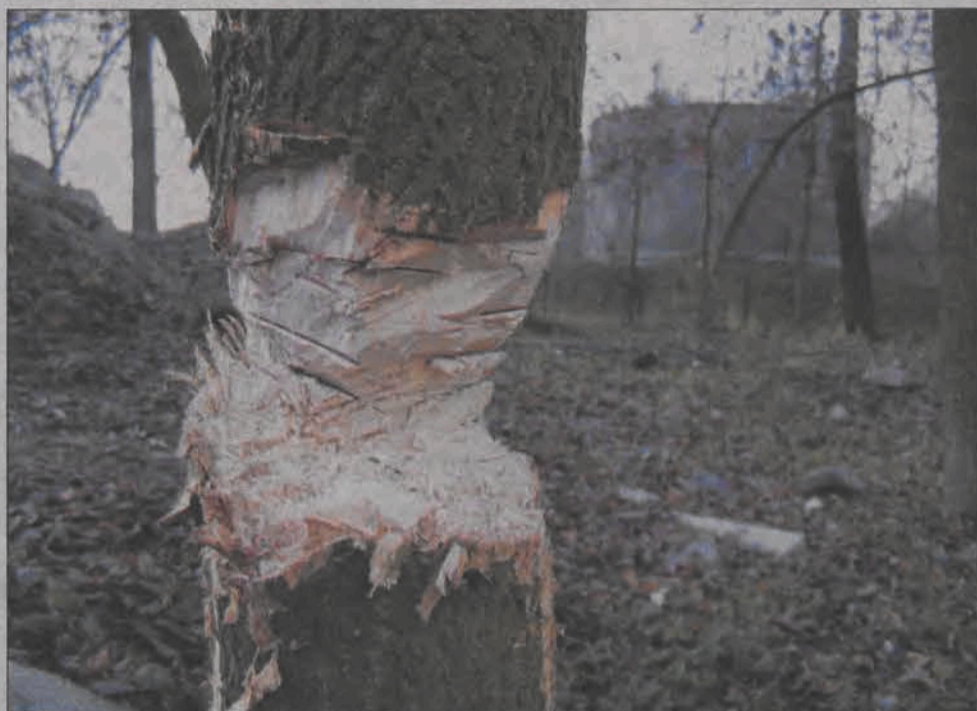
Nacięty pień młodego klonu. Drzewo rośnie w pasie drogi, który przetnie Park Błonie, ale czy to jest usprawiedliwienie dla osoby, która chciała je wyciąć.