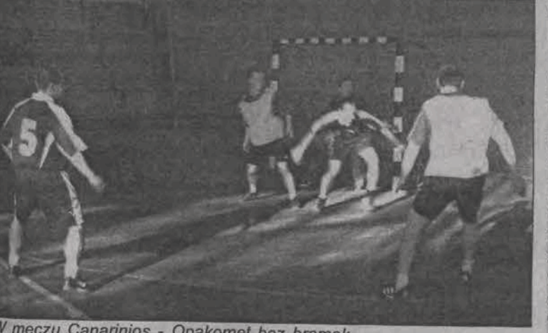
W meczu Canarinios - Opakomet bez bramek...