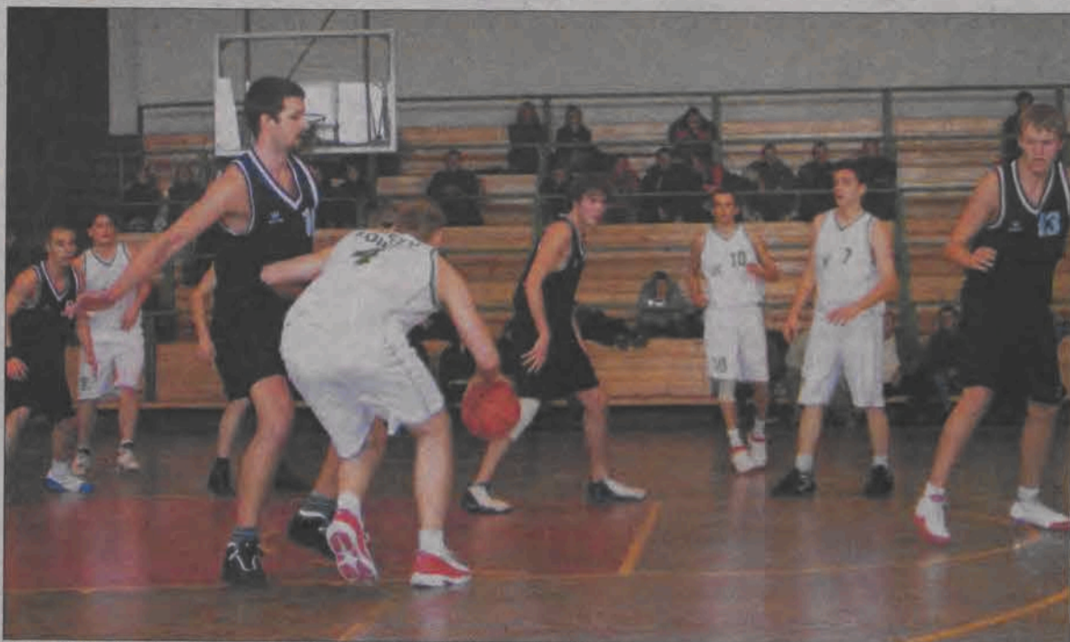
Emocji nie brakowało, a zwycięstwo odnieśli jednak łowiczanie.