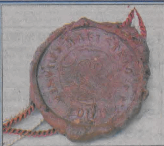
Akt erekcyjny i preambułę spinała miejska pieczęć z przedwojennym herbem z jednym pelikanem.