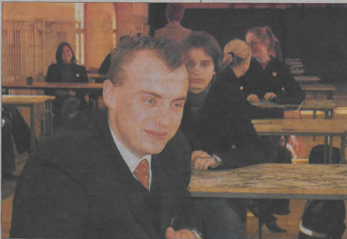
Chwilę przed rozpoczęciem próbnej matury z języka angielskiego w sali gimnastycznej „Chelmońskiego” nie było widać paniki, humory raczej dopisywały licealistom.

Mimo problemów z późnym dostarczeniem przez kuratorium wzorów arkuszy egzaminacyjnych