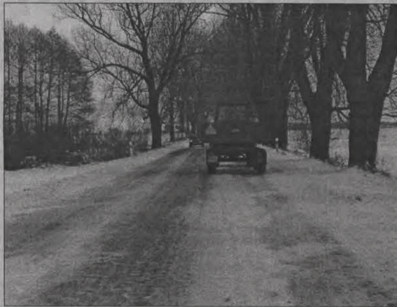
Gorzej, że dzień później na niektórych drogach ponownie była szklanka, choć przecież od wielu godzin już nie padało. Na zdjęciu oblodzona droga z Bielaw do Łowicza.

Miejsce „zapomnianych”, nie uprzątniętych ze śniegu i lodu było w Łowiczu więcej. Karykaturalnie w niedzielę wyglądał na przykład odcinek chodnika przy ulicy Długiej w Łowiczu. Wzdłuż przy-