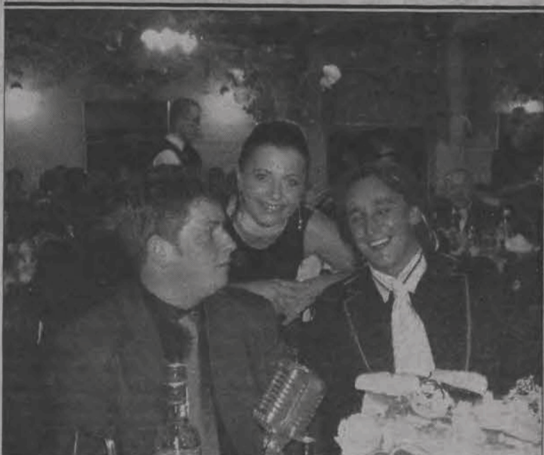
W ostatnią sobotę K.S. Pelikan zorganizował Bal Sportowca. Gościem specjalnym na imprezie był Michał Wiśniewski - lider i wokalista grupy Ich Troje. Michał nie tylko okazał się wielkim kibicem Pelikana, ale również znakomitym wodzirejem. Rozmowa z piosenkarzem w tym numerze Nowego Łowiczana na str. 25.