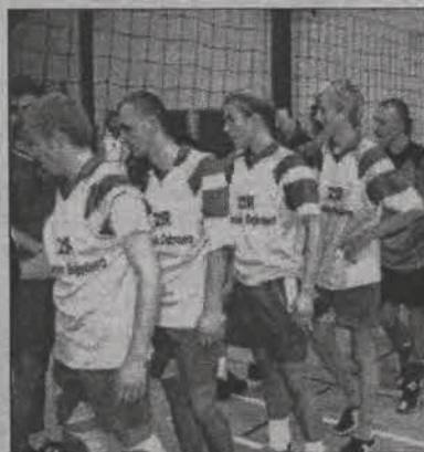
W tie-breaku lepsze Technikum.