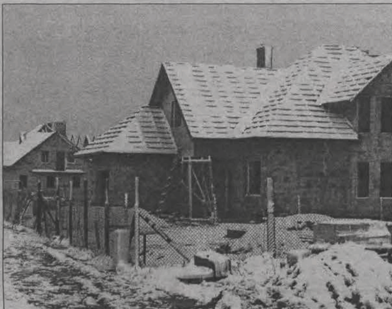
Coraz więcej działek budowlanych przy osiedlu Bratkowice jest już zabudowanych domkami jednorodzinymi. Na zdjęciu ulica Braterska.

Następny przetarg dotyczył sprzedaży niezabudowanej nieruchomości położonej w Łowiczu w obrębie Bratkowice przy ulicy Tuszewskiej. Nieruchomość położona jest w atrakcyjnym punkcie miasta obok centrum handlowego „Tuszeńska”. W planie przestrzennego zagospodarowania przeznaczona jest pod obsługę komunikacji samochodowej i zaplecza technicznego motoryzacji. Dopuszcza się wprowadzenie funkcji użyteczności publicznej nie ograniczających funkcji przeznaczenia terenu. Wysokość budynków - jedna kondygnacja. Powierzchnia nieruchomości wynosi 3.014 m 2 , cena wywoławcza ustalona była na 290 tysięcy złotych. Chętnych na ten przetarg również nie było. (mak)