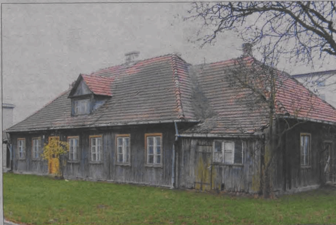
Alkierzówka - widok od strony ul. Blich - niezwykle wygląd budynku zawsze intrygował tych, którzy po raz pierwszy go zobaczyli.

podejmować temat, o czym poinformował właścicieli.