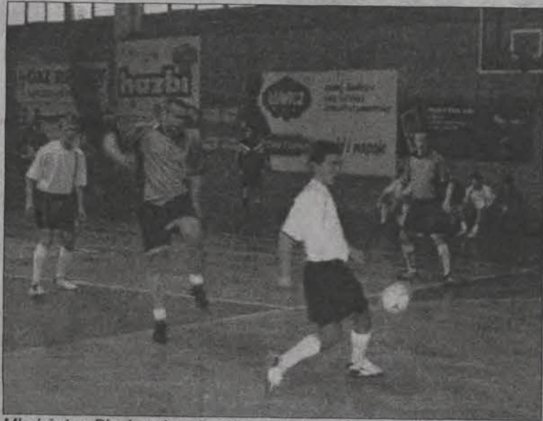
Młodzież z Blockersów okazała się jednak lepsza od Alcatraz.