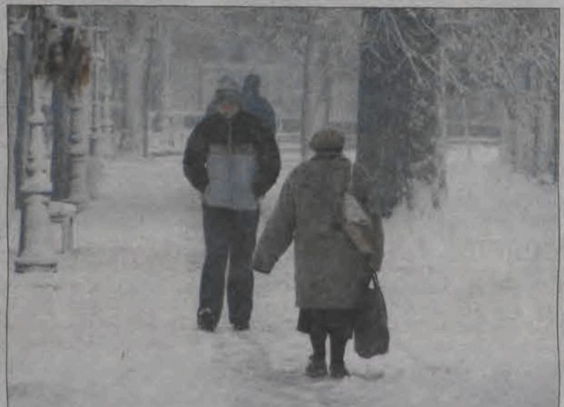
Po raz pierwszy w tym roku sypano śniegiem w ubiegły piątek, ale za to od razu obficie. O niewesołych wnioskach płynących z pierwszych śniegowych doświadczeń piszemy na stronie 4.