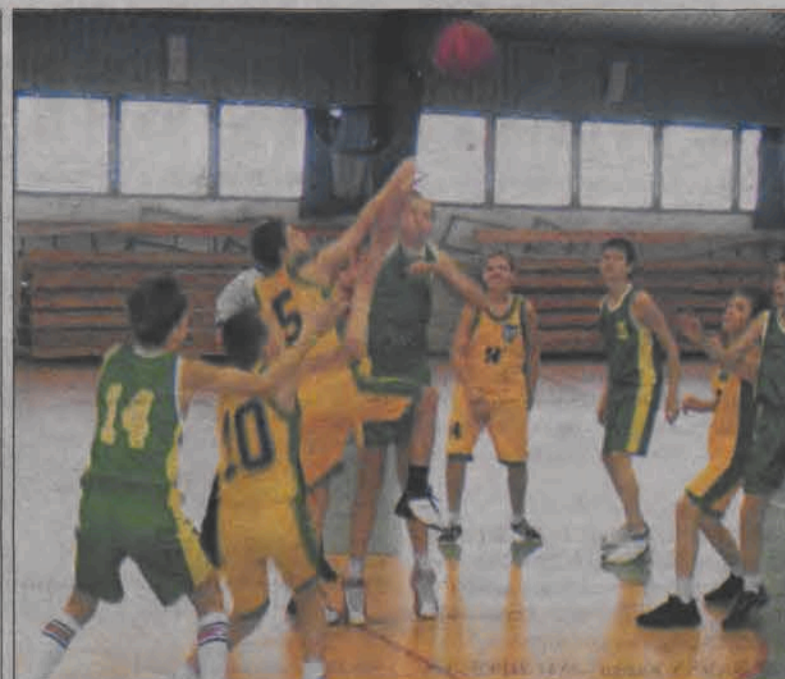
W tym wieku rok różnicy to niemalże „przepaść”. Młodzicy Księżaka I nie dali najmniejszych szans swoim młodszym kolegom z zespołu Księżaka II (rocznika 1992).

Zatem łowiczanie kadeci przegrali mecz 59:57, ale w dwumeczu są górą bowiem u siebie wygrali pięcioma punktami. Po siedmiu kolejkach wojewódzkiej ligi kadetów „Księżacy” zajmują drugie miejsce w swojej grupie i są już pewni awansu do finałów o miejsca 1-6.