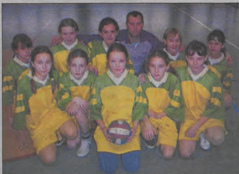
Mistrzyniami powiatu łowickiego okazały się uczennice SP Nieborów.