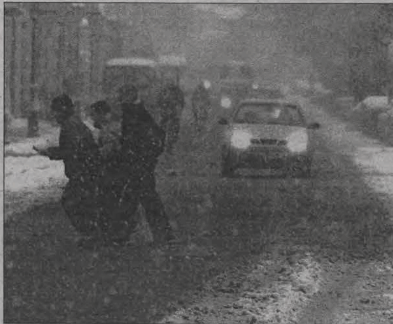
Pierwsze w tym roku uderzenie zimy było gwałtowne. Śnieg padał w piątek gęsto, ale pługów nie było widać ani w Al. Sienkiewicza w Łowiczu (na zdjęciu), ani w innych miejscach.

-Zima zaskoczyła drogowców!!! Od kilku lat jestem drogowcem i nie wiem jak można takie bzdury pisać... Służby są przygotowane, ale przecież nie ruszają na drogi przy pierwszych płatkach śniegu... zastanówcie się... nie byłoby czego odśnieżać i posypywać solą... akcje rozpoczyna się wg norm, a nie przy pierwszym śniegu... - można było przeczytać po godzinie 13. na internetowym forum portalu onet.pl. Osoba, która podpisała się ~DROGO-WIEC już po kilku minutach otrzymała kilkanaście odpowiedzi oburzonych internautów, którzy tego dnia mieli wątpli-