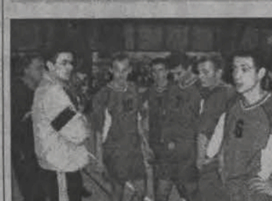
Blich prowadził w setach 1:0 i 2:1, ale przegrał jednak 2:3.