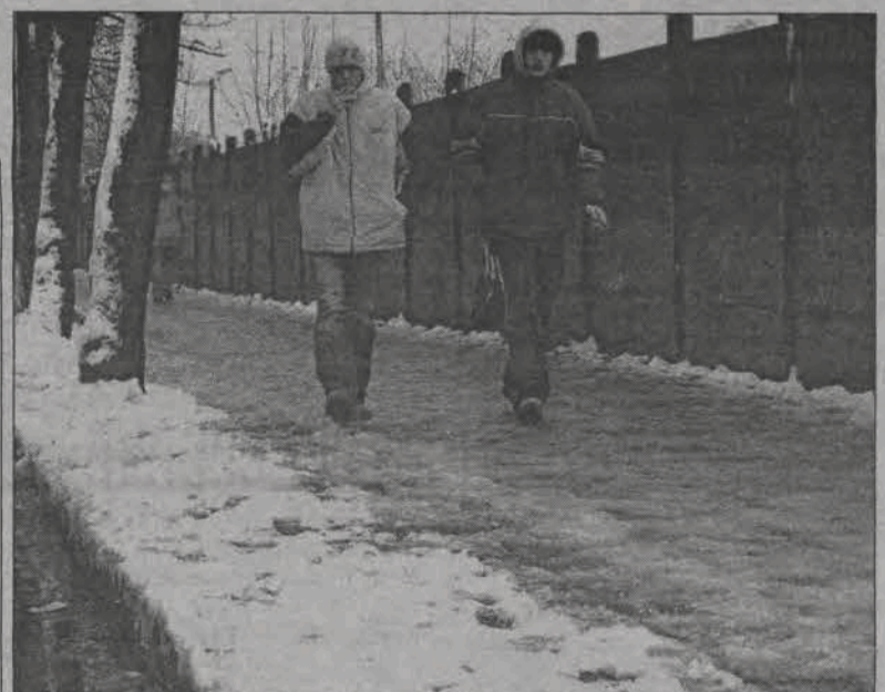
Kolej tradycyjnie nie zadbała o sprzątnięcie śniegu z przyległego do jej terenu chodnika przy ul. 3 Maja w Łowiczu, ratusz tradycyjnie nie wyciągnął wobec kolej konsekwencji. Po chodniku w miarę szybko potrafili poruszać się tylko młodzi i sprawni.

Jutrzejsze zajęcia stanowią integralny element szóstej edycji Powiatowego Przeglądu Piosenki Dziecięcej - Zduny 2004, którego finał odbędzie się w GOK Zduny 1 i 2 grudnia na sali widowiskowej GOK Zduny. Na scenie zaprezentuje się kilkadziesiąt osób, dzieci i młodzież, zakwalifikowanych po eliminacjach gminnych, zarówno soliści, jak i zespoły w trzech kategoriach wiekowych. Każdy z wykonawców ma obowiązek zaprezentować jeden utwór w języku polskim. W środę 1 grudnia od godz. 9 prezentować będą się uczniowie klas 0 - I, a od godziny 11 uczniowie klas IV - VI, drugiego dnia w czwartek 2 grudnia od godz. 10 rozpoczną się przesłuchania gimnazjalistów. Każdy dzień kończyć będzie się wręczeniem nagród laureatom. Wstęp na salę widowiskową w czasie przeglądu jest wolny. (fb)