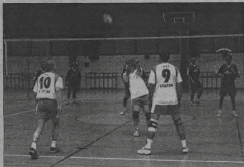
W piątek ciekawy mecz rozegrają Książak z Dzi-koś-cią.

Mecze 5. kolejki zaplanowane zostały na piątek 26 listopada, a zmierzą się wówczas: godz. 17.30: Zatorze - Rzemiosło, godz. 18.45: Dzi-koś-ć - TKKF Książak i Malina Skierniewice - TKKF BS oraz godz. 20.00: TKKF Expandor - LZS Retki. (zł)