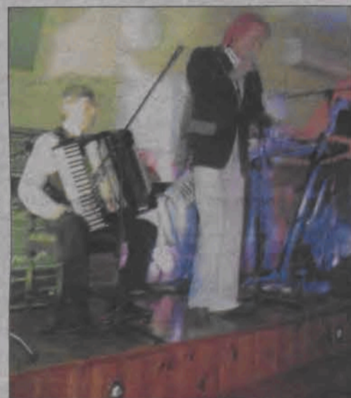
Podczas Balu Sportowca Michał Wiśniewski nie tylko był. Także śpiewał.