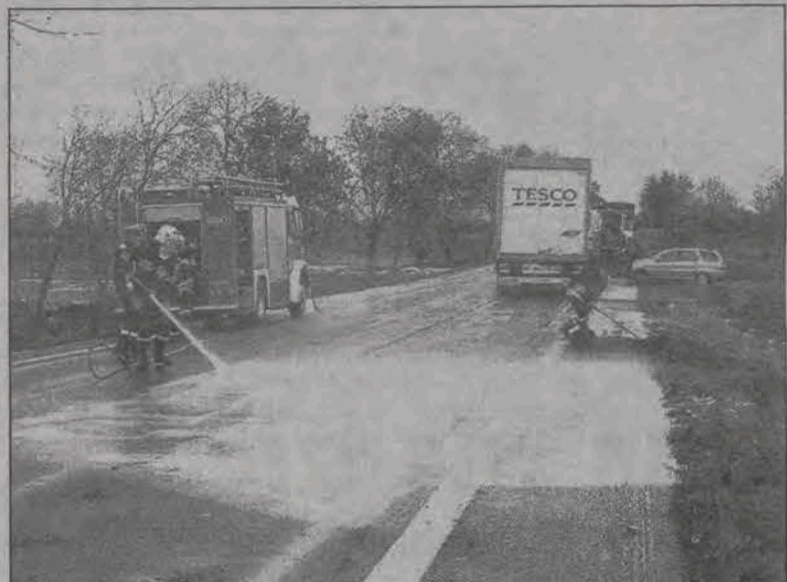
Okolo godz. 9.20 we wtorek w Kopminie straż usuwała pozostałości po wypadku z jezdni, wkrótce też przywrócono ruch.

Wśród dróg przewidziana jest realizacja zaplanowanej co prawda na rok obecny, drogi Urzeczce - Bogoria Góra o długości 2.366 m. Możliwe jest, że droga będzie mogła zostać dofinansowana ze środków unijnych, wniosek złożono już w czerwcu, obecnie są sygnały, że wniosek jest w grupie możliwych do zakwalifikowania. Jeśli do tego dojdzie, gmina dostalaby 70% kosztów planowanego zadania, czyli kilkaset tys. zł. Planowana jest także budowa liczącej ok. 2 km drogi pomiędzy Wiskiennicą Górą a Bąkowem Górnym. Koszt tej inwestycji może wynieść ok. 250 tys. zł. Gmina wystąpiła do Urzędu Marszałkowskiego o dofinansowanie jej z Funduszu Ochrony Gruntów Rolnych. W budżecie gminy znalazły się także zarezerwowane 100 tys. zł na rozpoczęcie prac projektowych dotyczących budowy oczyszczalni ścieków w Strugienicach i pierwszej nitki kanalizacji sanitarnej w Strugienicach i Zdunach.