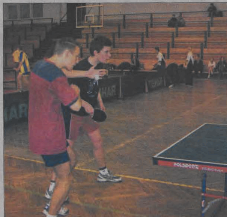
Pingpongści z I LO Łowicz okazali się najlepsi w rejonie i awansowali do czołowej szóstki w województwie łódzkim.