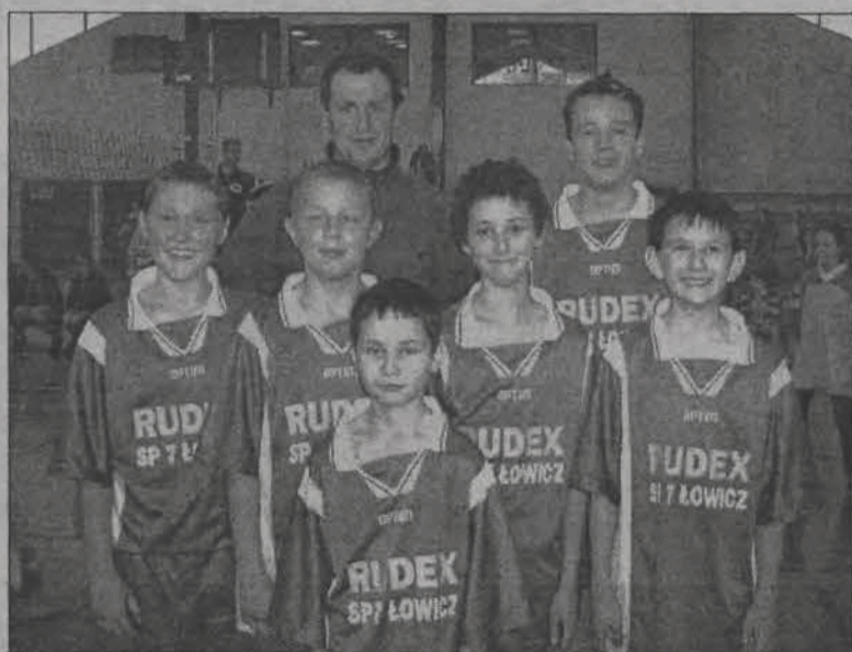
Mistrzowie powiatu łowickiego - siatkarze SP 7 Łowicz.