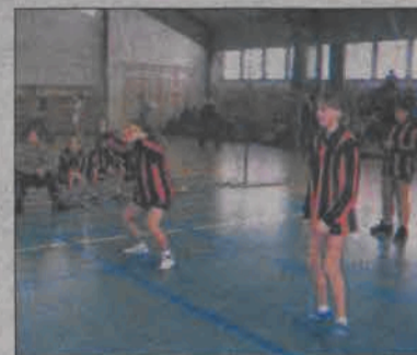
Drugie miejsce w PIMS dla SP 4.