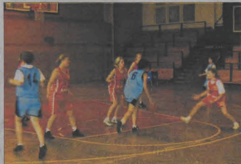
Kadetki Księżaka po zwycięstwie z Mag-Rysem powróciły na drugie miejsce w tabeli.