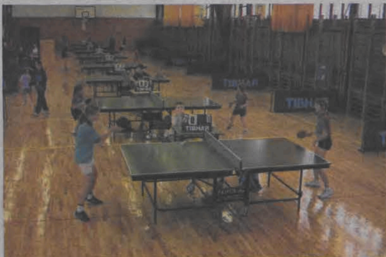
Łowiczanki miały realną szansę na awans do czołowej czwórki...