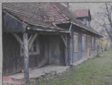
Czy kryta sypiąca się powoli dachówką drewniana alkierzówka skazana jest na śmierć?

o pieniądze z zewnątrz na ten cel, bo jako szkoła nie prowadzimy działalności gospodarczej, osoba prywatna ma większe możliwości w tym zakresie - przyznał nam Kret, który podkreśla, że bardzo mu zależy, by budynek znalazł swego właściciela.