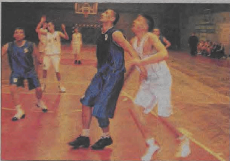
Łowiczanie po raz drugi nie sprościli silnej ekipie AZS Kutno.

Halowa piłka nożna - mecz 2. kolejki I ligi ŁLPNP