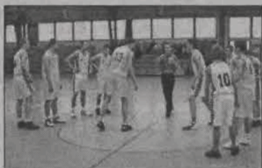
Kadeci Księżaka okazali się wyraźnie lepsi od rywali z Sieradza.

Łowicz, 28 listopada. Łowiccy kadeci w minioną niedzielę zegrali mecz rewanżowy z ekipą Trójki Sieradz. Pierwszy mecz tych dwóch drużyn był bardzo wyrównany i łowiczanie wygrali 86:80. Na swoim