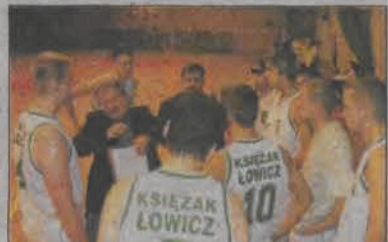
Księżak na półmetku zajmuje trzecie miejsce.

1. AZS Kutno (1) 8 16 623:424 2. Osemka Skierniewice (2) 8 13 545:516 3. Księżak Łódź (3) 8 12 469:454 4. Start Łódź (4) 8 11 613:558 5. Wiking Tomaszów (5) 8 8 350:648