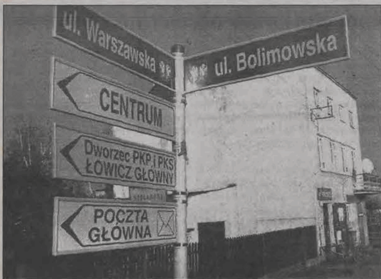
22 słupki z tablicami informacyjnymi stanęły na terenie Łowicza.