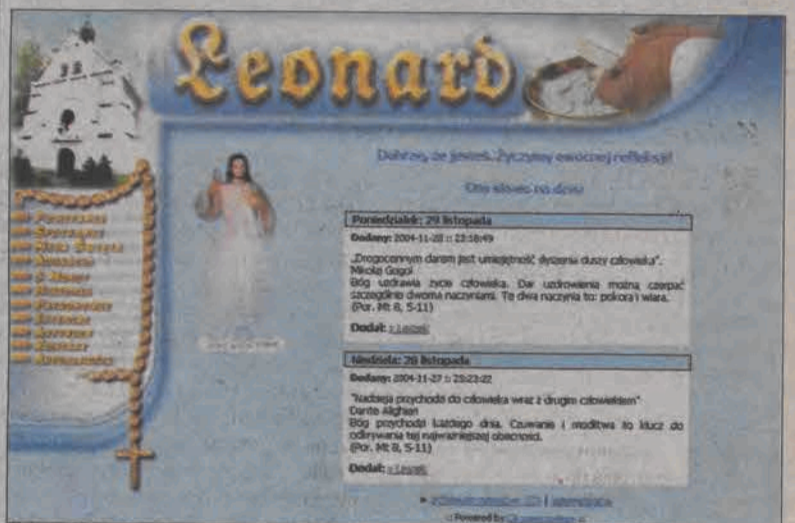
To ujrzymy na ekranie wchodząc na stronę www.leonard.com.pl

Ponadto na stronie kilka innych, ciekawych działów. Leonard.com.pl - warto zajrzeć. I warto wpaść do kościoła. (wał)