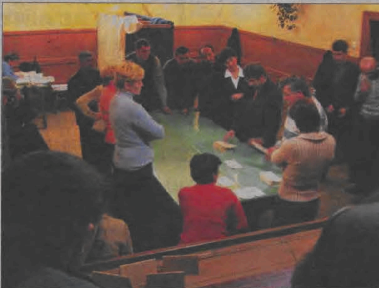
21 listopada wieczorem. Komisja wyborcza w Tershivie liczy głosy.

swych pieniędzy i odwrotnie - swe pieniądze dla konserwowania swego wpływu na politykę. - To był ich folwark, w którym robili co chcieli - streszcza Lebioda opinie kijowskiej ulicy o ludziach, którzy Ukrainą w ostatnich latach rządili - a z błogosławieństwem Moskwy chcą rządzić dalej.