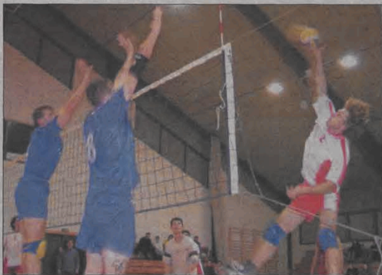
Siatkarze LZS Retki tym razem nie dali szans rywalom z Głowna.

■ MALINA Skierniewice - TKKF BANK SPÓŁDZIELCZY Głowno 3:1 (25:16, 25:20, 22:25, 25:20)