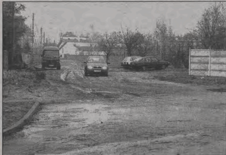
Ulica Kutrzeby, od strony Grunwaldzkiej, jeszcze w tym roku zostanie utwardzona kostką brukową.