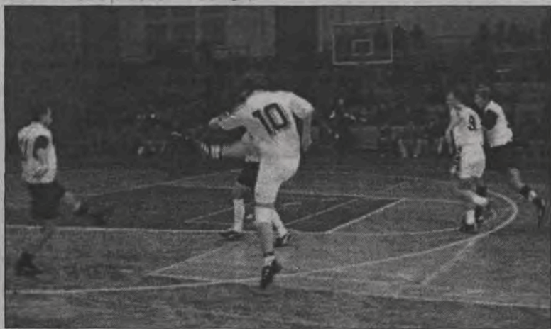
Na gola Dagramu „Starsi Panowie” odpowiedzieli trzema trafieniami.

Jak na razie gra Abexu musi imponować. Dwa przekonywujące zwycięstwa, dają znakomity bilans bramkowy i... re-