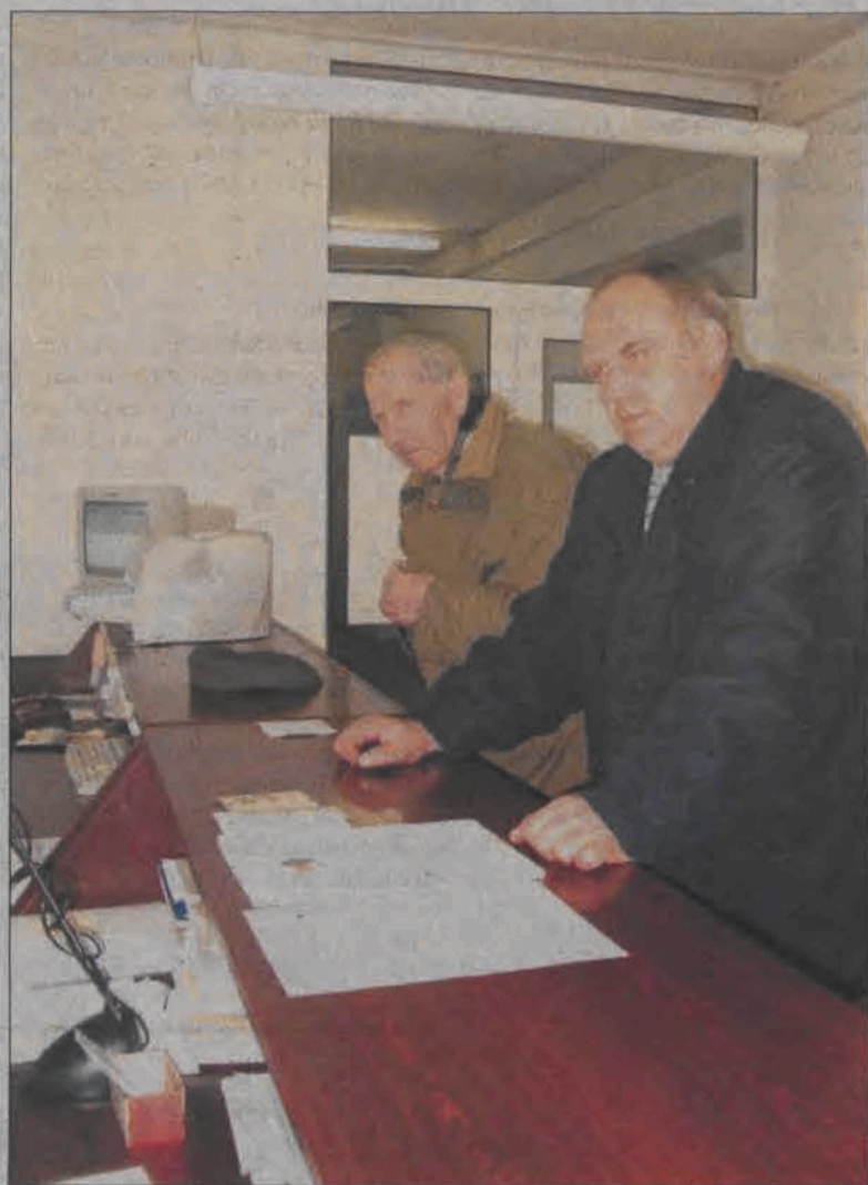
Jak widać w wydziale spraw obywatelskich łowickiego ratusza nie zawsze jest kolejka. Na zdjęciu petenci, którzy przyszli tu w sprawie wymiany dowodu osobistego.