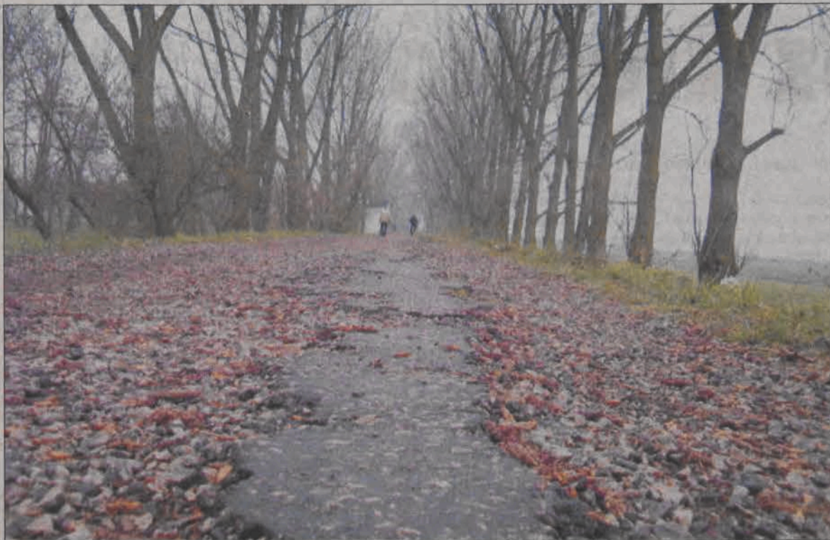
Tak wygląda późnojesienny pejzaż na wale przeciwpowodziowym w Łowiczu. Zniszczona powierzchnia niegdyś asfaltowej nawierzchni wału doprowadza do frustracji spacerowiczów, którzy w słoneczne dni dość licznie chodzą alejką porośniętą po obu stronach wysokimi włoskimi topolami. W dziurach grzęzną koła dziecięcych wózków, a rowerzyści muszą wykazać się sporym refleksem, by nie zaliczyć wywrotki. Kontemplowanie jesiennego krajobrazu w takich okolicznościach to nie lada wyzwanie. (tb)