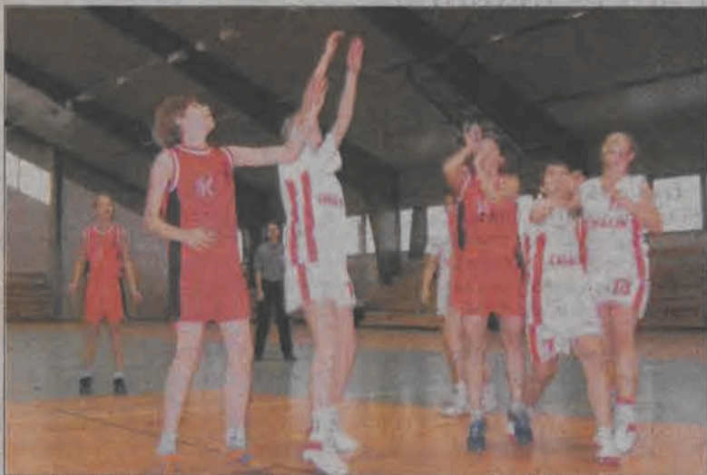
Młodzieżki Księżaka wysoko wygrały z rywalkami z Widzewa.