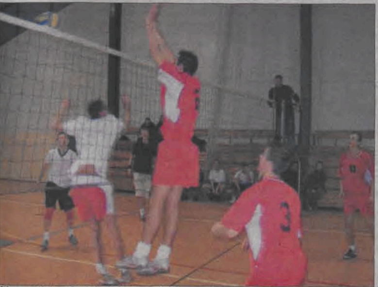
Mecz Blich - Groniu i Spółka zakończył się zdecydowanym zwycięstwem ekipy z ZSP 2 Łowicz.