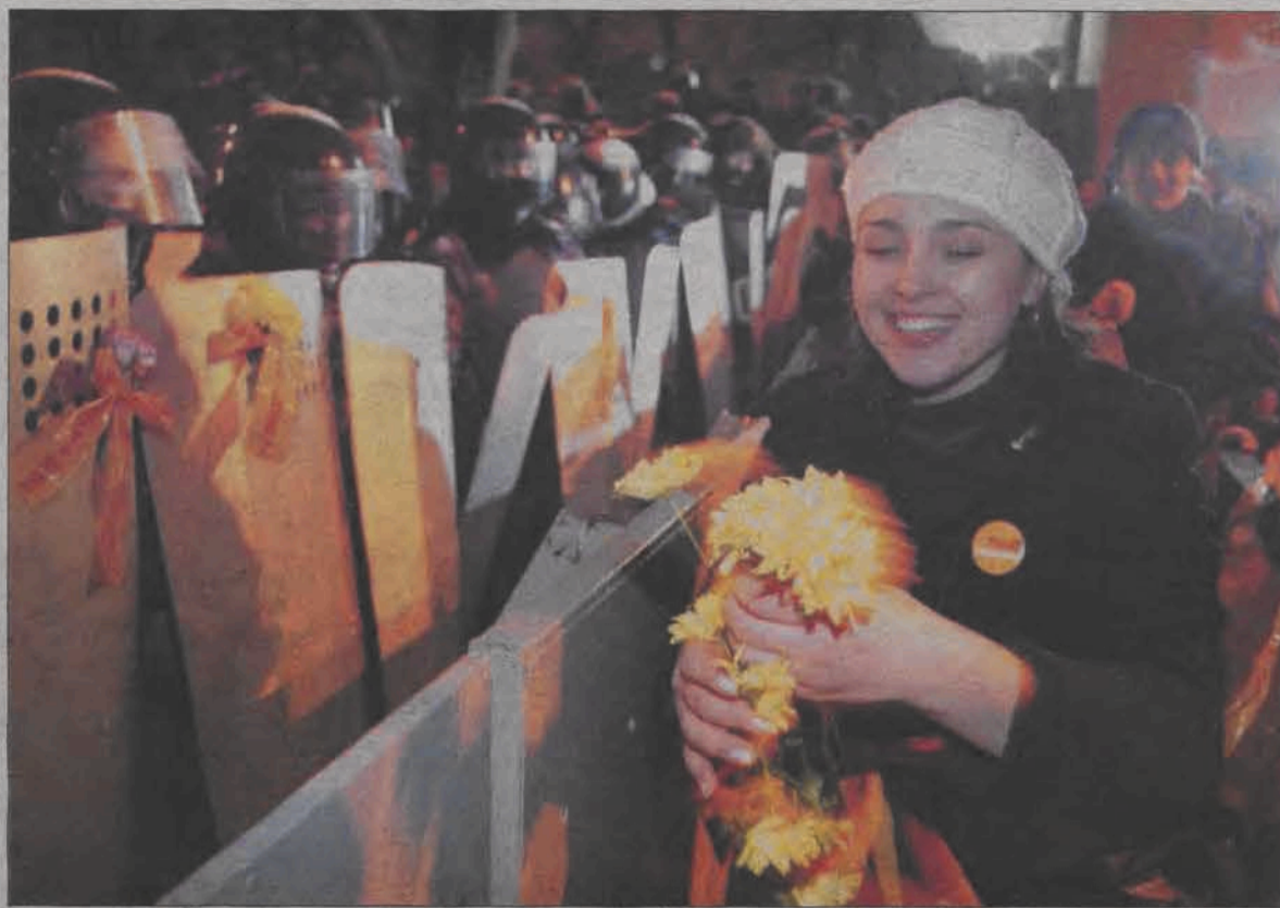
Pomarańczowe wstążki, kwiaty i piękne dziewczyny. Oby na zawsze stały się symbolem tej, na razie szczęśliwie bezkrwawej, rewolucji.

Kijów. Dochodzi godz. 15. Mroźno, wiatr zaczyna śniegiem. W taksówce do centrum miasta Aleksander - miejscowy taksówkarz - opowiada, co się dzieje. Wiózł już wcześniej dziennikarza, nie czeka więc na pytania, sam opowiada. Opowiada o udokumentowanych przypadkach fałszerstw wyborczych. Nie ma wątpliwości, że za wszystkim stoi Moskwa. Milknie, gdy w radiu Era, jedynym, które zachowało odrobinę niez-