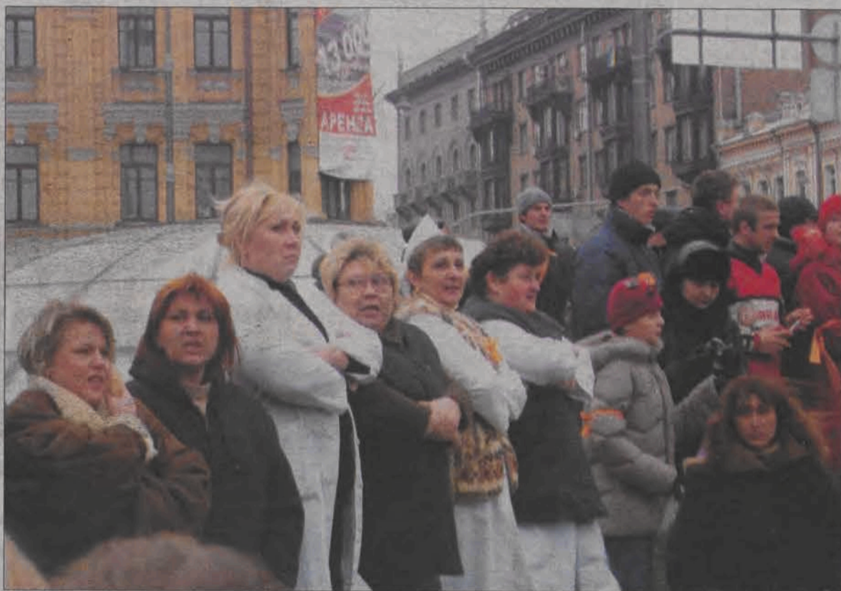
23 listopada. Drugi dzień protestów przeciwko fałszerstwom wyborczym. Na ulice wychodzi cały Kijów.

Przecież mieliby za co nienawidzić. Za prezydentury Leonida Kuczmy dochodziło do zabójstw niewygodnych dziennikarzy, za które nikt do tej pory nie odpowiadał, środki masowego przekazu dostały się w ręce albo administracji państwowej albo oligarchów powiązanych z rządem. Wielkie zakłady przemysłowe, całe gałęzie gospodarki podporządkowała sobie grupa związanych z Kuczmą ludzi, bez ceregieli wykorzystujących swą siłę polityczną dla pomnażania