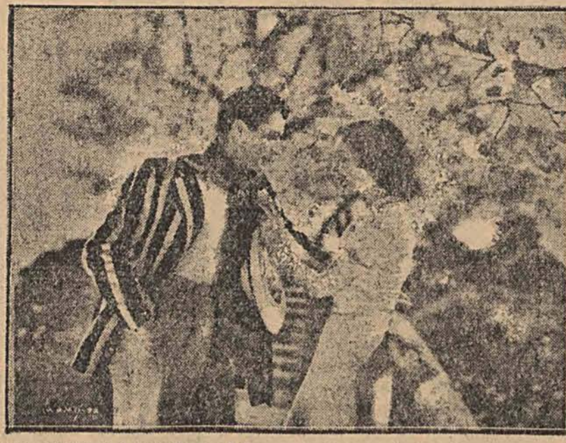
Robert Taylor jest niezwykle urodzonym artystą, lecz jest także doskonałym sportowcem. W filmie 'Student z Oxfordu' gra z nim Maureen O'Sullivan.