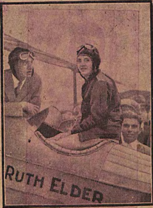
LOTNICZKA TRANSATLANTYKA, MISS ELDERS

O amerykance Ruth Elders, która odleciała z New Yorku, niema dotychczas żadnych wiadomości.