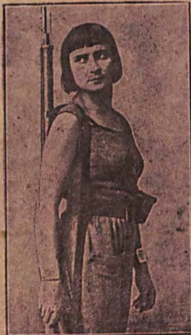
W manewrach jesiennych pod Odessą wzięła również udział „zwojenizowana” ludność cywilna. Na obrazku naszym widzimy dziewczynkę - żołnierza z komsomolu.