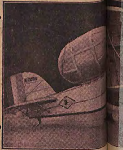
BALON RATAJ Dla samolotów transatlantycznych samolotu przyczepiony do niebezpieczny