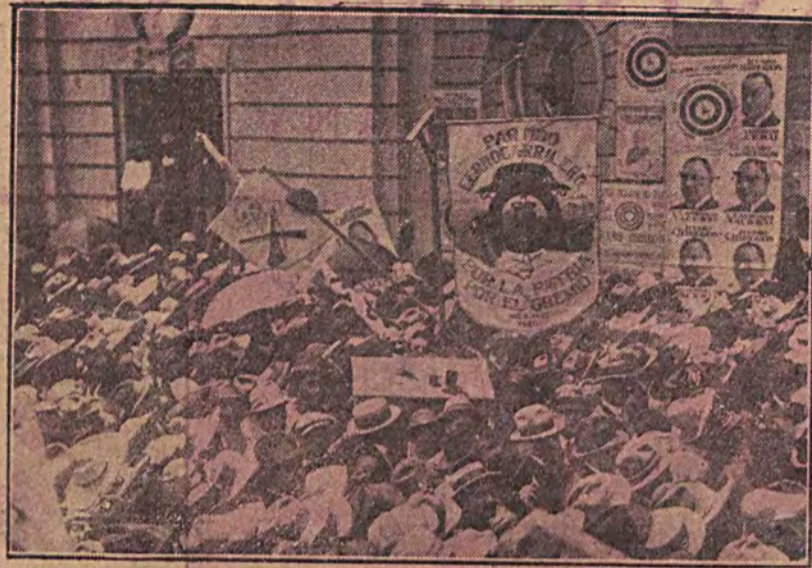
JAK ODBYWAJĄ SIĘ WYBORY W MEKSYKU. W Meksyku, państwie rewolucyj i przewrotów politycznych, wybory mają zazwyczaj przebieg bardzo burzliwy. Na ilustracji naszej widzimy fragment z wiecu wyborczego w Meksyku — City.