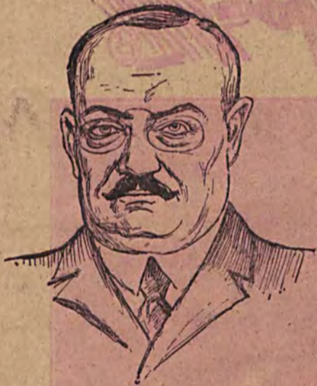
NASTĘPCA RAKOWSKIEGO. Sowiecki ambasador w Tokio, Dowgalewski.