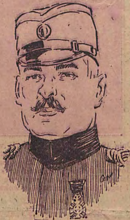
Jugosłowiański generał, Michał Kowaczewicz, zabity został w tych dniach przez dywersantów macedońskich.