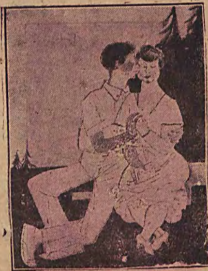
— Co czuje pani, siedząc tak obok mnie pośród boskiej tej natury? — Ze się jutro spóźnię do biura.