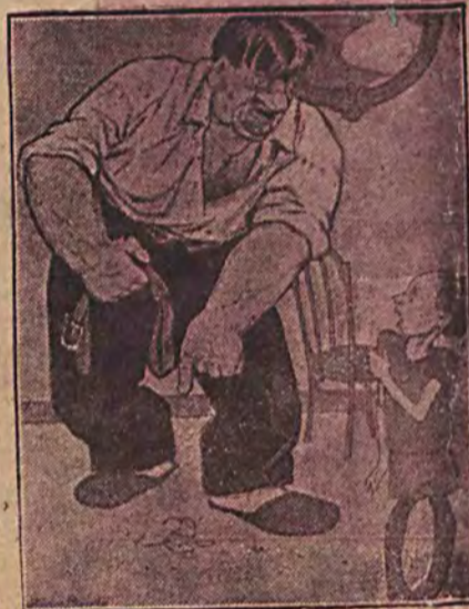
— Poczekał, ja cię nauczę, jak należy się obchodzić z delikatnymi przedmiotami...