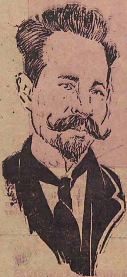
SMETONA - Prezydent republiki Litewskiej.