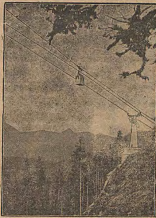
W Zalekamergucie zbudowano nową koleją napowietrzą długości około 3.000 metrów. Najgłębsza przepaść pod koleją wynosi 400 metrów.

ło się w zaświaty astralne, tracąc wszelki kontakt z ziemią, gdy nagle rozległ się okrzyk: „Baczność, policja!”. Uspione medium zrywa się, jak oparzone z krzesła i poczynając zmykać, nie trzaskając się nawet o los swojego impresarja. Publiczność zbyt dobrze widokiem tym się ubawiła, by żądać zwrotu datków.