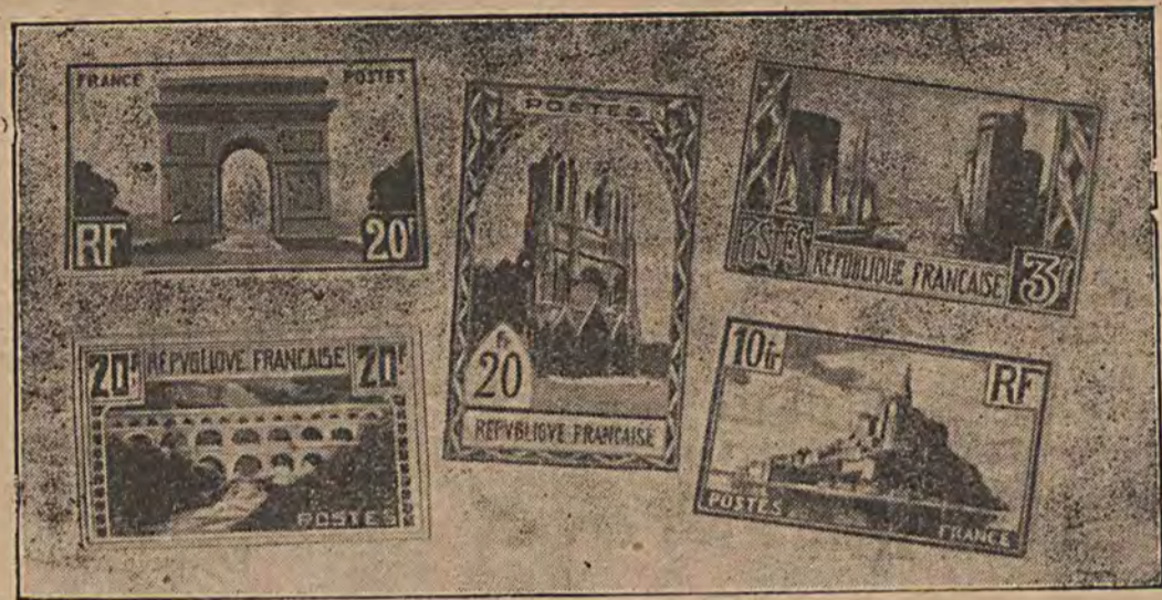
Nowe marki francuskie z widokiem sławnych francuskich miejscowości. Po środku: katedra w Rheims; na lewo: u góry brama triumfalna w Paryżu, u dołu Ponta du Gard, staro-rzymski most. Na prawo: u góry port w La Rochette, u dołu Mont Saint Michel, francuska forteca kościelna w Kanale.

Kto chce najkorzystniej sprzedać rzeczy — proszę zgłaszać się do „SKLEPU KOMISOWEGO”