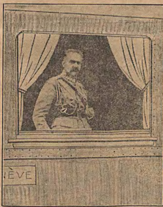
MARSZAŁEK PIŁSUDSKI NA PERONIE GENEWSKIM.

Czas od 1 grudnia 1927 roku do 10 stycznia 1928 roku jest w całej Polsce poświęcony propagandzie walki z gruźlicą.