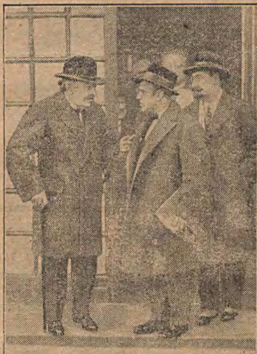
BRIAND W GENEWIE. Francuski minister spr. zagr. jest molestowany przez dziennikarzy o wywiad.