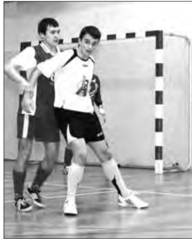
W meczu na szczycie Mariott - Warriors padł wynik remisowy 2:2.