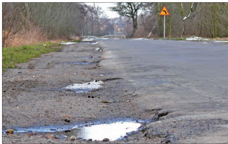
Droga pomiędzy Bielawami a Sobotą ma zostać zmodernizowana za pieniądze z RPO.

Prace przy realizacji tych zadań będą w różnym stopniu rozłożone do 2012 roku.