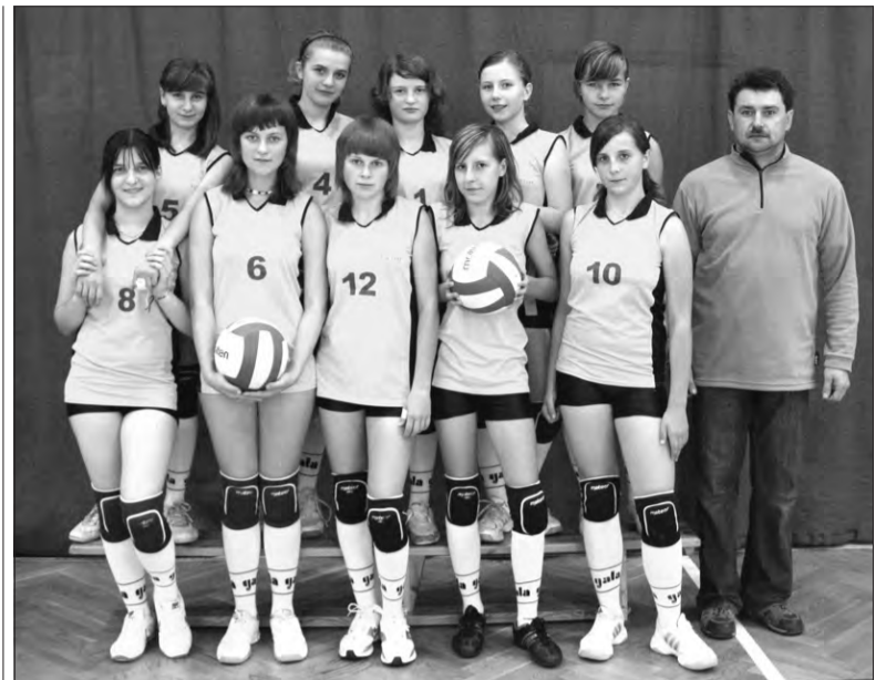
Siatkarki ŁUKS Asik grają coraz lepiej...