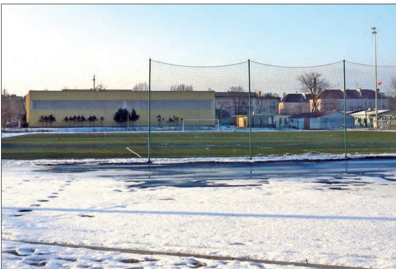
Zielona nawet zimą, bo sztuczna, murawa na stadionie OSiR została wykopana w pierwszym etapie gruntownej przebudowy obiektu.

Miasto wystąpiło już w tej sprawie o dotację do Ministerstwa Sportu w wysokości 1 mln zł. Dotychczas na budowę murawy, bieżni i oświetlenie obiektu miasto pozyskało już z Urzędu Marszałkowskiego 1,3 mln zł. Jeżeli pieniędzy nie udało się pozyskać, całą kwotę próbowano by wygospodarować z budżetu miasta. Prze-