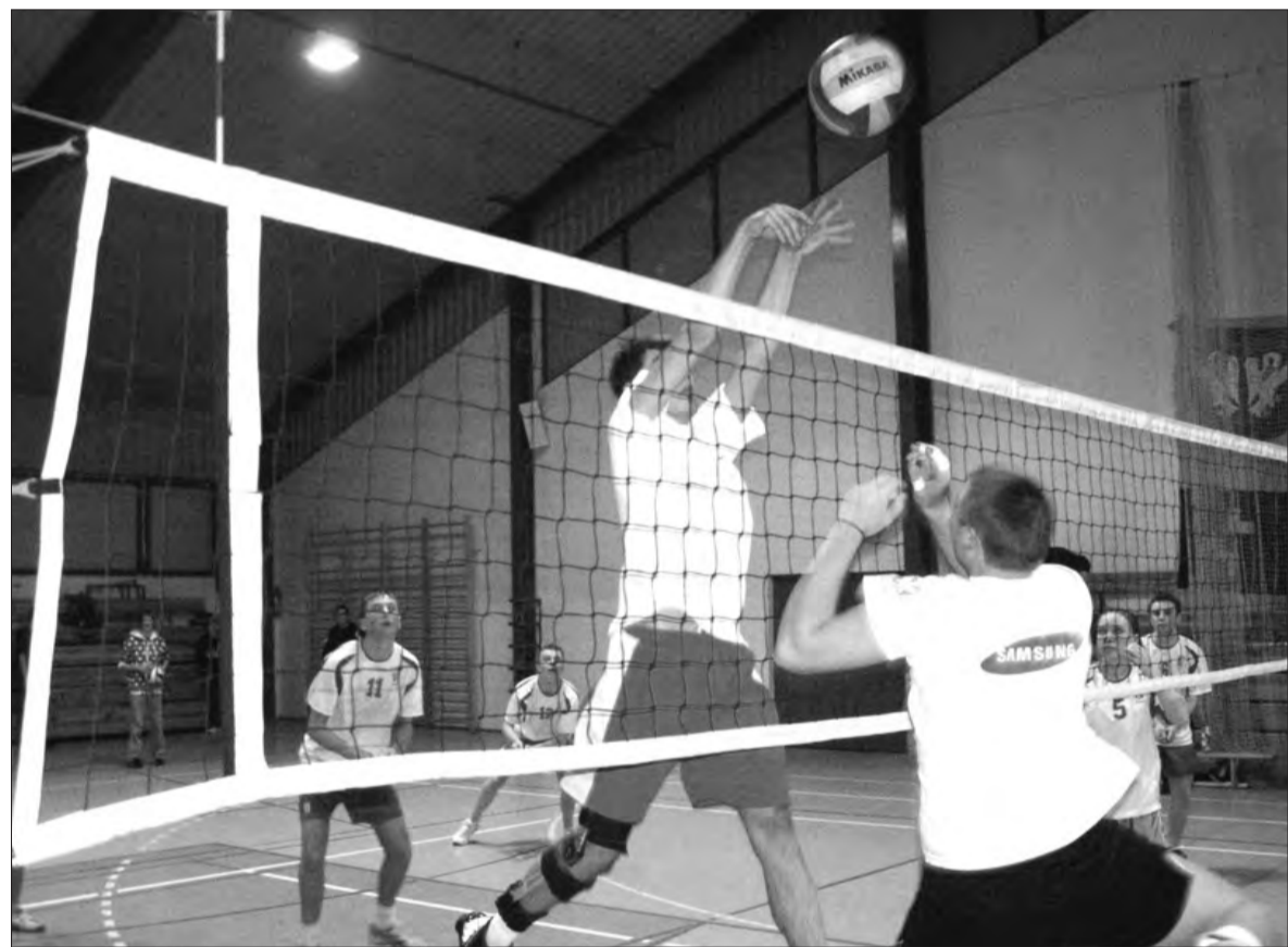
Rozgrywki siatkarzy - amatorów powoli zbliżają się już do końca.

Kolejne zmagania siatkarzy amatorów rozegrane zostaną w piątek 20 lutego, a pierwsze mecze zaplanowano na godz. 16.00. (zł)