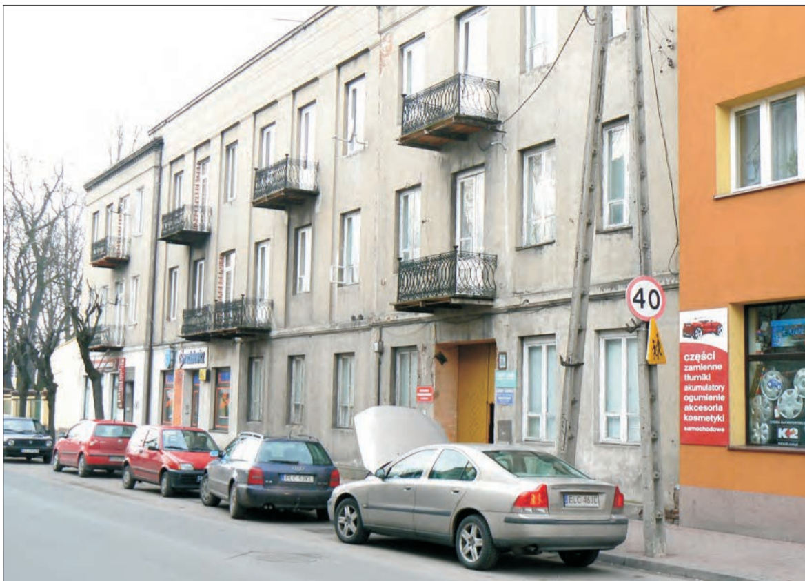
Lokale, które powiat chce sprzedać, położone są na parterze budynku przy ul. Podrzecznej 28.

Na sesji styczniowej radny Jerzy Wolski pytał o plany dotyczące budynku III LO przy ul. Armii Krajowej oraz o to, które nie-