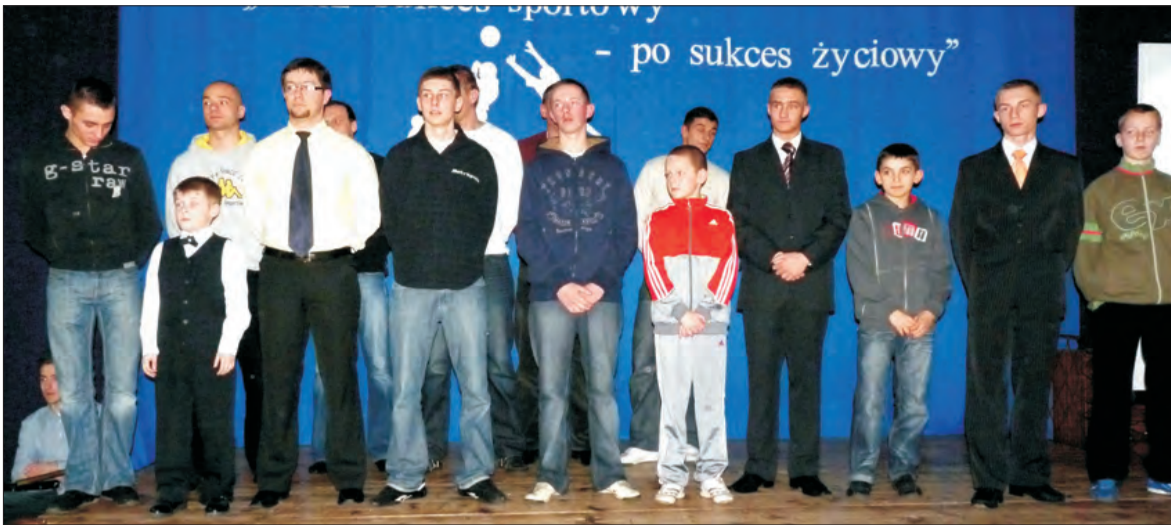
Nagrody rzeczowe otrzymali piłkarze, koszykarze, lekkoatleci, judocy, karatecy, szachiści, motocrossowcy...