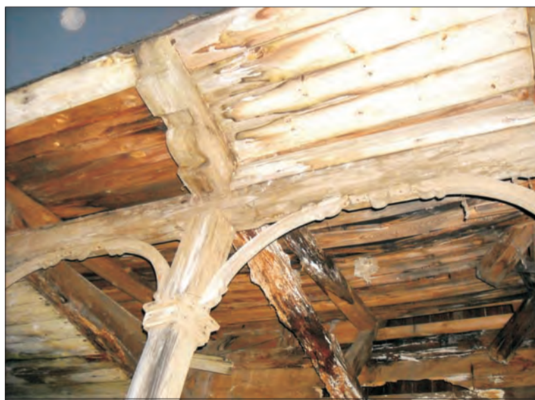
Budynek nie kwalifikuje się do rozbiórki, ale do solidnego remontu - owszem!

Nadleśniczy Mateja mówi nam, że od ukazania się 29 maja 2008 roku artykułu w NL plany nadleśnictwa w stosunku