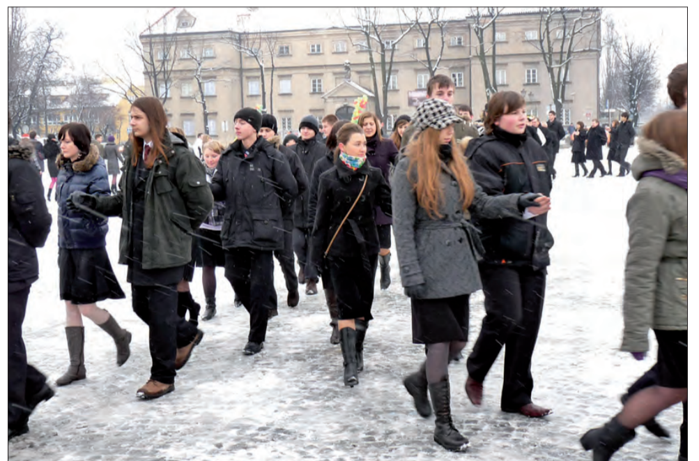
Młodzież z II LO tańczy poloneza na Starym Rynku. Ubrani jak przystało na tę porę roku, nie skarżyli się na zimno i opady śniegu.

Chcielibyśmy upublicznić pewien fakt, który miał miejsce nie tak dawno, a dotyczył obchodów 10-lecia powiatu łowickiego. Przez wiele lat teściowie współpracowali z powiatem, przyjmowali jego gości (nieodpłatnie!) i z otwartym