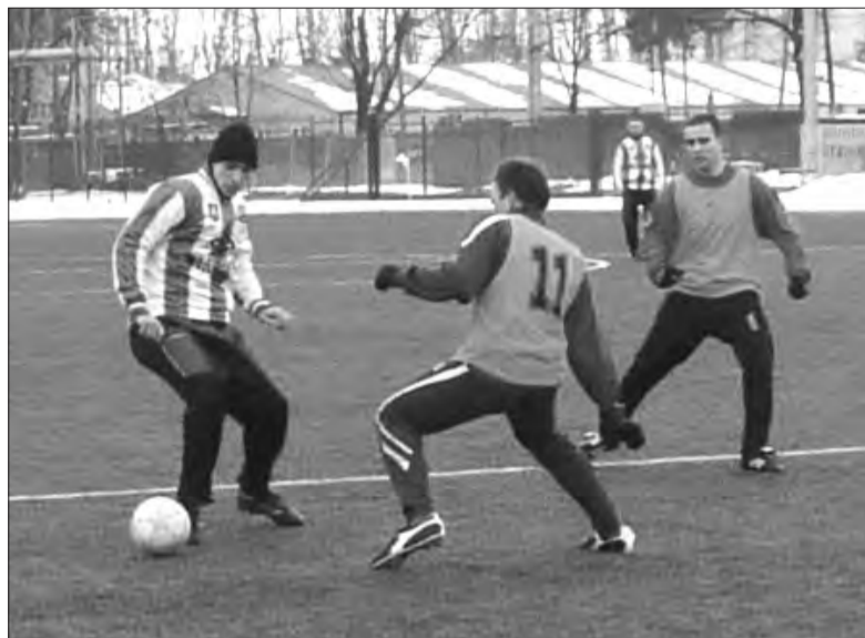
W trzech kolejnych sparingach Pelikan II przegrał - najwyżej z Woyem...