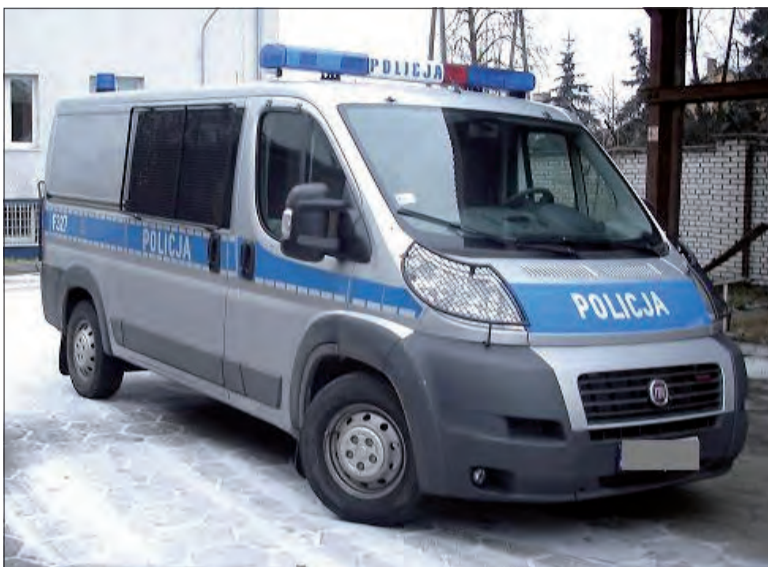
Nowe radiowozy na bazie Fiatów Ducato już jeżdżą po Łowiczu

Jest to samochód z osobnym przedziałem dla policyjnych funkcjonariuszy oraz osób zatrzymanych. Zatrzymani przewożeni będą w specjalnie do tego celu skonstruowanym i wzmocnionym przedziale