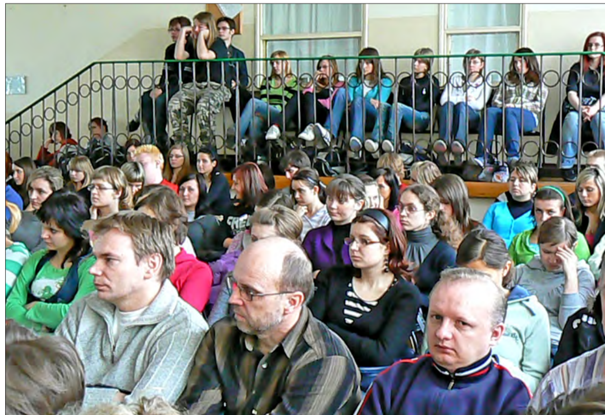
Tematyka była trudna, zwłaszcza do rozmów w tak szerokim gronie. Zachowanie młodzieży było nienaganne.