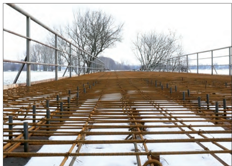
Na moście w Wierznowicach wykonane jest już zbrojenie płyty jezdnej, czeka ono obecnie na wylanie betonu.

Jeśli gminy zechcą współfinansować budowę chodników, będą musiały anulować wcześniejsze uchwały dotyczące współpracy z powiatem w zakresie prowadzenia inwestycji i podjąć uchwały o pomocy rzeczowej. (tb)