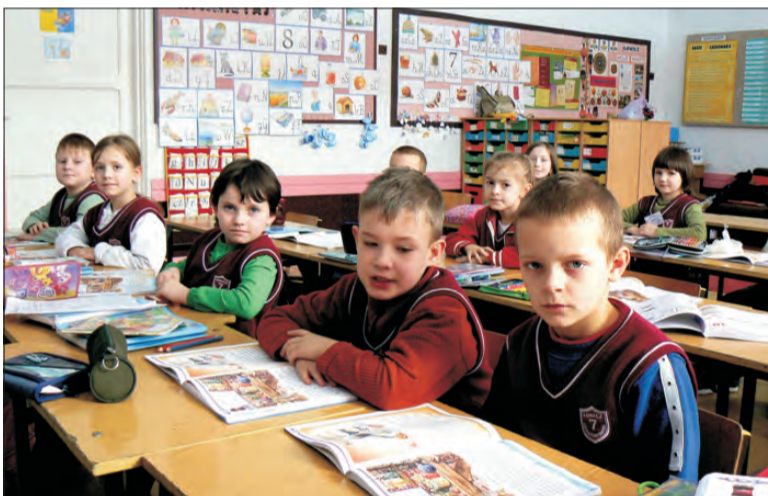
„Siódemka” jest jedną ze szkół, w której realizowany będzie projekt. Na razie lekcje w klasie I odbywają się według dotychczasowego programu.

Do realizacji projektu wybrano 6 województw, na liście tej znalazło się Łódzkie. Chęć wzięcia udziału w projekcie mogła wyrazić każda szkoła, ale o wyborze placówek decydowało losowanie. Ostatecznie w projekcie bierze udział 2.700 szkół w Polsce, w tym 360 w województwie łódzkim. Z naszego terenu są to: szkoły pod-