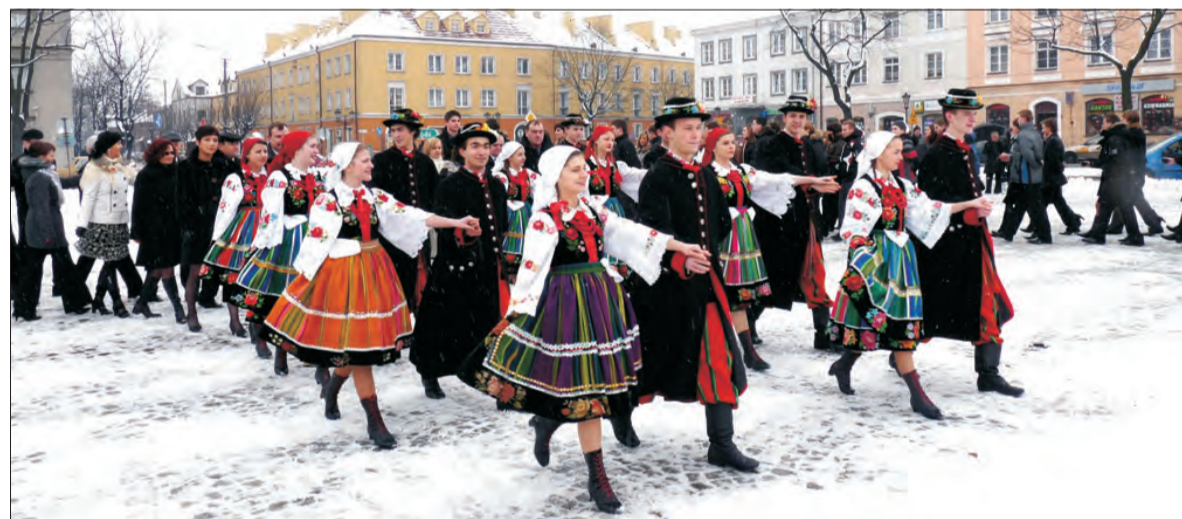
Polonez tańczony przez 200 osób na Starym Rynku w Łowiczu, w sobotę 14 lutego rozpoczął obchody 10-lecia powiatu łowickiego. Więcej o tej uroczystości piszemy na str. 14 - a o mniej nagłośnionej, jubileuszowej imprezie w Walewicach - na str. 2.

■ Rusza sezon koncertowy w Sannikach. czytaj na str. 6