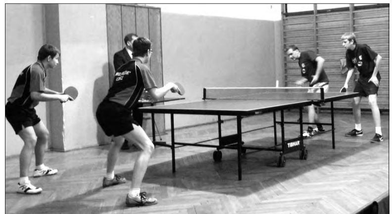
Pingpongiści Księżaka bez problemów wygrali z drugą drużyną Włókniarza Pabianice, tracąc tylko jeden punkt.

Kolejne mecze - 12. kolejki III ligi odbędą się w sobotę 22 lutego o godz. 16.00, a zagrają wówczas: GUKS Gorzkowice - Opoka Zduńska Wola, Włóknierz II Pabianice - UKS Bednary, Proсна Wieruszów - Macovia Maków, ULKS Moszczenica - UMKS Księżak Łowicz i Burza Pawlikowice - Elta II Łódź. (p)