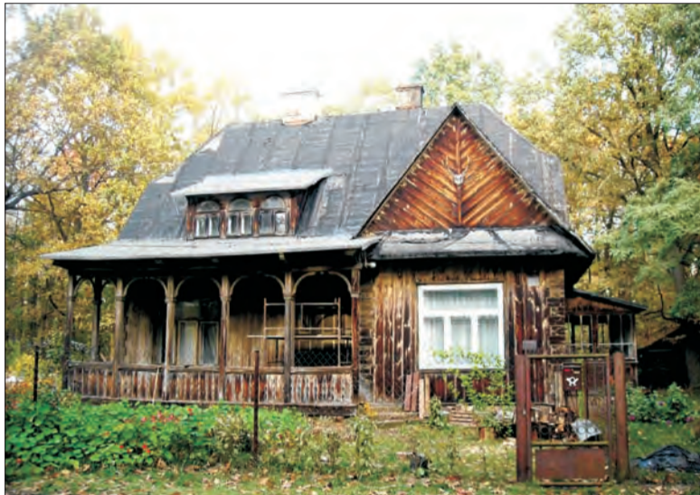
Piękna, stylowa leśniczówka - obiekt sporu.

Prowadzone przez prokuraturę postępowanie wykazało, iż umowa została sfalszowana - podpis Zofii Bogacińskiej na umowie nie został sporządzony przez nią.