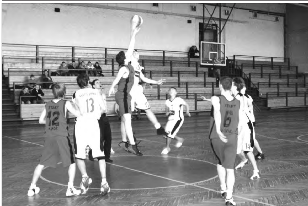
Kadeci Książaka wysoko przegrali w Łodzi ze Startem, ale mają nadal szansę na zajęcie czwarte miejsce w lidze U-16.

Koszykówka - 20. kolejka wojewódzkiej ligi kadetów U-16