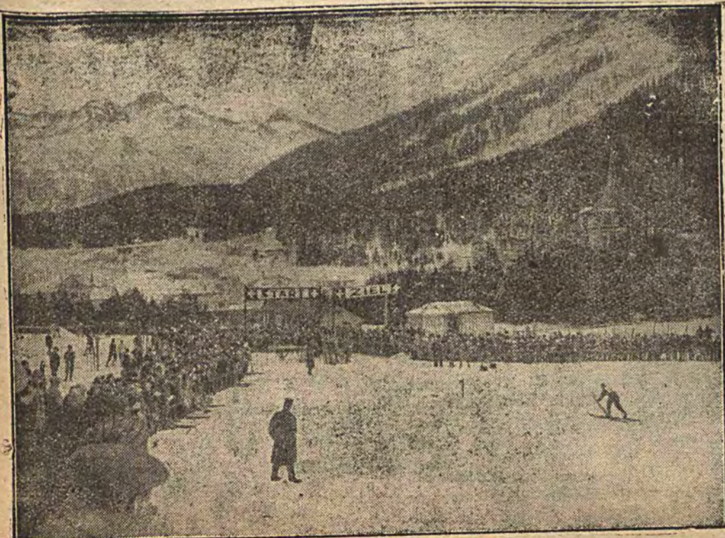
BIEG MARATONSKI NA NARTACH.

powiedział: „Będę niezawodnie okrzyknięty za wroga radja, ale muszę wyznać szczerze, że mi się amerykańskie radio wcale nie podoba. Mówię to z doświadczenia, gdyż ile razy w Ameryce słuchałem radja, zawsze słyszałem co najmniej tuzin i tyleż jazzbandów naraz.”