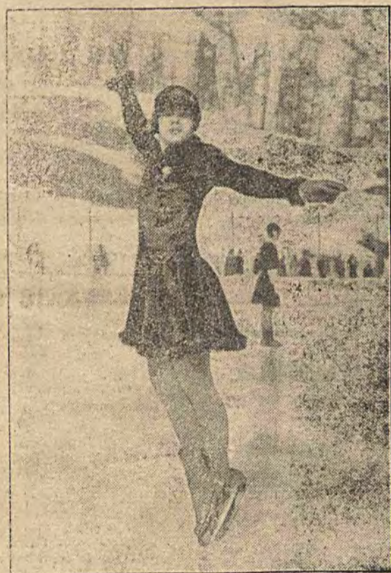
SONIA HENIE (Szwecja) mistrzyni świata w sporcie łyżwiarskim.