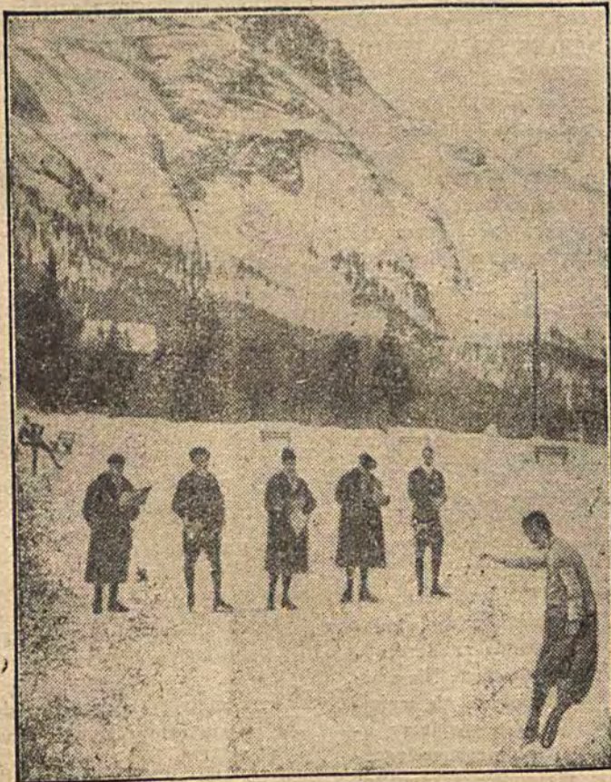
GRAFSTRÖM (Szwecja) Zwycięzca w jeździe na łyżwach.