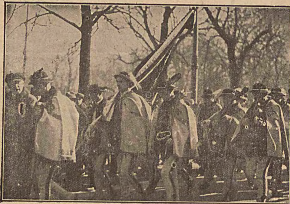
Z dalekich Karpat ściągnęli do Warszawy, by zmanifestować swoje wierne uczucia dla Wodza Narodu. Rody góralskie dały już Marszałkowi Piłsudskiemu liczną rzeszę tegich współpracowników, poczynając od lat wielu, przez Legjony Polskie, wojnę z bolszewikami i lata rozbudowy Państwa Polskiego.