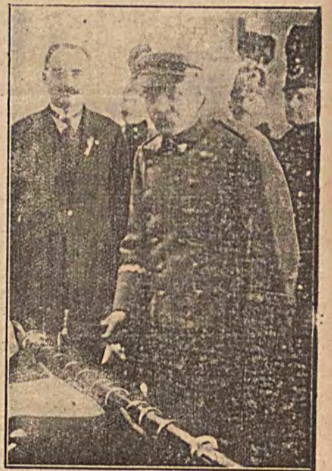
Na prośbę górników Marszałek Piłsudski wbił gwóźdź pamiątkowy w drzewce sztandaru. Lud św Barbary wie doskonale, w kim znajduje obrońcę, pamiętającego o twardej służbie górnika.