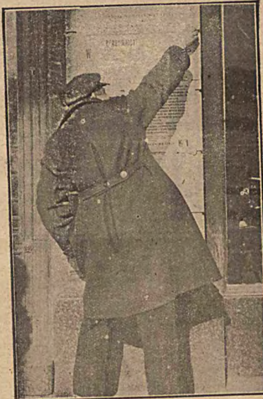
Partyjnicy są wściekli, że ich apetyty na mandaty i koncesje kończą się łaskiem. Naszemu fotografowi udało się sfotografować szkodnika, który zrywał plakat jedyńki. Oczywiście schwytany na gorącym uczynku najmita powędrował do kozy, ponieważ żadnych plakatów nie wolno zrywać w okresie wyborczym.