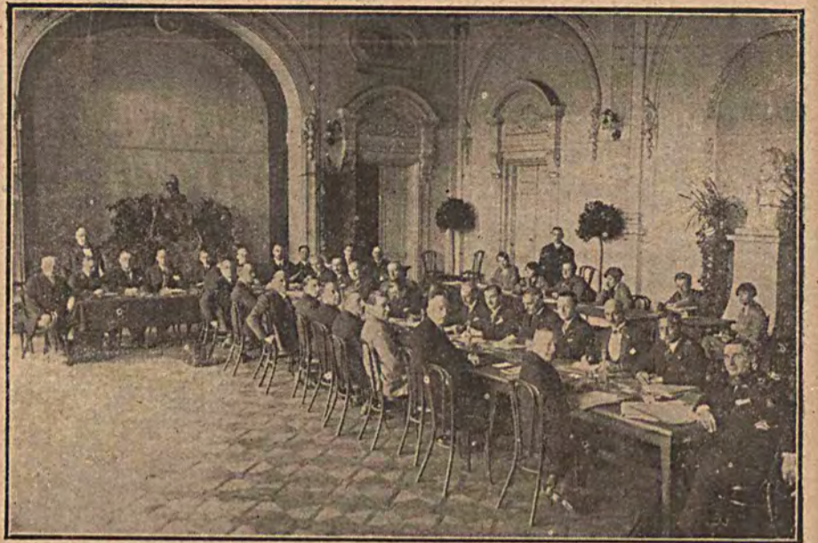
Odbył się w Warszawie przy udziale licznych delegatów zagranicznych wielomilijonowy kongres lotniczy. Następnym kongresem zbiera się w Londynie.