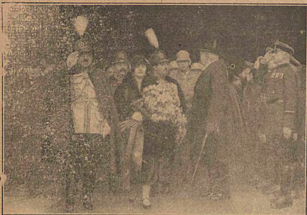
Przybycie króla Afganistanu do Berlina.