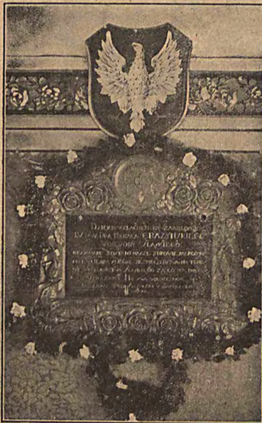
Może żaden z wojewodów polskich nie cieszy się taką powszechną miłością i szacunkiem wśród swoich obywateli, jak wojewoda Grażyński. Ale prawda jest, że p. Grażyński całe swoje życie poświęcił dla Ślązaków i przeżył z nimi razem dole i niedole powstań śląskich. Nasze zdjęcia przedstawiają: z lewej strony tablicę ku czci wojewody, którego staraniem została w Zakopanem willa „Ślązaczka” dla funkcjonariuszy policji państwowej; z prawej — willa „Ślązaczka” z gronem rekwalescentów.