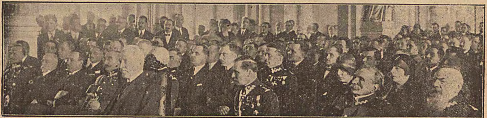
Po zjeździe inauguracyjnym federacji polskich związków obrońców Ojczyzny, w skład którego wchodzi: stowarzyszenie rezerwistów i b. wojskowych, związek legionistów polskich, ogólny związek podoficerów rezerwy, polska organizacja wolności, centralny związek osadników, legja inwalidów wojskowych, związek sybiraków, związek bjończyków, związek kaniowczyków, związek obrońców Lwowa i związek powstańców Górnego Śląska, uczestnicy w liczbie pięciu tysięcy udali się do Belwederu, by oświadczyć Naczelnemu Wodzowi i najbardziej zasłużonemu obywatelowi, że stowarzyszeni gotowi są w czasie wojny i pokoju w każdej chwili spełnić Jego wolę i rozkaz.