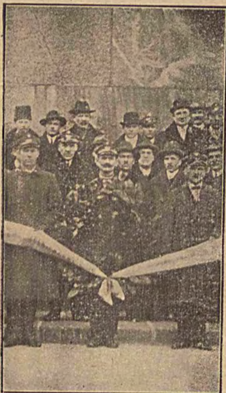
Przysposobienie wojskowe kolejarzy, zorganizowane pod obecnymi rządami, składa wieniec na grobie Nieznanego Żołnierza po bytności w Belwederze u Marszałka Piłsudskiego.