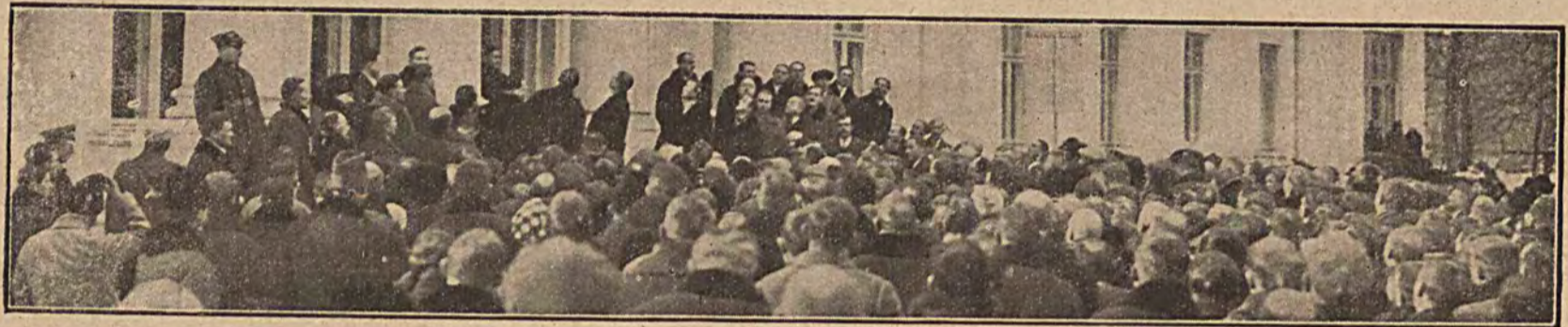
Ze wszystkich stron Rzeczypospolitej złożyło hołd Marszałkowi Piłsudskiemu w Belwederze. Na pytanie delegatów Marszałek wyraźnie oświadczył, że głosować należy na listę Nr. 1.