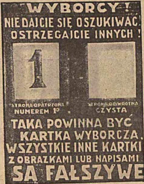
Już raz ostatni ostrzegamy naszych czytelników przed fałszywymi kartkami wyborczymi. Dobra kartka nie może zawierać oprócz jedyńki.