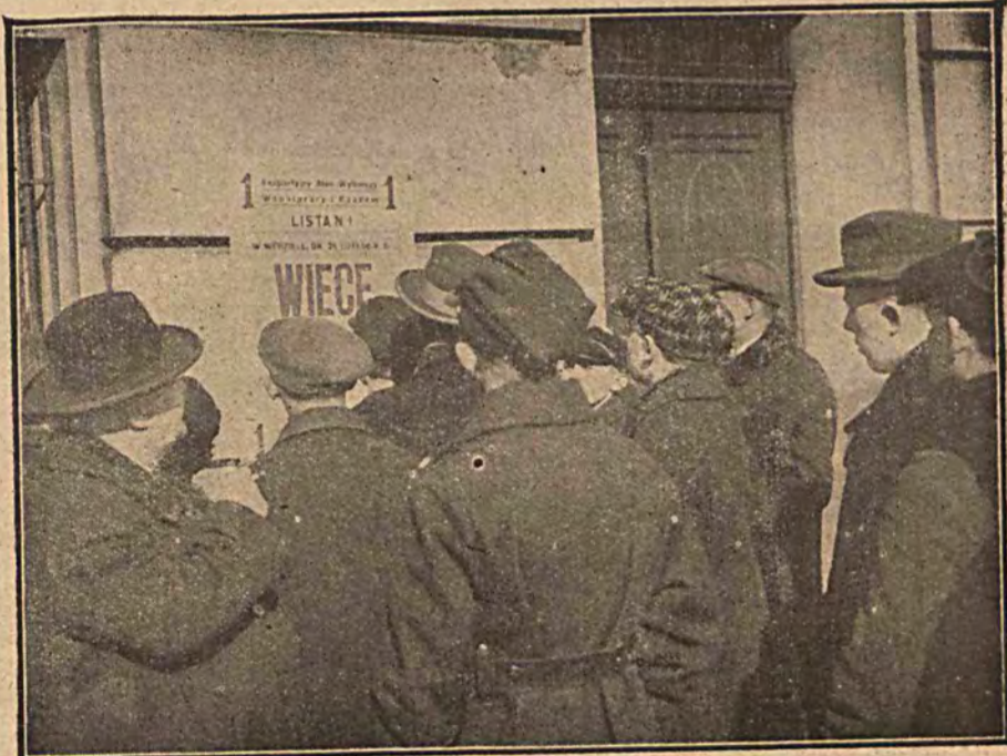
Gromadzą niezliczone tłumy, które pragną zmanifestować swoje uczucia w gładem Człowieka Opatrznościowego, jakim jest Józef Piłsudski, a jakiego historia Polski nie widziała od kilku wieków. Najlepsze zamiary—najlepszych ludzi tonęły zawsze w bloce partyjnicstwa. Dziś historia Polski odwróciła nową kartę. Cały naród to rozumie. Nasza ilustracja przedstawia obywateli czytających zapowiedzi wieców Bezpartyjnego Bloku Współpracy z Rządem, oraz słuchaczy przemówień wyborczych, wygłaszanych przez megalony.