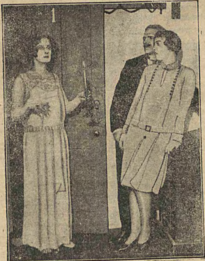
TRAGEDJA SZEKSPIRA W STROJACH NOWOCZESNYCH.

III WYDZIAŁ MINISTERSTWA Sketch w 1 odsłoni