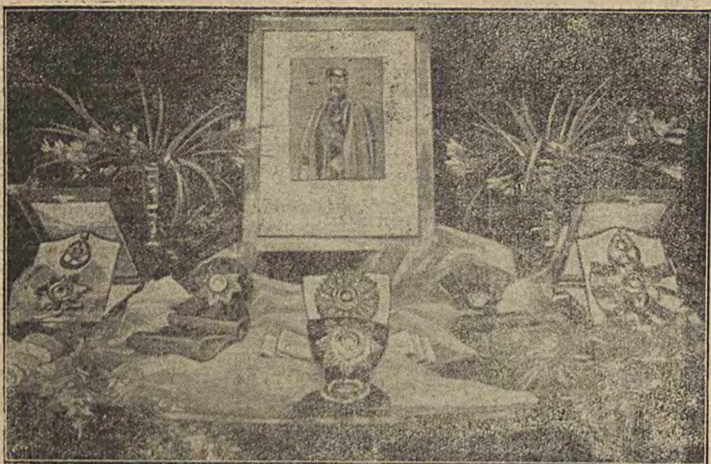
W Berlinie zostały wykonane najwyższe odznaczenia królestwa Afganistanu, które zostaną rozdane przez króla osobom na wyższych stanowiskach.