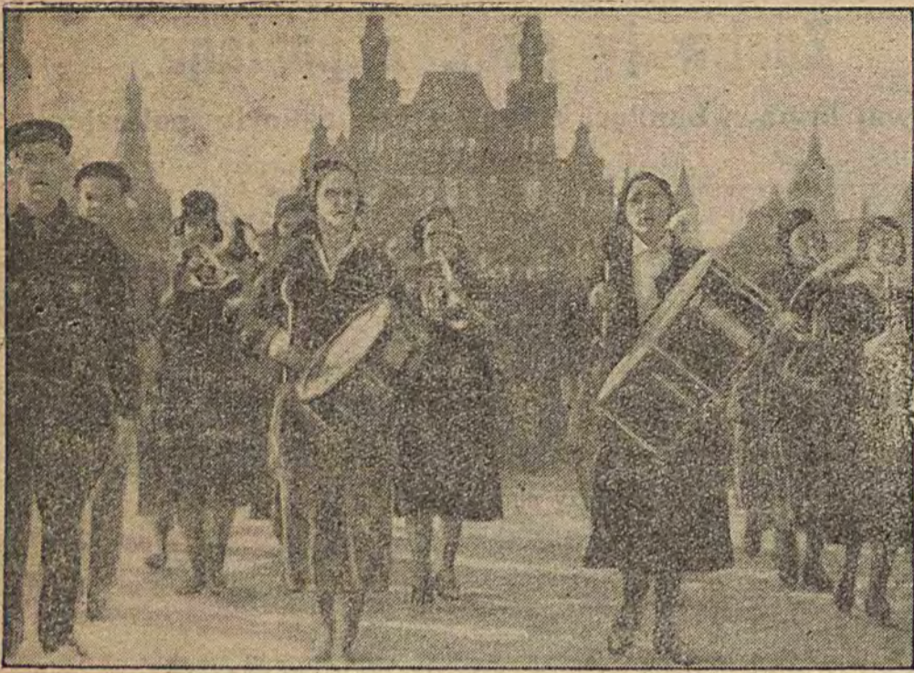
ORKIESTRA ARMII KOBIEC W SOWIETACH.