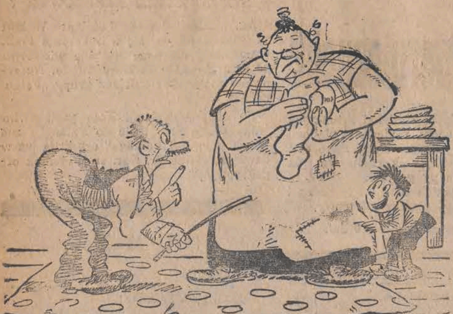
— Ty urwisie, pogadamy jeszcze, gdy matka wyjdzie!