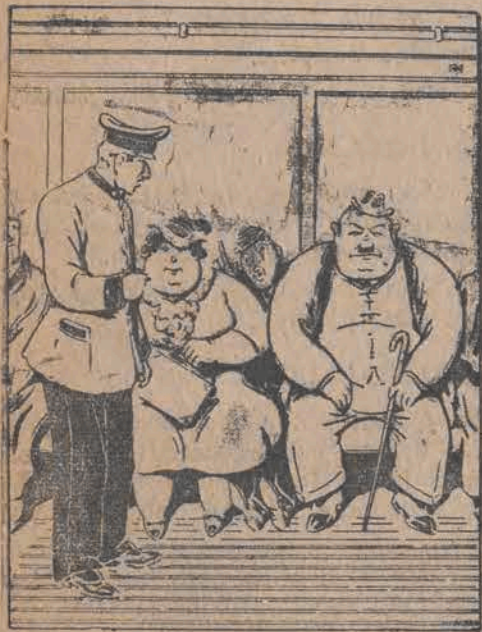
— Gdzie jest ten pan, który chciał się poskarżyć?