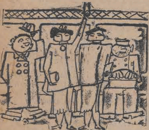
— Czy pozwolą panie, że starszej z nich zaoferuję miejsce ?!