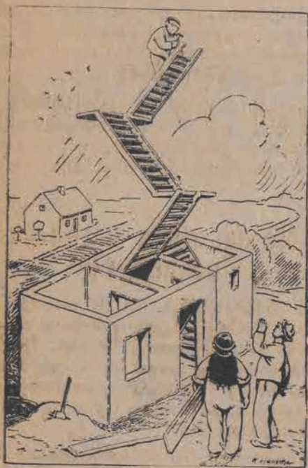
— Maksio, opanuj się już dosyć, przecież dom ma być jednopiętrowy.