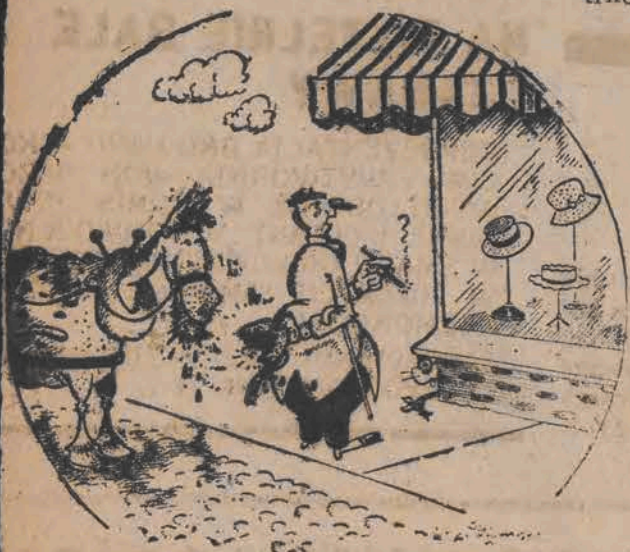
— Nie, w tym roku już nie kupię sobie kapelusza !