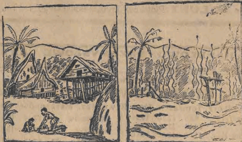
Barbarzyństwo i cywilizacja.

Duży wybór płyt gramofonowych i najlepszych igieł gramofonowych