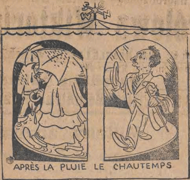
Francuska chorągiewka na pogodę.