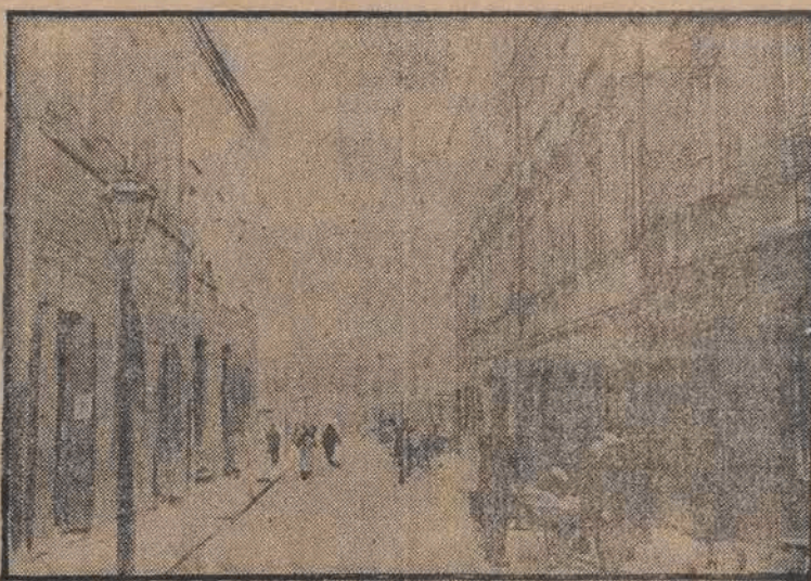
Kamienica przy ul. Podwale Nr. 46 (z prawej strony na zdjęciu) zagrożona poważnie możliwością zawalenia się.

W chwili obecnej najbardziej może zagrożone są domy, leżące przy ul. Podwale i ul. Jezuickiej. Ładna, kilkupiętrowa kamienica Nr. 46 nie wygląda wcale na to, aby miała jej coś grozić. A jednak o bezpieczeństwie mówi aż nazbyt dobitnie stemple, którymi podparto mury od tyłu.