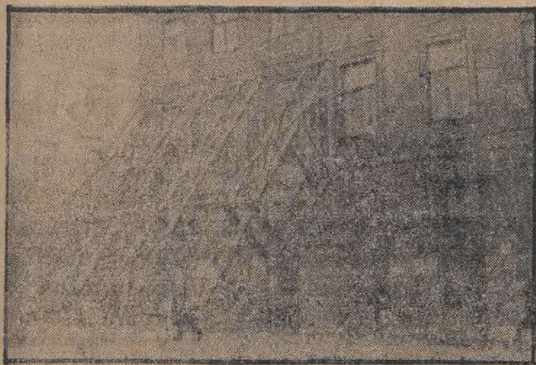
Kompleks podstemplowań, chroniących ścianę kamienicy przy ul. Podwale Nr. 18 przed zawaleniem się.

Zabytkowe dzielnice Starego Miasta w Warszawie, zabudowane po kilkaset lat liczącymi domami, od dawna już zagrożone są nieuchronną zgoną niektórych budynków.