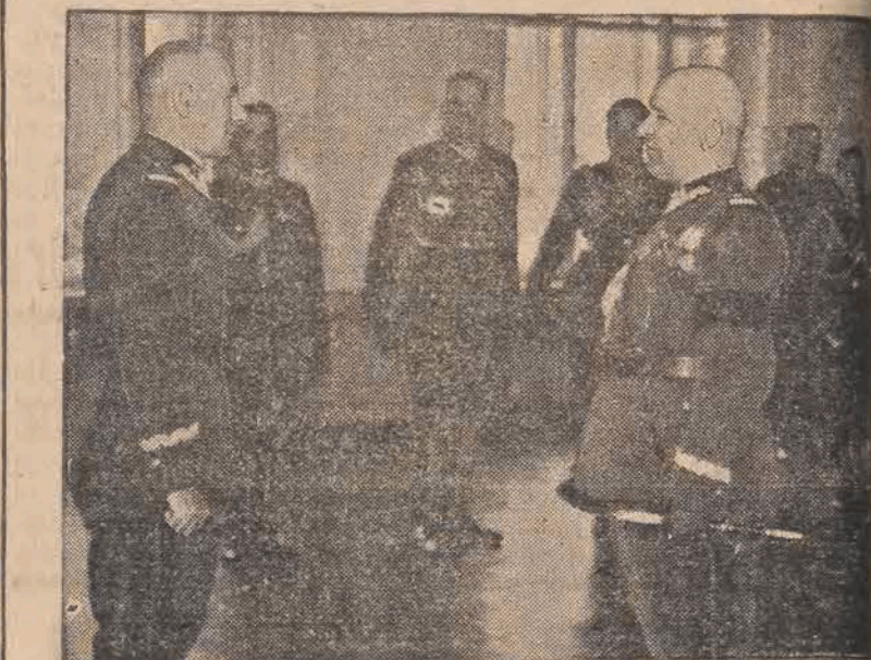
Z okazji uroczystości wręczenia pułkom broni pancernych sztandarów, Naczelny Wódz Pan Marszałek Edward Smigły Ryzd przyjął delegację wszystkich oddziałów wojsk pancernych.