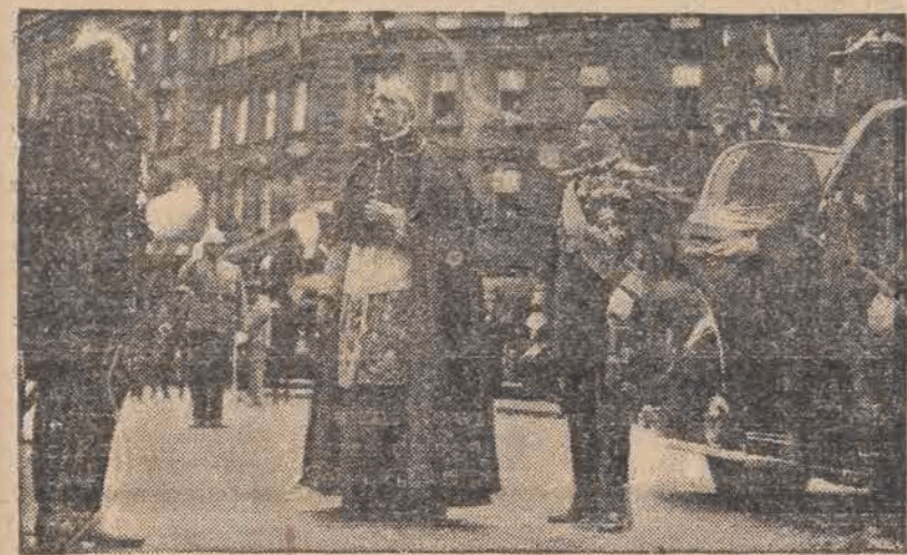
Zdjęcie przedstawia moment powitania w Budapeszcie przybyłego z Rzymu w charakterze delegata Ojca Świętego na kongres kardynała Pacellego, sekretarza stanu w Watykanie.