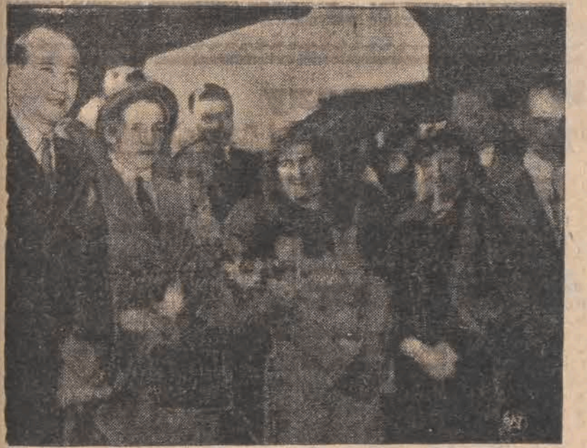
Reprodukcujemy zdjęcie, otrzymane w drodze telegraficznej ze Sztokholmu, przedstawiające moment powitania p. min. Becka i jego małżonki na dworcu głównym w Sztokholmie.

SZTOKHOLM. — Pierwszy dzień pobytu min. Becka w Sztokholmie wypełniły wizyty o charakterze oficjalnym. Min. Beck był przyjęty przez min. Sandlera. Wizyty te dały sposobność do wstępnej wymiany poglą- dów o charakterze ogólnym, któ- rą ministrowie Polski i Szwecji prowadzić będą dalej w następ- nych dniach, przy czym szcze- gólnie popołudnie piątkowe za- rezerwowane zostało na rozmó- wy polityczne.