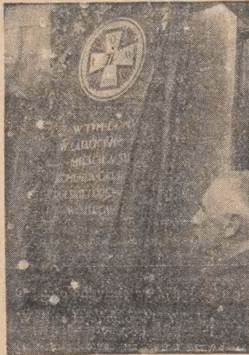
Ostatnio odbył się we Włocławku zjazd historyczny okręgu pierwszego P. O. W.

Wojewoda pomorski Władysław Raczkiewicz odsłania tablicę pamiątkową na domu przy ul. Kościuszki nr. 4 we Włocławku, w którym mieściła się komenda okręgu I-go P. O. W.