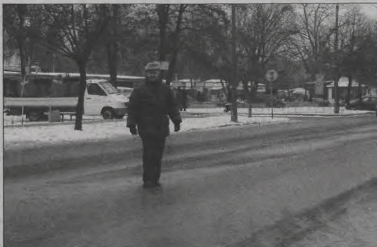
Jeszcze w tym roku osoby przechodzące przez ulicę Starzyńskiego w tym właśnie miejscu będą miały okazję skorzystać z przejścia dla pieszych z tzw. azylem (wysepką na środku ulicy).

W pierwszej kolejności miasto zamierza rozpocząć budowę nowego przejścia dla pieszych, z wysepką na środku ulicy, na wysokości bloków nr 4 i 5 osiedla Starzyńskiego. Wybudowany zostanie także chodnik prowadzący od bloków do krawędzi jezdni, aby piesi kierowali się na przejście wyraźnym szlakiem komunikacyjnym.