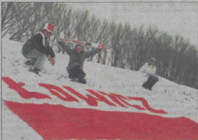
To tę właśnie flagę oglądali na ekranach swoich telewizorów miliony ludzi w Polsce i na świecie. Na zdjęciu: próbne rozłożenie na łąkach nad Bzurą.