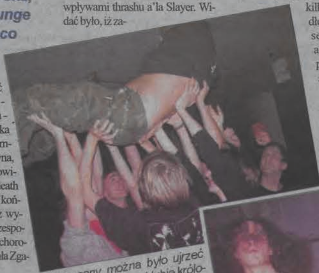
Takie sceny można było ujrzeć wśród publiczności, gdy w klubie królowali death metal.

Wieczór rozpoczął się i zakończył muzyką reggae, jako że na koniec zagrała grupa o wdzięcznej nazwie SPT - Soki Puszcza Truskawa, która na powrót rozbijała zgromadzoną na sali publiczność.