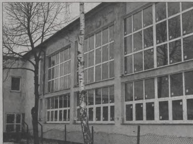
Już od września przyszłego roku szkolnego hala udostępniona będzie uczniom kompleksu szkół w Bolimowie.

niądze z 1 miliona 680 tysięcy wyłożyła sama gmina. Tyle kosztować ma dokończenie inwestycji, która w całości od początku jej budowy kosztować będzie 2 miliony 100 tysięcy złotych.