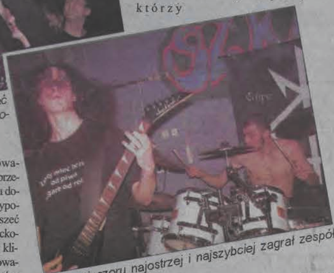
Tego wieczoru najostrej i najszybciej zagrał zespół Eclipse Extreme.

Koncert przyszedł się wyśzaleć okupowali teren pod sceną, reszta siedziała przy stolikach popijając piwo, rozmawiając. Ochrona wydawała się zbyteczna. Niezbyt pozytywnie natomiast zapamiętaliśmy występ kolejnego wykonawcy, łowickiej grupy Gene-