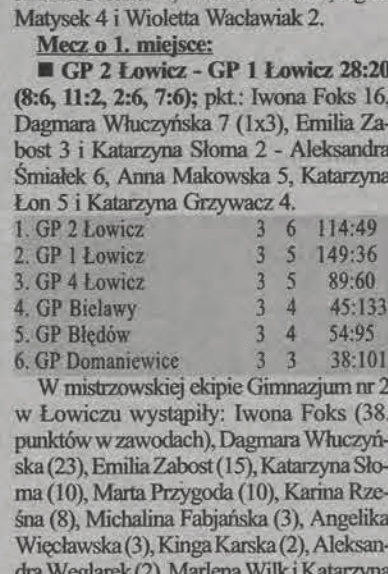
Liderką zespołu GP 2 jest Iwona Foks.

Łowicz, 21 stycznia. Podobnie jak rok temu zwycięzca eliminacji miejskich został