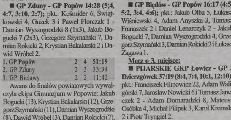
Wszystkie miejsca na podium zajęły szkoły z Łowicza...

■ GP 3 Łowicz - GP Popów 30:18 (4:2, 5:6, 2:4, 6:4, 14:2); pkt.: Maciej Rybus 13,