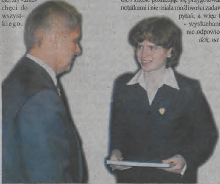
Premier Marek Belka w rozmowie z uczennicą klasy III d Kingą Figat.

Dyrektorowi Henrykowi Zasepie premier dał w prezencie laptopa, drugiego laptopa - dla nauczycieli - dał w prezencie minister rolnictwa Wojciech Olejniczak. Laureaci i finaliści olimpiad przedmiotowych dostali w prezencie albumy o drodze Polski do EU i pióra. Samej szkoły premier jednak nie odwiedził, spotkanie odbyło się w południe 31 stycznia w sali barokowej łowickiego muzeum. Oprócz licznie przybyłych licealistów z „Chelmońskiego” zaproszono na niekiluosobowe delegacje ze wszystkich szkół średnich. Spotkanie z premierem było jednak bardzo oficjalne, młodzież mówiła o sobie i szkole posilkując się przygotowanymi notatkami i nie miała możliwości zadawania pytań, a więc także - wysłuchania na nie odpowiedzi. dok. na str. 6