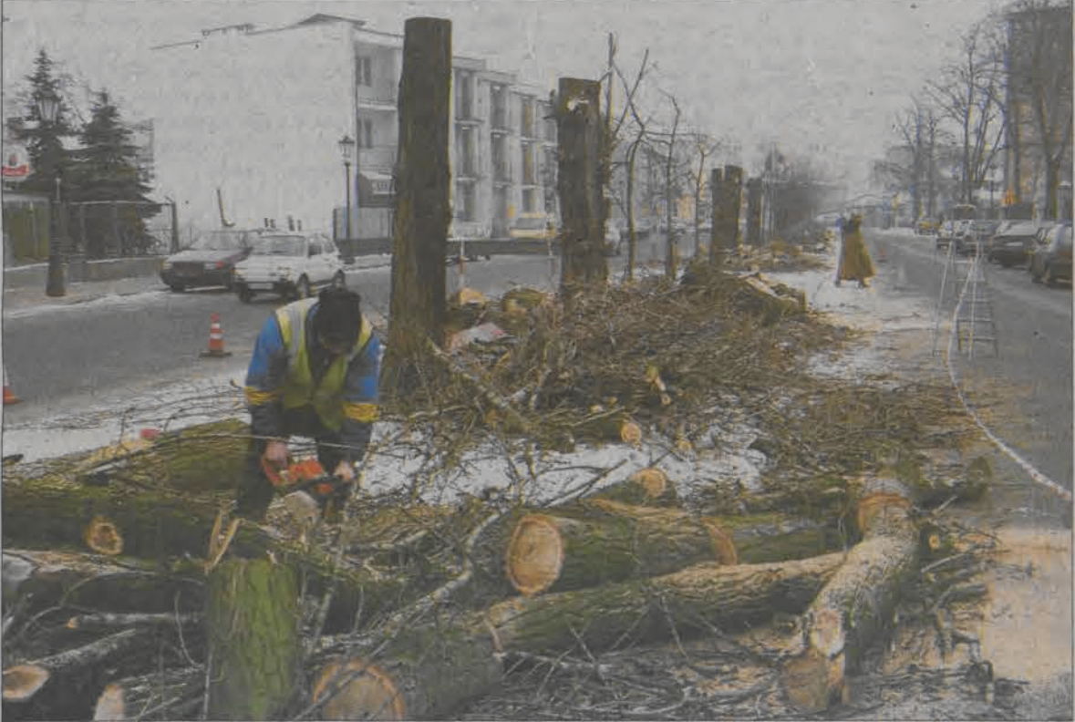
Tak wyglądał skwer w Alejach Sienkiewicza w sobotę 29 stycznia, obecnie nie ma już śladu po pniach topól.