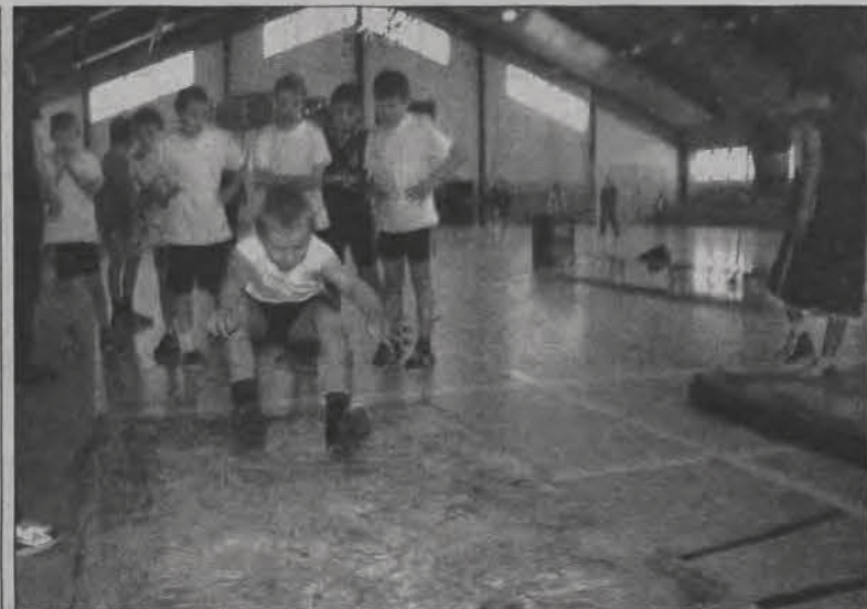
Jedną z konkurencji Trójboju LA był skok w dal z miejsca.

Lekka atletyka - druga runda V edycji Ligi Trójboju