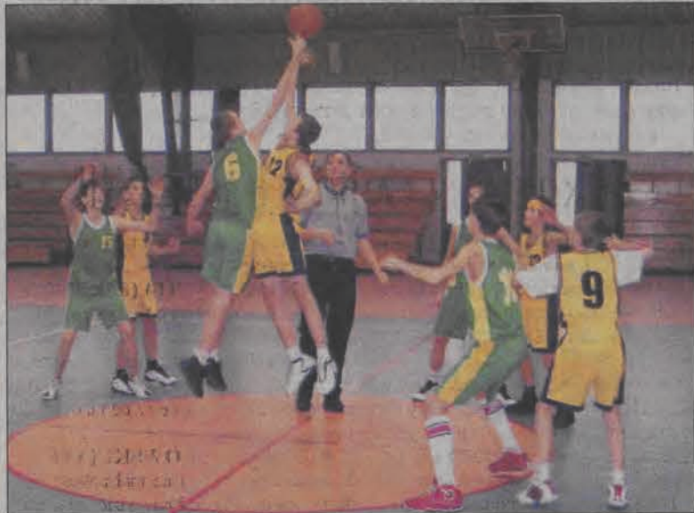
Łowiczanie znacznie lepiej zagraли w drugiej połowie...

Koszykówka - 4. kolejka finałów wojewódzkiej ligi kadetek o miejsca 1-6