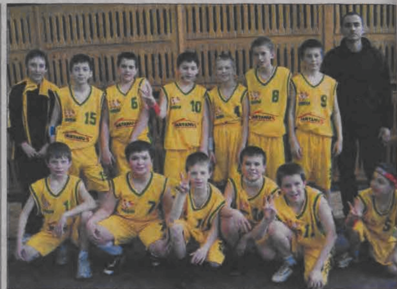
Dwa zwycięstwa w Łodzi wywalczył team Księżaka I Łowicz.

Koszykówka - 1. kolejka wojewódzkiej ligi żaków