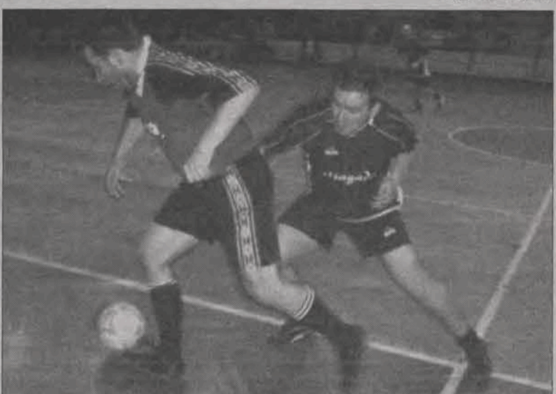
Vagat Domaniewice w ostatnim swoim meczu jedynie zremisował z Hurtownią Magado, straciwszy w ten sposób miejsce na podium.