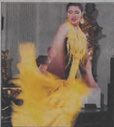
Flamenco w sali barokowej? Czemu nie. Występ został nagrodzony okłaskami na stojąco.

Zespół Funny Fingers powstał w 1999 roku. Tworzą go czterej młodzi muzycy grający na instrumentach akustycznych. Trzej z nich mają wyższe wykształcenie muzyczne (Akademia Muzyczna w Łodzi), zaś czwarty skończył Akademię Sztuk Pięknych. Do Łowicza przyjechały też dwie tancerki flamenco współpracujące na stałe z zespołem. Muzyka, którą prezentuje zespół jest wynikiem zainteresowań członków zespołu flamenco, jazzem, muzyką latynoamerykańską i arabską. Instrumentaliści z Funny Fingers zaimponowali w Łowiczu