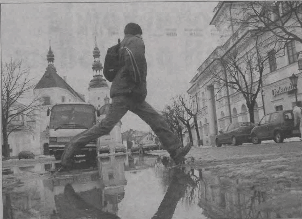
W ubiegłym tygodniu Stary Rynek tonął w błocie i bez takich skoków trudno się było poruszać. Po nowych opadach śniegu, po raz pierwszy od lat, ratusz wziął się za jego wywożenie. Oby następnej zimy o tym nie zapomniano i oby dobrze, na całej szerokości, odśnieżano miejskie ulice. Na razie zaparkować przy krawężnikach nie sposób.

Autobus wożący robotników do Warszawy utknął w zaspie w Bednarach, tu na pomoc przyszli członkowie Ochotniczej Straży Pożarnej w Bednarach, którzy samochód wyciągnęli. Autobusy miały także problemy na terenie gminy Chaśno na drodze Łowicz - Kiemozia. Na wysokości wsi Chaśno i Goleńsko śniegu było tak dużo nawiane na drogę, że powstał długi korek samochodowy. Problemy miały także busey wożące pasażerów przez Stachlew do Skiernewic. Na trasie tej drogi są bardzo wąskie i lekkie busey w odróżnieniu od ciężkich autobusów nie mogły pokonać wysokości zasp śnieżnych. Musiały one zmieniać swoje trasy. - Trzeba przyznać, że w wielu trudnych momentach kierowcy autobusów mogli liczyć na pomoc innych kierowców i mieszkańców wsi, przez które jeżdżą, rolnicy z dużym poświęceniem wyciągali nasze autobusy z zasp - powiedział nam kierownik