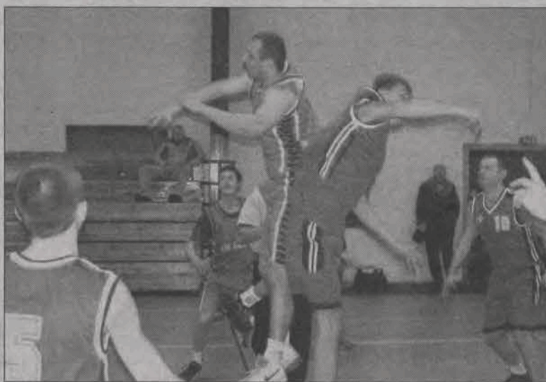
W ostatnim meczu 1. kolejki Energobudowa ograła No Name...

W tym spotkaniu o końcowym wyniku decydowała druga kwarta. Ekipa No Name po dziesięciu minutach gry dostała zadyszki, a rywal, który dokonywał zmian prawie hokejowych, wykorzystał to bezlitośnie,