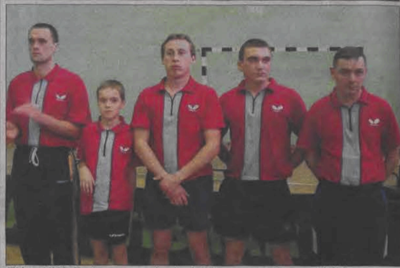
Ekipa UKS Bednary wywalczyła kolejne zwycięstwo w III lidze.

Tenis stołowy - 14. kolejka III ligi mężczyzn