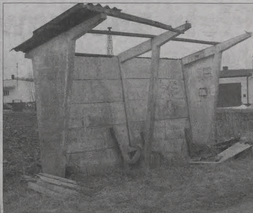
Tak wygląda wiata przystankowa w Jeziorku, która prawdopodobnie będzie rozebrana.