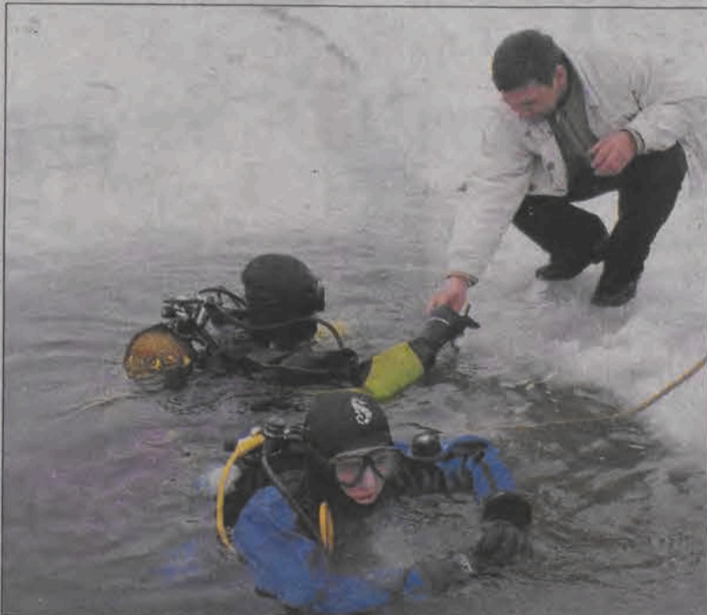
Nurkowanie podlodowe odbywa się zawsze parami i z asekuracją z łądu. Dodatkowym zabezpieczeniem jest lina.

Bardzo trudne i ryzykowne jest natomiast nurkowanie pod lodem. Działanie takie reguluje szereg zasad, które łowiccy płetwonurkowie przerobili w praktyce. A więc po wycięciu przerembla, wyciętego kawałka