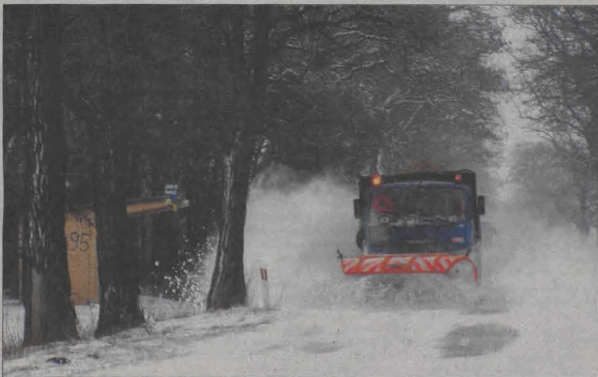
Bez względu na to, jakiemu zarządowi dróg podlegały, plugi śnieżne miały ostatnio wiele pracy. Nadchodzące dni też mogą być trudne - zapowiadane są kolejne opady.