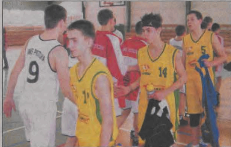
Młodzicy Księżaka nieznacznie przegrali z Piotrcovią.

Szkoda tego spotkania, bo była szansa na zwycięstwo. Po tej porażce ekipa Księżaka zajmuje drugie miejsce w tabeli ligi wojewódzkiej młodzików. (z)