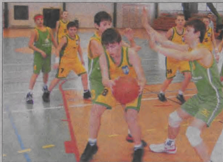
Ekipa Księżaka II odniosła zdecydowane zwycięstwo nad Junakiem.

Jednak w pierwszych dwóch kwartach nie było najlepiej. W drużynie tej zabrakło gry zespołowej i gry w obronie. Na szczęście goście byli bardzo nieskuteczni i nie potrafili tego wykorzystać. (z)