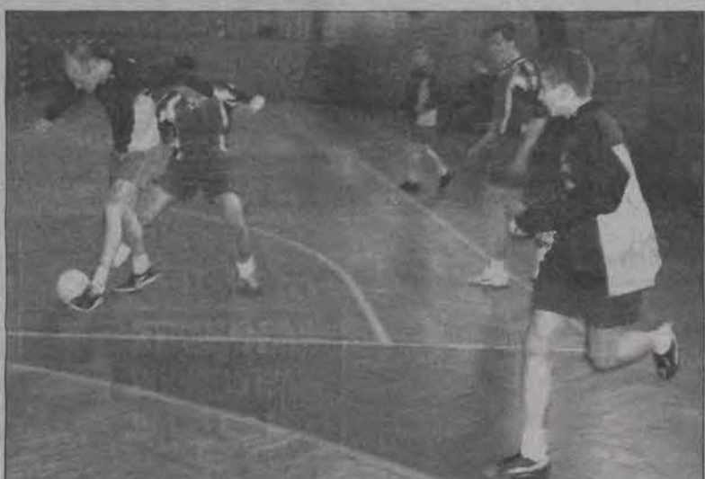
W ostatnim meczu sezonu ekipa RTS pokonała TKKF Księżak 4:2.

■ JA-RO Łowicz - PELIKAN-88 I Łowicz 0:4 (0:1) ; br.: Mateusz Dur (13), Maciej Rybus 2 (24 i 27) i Konrad Bolimowski (28).