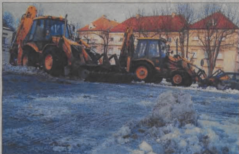
We wtorek w kilku miejscach w Łowiczu zabrano się za usuwanie śniegu z miasta. Złośliwi mówili, że to dlatego, iż Łowicz odwiedził ambasador USA. Więcej ambasadorów!