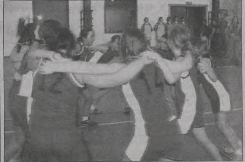
Ekipa „Czwórki” raz w Kutnie wygrała, a raz przegrała...