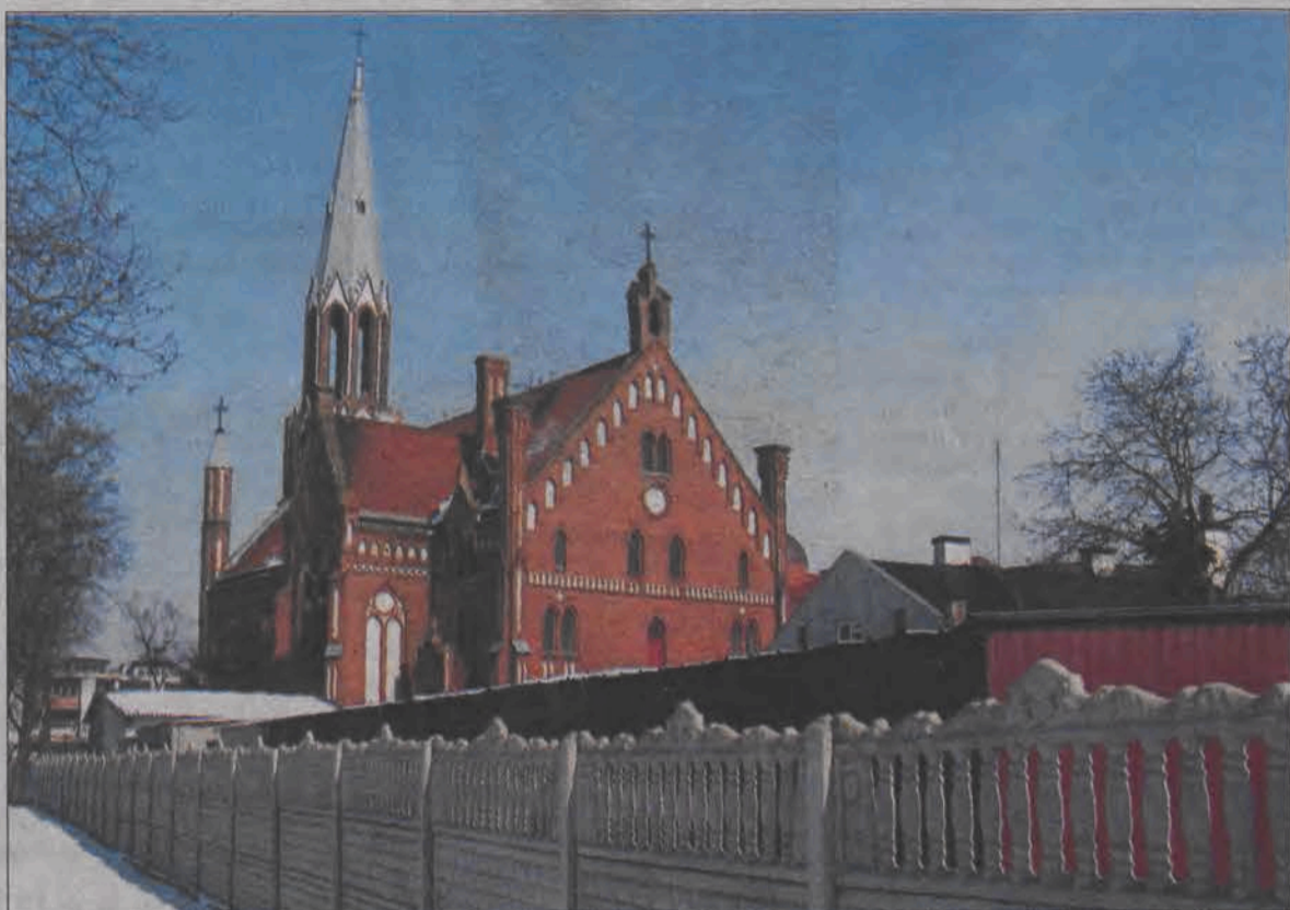
Kiedyś był tu rozwalający się płot i krzaki. Teraz jest przynajmniej czysto, ale niezgodnie z wymogami konserwatorskimi. Płot i garaże muszą być rozebrane.

Wśród prac, które parafia wykonała na kościele, proboszcz wymienił m.in. zaimpregnowanie drewnianej konstrukcji podtrzymującej dach, podwiązanie miedzianym drutem poszycia kościoła, do bruty stalowe przerdzewiały, wymieniane blacharki dachowej i rynien. Naprawiono też ogrodzenie od strony Alei Sienkiewicza oraz bramę wejściową, dokonano demontażu i ustawienia nowych kopuł dwóch wieżyczek stojących po prawej i lewej stronie dużej wieży ko-