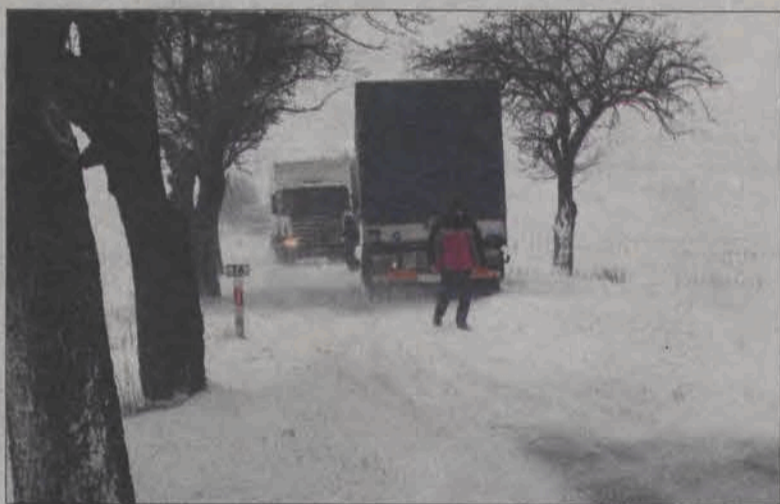
Zamieć unieruchamiała niekiedy nawet ciężarówki i autobusy. Na zdjęciu zator na trasie Łowicz - Bielawy na wysokości Bochenia w poniedziałek 7 marca.