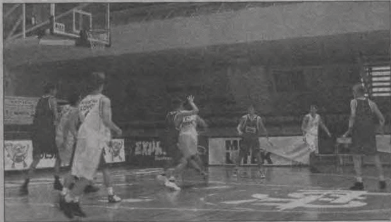
Tym razem w hali ŁKS o zwycięstwo nie było łatwo...