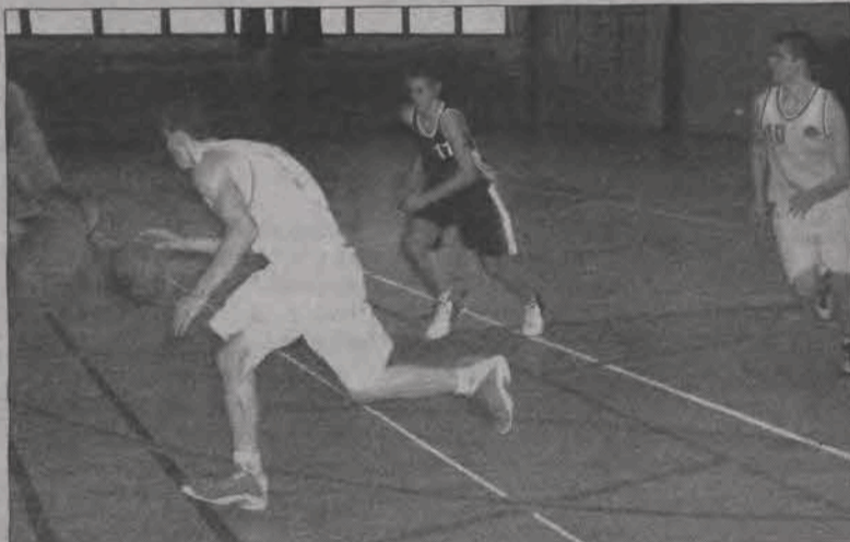
Kadeci w Pabianicach rozegrali nieco słabsze spotkanie...

Podopieczni trenera Cezarego Włuczynskiego w pierwszej odsłonie prowadzili wyrównany pojedynek i nie nie zapowiadało końcowego niekorzystnego wyniku. Jednak w drugiej kwarcie było tragicznie. Zawiodła skuteczność na linii rzutów wolnych. Łowiczanie spudłowali aż 8 razy i po 20. minutach gry przegrywali 26:46. To