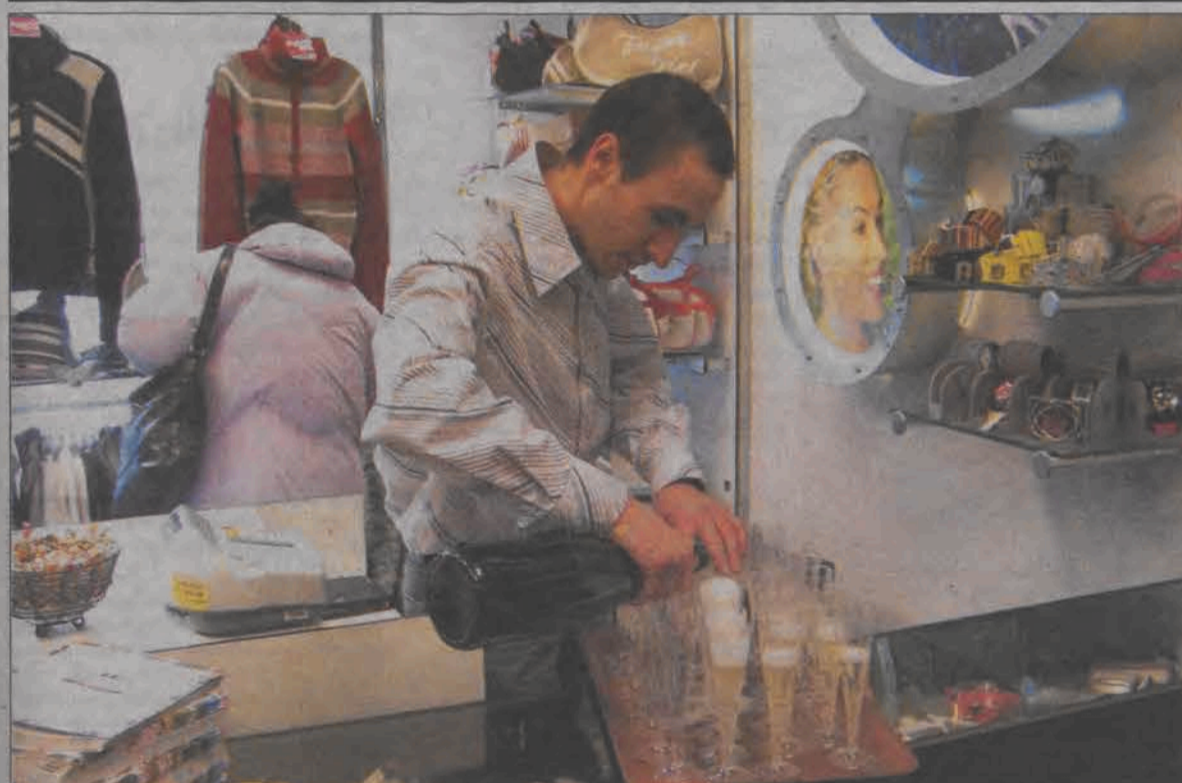
Otwarcie sklepu Reporter - klienci dostali spore zniżki i poczęstowano ich szampanem.

maczył policjant osobom chcącym wejść do bloku, w którym mieszkają. Na starszych, pamiętających powojenne czasy pocisk nie zrobił zbyt dużego wrażenia. - Blok był stawiany w 1963 roku, a wcześniej były tutaj sad i ogródki. Jak byłem mały to się bawiliśmy takimi pociskami tutaj i w Mysłakowie... - opowiadał jeden z mieszkańców. (mak)