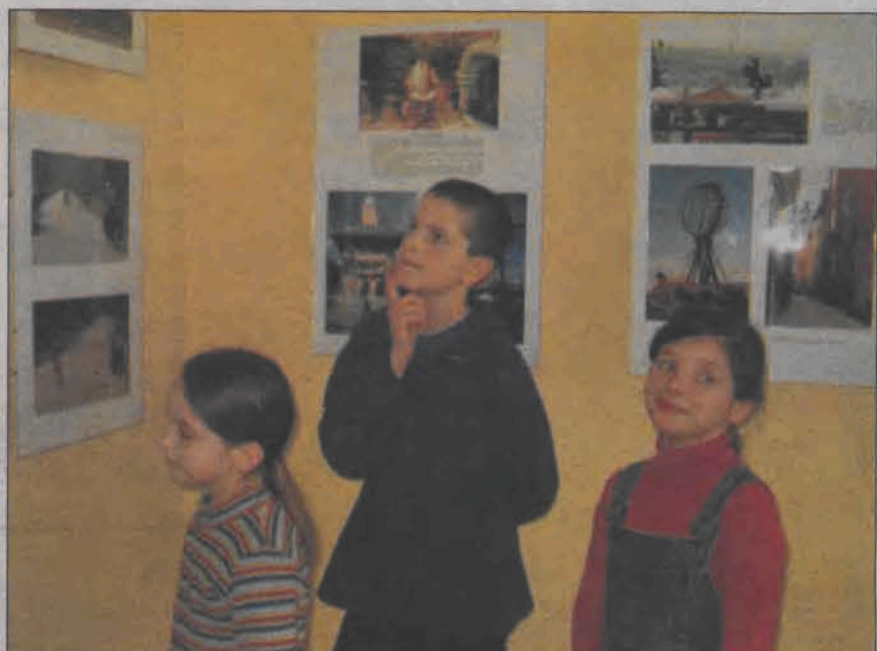
Jeszcze tylko dziś i jutro oglądać można w GOK w Domaniewicach wystawę fotografii Radosława Taflńskiego z jego podróży po północnych krańcach Półwyspu Skandynawskiego. Do dziś obejrzało ją już około pięciuset osób, z zaciekawieniem spoglądając na fotosy przedstawiające renifery, zachody słońca, architekturę dalekiej północy i tamtejsze krajobrazy.