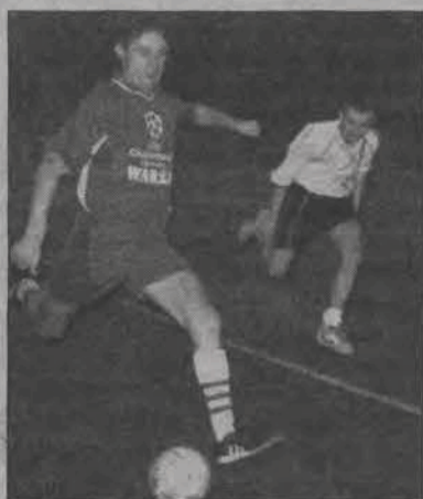
Awans do I ligi wywalczyły zespoły Cavalieros i Blockersów.

■ VICTORIA Bielawy - BLOCKERSI Łowicz 1:6 (0:3) ; br.: Przemysław Grzego-