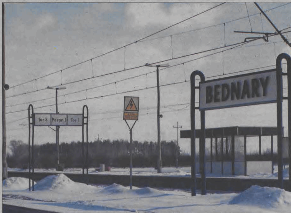
Po niedawnych zmianach w rozkładzie jazdy, pociągi zatrzymują się na stacji w Bednarach coraz rzadziej. Najgorsze, iż ostatni pociąg z Warszawy dojeżdża obecnie tylko do Sochaczewa.

w Łowiczu i przez Mysłaków, Janowice i Bednary dojechał właśnie do Sochaczewa, w powrotnej drodze zabierając pasażerów jadących z Warszawy.