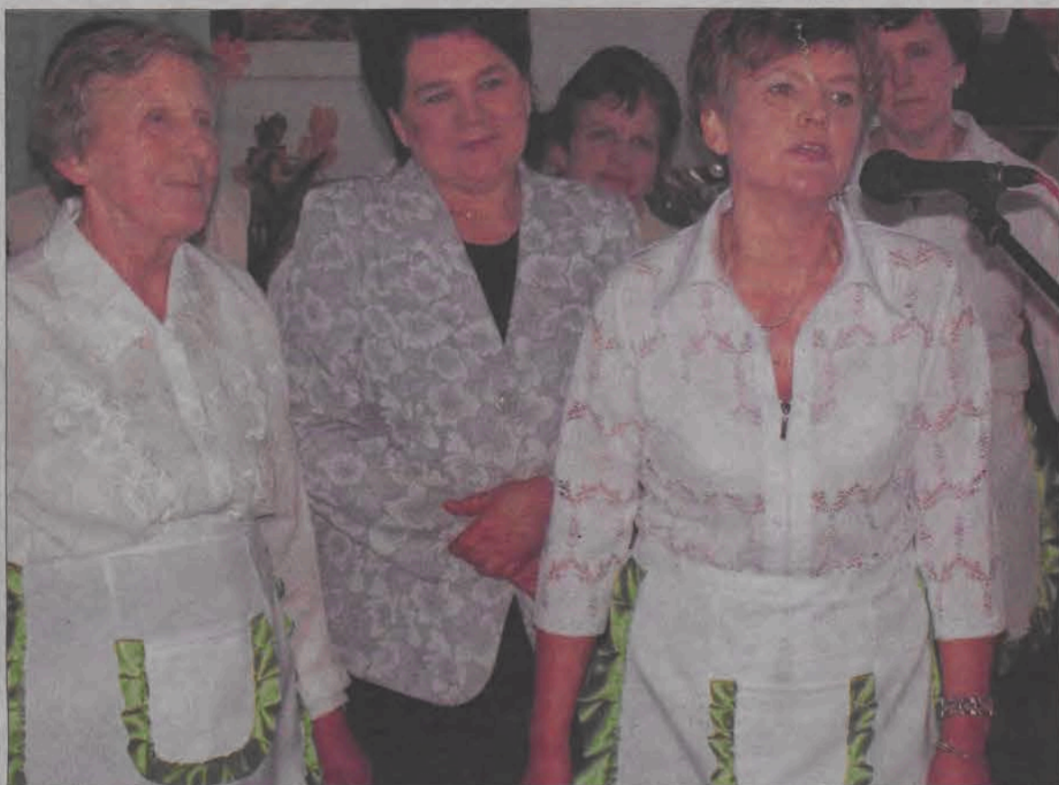
Członkinie KGW w Popowie powitały zebranych ludową przyspiewką. Uwagę zwracały estetycznymi fartuszkami.