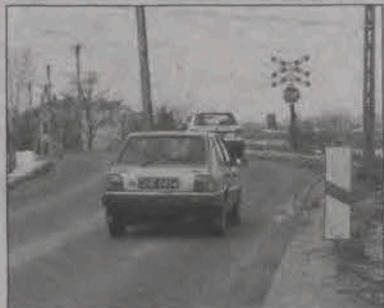
Ruch pojazdów na przejeździe kolejowym na ul. Klickiego jest duży. Przejeżdżając go należy pamiętać, że nie jest on już strzeżony.