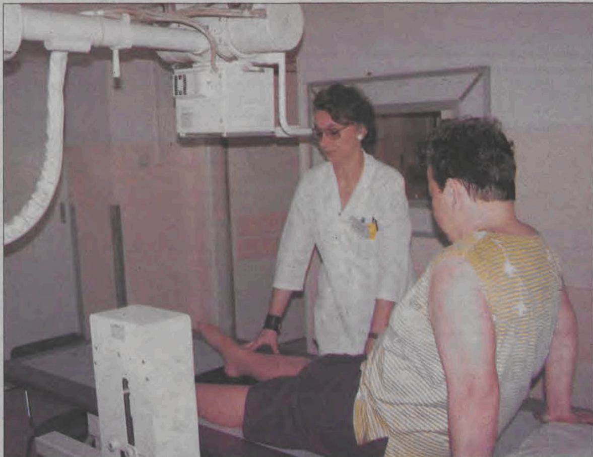
Przez długi czas nowszy aparat rentgenowski był unieruchomiony. Obecnie od stycznia dzięki zakupionej lampie znów można wykonywać nim zdjęcia.

Nową lampę do działającego od 10 stycznia aparatu rentgenowskiego kupiono za kwotę 48 tysięcy złotych. O tym, na co przeznaczone zostaną inne pieniądze rozmawialiśmy z wicedyrektorem Kaźmierczakiem, który twierdzi, iż w najbliższym czasie łowicki szpital wzbogaci się o spirometr - urządzenie służące do badania układu oddechowego. Spirometr kosztował będzie w granicach 10 - 12 tysięcy złotych, jest on wykorzystywany przy wszystkich schorzeniach związanych z układem oddechowym.