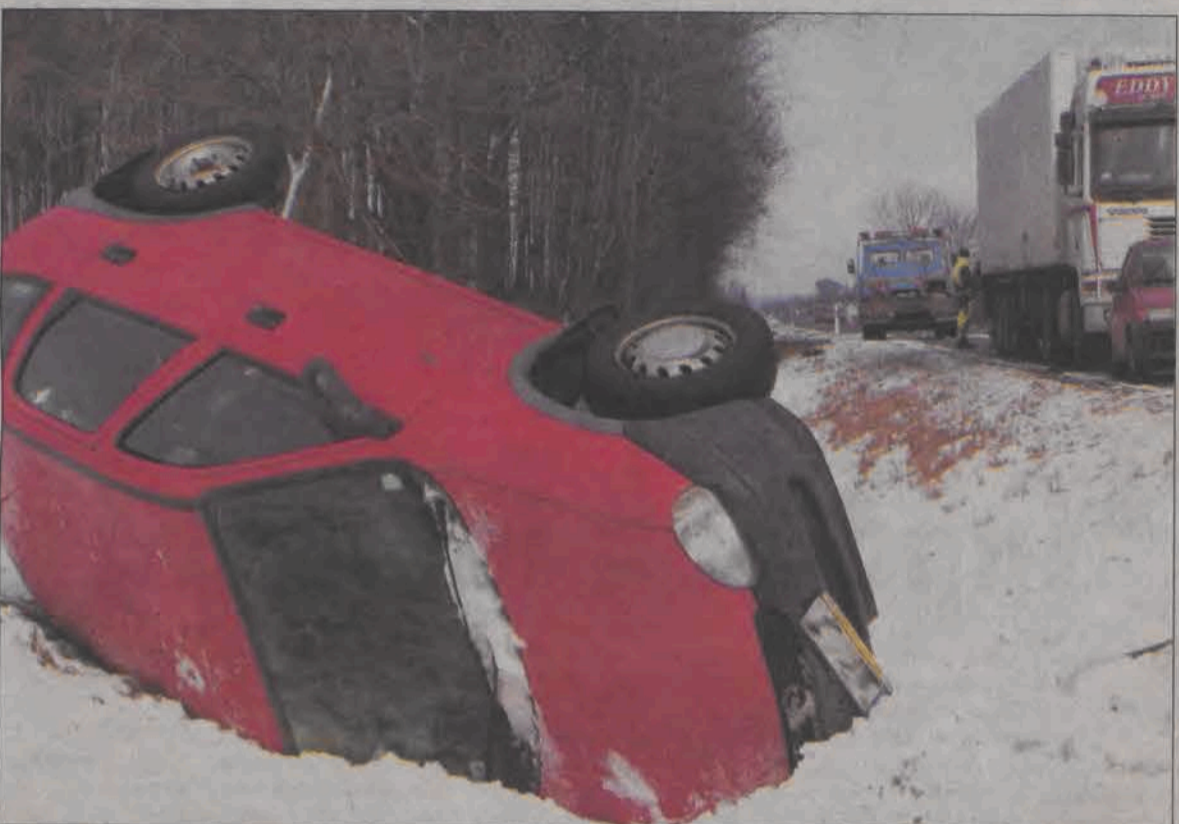
O dużym szczęściu, bo nic się jej nie stało, mówić może mieszkanka Łodzi, która w niedzielę 13 marca wpadła w poślizg i dachowała Oplem Astrą na szosie między Jamnem a Łowiczem. Podczas wyprzedzania innego pojazdu zjechała na sąsiedni pas, ale tam w koleinach zalegało pośniegowe błoto. Wpadła w poślizg i mimo prób, samochodu nie udało jej się już wyprowadzić. Poszkodowaną zaopiekowali się usłudźni kierowcy. Jako że na zewnątrz szalał przejmujący wiatr, starsze małżeństwo pozwoliło jej zaczekać na lawetę wewnątrz swojego samochodu. O tragicznym stanie naszych dróg w minionych dniach piszemy szerzej na stronie 4.