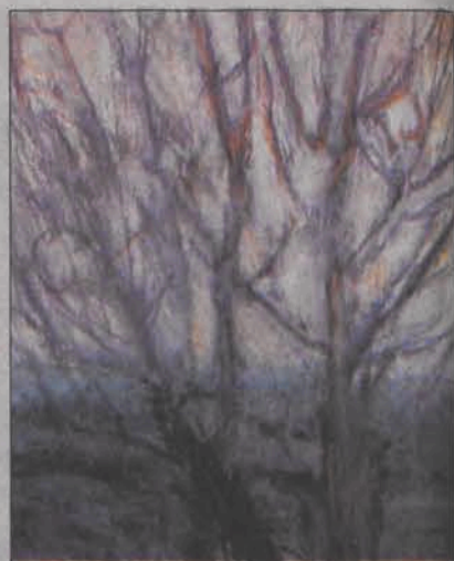
Drzewa, 2003, pastel, papier.