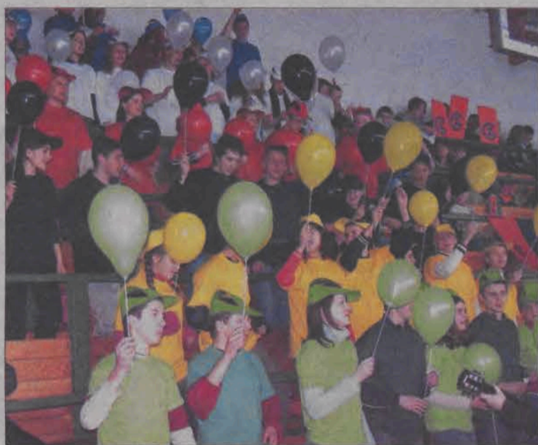
Uczniowie z Gimnazjum nr 3 w Łowiczu stanowili najbarwniejszą drużynę dopingującą.