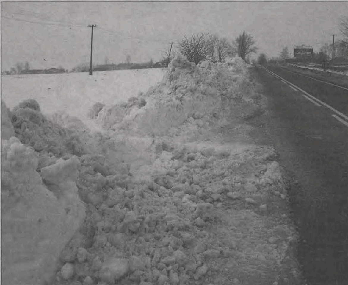
Zwały śniegu zalegały na poboczu drogi z Łowicza do Kiernozi jeszcze we wtorek, 15 marca.

W niedzielę wiał silny wiatr, momentami wychodziło też mocne słońce. To powodo-