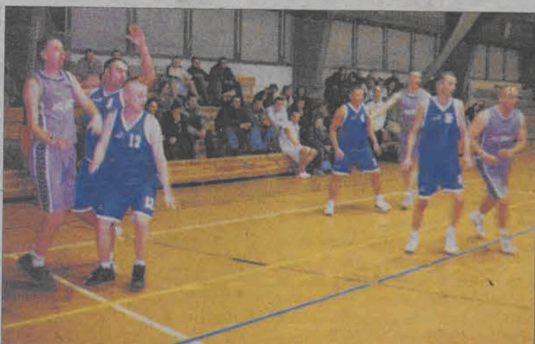
Początek wskazywał na „Bezimiennych”, ale wygra team Jurasów.