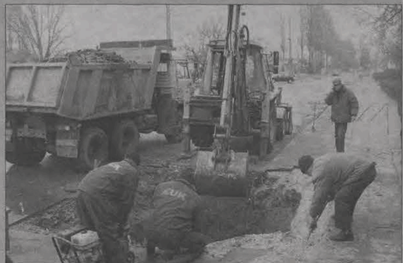
Pracownicy Zakładu Usług Komunalnych usuwali wczoraj, w środę 16 marca, poważną awarię kanalizacji ściekowej przy bloku nr 1 na os. Broniewskiego.