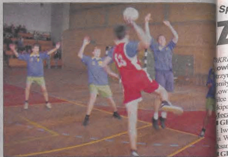
Faworyci z „Pijarskiej” sięgnęli po tytuł mistrzów powiatu łowickiego

■ GP 1 Kompina - GP 2 Łowicz 3:7 (0:4); br.: Mateusz Pach 3 - Maciej Siemieńczuk 4, Marcin Pelka 2 i Przemysław Duranowski.