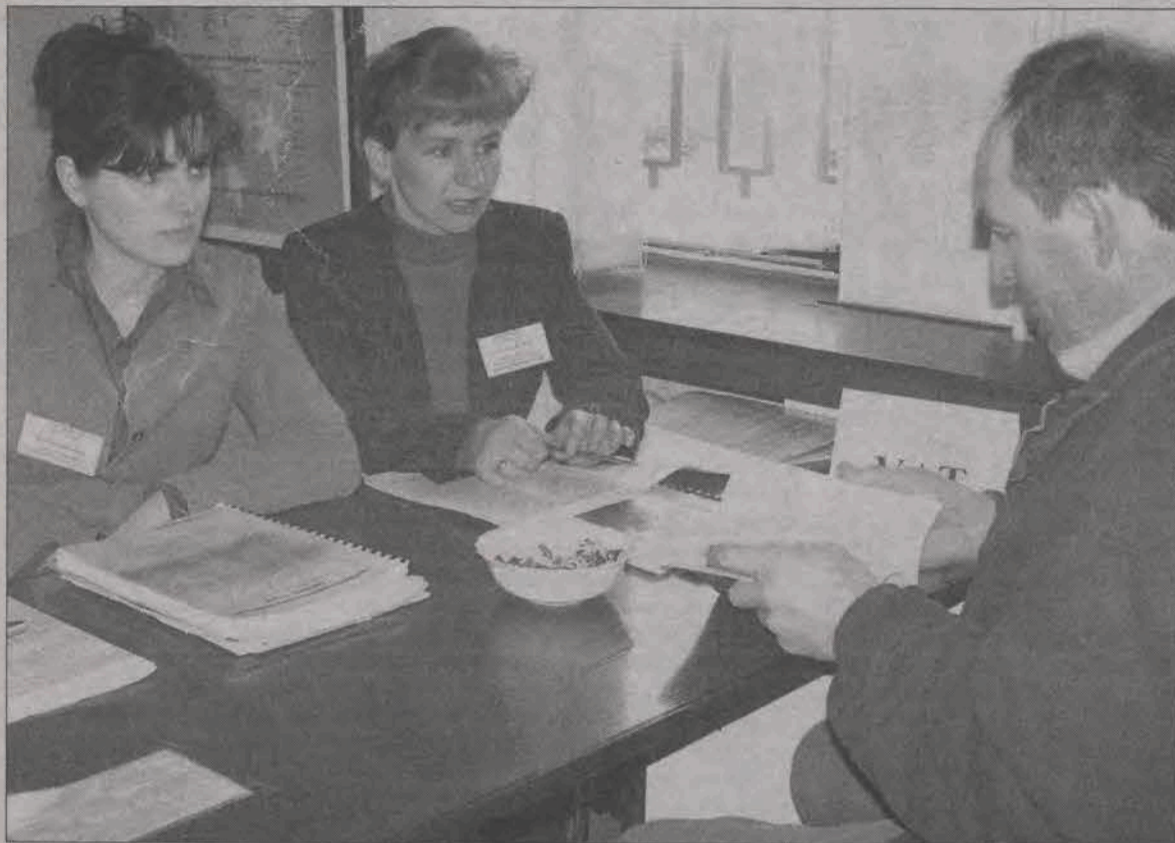
W sobotę w łowickim Urzędzie Skarbowym każdy z petentów otrzymał mógł wyczerpujące informacje. Z akcji skorzystało 170 osób.