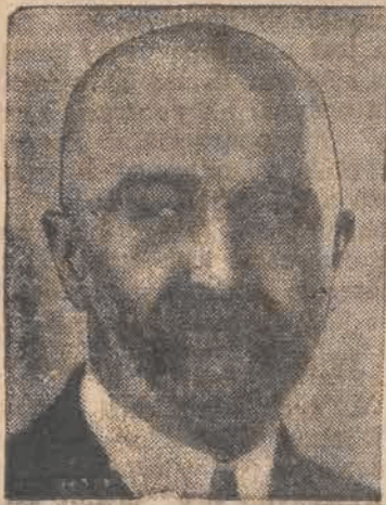
Nowy marszałek Sejmu, płk. Walery Sławek.

P. marszałek Sejmu Walery Sławek zwołał plenarne posiedzenie Sejmu na poniedziałek 27 b. m. na godz. 11-stą.