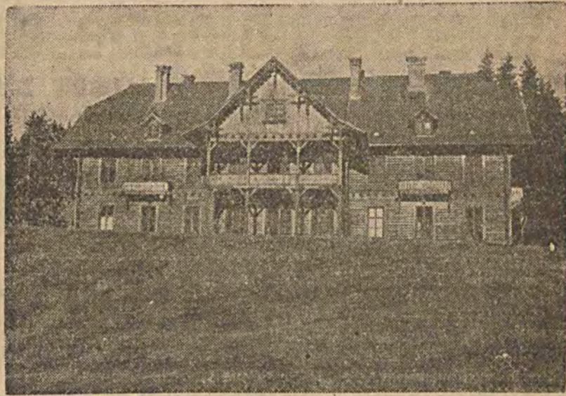
Na zdjęciu — zameczek myśliwski w Jaworzynie, najnowsza rezydencja Pana Prezydenta Rzeczypospolitej, w której Pan Prezydent spędza obecnie wraz z Rodziną wywczasowy świąteczny