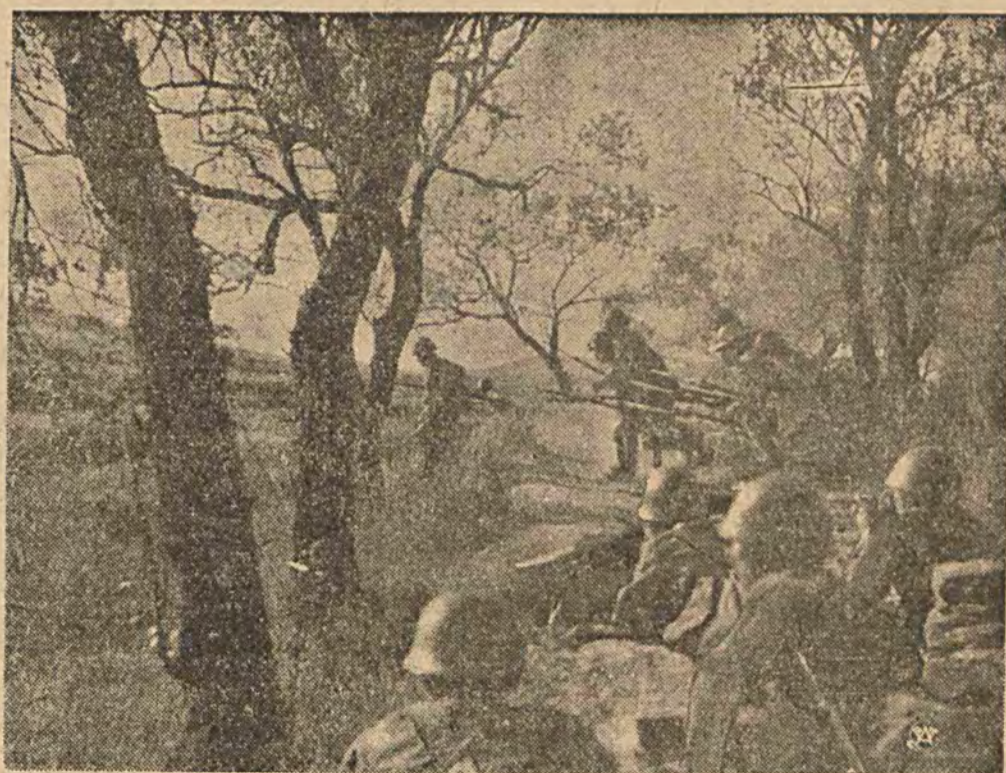
Na zdjęciu — oddział wojsk ja pońskich wraz z karabinami maszynowymi, podczas ataku na pozycje Marszałka Czang - Kai - Szeka pod Kantonem.