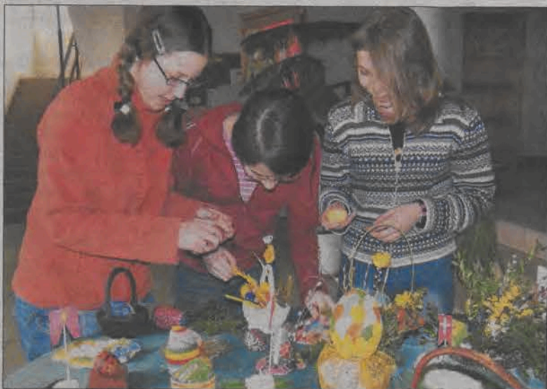
Uczennice klasy szóstej oglądają znajdujące się na szkolnym holu ozdoby świąteczne, które zrobili ich koledzy.

Zdarzają się nawet sytuacje, iż uczniowie wspólnie z rodzicami potrafili rozładować całe dwa Tir-y przywiezionego na budowę styropianu.