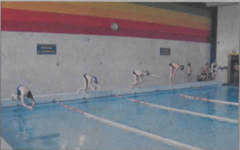
Umiejętności startujących były bardzo różne.