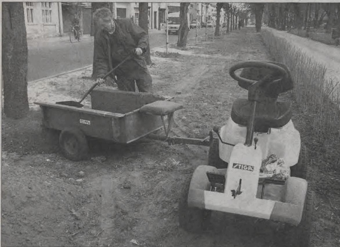
Pracownik skierniewickiej firmy Gitpol nawozi ziemię na niżej położony fragment skweru w Alejach Sienkiewicza.