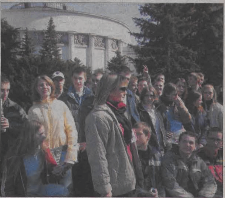
Gimnazjaliści z Łyszkowic przed charakterystycznym budynkiem Sejmu RP przy ul. Wiejskiej w Warszawie.

Kolejnym punktem wycieczki była wizyta w warszawskich Łazienkach i na Rynku Starego Miasta. Miłą, choć nieoczekiwaną atrakcją było spotkanie z licznymi grupami polskich i irlandzkich kibiców, którzy przebywali właśnie tego dnia w stolicy z powodu meczu Polska - Irlandia Północna. Młodzież z Łyszkowic miała okazję poznać młodych ludzi z innych stron Polski i świata oraz przekonać się, że można spotkać miłych, kulturalnych i zgodnych kibiców piłki nożnej. Ostatnim punktem programu był seans filmowy w kinie. (mwk)