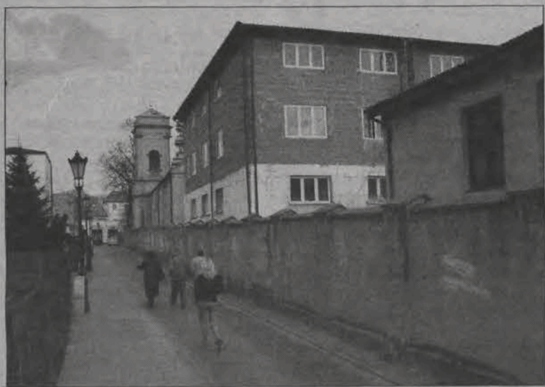
Gmach liceum pijarskiego widziany od tyłu, tj. od strony ulicy Chopina. 1 września w nowych, przestronnych salach, rozpocznie się nauka.

Liceum pijarskie nie chce być jednak tylko liceum wymagającym, egzekwującym od ucznia określony zasób wiedzy. Szkoła zamierza być dla ucznia: nie tylko wymagać, ale przede wszystkim uczyć i pomagać w rozwoju jego indywidualnych predyspozycji. Będzie się starało nie znamować żadnego talentu, przeciwnie: wykorzystać uczniowskie zdolności. Nauczanie powierzone będzie dobrem nauczycielom, a indywidualnemu rozwojowi służyć będą liczne zajęcia pozalekcyjne: dla klasy humanistycznej z historii sztuki i filozofii oraz łaciny i kultury antycznej, dla chętnych zajęcia informatyczne, politologiczne i ekonomiczne, warsztaty prawnicze, DKF, zajęcia sportowe, teatralne i dziennikarskie – lista może ulegać zmianie w zależności także od zapotrzebowania.