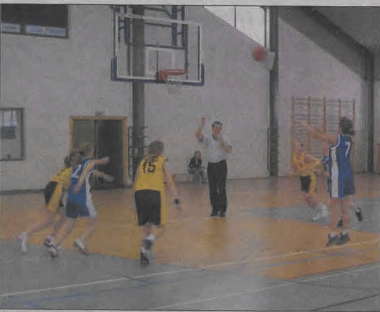
Ekipa Księżaka I zagra o trzecie miejsce mistrzostw woj. łódzkiego.

1. MTK II Pabianice 2 4 67:37 2. Księżak II Łowicz 2 3 50:54 3. MTK IV Pabianice 2 2 47:73