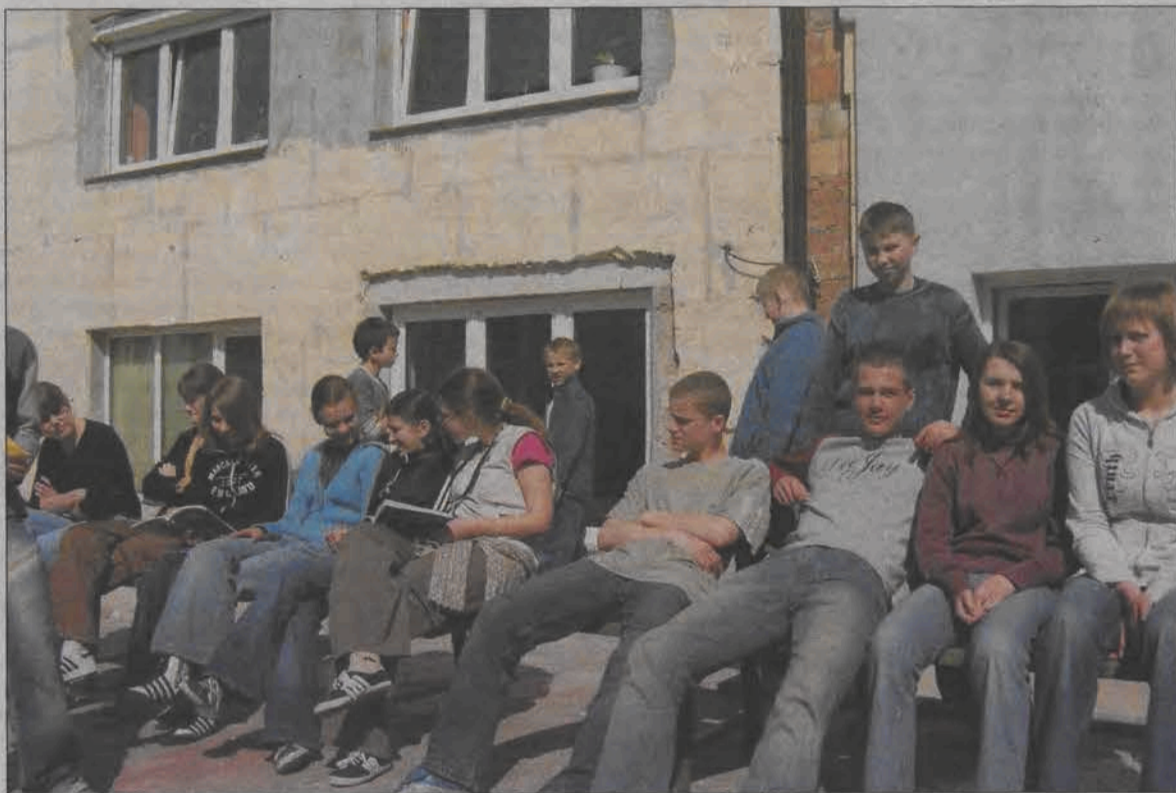
Pogoda dopisuje, tak więc uczniowie klas trzecich spędzają czas na szkolnym dziedzińcu. W tle mury rozbudowanego gmachu, w którym od września będzie także liceum.

Wysoki poziom nauczania, jaki osiągała szkoła pijarska jest faktem bezspornym, o czym świadczą rokroczne wyniki egzaminów klas szóstych i egzaminów gimnazjal-