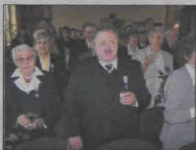
„Sto lat” dla jubilatów z gminy Zduny obchodzących Złote Gody odśpiewano wraz z nimi w GOK w Zdunach w sobotę, 16 kwietnia.