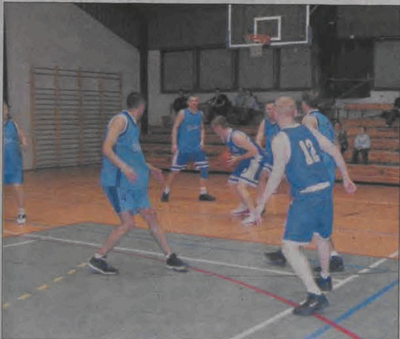
Blusmeni po zwycięstwie nad Jurasami objęli prowadzenie w tabeli...

Łowicz, 15 i 17 kwietnia. Po dwutygodniowej przerwie na parkiet hali łowickiego OSiR nr 2 powrócili koszykarze Amatorskiej Ligi Koszykówki. W piątek i w niedzielę rozegrano o cztery spotkania, w których nie było niespodzianek. Wygrywali faworyci. Dwa mecze rozegrali zawodnicy Blue Stars i po dwóch zwycięstwach ekipa ta wysunęła się na prowadzenie ligi. Na drugim miejscu jest drużyna ŁSM. Obidwa zespoły są jak na razie bez porażki, zatem zapowiada się ciekawa rywalizacja pomiędzy nimi.