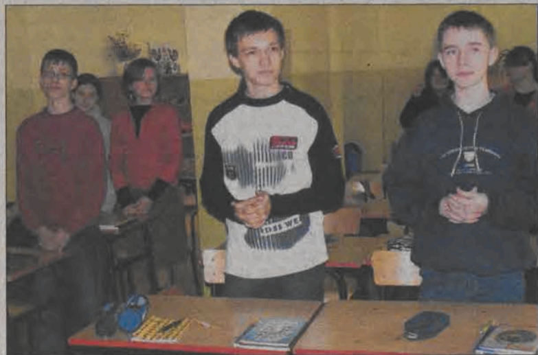
Gimnazjaliści w klasie podczas modlitwy, jaką rozpoczynają się lekcje religii.