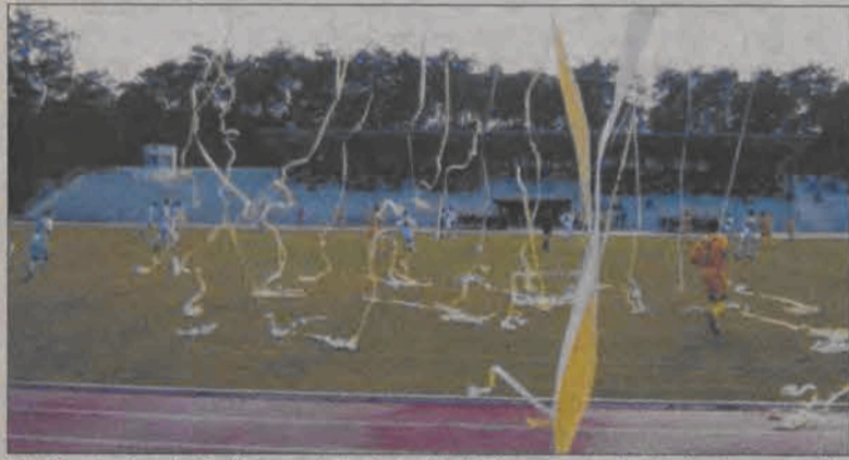
W Kozienicach Pelikan zdobył punkt.

Piłka nożna - zaległa 17. kolejka III ligi