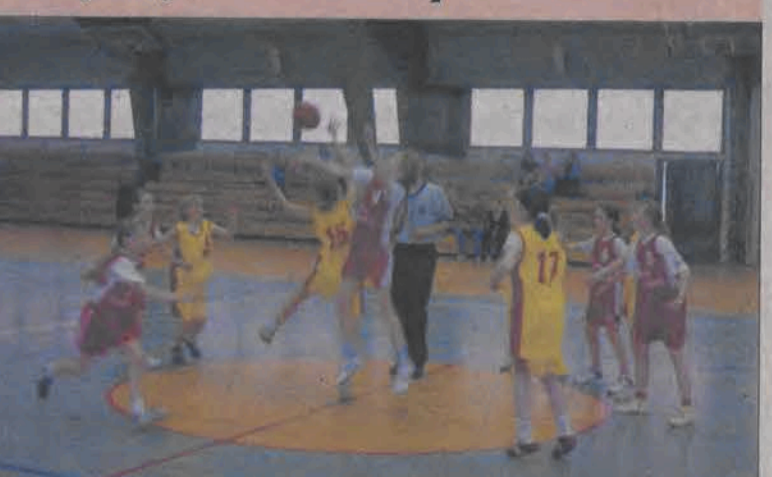
Najmłodsze łowickie koszykarki z rocznika 1994 odniosły swoje pierwsze zwycięstwo w karierze.

1. MTK II Pabianice 2 4 67:37 2. Księżak II Łowicz 2 3 50:54 3. MTK IV Pabianice 2 2 47:73