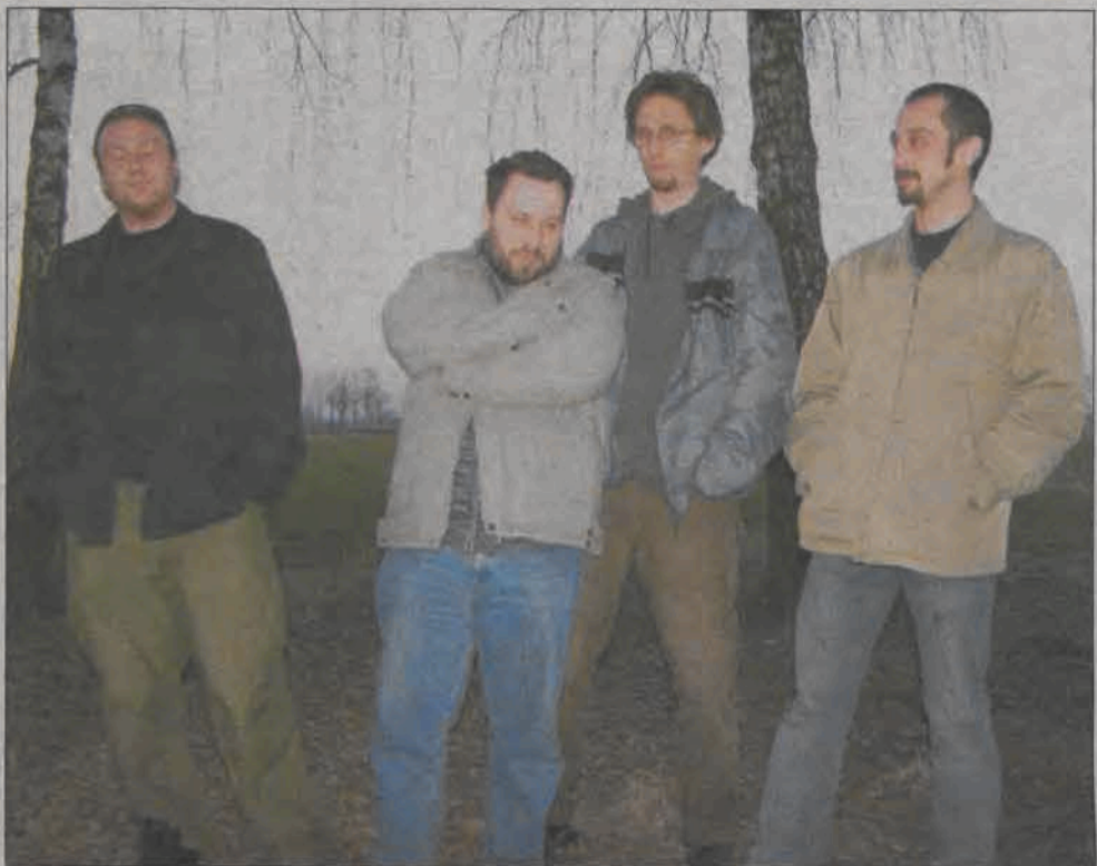
Grupa wygląda ma może mało metalowy, ale gra za to ekstremalny, klasyczny black metal z wpływami death, doom i thrash.