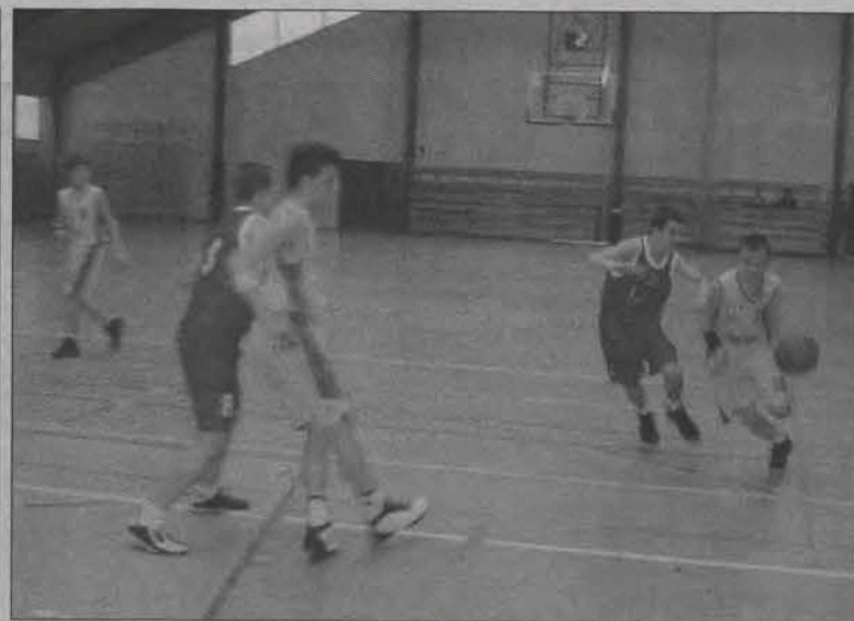
Łowiczanie w ostatnim meczu sezonu wygrali ze Stertem III.