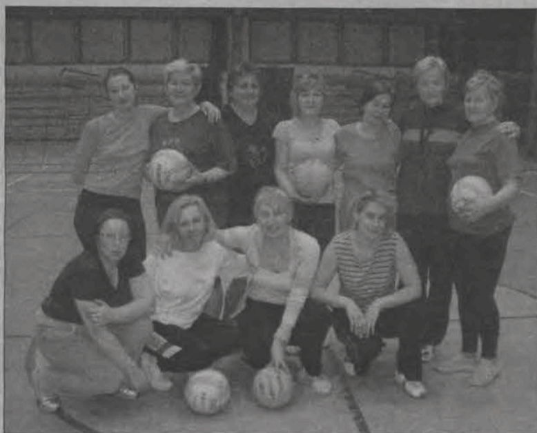
Ćwiczą już od lat...