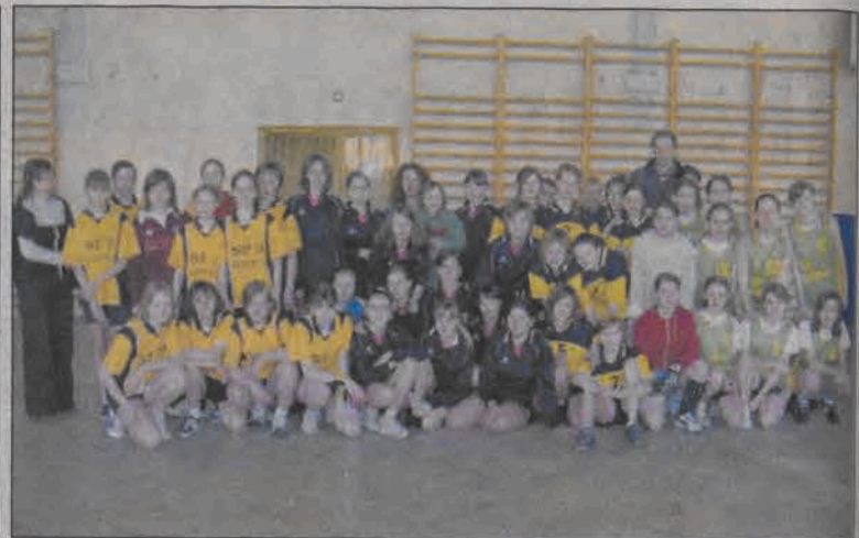
W mistrzostwach Łowicza wystąpiły cztery drużyny, aż trzy z nich zapewniły sobie awans do turnieju finałowego: „Czwórka”, „Trójka” i „Dwójka”.