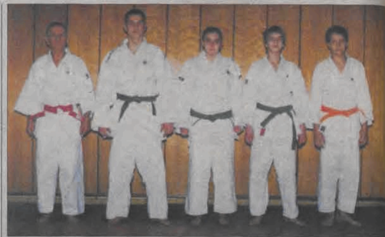
Z czwórki zawodników Zrywu w finałach wystartuje tylko dwójka.