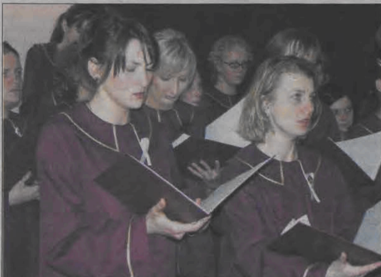
Oratorium do poematu „Tryptyk Rzymski” chór z Mysłowic wykonywał już w Filharmonii Śląskiej, Krakowskiej, Kaliningradzkiej, Bazylice Matki Bożej Piekarskiej. W ostatnią sobotę śpiewali w Łowiczu.