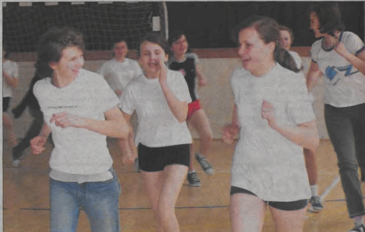
Rozgrzewka trzecioklasistek na szkolnej sali gimnastycznej.

Na tę miłą, koleżeńską atmosferę wpływ ma na pewno organizowany co roku wyjazd turystyczny do Koszarawy w Beskidzie Żywieckim, w którym uczestniczą pierwszoklasiści właśnie rozpoczynający naukę w gimnazjum pijarskim. Uczniowie