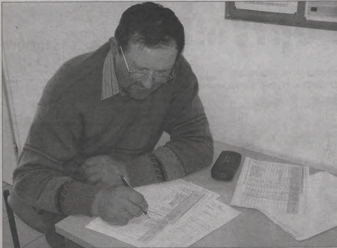
W czasie dni otwartych rolnicy przychodzili zwykle z wnioskami o dopłaty bezpośrednie. Niektórzy po konsultacji z pracownikami wypełniali wniosek przy stoliku w korytarzu biura.