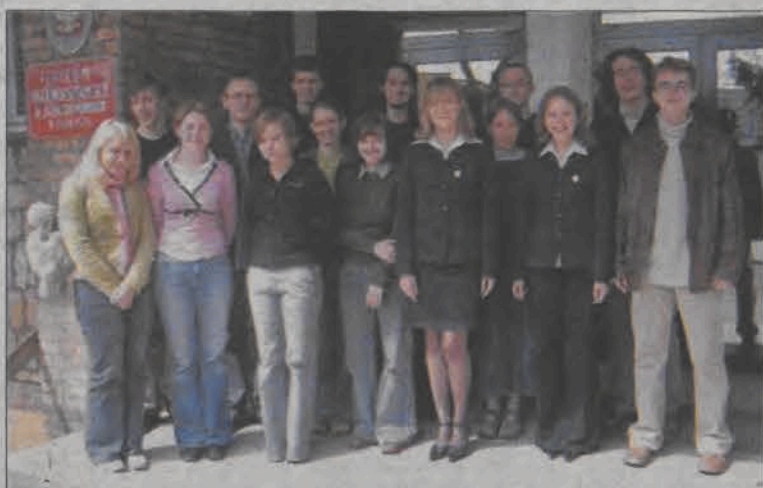
Olimpijczycy z „Chelmońskiego” - najwięcej jest w tym gronie maturzystów, ale są też uczniowie klas II, którzy do nowej matury przystąpią za rok, a już „mają w kieszeni” indeksy.