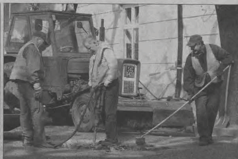
Pracownicy PRID w Łowiczu łatają dziury na wylocie ul. Mostowej na Stary Rynek.

Prezentując powyższy plan pominęliśmy inwestycje, które w nim uwzględniono, a które gmina przewidziała do wykonania w budżecie w tym roku.