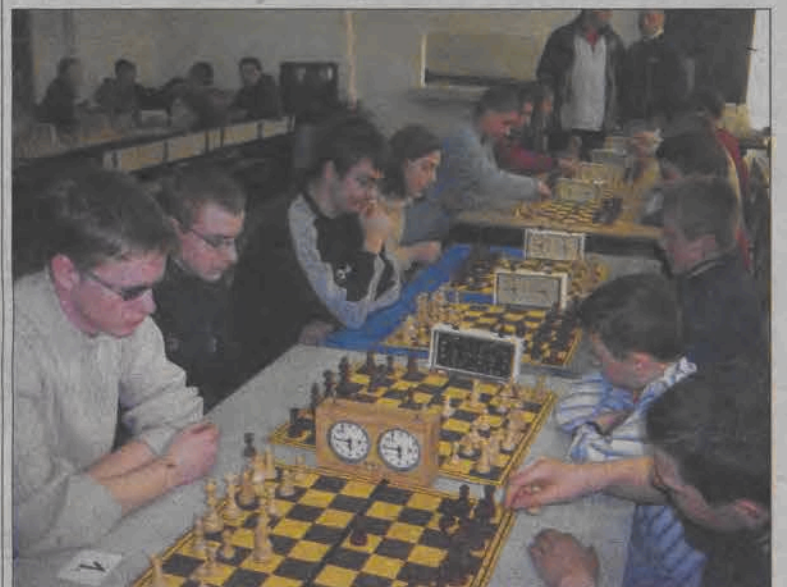
W mistrzostwach powiatu łowickiego w szachach wystartowało pięć ekip.