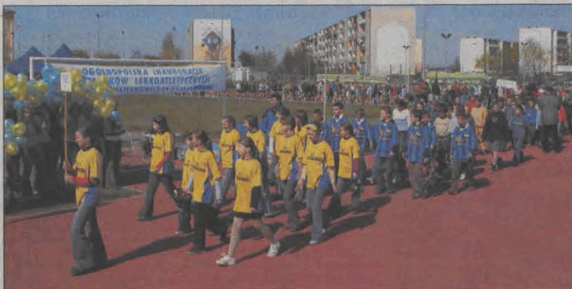
Otwarcie miało bardzo uroczysty charakter. Podczas defilady ekipa Szkoły Podstawowej w Domaniewicach.

Lekka atletyka - XI edycja „Czwartków lekkoatletycznych”