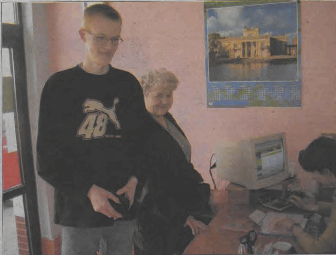
Agencje finansowe to wciąż nowy rodzaj usług na naszym rynku. Zdjęcie zrobione w agencji „Omega” przy ul. Krakowskiej.

Samym właścicielem tej małej firmy zależy na tym, aby być solidnym. Deklarują, że