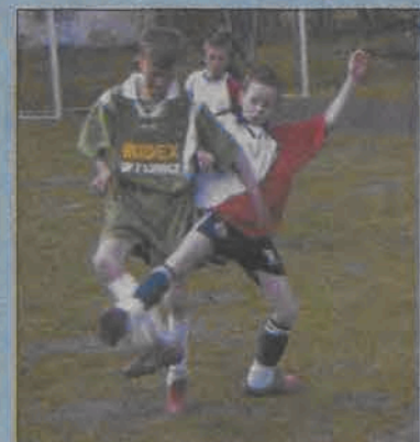
W decydującym meczu „Czwórka” ogryła „Siódemkę” 3:1.