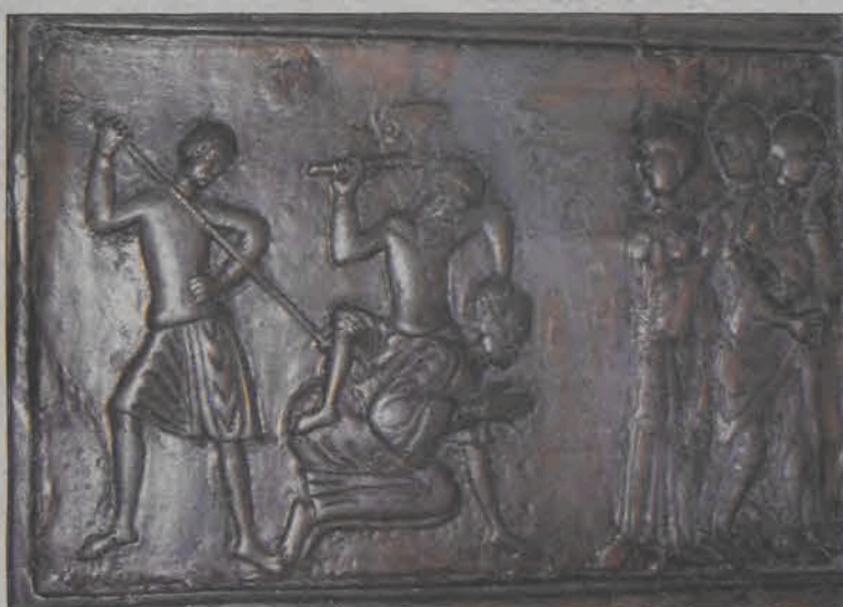
Męczeńska śmierć Świętego Wojciecha - scena z drzwi gnieźnieńskich ilustrujących koleje życia pierwszego patrona Polski.

Miała to być jednak droga bardzo trudna, gdyż nowy biskup Pragi okazał się od tego momentu pasterzem bezkompromisowym. Gwałtownie potępił zwyczaje uważane w Czechach za normalne - pogańskie obrzędy, zaprzędawanie chrześcijan w niewolę - według legendy we śnie zwrócił mu na to