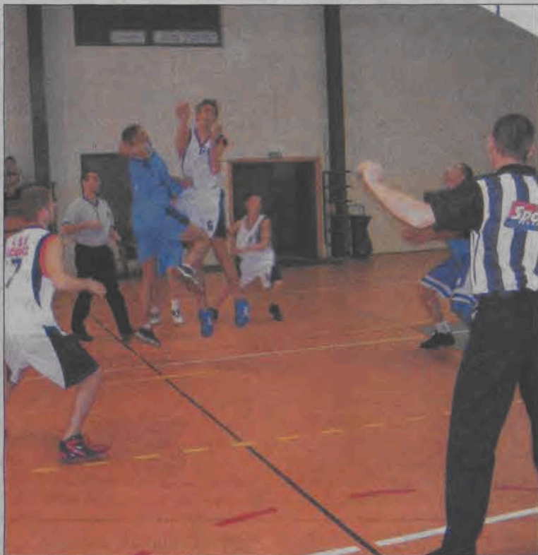
W meczu na szczycie „Gwiazdy” lepsze od „Spółdzielni”.