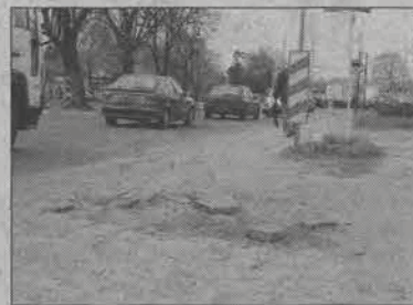
Taka dziura straszy od wielu miesięcy na chodniku pomiędzy ulicą Chrobrego a Gdańską.