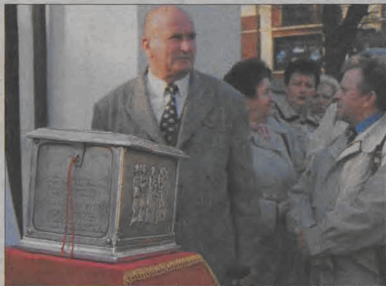
Po godzinie osiemnastej relikwie dotarły do Łowicza, gdzie odprawiona została msza święta w kościele Świętego Ducha.