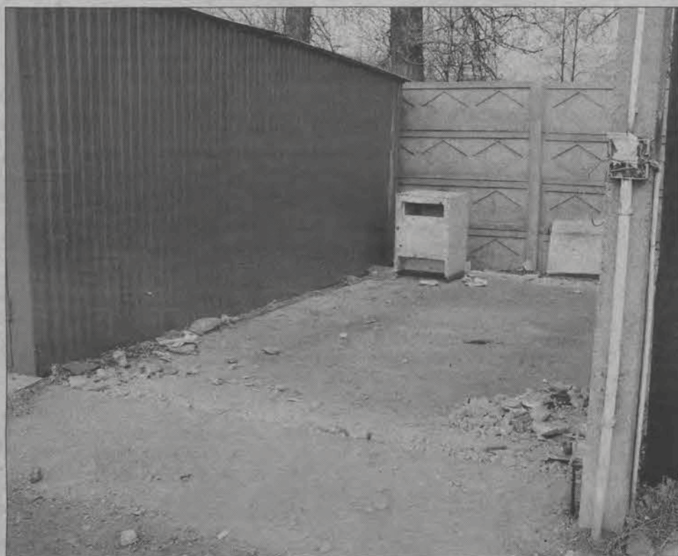
Po części garaży przy Pelikanie zostały tylko śmieci i stare szafki.

W miejskim Wydziale Gospodarki Gruntami i Zagospodarowania Przestrzennego dowiedzieliśmy się, że miasto dysponuje terenem pod około 60 garaży, ale... przy ulicy Matejki na Korabce. Dla mieszkańców osiedla Starzyńskiego i okolic, którzy w większości mają