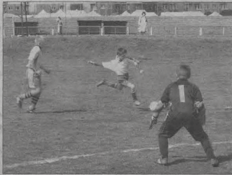
Młodzi gracze Pelikana znowu grali przy ul. Starzyńskiego.

Wólucza 2:3, Laktoza Łyszkowice - Unia Skierniewice 0:3 (w.o.), Macovia Maków - Mazovia Rawa Mazowiecka 0:11, Pogoń Belchów - Pogoń Godzianów 3:1.