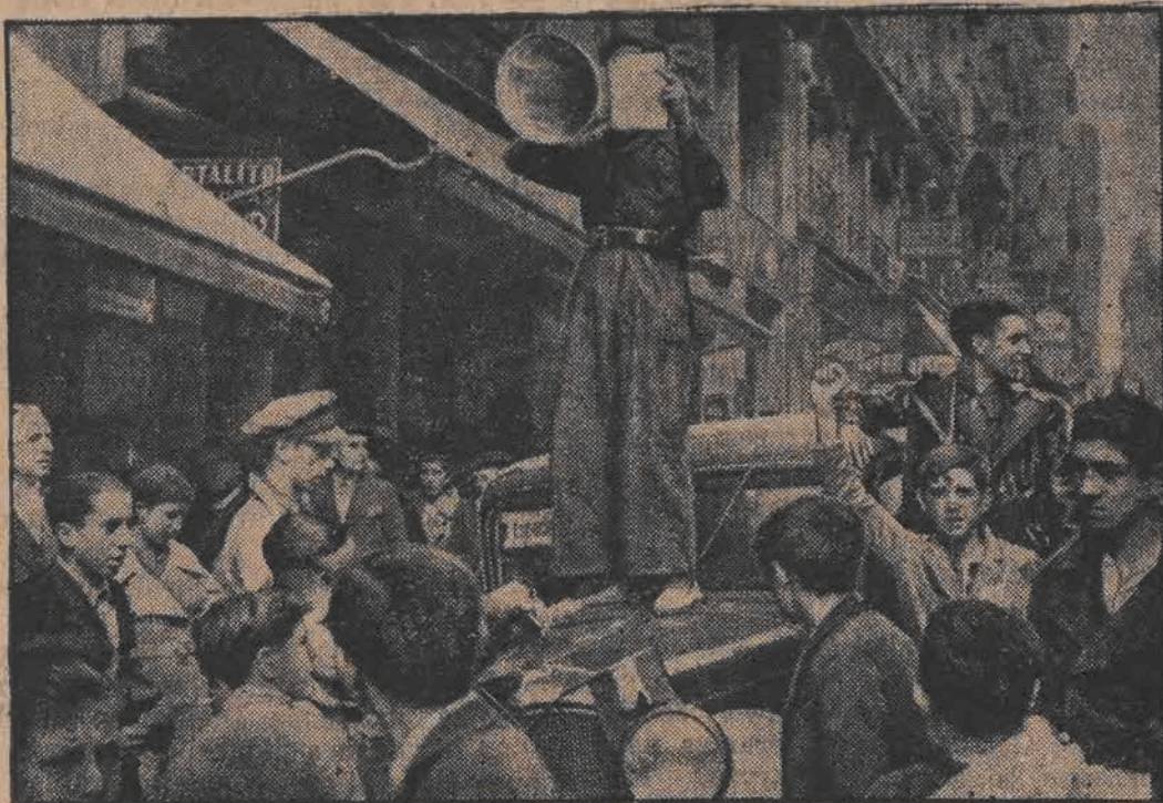
Na zdjęciu widzimy agitującego na ulicach Madrytu, wyrestka który nawołuje do wstępowania w szeregi czerwonej milicji.

Dzięki temu nauka języków przestała być uciążliwą pracą, a stała się przyjemną i pożyteczną rozrywką.