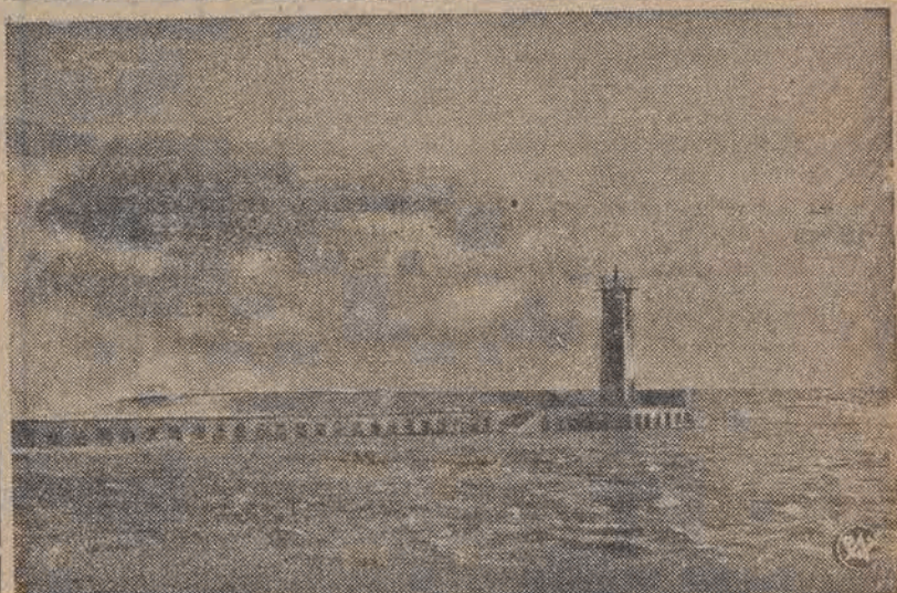
Na zdjęciu — latarnia morska i wejście do portu w nowo-wybudowanym porcie rybackim w Wielkiej Wsi Hallerowo.

W latach 1930—1936 liczba ta nieco spadła i utrzymała się mniej więcej koło 910—960 par bliźniąt i 10 do 14 trójek trojaczek.