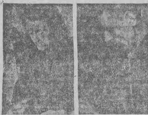
Władysława Madejskiego wykonuje 210 proc. normy