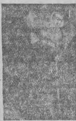
Tow. Edmund Pietrzak przystąpił do wyścigu pracy

wyścigu pracy mogła być wprowadzona w czyn.