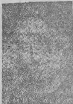
Bronisława Ciperling wykonała w mies. paź. dzienniku br. 240 proc. normy

Jeszcze przed rozpoczęciem współzawodnictwa Państwowe Zakłady Przemysłu Dzierżarskiego nr 1 należały do przodujących w tej gałęzi przemysłu. We wrześniu br. przekroczyła produkcja Zakładów plan państwowy na ten miesiąc o 18,3 procent. A nawet plan oddolny, opracowany przez personel techniczny Zakładów, został przekroczony. W październiku br. plan państwowy wykonano w 120 procentach.