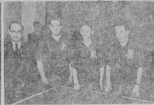
Na zdjęciu — obie reprezentacje, Krakowa...