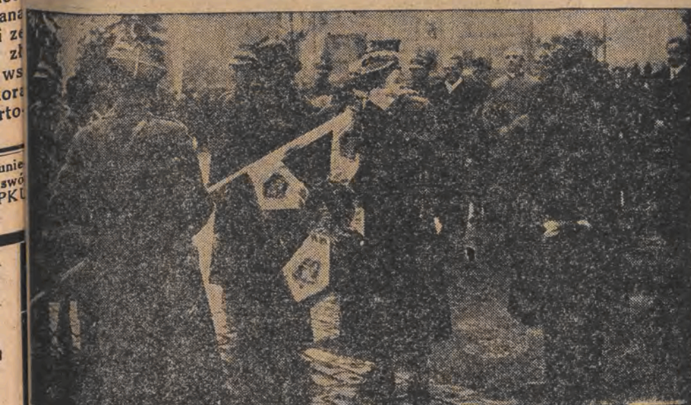
Moment przypinania przez Marszałka Śmigłego Rydza na sztandarze wileńskiego pułku artylerii krzyża „Virtuti Militari”. Przy sztandarze widzimy Panią Marszałkową Piłsudską, zaś obok na prawo Pana Prezydenta R.P.