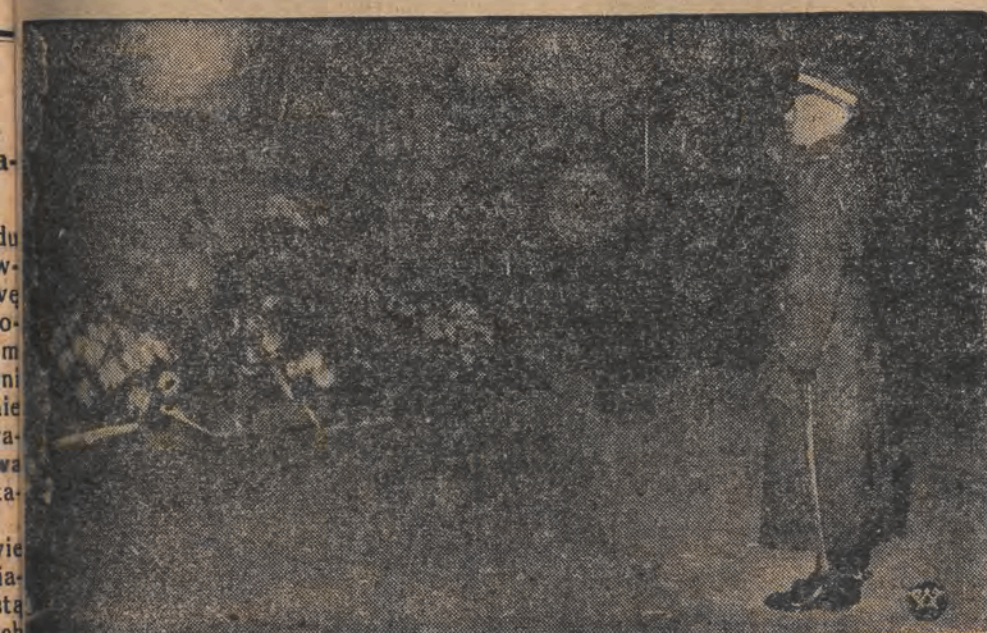
Moment złożenia w Belwederze hołdu Cieniom Pierwszego Marszałka Polski Józefa Piłsudskiego przez dziedzica buławy — Marszałka Śmigłego Rydza.

Zbratanie młodzieży z Armią w dniu Święta Niepodległości