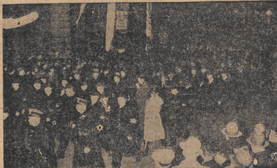
Tysięczne rzesze Warszawy, defilujące w kierunku Belwederu, dla oddania hołdu Marszałkowi Piłsudskiemu, przed domem przy ul. Moniuszki Nr. 2, w którym w 1918 r. rajował po swym powrocie z Magdeburga Marszałek Piłsudski.