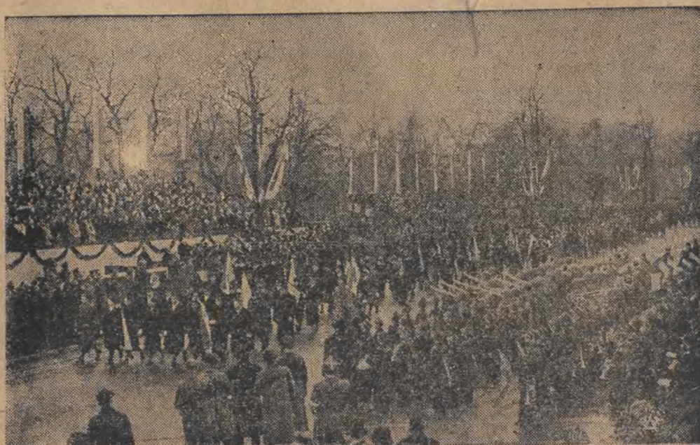
Fragment z defilady organizacji młodzieżowych ze sztandarami przed Naczelnym Wodzem.