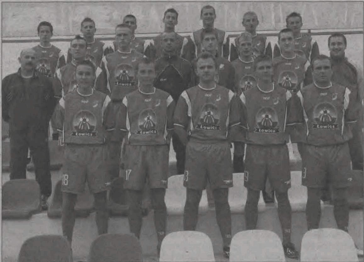
Jesienią łowiccy rezerwiści nie zachwycali... Mniejmy nadzieję, że lepiej będzie wiosną 2006.