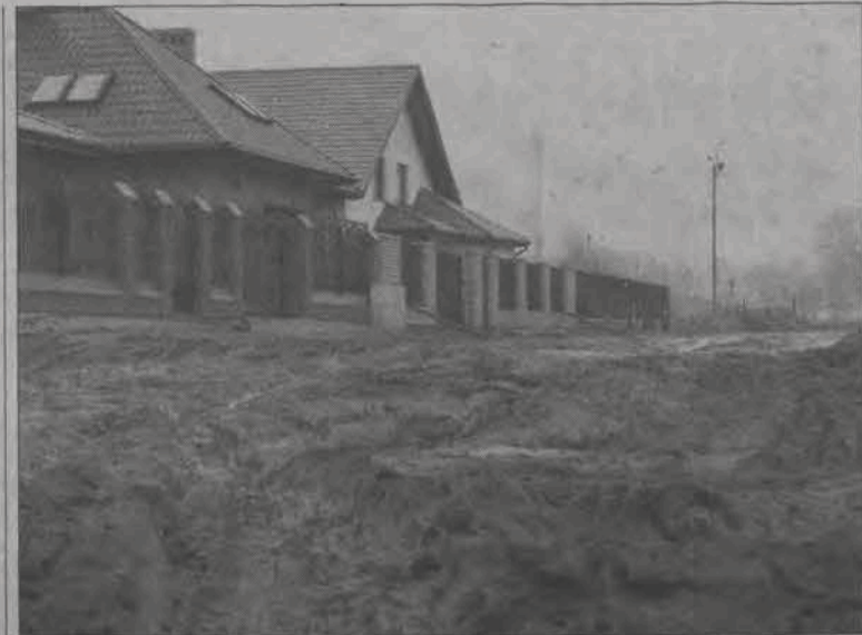
Trudno jest obecnie przejść ulicą Dziewiarską do jej końca, głębokie błoto skutecznie to uniemożliwia.