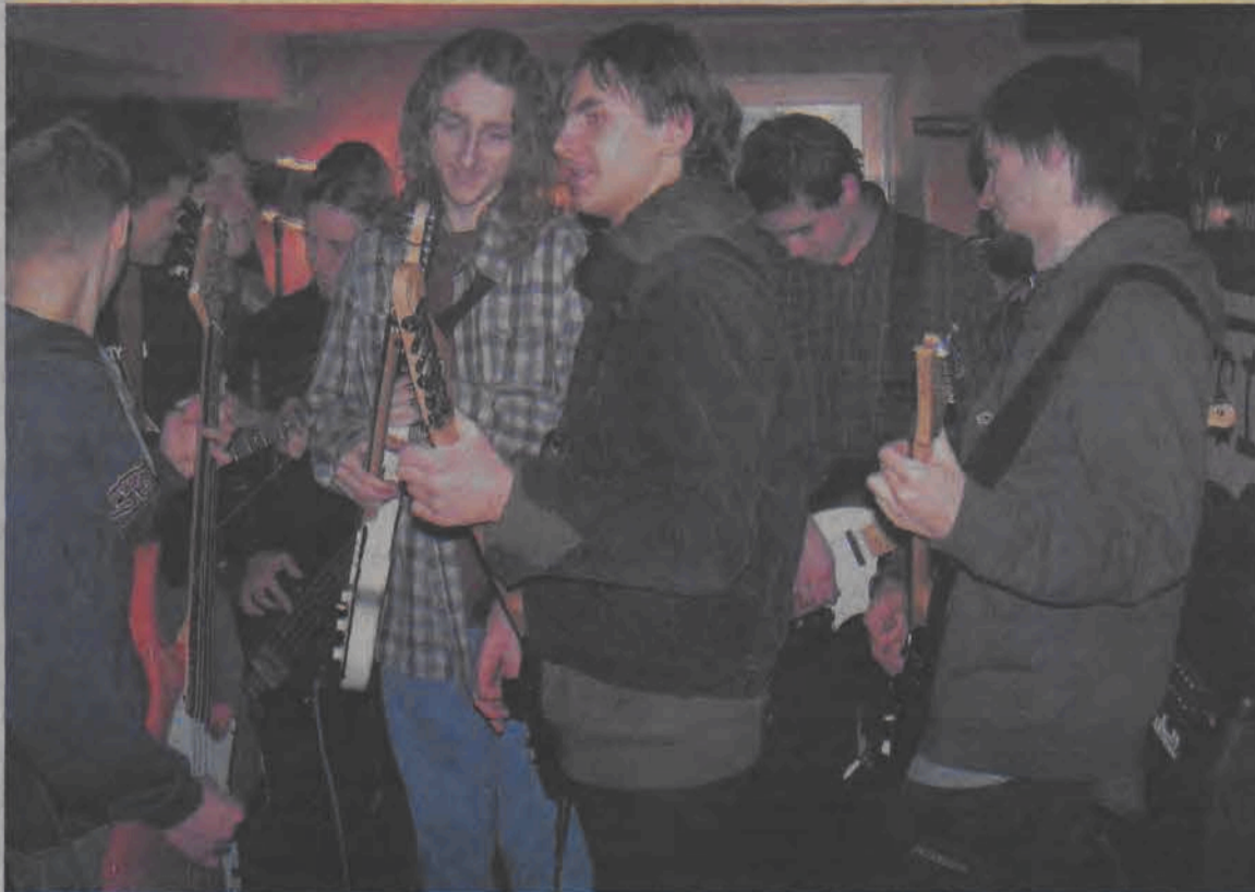
21 grających muzyków na scenie Tipes Topes - to rekord ustanowiony 10 grudnia w czasie koncertu kołęd.