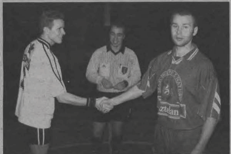
W meczu Forum i OSP zdecydowanie lepsi okazali się ci pierwsi...

Halowe mistrzostwa Łowicza - zaległy mecz 3. kolejki III ligi ŁLPNP