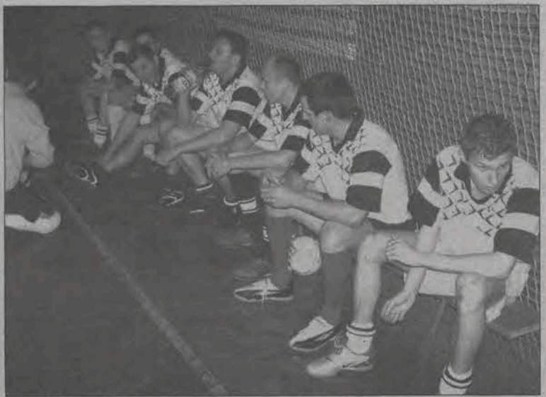
Fantazja odniosła czwarte zwycięstwo i awansowała tym samym na pozycję liderów II ligi.

Halowe mistrzostwa Łowicza - zaległy mecz 1. kolejki II ligi ŁLPNP