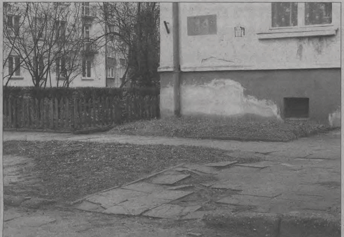
Zniszczony chodnik, łatana elewacja bloku - to bardzo częsty widok na os. Kostka w Łowiczu.

Zjazdy, jak poinformowała nas wicedyrektor szkoły Elżbieta Wojtyna, będą odbywały się w cyklu zaocznym dziesięć razy w okresie semestru czyli w dniach: sobota -