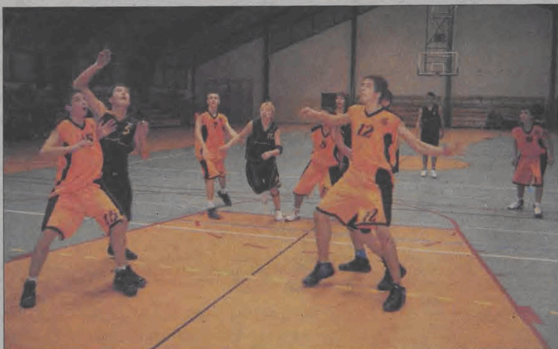
Przez trzy weekendowe dni w Łowiczu rozgrywano był turniej koszykówki, o którym szerzej piszemy na str. 30.