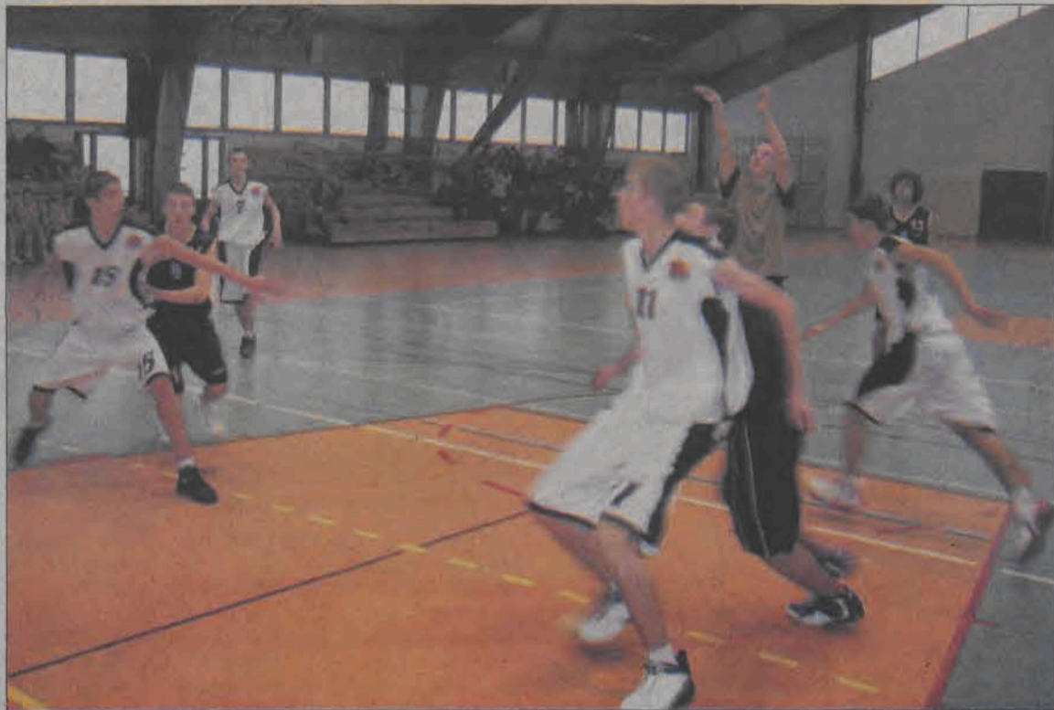
Kadeci Księżaka w eliminacjach przegrali z późniejszymi zwycięzcami turnieju - graczami Prokomu-Trefla Sopot.

■ UMKS KSIĘŻAK I Łowicz - UKS 7 PROKOM TREFL Sopot 52:81 (10:16,