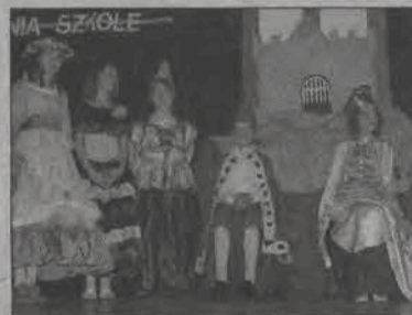
Uczniowie „Dwójki” dostojnie prezentowali się w rolach królewskiej pary i dam dworu w utworze „Rękawiczka”.