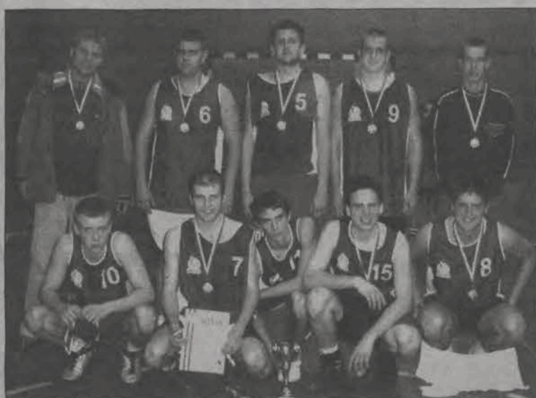
Koszykarze z I LO Łowicz wywalczyli w Łowiczu drugie miejsce.