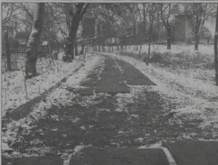
Przy braku dostatecznego oświetlenia trudno nie potknąć się po wstąpieniu nogą w tę wyrwę.

ne. W okresie zimowym do pomalowania przeznaczona jest część pralni i suszarni w blokach na osiedlu Bratkowice oraz część korytarzy piwnicznych również na innych osiedlach mieszkaniowych w Łowiczu. Zanim dojdzie do malowania korytarzy piwnicznych, spółdzielnia będzie prosiła lokatorów, poprzez kartki wywieszane na klatkach schodowych, o usunięcie z piwnicznych korytarzy stojących tam rzeczy. Potrzeby można cały czas jeszcze zgłaszać do biura spółdzielni. (mak)