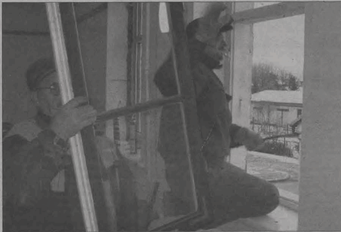
Pod koniec minionego tygodnia, pracownicy gminnej sekcji obsługi Urzędu Gminy w Bolimowie, kończyli już zakładanie nowych, plastikowych okien na górze budynku Gminnego Ośrodka Kultury. Do końca roku za 15 tysięcy złotych założyć mają łącznie na górze i dole 17 okien. Do wymiany pozostanie jeszcze 7 drewnianych, jednak są one w dobrym stanie i nastąpi to w przyszłości. Na zbliżający się rok planowane są natomiast prace przy elewacji budynku. (mwk)

Tylko jedna oferta, na dodatek złożona po terminie wpłynęła na organizowany przez gminę Zduny przetarg na ułożenie blisko 700 m 2 nawierzchni z betonowej kostki brukowej na nieutwardzonym dotąd terenie na zapleczu budynku Urzędu Gminy w Zdunach. Przetarg odbył się w poniedziałek 29 listopada, w przyczyn formalnych został unieważniony. 1 grudnia ustalono, że drugi przetarg odbędzie się 19 grudnia, wyłoniony w nim wykonawca będzie miał czas na realizację zadania do końca kwietnia. Koszt zadania wyniesie prawdopodobnie ponad 100 tys. zł. Gmina chce, by ułożony 664 m 2 nawierzchni z kostki, która powiększy teren istniejącego już parkingu za budynkiem gminy. Dodatkowo ułożonych zostanie blisko 37 metrów bieżących chodnika, także z kostki, którym będzie można dojść do powstającej publicznej toalety. (tb)