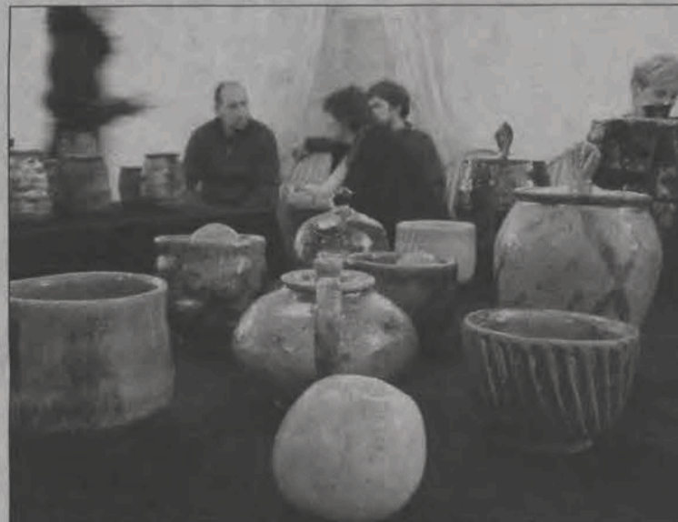
Ceramika prezentowała się wspaniale, jej uzupełnieniem były owoce.

Wszystkie zostały stworzone samodzielnie przez artystów, sami opracowali