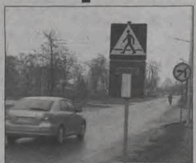
Niepotrzebny znak na Tuszewskiej dezinformował kierowców jeszcze kilkanaście dni po otwarciu drogi.

Mylący kierowców znak drogowy, który informuje, że ulica Tuszewska jest drogą bez wyjazdu, stał w sąsiedztwie handlowego Centrum Tuszewska na osiedlu Bratkowice w Łowiczu jeszcze na początku tego tygodnia.