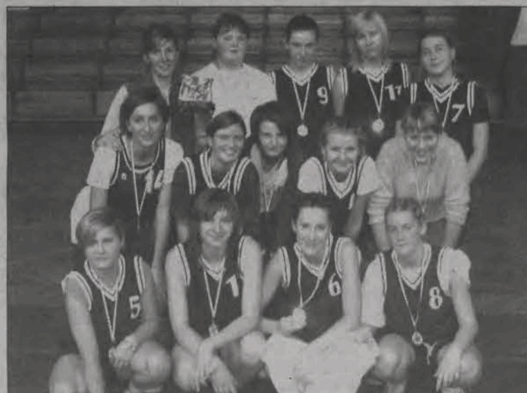
Łowiczanki sięgnęły po brązowy medal mistrzostw województwa łódzkiego.