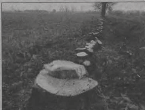
Przed wycięciem było ładniej.

Kilkanaście olch zostało wyciętych wzdłuż lokalnej drogi łączącej Świerż I ze Świerżem II w gminie Łowicz. Razem z nimi pod piłę, niestety, poszły również niektóre kilkunastoletnie dęby, które były posadzone zbyt blisko asfaltowej drogi.