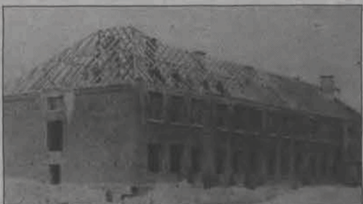
Odbudowa szkoły po wojnie (1946 r.).

Obecnie w tej szkole w 16 oddziałach klas I - VI uczy się 392 uczniów, a w dwóch oddziałach przedszkolnych - 41 dzie-