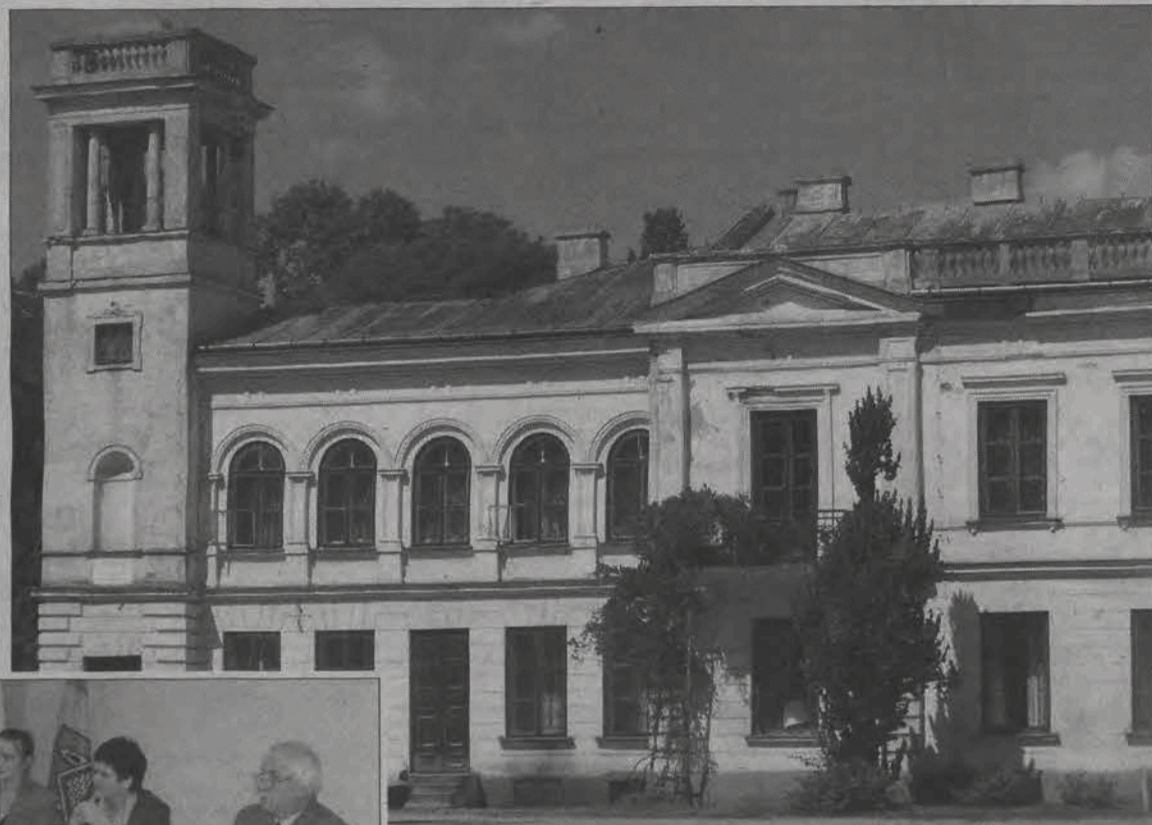
Zanim pałac w Sannikach nabierze nowego blasku, minie jeszcze sporo czasu. To, że wymaga nakładu, widać nawet gołym okiem.