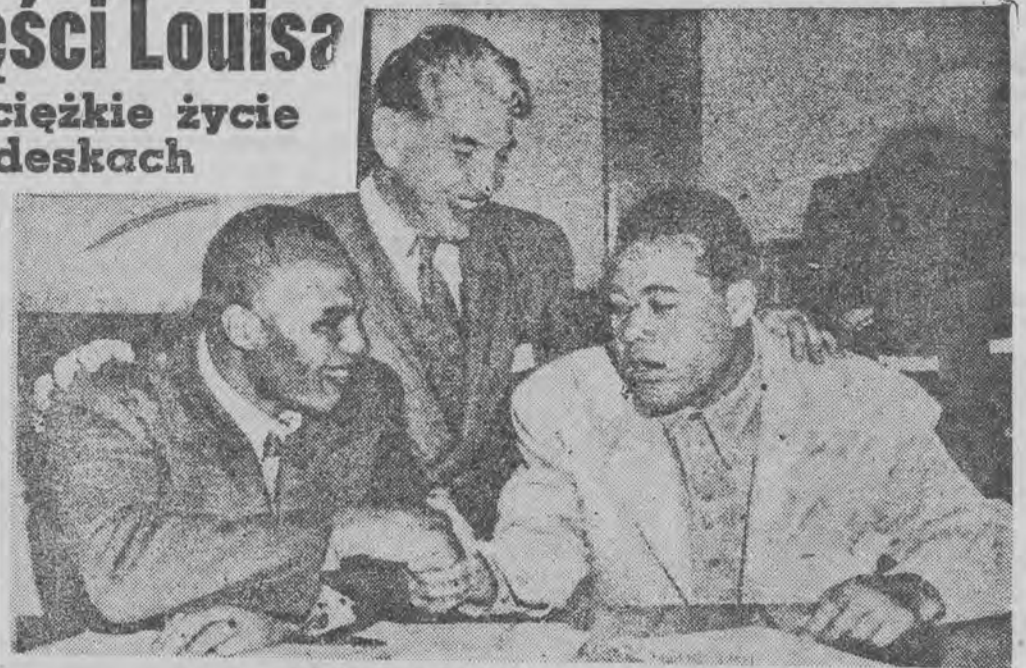
Joe Louis i Joe Walcott podpisują kontrakt.