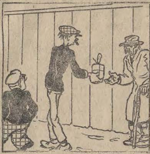
WICEK: — Niezbyt świeże, ale mo- że się wam przyda... ZEBRAK: — Zobaczymy!..