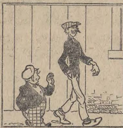
WICEK: — Nareszcie mamy spokój, z tą padliną! WACEK: — A co było trudne!