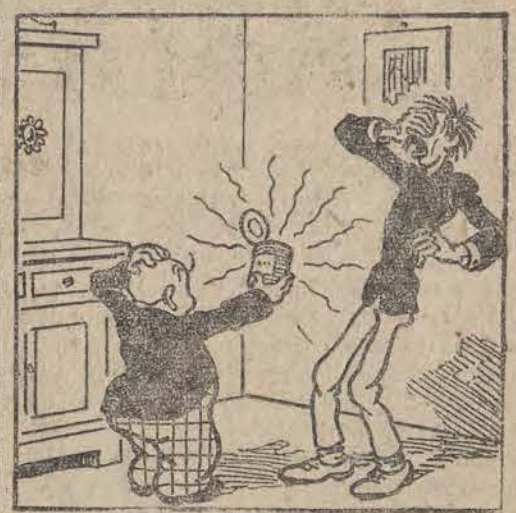
WACEK: — Ratunku! Pomyłka! Wy- daliśmy dobrą konserwę, a śmier- dząca została!