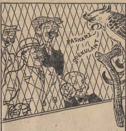
PAPUGA: — Oho!... Paskarz!... SZABERSKI: — Skądże ona mnie zna? Słowo honoru! Stare grzechy człowieka męczą!...