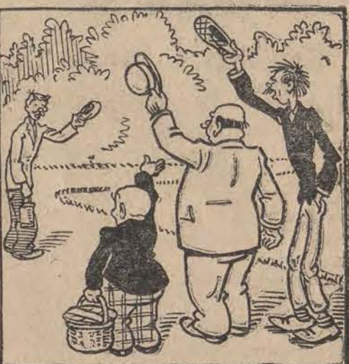
WICEK: — Bardzo miło spędziłem czas w zoologii! Serwus! DOZORCA: — A ja dziękuję za pomoc! Zegnam panów!...