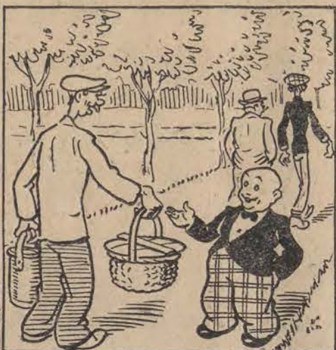
SZABERSKI: — To pana zgnotyli! WICEK: — Małpia złośliwość! DOZORCA: — Teraz idziemy do ptaków. Ponieś pan ten koszyk!