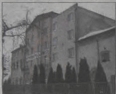
Być może właśnie w budynkach dawnej paszarni przy ul. Klickiego ruszy produkcja karmy dla psów i kotów.