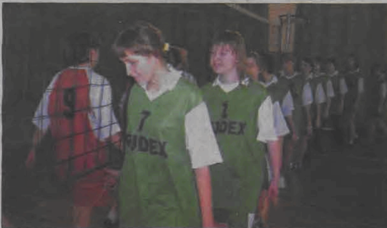
Brązowe medale wywalczyły siatkarki z GP 4 Łowicz (zielone stroje), które w „małym finale” pokonały GP Bielawy.