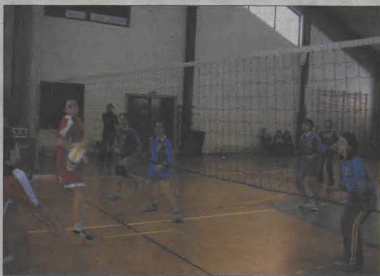
W meczu o pierwsze miejsce Pijarska (niebieskie koszulki) okazała się lepsza od teamu z GP 1 Kompina.