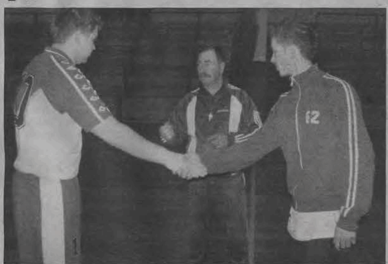
Remis Błękitnych i Zatorza II jeszcze bardziej skomplikował sytuację na szczycie III ligi ŁLPNP.

■ CANARINHOS - BAD BOY'S Łowicz 2:2 (1:1); br.: Krzysztof Wolski (4)