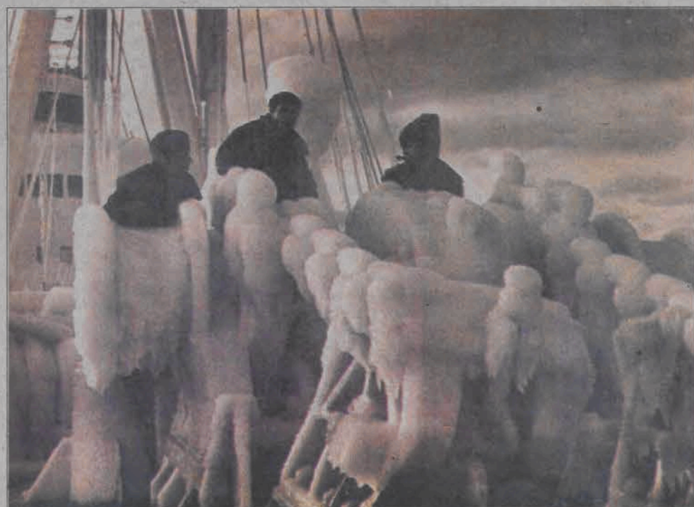
Rok 1963, na Morzu Ochockim podczas zimowego rejsu na Kołymę. Temperatura na zewnątrz kajuty -28 stopni Celsjusza.

ŻYCZLIWI I FACHOWY PERSONEL APTEKI SERDECZNIE ZAPRASZA