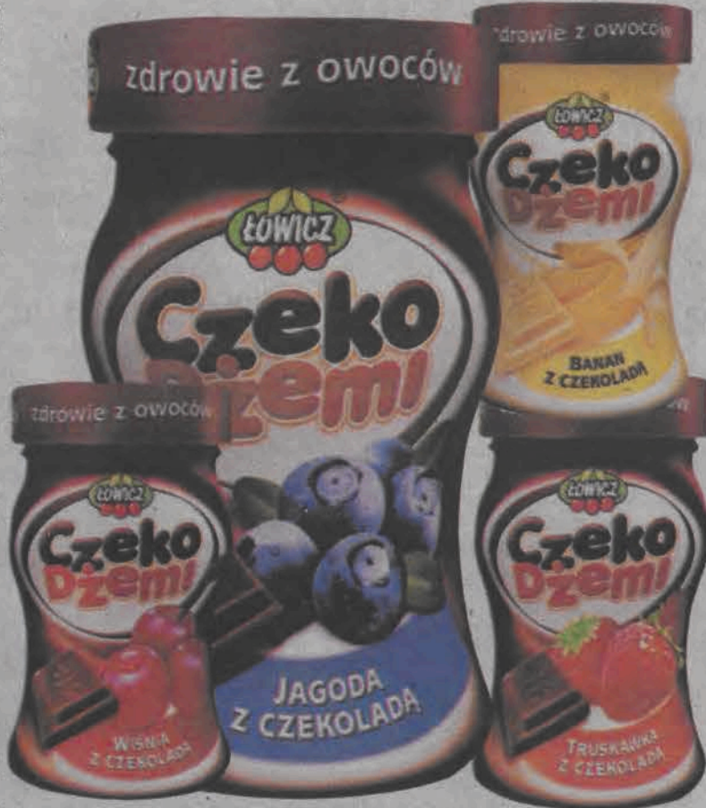
Czeka Dżemi z Łowicza reklamowany jest jako produkt o nowatorskim smaku i w oryginalnym opakowaniu.

Czeka Dżemi jest dostępny w szklanych słoiczkach, w których jest 200 gramów produktu (cena detaliczna około 3,50 zł). Opakowanie zaprojektowano tak, by dzieci z łatwością mogły je same otworzyć. Dłatego są pękate, niewielkich rozmiarów i mają wygodne zważenie, które dopasowane jest do rączek dziecka. (mwk)