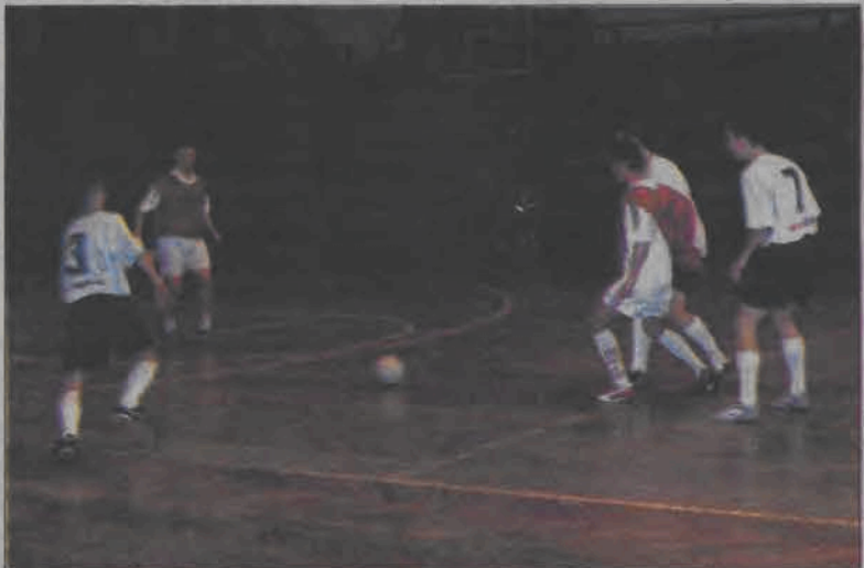
Pędzące Imadla mają jeszcze wciąż nadzieję na „majstra”. Muszą jednak liczyć na co najmniej remis Budowy w meczu z Zatorzem.

Tak jak przewidywaliśmy nawet bez swoich najlepszych graczy Abex bez problemu pokonał kutnian. Ci, niespodziewanie, muszą walczyć o utrzymanie do końca.