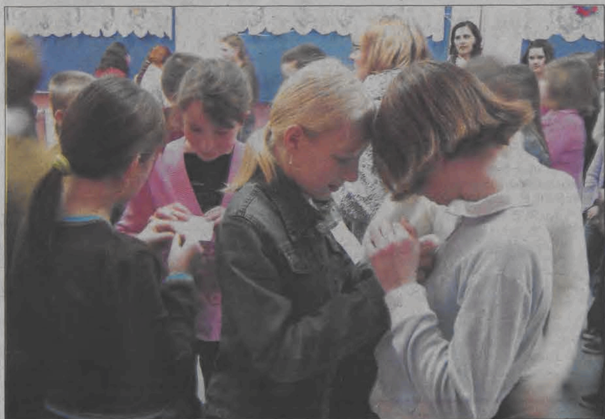
Każdy z uczestników spotkania miał przypiętą karteczkę z imieniem.