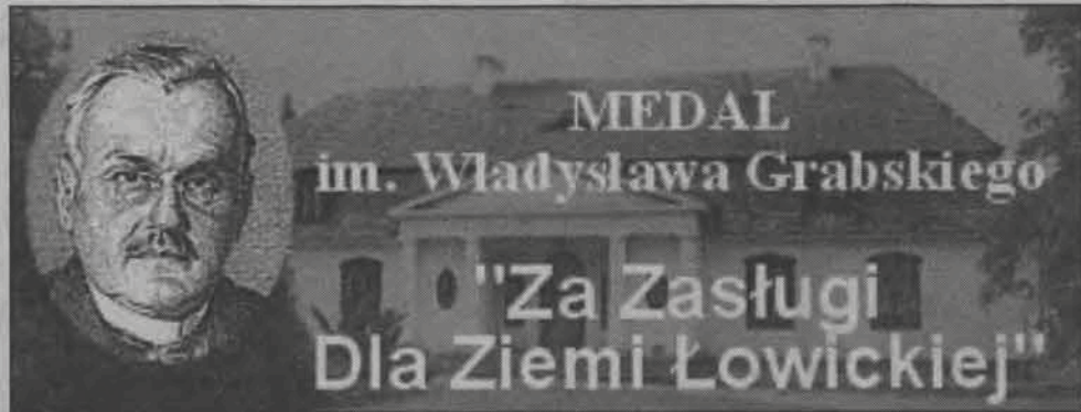
Tak prezentuje się wizerunek W. Grabskiego z medalu jego imienia. W tle dworek w Borowie.

Już po raz drugi przyznane zostaną medale imienia Władysława Grabskiego „Za Zasługi dla Ziemi Łowickiej”. Wnioski z kandydaturami osób i instytucji, które zasługują na takie wyróżnienie, składać można do końca lutego.