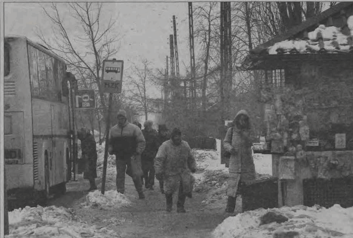
Na wiatę przystanku oraz nowy kiosk trzeba jeszcze poczekać.