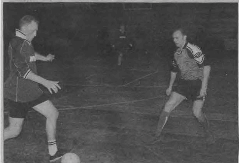
Witonia nadspodziewanie łatwo ograła Barsę Kutno (aż 4:0!).