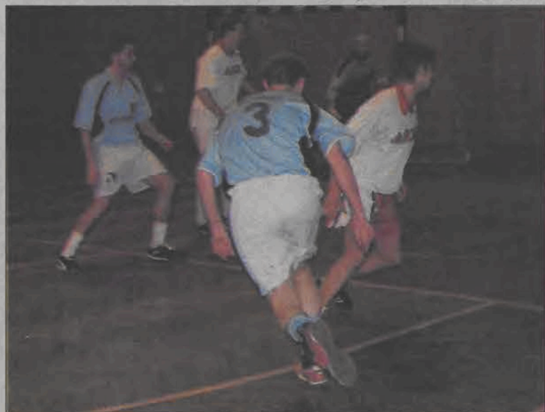
Abex rozgromił Brooklyn aż 8:2 i ekipa z Kutna będzie musiała zapunktować z Oldbojem.