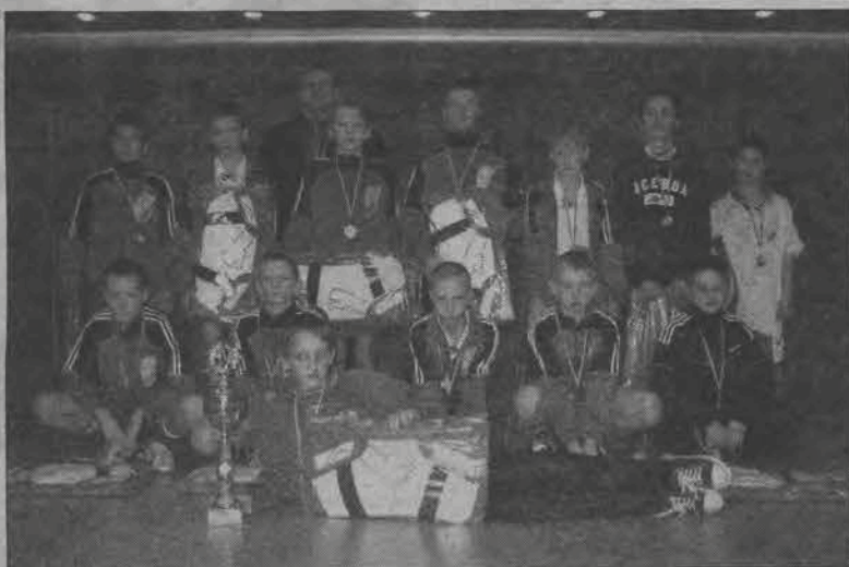
Młodzi piłkarze Pelikana zdecydowanie zwyciężyli w turnieju w Skierniewicach.