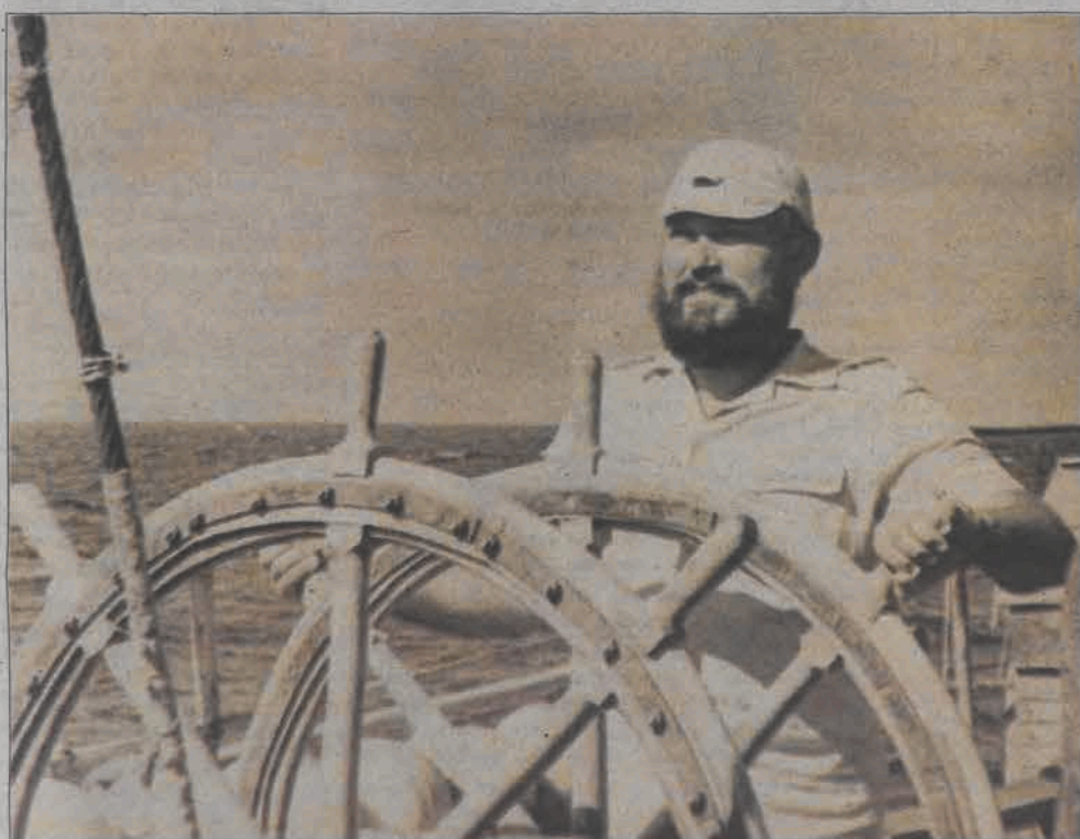
Na końcu świata - za kołem sterowym na Morzu Weddella u wybrzeży Antarktydy w roku 1977.

Jednocześnie studiował zaocznie dziennikarstwo, egzaminy zdając w przedziwny sposób: w różnych sowieckich portach, do których zawiązał. Od blisko trzydziestu lat pisze w gazetach. Przez lata całe nie było to dziennikarstwo, do jakiego się przez kilkanaście lat wolności przyzwyczailiśmy, wolne słowo w ZSRR nie istniało. Ale rzemiosło, umiejętność posłu-