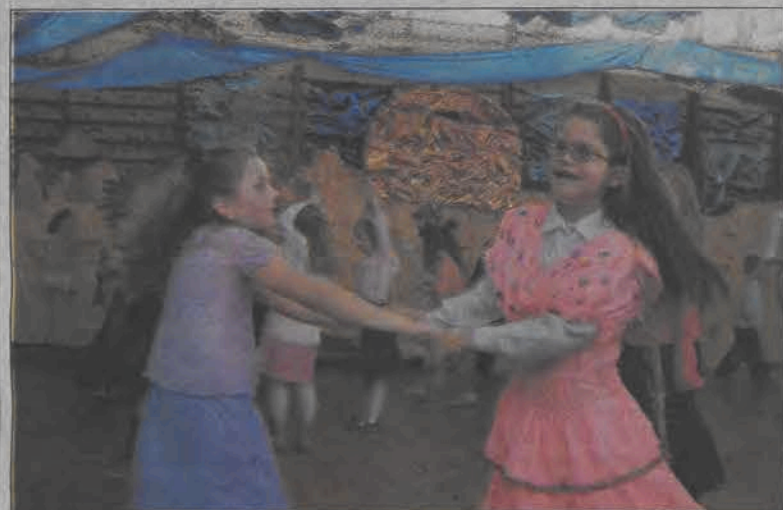
Młodsze dzieci bawiły się w Domaniewicach już od godziny 10.00.