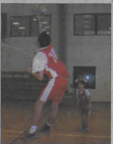
W meczu finałowym ekipa z Bielaw okazała się lepsza od reprezentacji GP 2 Dzierżgówek.