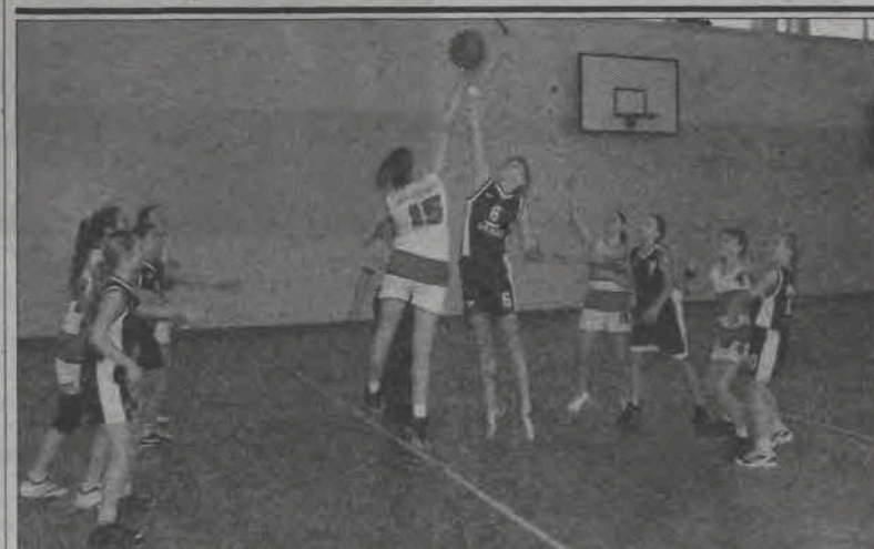
Starsze, wyższe i przede wszystkim silniejsze rywalki nie miały problemów z „rozstrzelaniem” łowiczerek.

W 11. kolejce w weekend 24-25 lutego zagrają: piątek - godz. 17.30: Elta II Łódź - ŁKS II Biała Rawska, sobota - godz. 12.00: PKTS II Pabianice - Legion II Skierniewice, godz. 16.00: Macovia Maków - UKS GOK Zduny i Burza Pawlikowice - ŁKS Kolutzki. Pauza: UKS Dobryszycy.