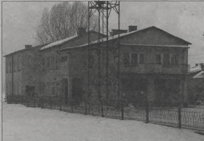
Strażnica w Karsznicach ma obecnie za ciasne garaże, strażacy chcą je rozbudować.

Strażacy planują wystąpić o pieniądze do Komendy Głównej Państwowej Straży Pożarnej, Zarządu Wojewódzkiego OSP, Wojewódzkiego Funduszu Ochrony Środowiska, a także firm ubezpieczeniowych. W tej chwili wiadomo już, że otrzymają