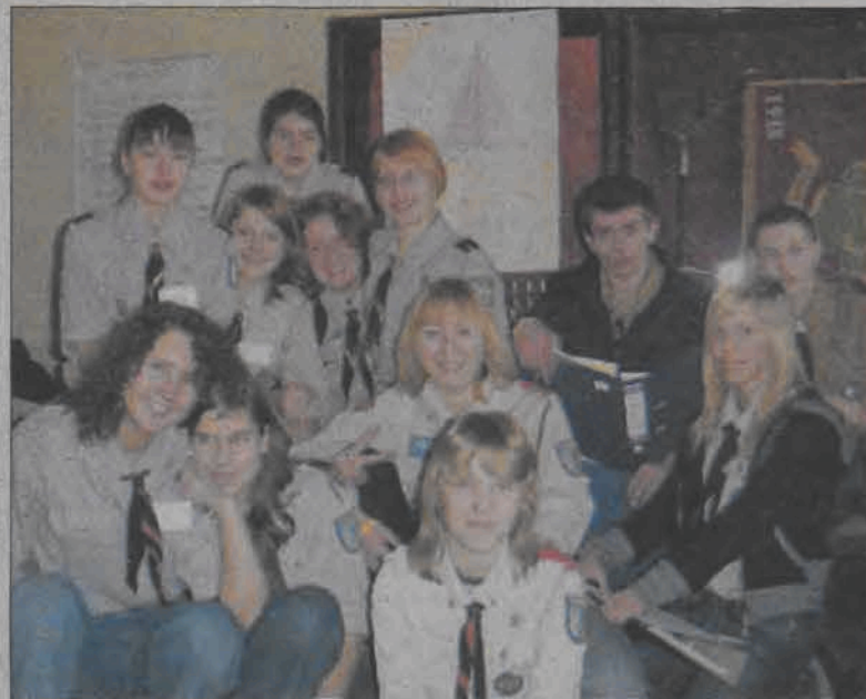
Grupa łowickich harcerzy na szkoleniu drużynowych w hufcu ZHP w Kutnie.

były to 3 - 4 osoby rocznie. Teraz szkolących się jest piętnaście osób. Wcześniej w czasie ferii zimowych podobny kurs ukończyło dwóch innych harcerzy. W sumie w łowickim hufcu przybędzie 17 harcerzy, w wieku od 15 do 17 lat, którzy będą mogli zawiązywać nowe drużyny. Już teraz dobrali się oni w pary, dzieląc między siebie przyszłe obowiązki drużynowego i przybocznego w nowych drużynach. Dwie pary zdecydowane są na zawiązanie gromad zuchowych, pozostałe sześć - drużyn harcerskich. (tb)