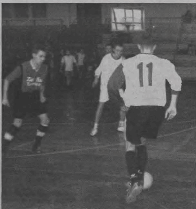
W meczu Zetki i Aveny sytuacji nie brakowało, ale skończyło się remisem 1:1.