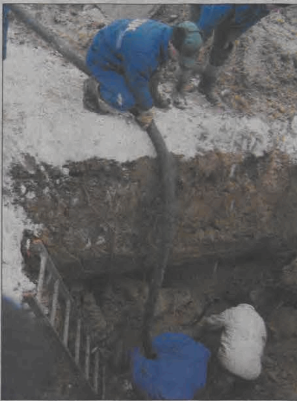
We wtorek ekipa ZUK odkopała miejsce, w którym doszło do awarii. Odpompowywano z niego wodę, aby odciąć pęknięty odcinek i wymienić go na nowy, z PCV.

Wodociąg łączący budynki ma 35 lat, jest w złym stanie technicznym. ZUK nie może w jego