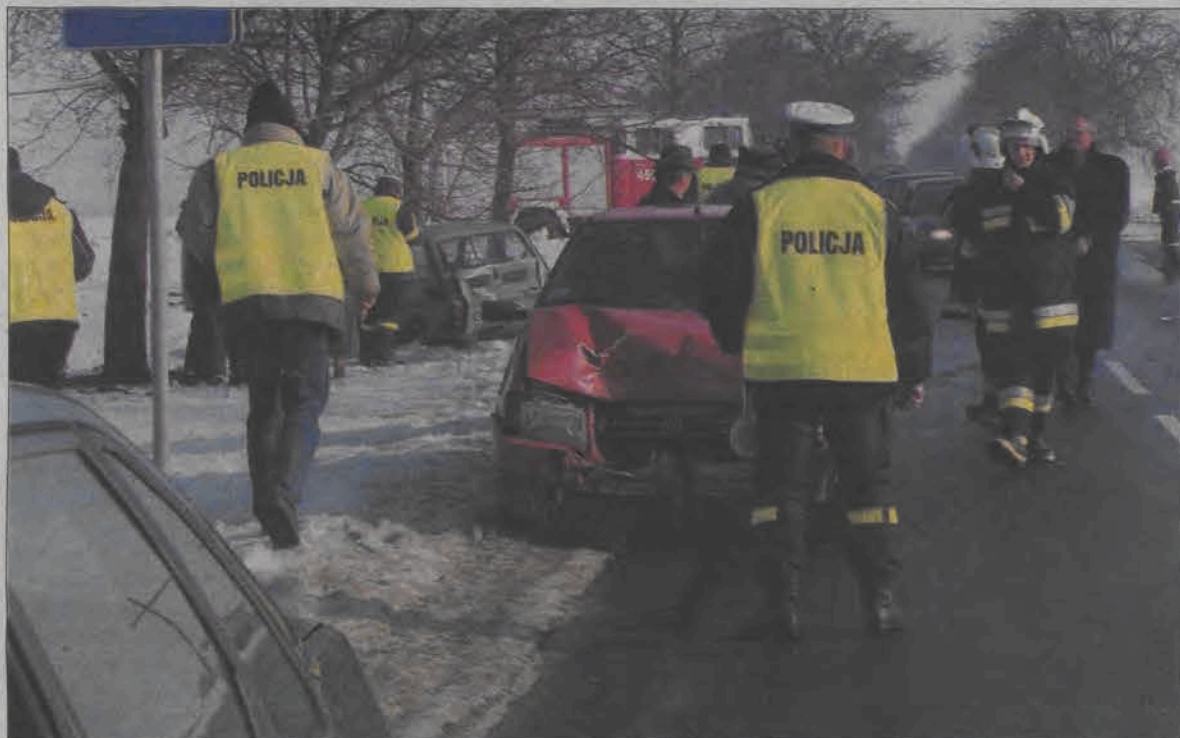
Miejsce wypadku około godziny po tragedii. W głębi widoczny zielony Fiat 126p, którym jechała ofiara wypadku, na skraju drogi Fiat Uno, którym jechał pijany kierowca.