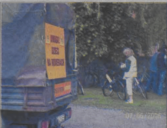
Ten samochód jechał za kolumną rowerzystów.

codziennie dojeżdżał na miejsce, by pomóc. Ktoś dostarczył apteczkę, ktoś inny uzgodnił wiele spraw przez telefon, jeszcze inny przywiózł sprzęt na dyskotekę, a jakiś zagorzał kibic telewizor i antenę, by oglądać mecz Polaków z Ekwadorem. W piątkowy wieczór, gdy miało być ognisko, do Borowa zjechali prawie wszyscy rodzice. Przed wyjazdem dali dzieciom prowiant na wycieczkę i złożyli się na obiady i inne wydatki. Za 60 złotych od osoby zapewniono dzieciom 4 dni wspólnego wypoczynku - a i tak pieniądze zostały na uroczystość zakończenia roku szkolnego.