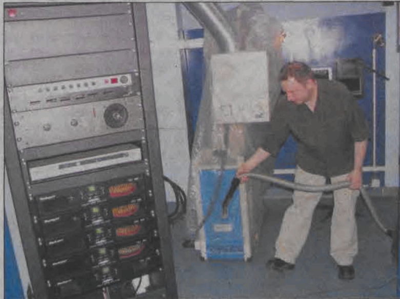
Na czas rozbudowy nagłośnienia projektory zostały przykryte folią. Na pierwszym planie stoi szafa z procesorami sterującymi dźwiękiem dookolnym.

System zapisu i odczytu dźwięku określany mianem Dolby Surround powoduje u widza wrażenie dźwięku przestrzennego. Co to oznacza dla łowickiego kina? Na ścianach kina zainstalowane zostanie 12 dodatkowych głośników, tzw. efektywnych, oprócz tego pozostaną (były do tej pory) trzy głośniki zaekranowe. Ponadto zamontowany zostanie tzw. subwoofer odpowiedzialny za emisję niskich dźwięków. Łódzka firma Kinexpert, która dostarczy sprzęt nagłośnieniowy, zajmie się również rozprowadzeniem okablowania oraz zamontowaniem głośników na ścianach. Wszystko to zostanie po-