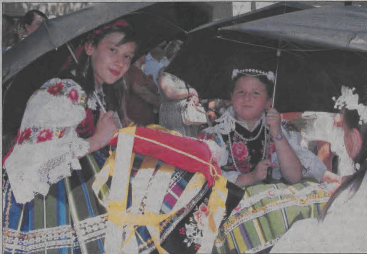
Te dziewczynki chroniły się przed upałem pod parasolami pod koniec uroczystej procesji, która przeszła przez miasto w Boże Ciało 15 czerwca. W tym roku temperatura sięgała aż 35 stopni Celsjusza, upał był trudny do wytrzymania. W czasie kończącej procesję nabożeństwa większość osób chroniło się w cieniu rzucanym przez kamienice stojące na południowej pierzei Starego Rynku, centralny plac świecił pustkami. (tb)

magazynu Składu Budowlanego VOX. Jak pisaliśmy w kwietniu, tej samej wielkości magazyn będzie tam już wkrótce montowany. Inna będzie tylko konstrukcja - nie aluminiowa, jaką miał poprzedni, ale znacznie mocniejsza - spawana stalowa. Montaż takiego magazynu trwać może około miesiąca. Termin oddania nowego magazynu planowano początkowo właśnie na czerwiec tego roku. Na razie nie widać, aby prowadzono prace montażowe. (mwk)