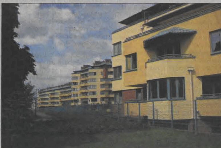
Przedsiębiorczy student, obecny wicemarszałek Sejmu kupił mieszkanie na tym luksusowym osiedlu w Warszawie krótko po studiach.

- Jak tuż po studiach udało się panu zbudować i urządzić spore mieszkanie na warszawskim Ursynowie za gotówkę i bez kredytu? - pytamy. - W czasie, kiedy inni się bawili, ja pracowałem i odkładałem - mówi.