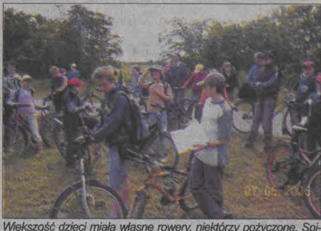
Większość dzieci miała własne rowery, niektórzy pożyczone. Spisywały się dobrze.