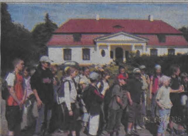
Trzeci dzień: przed dworkiem premiera Grabskiego w Borowie.