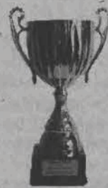
Debiut roku 2005