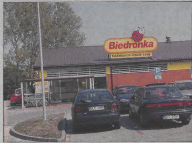
Atutem nowego sklepu jest duży parking i położenie.