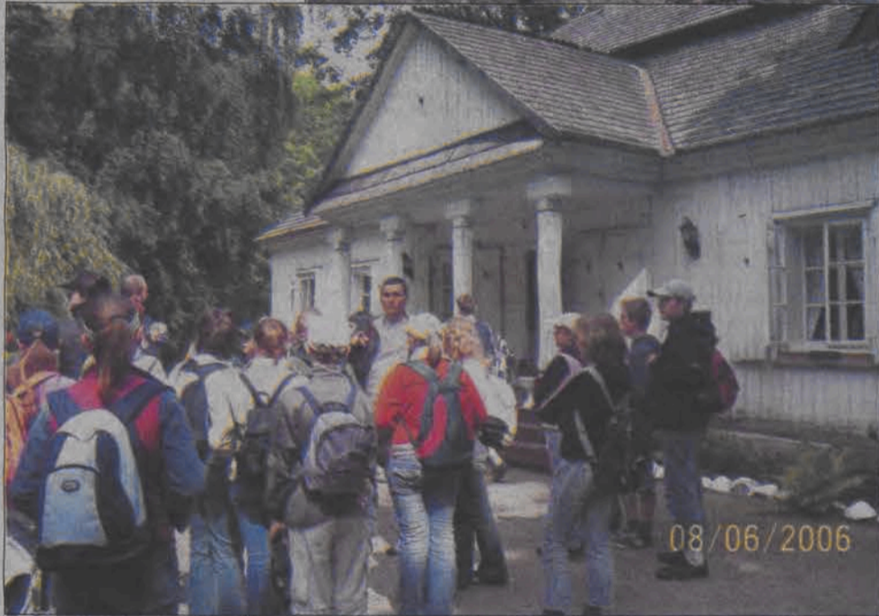
Przed 300-letnim, modrzewiowym dworkiem w Woli Pęcławskiej.