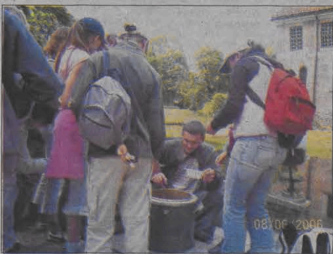
Obiad przed zamkiem w Oporowie.