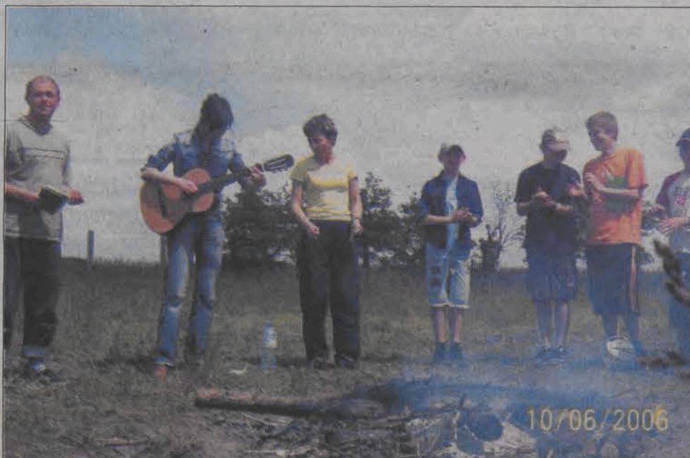
Sobota 10 czerwca, przed wyruszeniem w drogę powrotną. Tego dnia przejechali ponad 50 kilometrów.