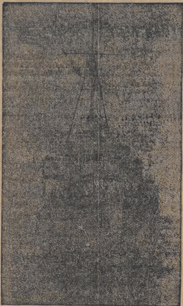
Jak donosiliśmy na międzynarodową defiladę okrętów wojennych, która odbędzie się w ramach uroczystości z okazji koronacji króla Anglii Jerzego VI-go w Spithead, został wyznaczony O.R.P. „Burza” (na zdjęciu).

LONDYN. Z New Delhi donoszą, że w Waziristanie (Indie północno-zachodnie) wojowniczo szepczy pod wodzą fakira Ipi napady na smoteryzowaną kolumnę angielską. Podczas bitwy ze strony angielskiej zginęło 6 oficerów, zaś 5 oficerów i 40 szeregowych odniosło rany.