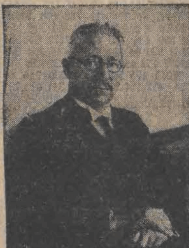
Wczoraj wieczorem na Zamku Królewskim w Warszawie

odbył się uroczysty obchód jubileuszu 30-lecia pracy naukowej prof. Włodzisława Świętosławskiego, ministra W. R. i O. P.