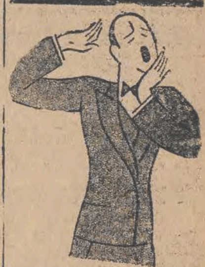
TEN DZENTELMEN JEST ZNUDZONY.

Stawiony przed sądem morderca skazany został na 10 lat więzienia.